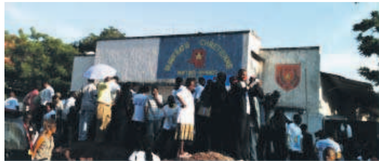
Des militants, devant le siège de la DC, sur Colonel Ebeya, à Gombe.

« Congo Désir » n'est pas, à en croire Freddy Kita, un nouveau parti politique mais plutôt une campagne politique qui vise à promouvoir un mouvement citoyen, populaire, dont l'objectif principal est celui de fédérer toutes les sensibilités politiques pour barrer la route aux promoteurs des valeurs anticonstitutionnelles qui veulent continuer à gouverner