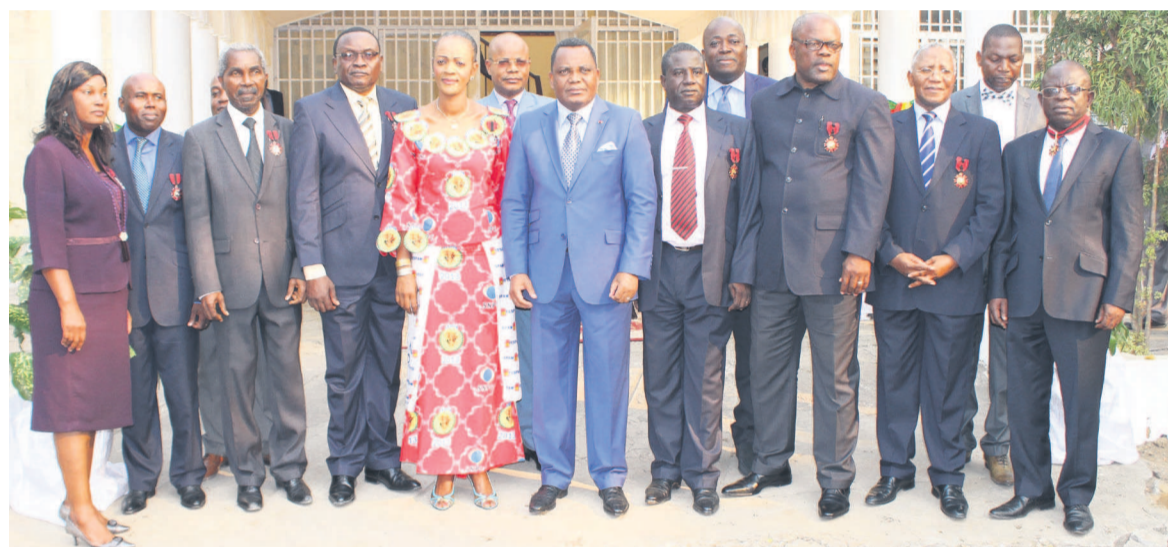
Photo de famille avec les décorés