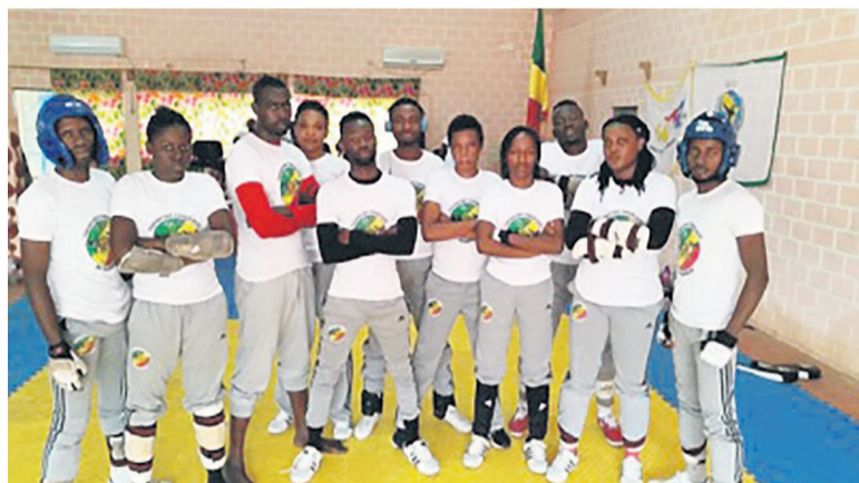
Les Diabes rouges de Taekwondo à Dolisie