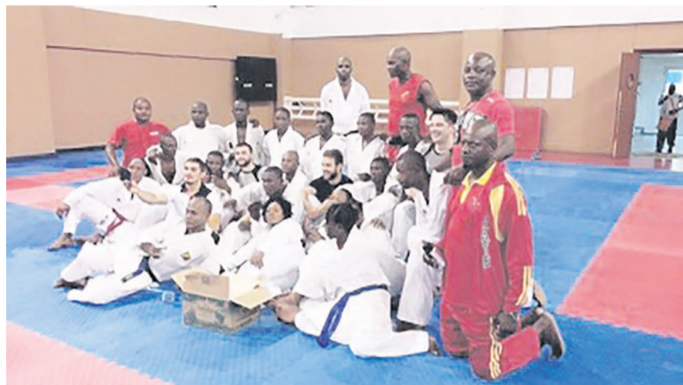
Les karatékas congolais en Turquie

Les athlètes congolais, toutes disciplines confondues, affûtent leurs armes pour ne pas manquer le rendez-vous historique des onzièmes Jeux africains à domicile. Les uns à l'étranger, les autres au pays avec un objectif commun : se faire une place sur les plus hautes marches des podiums. Le point sur la préparation de quelques disciplines.