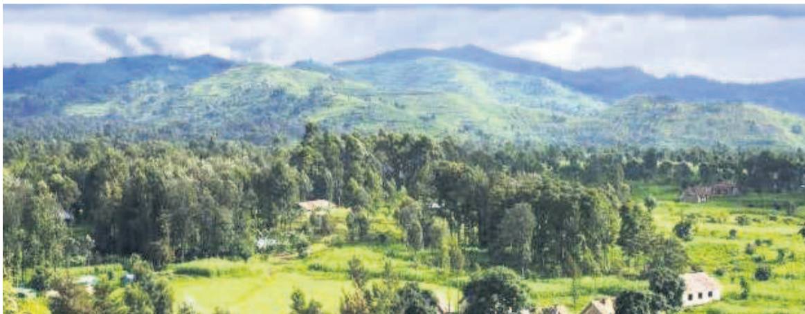
Vue lointaine du parc de Virunga

Grâce à son important potentiel forestier et hydrographique, la RDC sera sans nul doute au centre des sollicitations au cours de cette 21e Conférence des Nations unies sur les changements climatiques. Le gouvernement aurait déjà soumis au secrétariat de la conférence le document contenant sa Contribution prévue déterminée du pays (CPDN) portant sur la période 2021-2030.