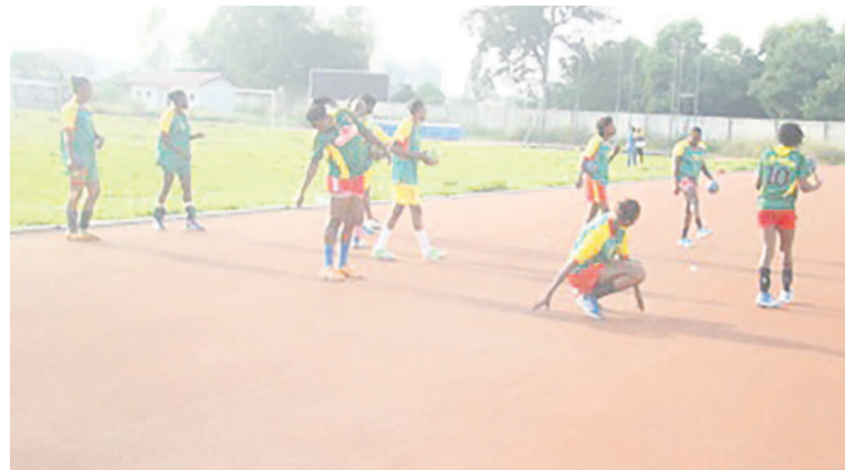
Les Diabes rouges de handball à l'entraînement

Handball : après plus d'une semaine de préparation physique et technique à Oyo, dans le département de la Cuvette, les Diabes rouges de la discipline se sont envolés pour le Cameroun. Ils y livreront des matchs amicaux avec les grands ténors du handball camerounais pour jauger leur niveau. Les dames notamment rencontreront TKC et FAP. Les handballeurs congolais mettront ensuite le cap sur l'Angola avec cinq matchs au programme pour les dames. « Sauf modification, du 25 au 5 septembre, elles en découvrant tour à tour avec Petro, Primeiro