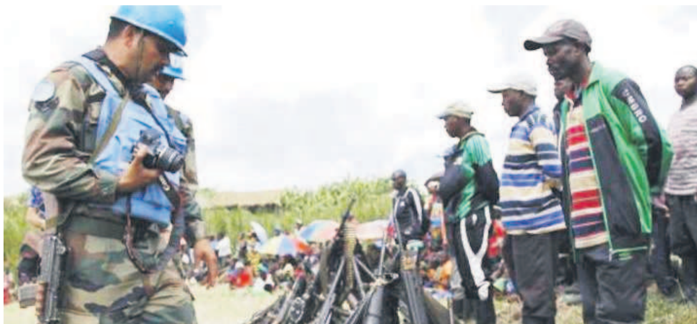
Désarmement des FDLR sous la supervision de la Monusco

Le soutien de l'ONU est requis pour appuyer et soutenir l'administration des camps de transit en RDC et faciliter le rapatriement au Rwanda de ces ex-combattants hutus rwandais à défaut de leur réinstallation dans un pays tiers. Telle est l'une des recommandations du 35e sommet des chefs d'État et de gouvernement de la Communauté de développement de l'Afrique australe (Sadc) qui s'est tenu du 17 au 18 août à Gaborone (Botswana). Cependant au camp de transit de Kisangani, près de huit cents membres parmi ces ex-combattants FDLR ayant choisi de déposer les armes dénoncent les conditions précaires de leur cantonnement.