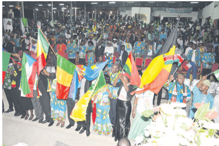
Une vue des participants

la corruption et de tout ce qu'il y a comme antivaleur.