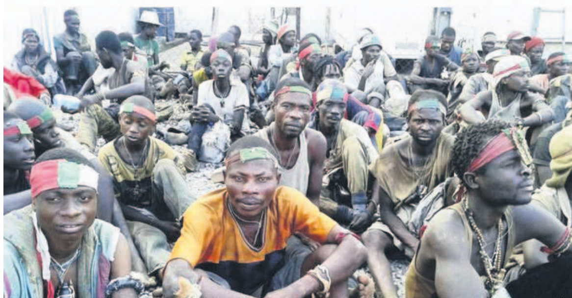
Des miliciens Bakata Katanga

La milice Bakata Katanga appartenant à Kyungu Mutanga, alias Gédéon, s'est transformée depuis quelque temps en un parti politique. La nouvelle a été accueillie avec stupeur par les ONG actives dans la promotion et la protection des droits de l'Homme en RDC. Au-delà de la légalité de ce mouvement,