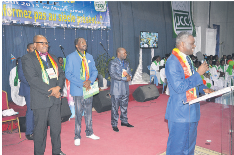
Anatole Collinet Makosso délivrant son message