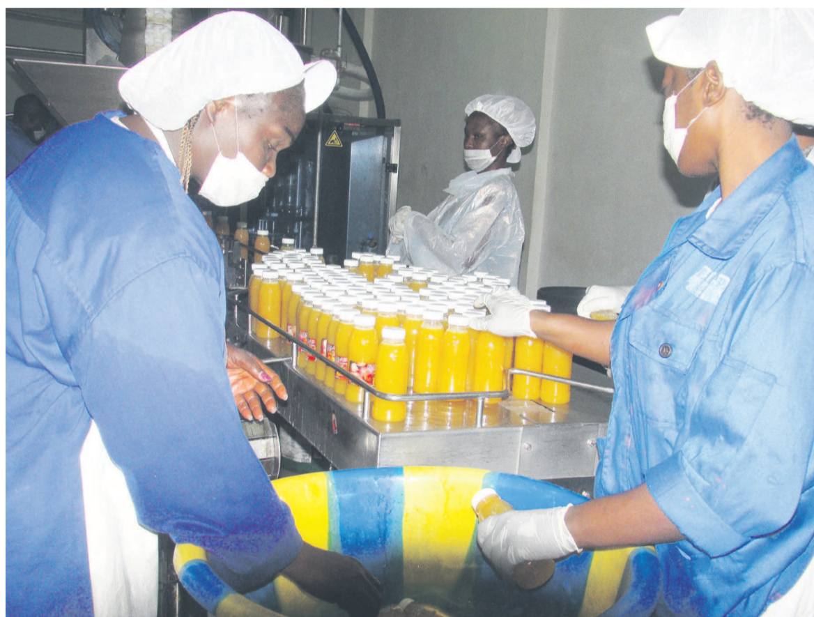
Des ouvrières à l'oeuvre

« Le FACP a apporté une subvention de 53 millions de FCfa à l'entreprise Bayo, pour