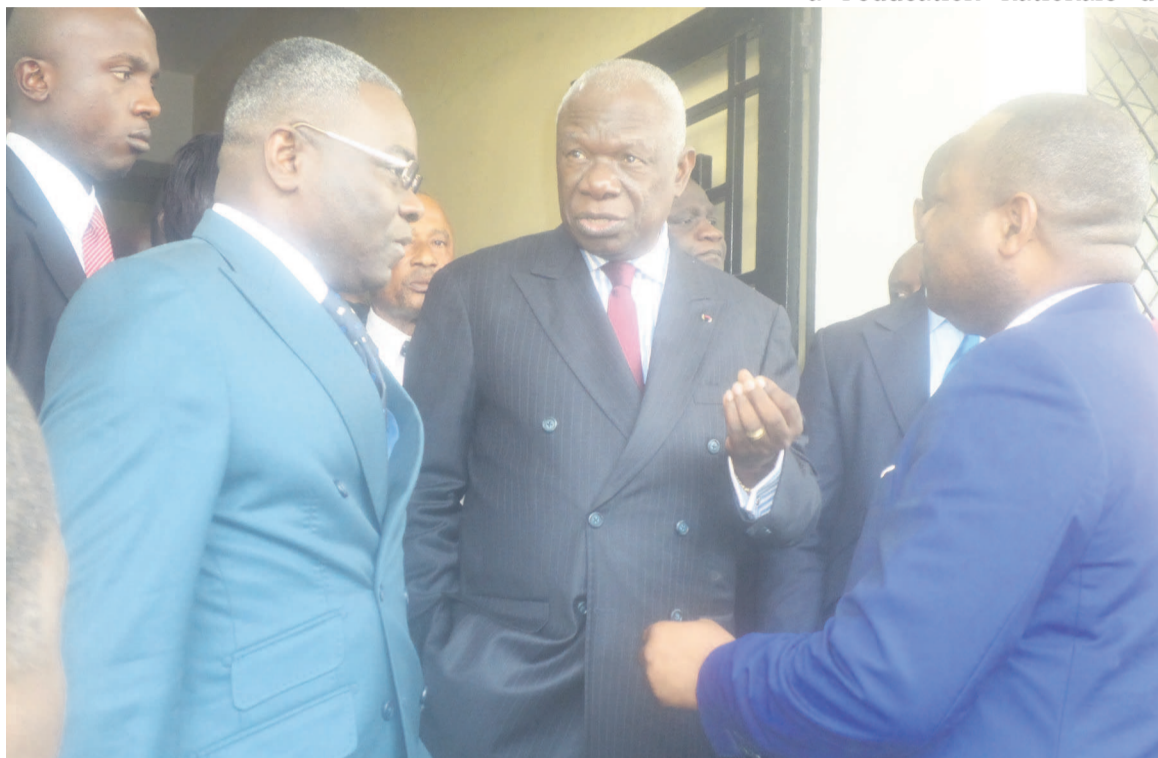
Les ministres entrant et sortant en concertation avec le conseiller à l'éducation du chef de l'Etat

Outre ces deux dossiers, le nouveau ministre de l'Enseignement primaire, secondaire et de l'alphabétisation devrait s'atteler sur la stratégie sectorielle de l'éducation en vue de l'adhésion du Congo au partenariat mondial de l'éducation PME. Il devra aussi porter son attention sur le projet d'appui et d'amélioration du système éducatif congolais en collaboration avec la Banque