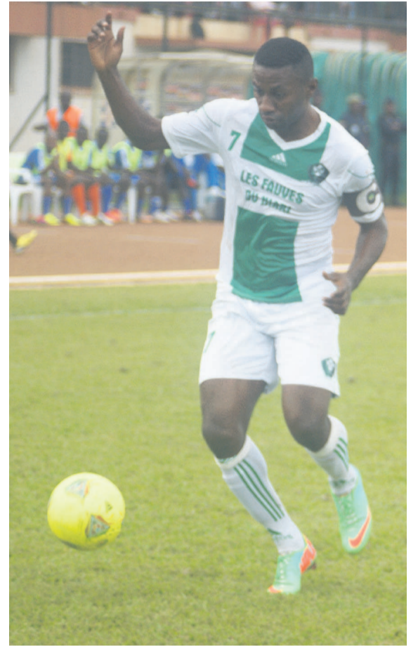
Le capitaine de l'AC Léopards de Dolisie, ici balle aux pieds, a été évacué en France

Le silence des autorités est inquiétant vu que le cas du joueur est encore très grave. Mais au moment où le Congo s'apprête à célébrer le cinquantenaire des Jeux africains, ce