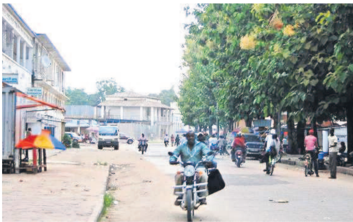
Vue d'un quartier de Kisangani

La mise en œuvre du processus de démembrement des provinces peine à prendre son envol. Les députés provinciaux de nouvelles provinces issues du démembrement jouent leur partition en procédant à la rétention des recettes publiques sous prétexte de protéger les avoirs financiers de nouvelles entités. Un peu partout, l'on as-