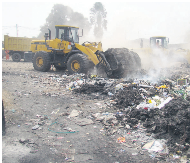
Deux engins en pleine opération