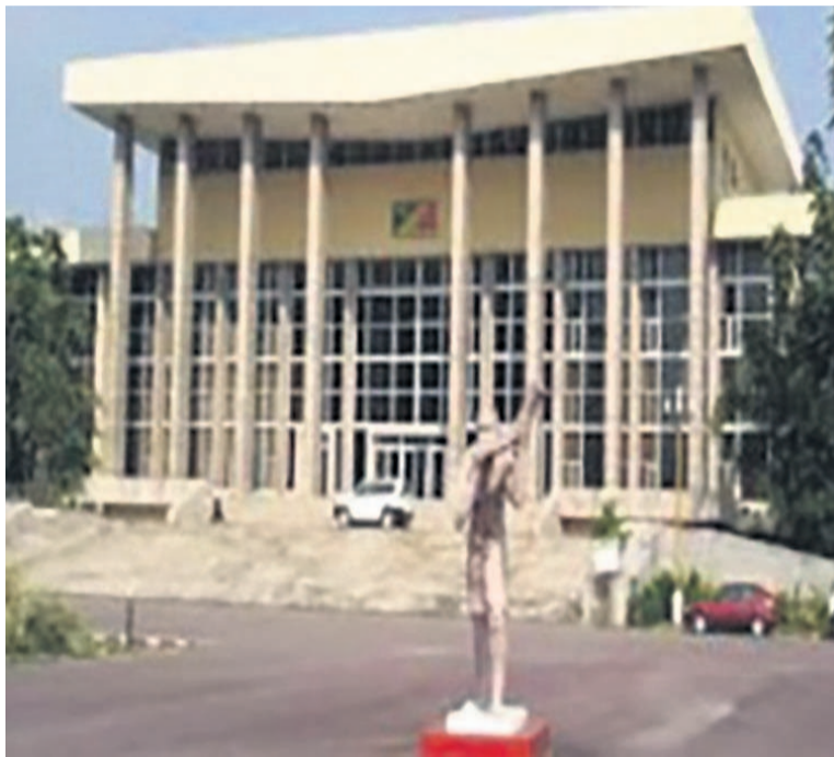
Le palais des congrès de Brazzaville

Adolphe Sicé de Pointe-Noire, de Dolisie, celui d'Owando et Edith Lucie Bongo Ondimba encore en construction à Oyo, qui sont des complexes sanitaires de référence et qui couvrent les départements du Kouilou, du Niari, de la Bouenza, des Plateaux, de la Cuvette et Cuvette-Ouest, la Likoua-