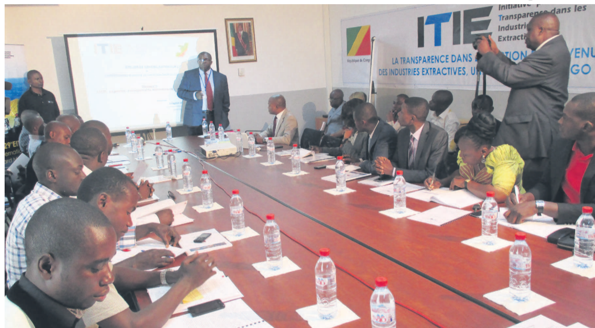
Les dirigeants de la FMC au cours du séminaire