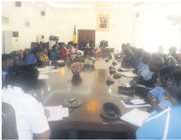
Les participants

L'atelier de formation organisé, du 25 au 27 août à Brazzaville, par le ministère de la Promotion de la femme et de l'intégration de la femme au développement en partenariat avec le Fonds des Nations unies pour la Population (Fnuap), vise la protection et l'amélioration du statut juridique et socioculturel de la femme.