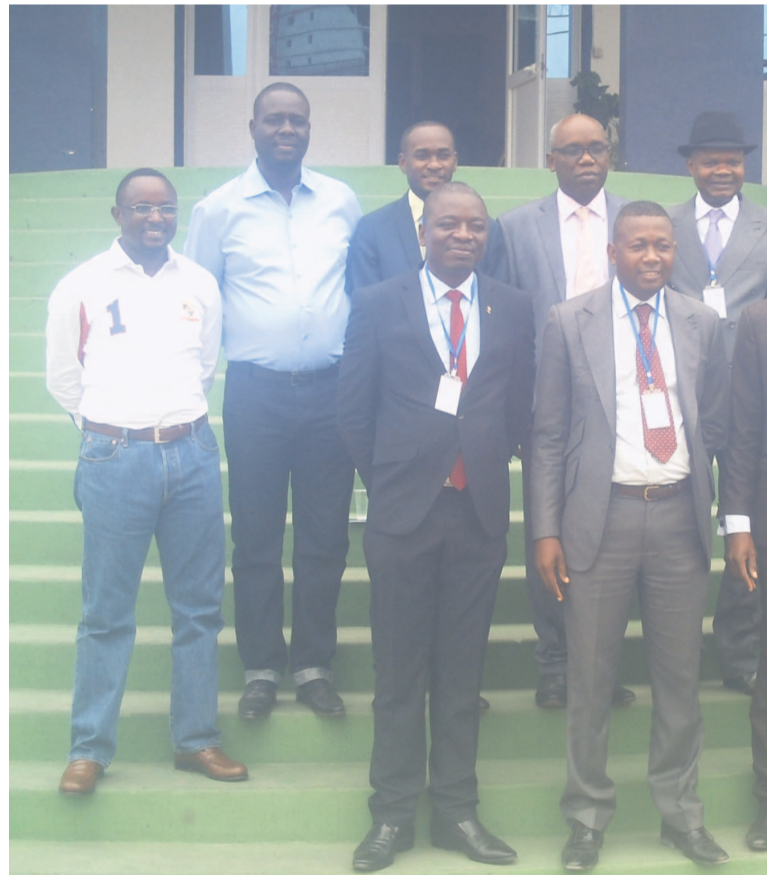
Les membres du Club des entreprises de Pointe-Noire posant avec le président de la chambre consulaire

La mise sur pied du club des entreprises obéit à la volonté de mutualiser les efforts afin d'envisager