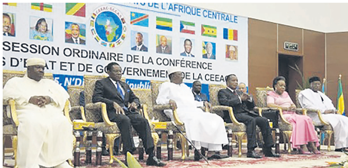
Photo des chefs d'Etat et de gouvernement de la Céeac

En effet, les différents intervenants présents devront d'abord approuver le projet d'Accord universel et juridiquement contraignant qui sera d'ailleurs sur la table de négociations de Paris; ensuite, les contributions de chaque Etat membre et enfin celles de la sous-région qui serviront à financer le transfert de technologie et le renforcement des capacités; sans oublier l'épi-