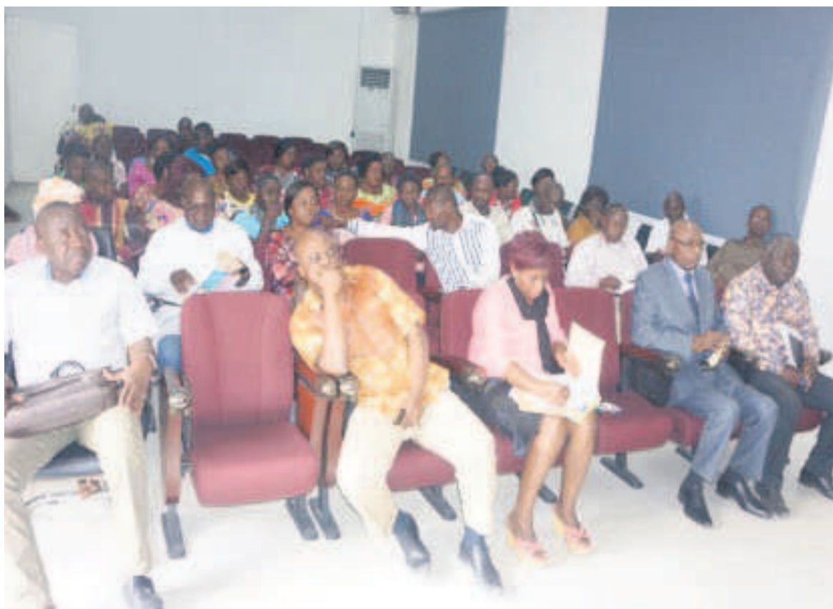
Une vue des caissiers de l'Hôpital général Adolphe Sicé de Pointe-Noire (ADIAAC photo),

terne interviendra dans les prochains jours en vue d'établir la responsabilité individuelle de chacun d'eux. « Les techniques d'investigation d'audit existent pour établir les faits, il n'est pas question de sanctionner de la même manière les caissiers qui ont pris des fortes sommes d'argent et ceux qui n'ont peut être rien pris. Nous ne voulons pas des agissements débordants de la part des agents concernés même si l'on a pu constater une certaine attitude de manque de considération », a-t-il conclu. Signalons que selon les services de l'inspection générale de la santé, les encaissements mensuels de l'hôpital général Adolphe Sicé oscillent entre 60 et 80 millions par mois. Cette séance de travail de l'Inspection générale de la santé