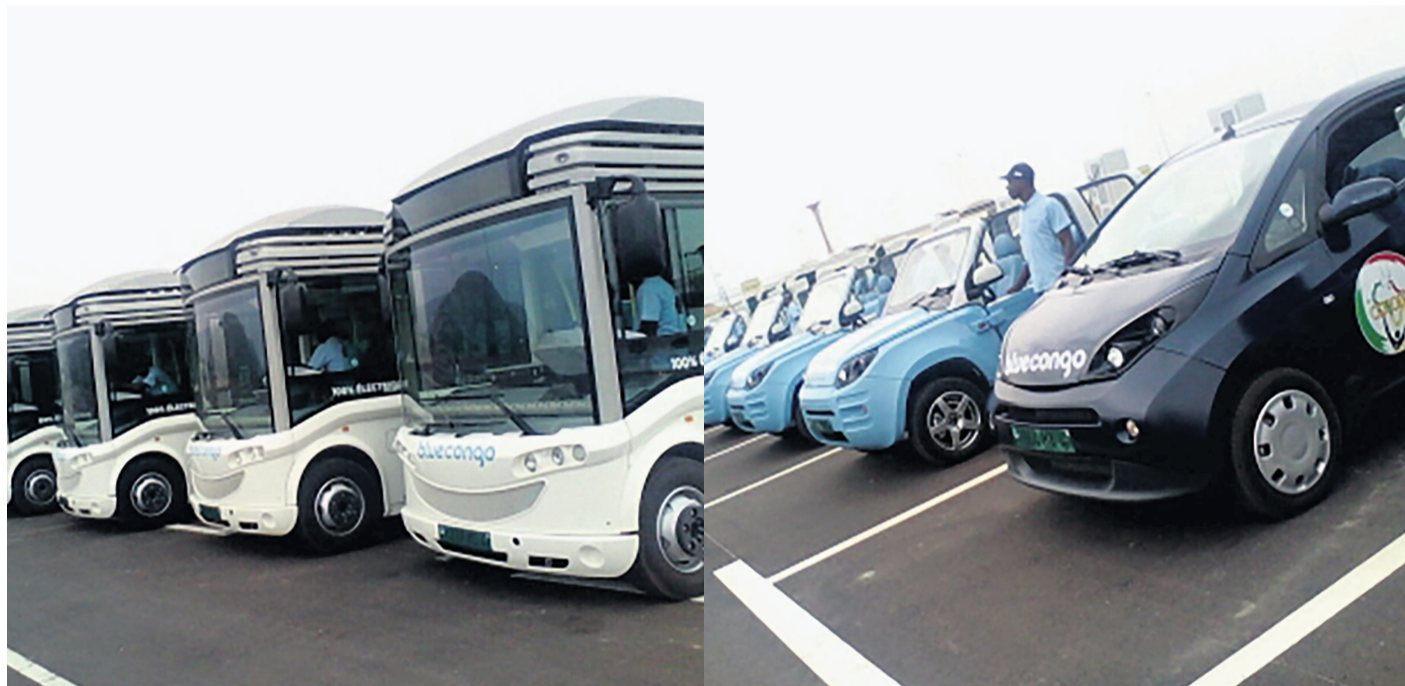
Bus et voitures électriques

le stade et le village olympique, érigé au chantier de l'Université Denis Sassou N'Gouesso.