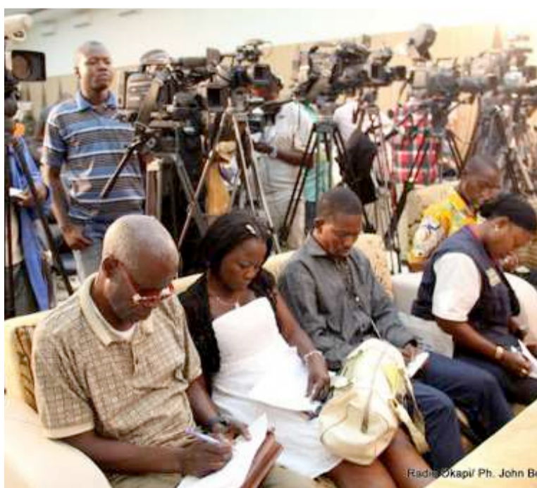
Des professionnels des médias lors d'une activité de la Cénipho

Dans sa requête du 31 août, l'association de défense et de promotion de la liberté de la presse, Freedom for journalist-Afrique (FFJ), a sollicité du président de la RDC, Joseph Kabila Kabange, de s'impliquer à la réouverture des télévisions fermées à Kinshasa. FFJ a dit espérer que la réouverture de ces médias serait un signal fort destiné aussi bien à l'opinion publique interne qu'à la communauté internationale sur l'engagement du président Kabila à promouvoir la liberté de la presse dans le pays. « Le dialogue politique auquel nous souscrivons est un impératif aujourd'hui. Mais aller au dialogue avec un apaisement au sein de la corporation des journalistes rassurait davantage les médias et les jour-