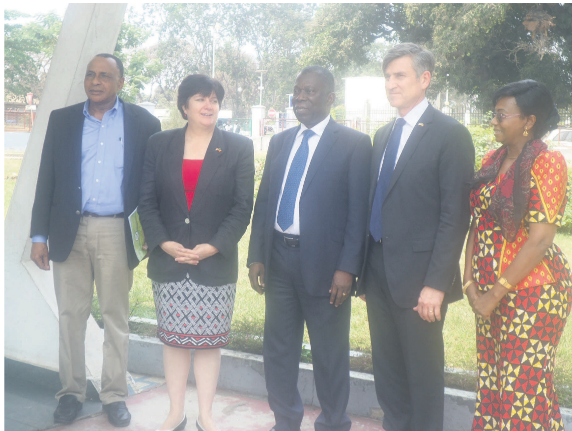
Le ministre François Ibovi posant avec la délégation américaine et la représentante de l'OMS-Congo

En effet, l'entretien entre les deux personnalités a porté essentiellement sur les conditionnalités de mise en œuvre des projets financés par le Fonds mondial de lutte contre le Sida, la tuberculose et le paludisme pour lesquels les États-Unis d'Amérique sont les premiers contributeurs. Les deux parties ont aussi évoqué la question de