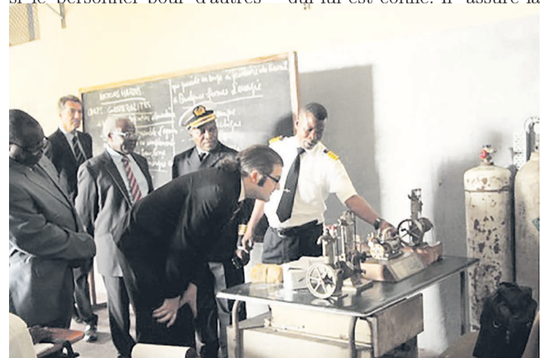
Une visite des salles de classe du CRFNI

Expliquant les deux filières, il a été noté que le capitaine est le premier responsable du bateau et de son convoi. Sa mission rappelle-t-on, est de conduire à bon port le bateau qui lui est confié. Il assure la