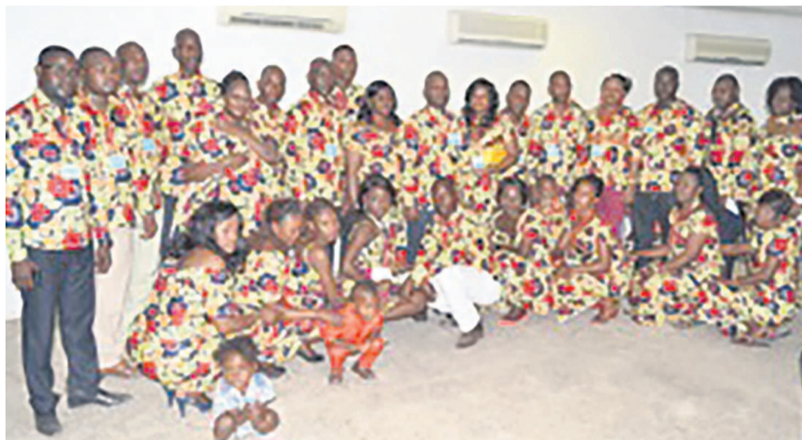
photo de famille à l'issue de la cérémonie

Trois prix ont été remis au cours de cette cérémonie à 21 membres du CGA. Il s'est agi du prix de la Participation financière donné à huit personnes ; du prix Amour et assiduité donné à sept personnes ; et le prix Riches interventions et opinions au cours des réunions, remis à six personnes. La soirée a été agrémentée par