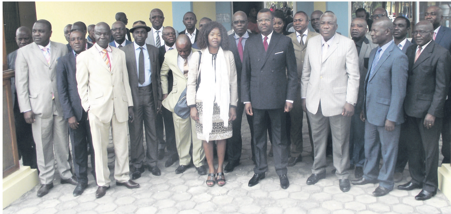
Photo de famille à l'issue de la cérémonie d'ouverture

« La tenue de la présente réunion du comité de pilotage mettra fin à la première phase