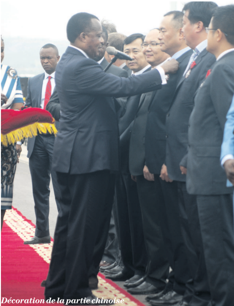
Décoration de la partie chinoise