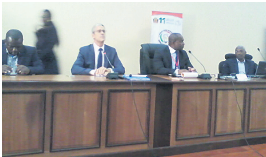
Photo des responsables lors de la conférence de presse Général du groupe français, Vincent Bolloré, dans une allocution télévisée, Bluecongo envisage très prochainement de développer un projet de grande envergure qui concerne de l'électrification

Les bus quant à eux, peuvent rouler jusqu'à 120 km, sans se décharger à une vitesse maximale de 70 Km/h. Ces batteries ont une durée de vie allant de 10