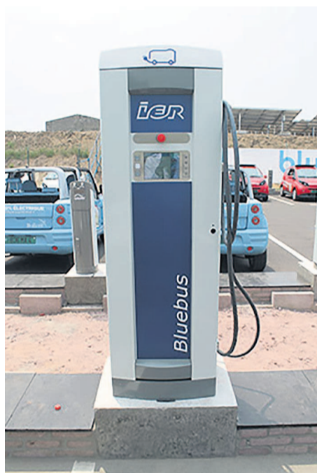
Une borne de recharge

Qatar ont lancé Bluecongo, une joint-venture (association de type économique dans laquelle les partenaires partagent les risques et les frais) ayant pour vocation de développer des infrastructures de