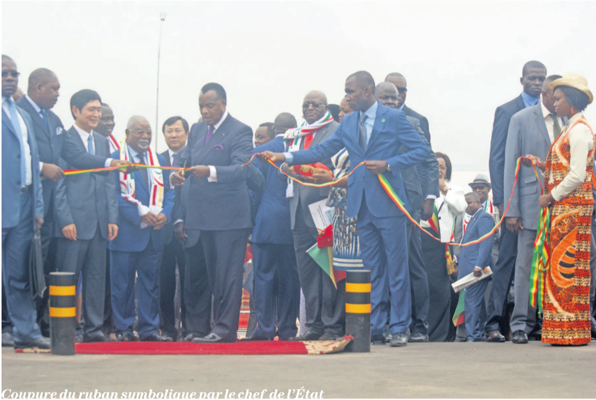
Couure du ruban symbolique par le chef de l'État