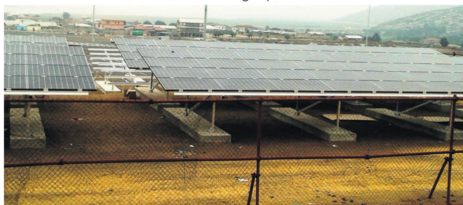
Panneaux solaires voltaïques

En outre, des salles de cinéma seront construites à Brazzaville, dans lesquelles seront projetés les grands films. L'objectif étant d'identifier les talents à travers tout le Congo, et les mettre en avant dans d'autres pays du monde, comme en France, aux États Unis ou au Canada. Créé en 1822, le groupe Bolloré est classé parmi les 500 plus grandes compagnies au monde. Il œuvre depuis plus de vingt-cinq ans de se diversifier, question d'assurer une meilleure répartition des risques. Grâce à sa stratégie de diversification basée sur l'innovation et sur le développement à l'international, il occupe aujourd'hui des positions fortes dans chacune de ses activités rassemblées autour de trois pôles, le Transport et la Logistique, la Communication et médias ainsi que le Stockage d'électricité. L'international groupe Bolloré emploie à ce jour plus 2000 personnes.