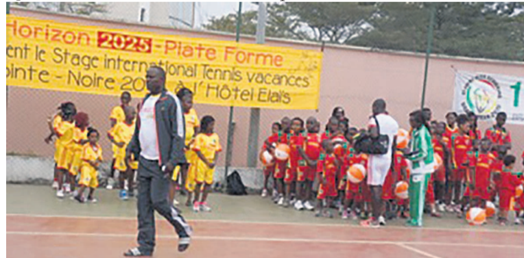
Des enfants à la clôture du stage

plateforme Horizon 2025 en vue de l'encadrement des jeunes joueurs à travers tous les départements. « Ce stage constitue un espace privilégié de détection de futurs talents de tennis et de basket. Au Congo, il n'existe pas encore une école destinée