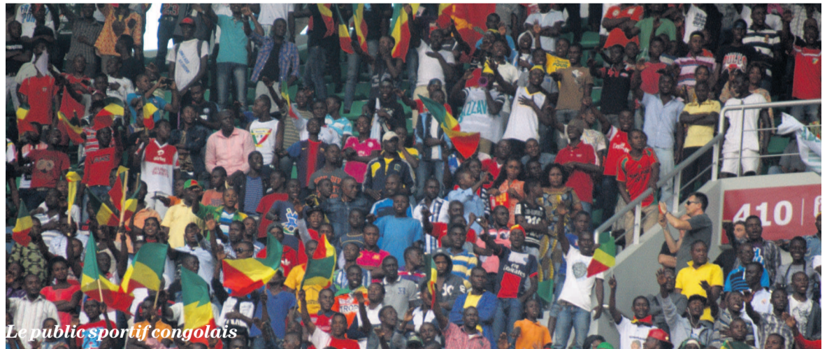
Le public sportif congolais