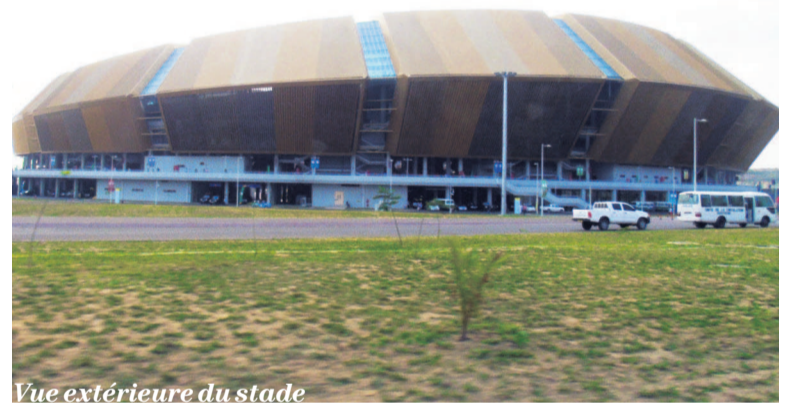
Vue extérieure du stade