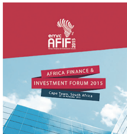
L'affiche du forum

En marge du forum sera organisé un concours en faveur des PME africaines. Le lauréat du concours, renseigne-t-on, qui sera une petite et moyenne entreprise africaine,