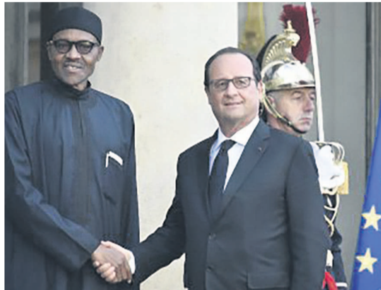
« le peuple burkinabé doit défendre sa liberté ».

Nous avons des besoins logistiques et de formation pour nos militaires [...] il y a la question de la recherche de financement pour nous procurer