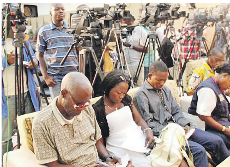
Des journalistes en pleine activité

Dans une communication faite le 15 septembre, à l'occasion de la célébration, de la Journée internationale pour la démocratie, l'association de défense et de promotion de la liberté de la presse, Freedom for journalist-Afrique (FFJ), a noté une dangereuse autocensure que les journalistes s'imposent, depuis la fermeture des médias proches de l'opposition à Kinshasa. L'ONG constate que les activités politiques couvertes par les journalistes ne sont pas rendues correctement, les parties importantes de reportage étant censurées par les reporters eux-mêmes par peur. La fermeture à la pelle des médias dont la ligne éditoriale ne rencontre pas celle du régime est un recul pour la démocratie, soutient le chargé d'assistance judiciaire de FFJ, Me Nkashama.