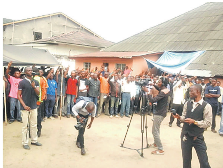
Les journalistes lors d'une manifestation de l'UDPS

L'ONG évoque, par exemple, l'autocensure que des médias présents s'étaient imposés dans leurs reportages lors d'une conférence de presse de Human Rights watch (HRW), une organisation de droit américain qui