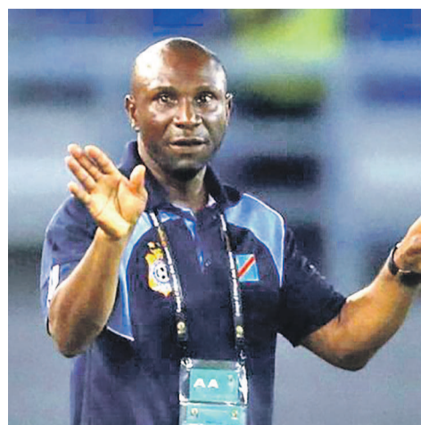
Le coach Florent Ibenge

Après la désillusion de Bangui face aux Fauves du Bas-Oubangi, les Léopards football de la RDC vont se mobiliser pour d'autres importantes échéances. Le sélectionneur Florent Ibenge en a fait part lors d'une récente intervention télévisée à Kinshasa. Ses poulains seront actifs au mois d'octobre avec deux rencontres pour la journée Fifa. La sélection nationale, a-t-il déclaré, compte disputer un premier match amical le 8 octobre contre soit le Sénégal soit le Nigeria à Mons en Belgique.