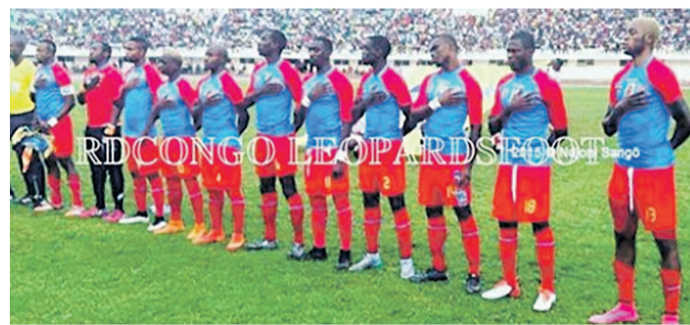
Les Léopards de la RDC

Après la désillusion de Bangui face aux Fauves du Bas-Oubangi, les Léopards football de la RDC vont se mobiliser pour d'autres importantes échéances. Le sélectionneur Florent Ibenge en a fait part lors d'une récente intervention télévisée à Kinshasa.