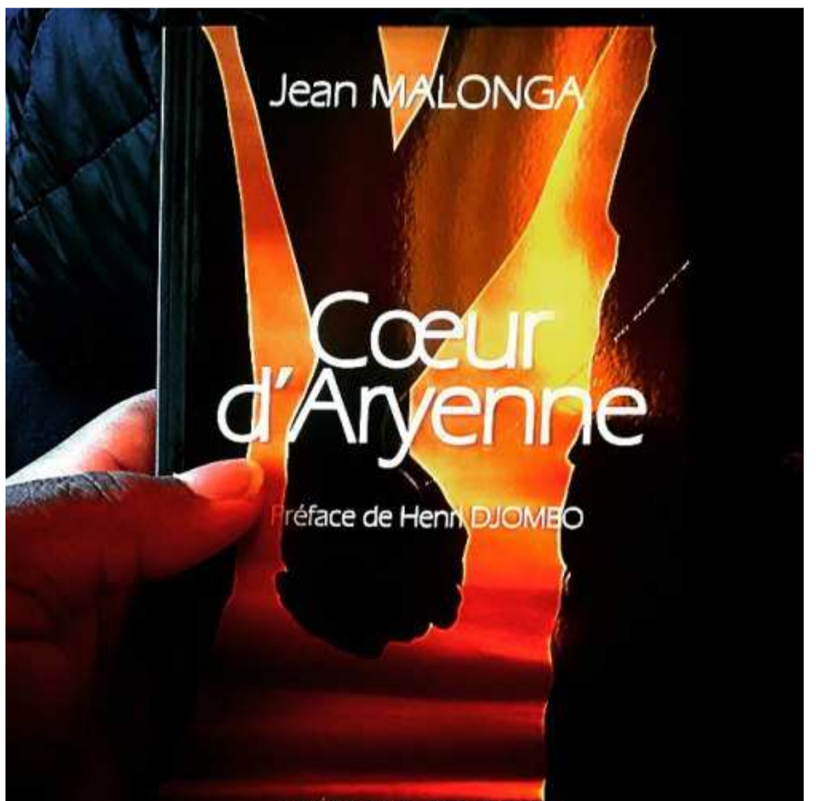
Cœur d'Aryenne est le premier ouvrage congolais

L'intrusion de l'auteur dans la narration révèle l'intérêt socio-historique et utilitaire de Cœur d'Aryenne comme un cri de révolte contre le mal colonial,