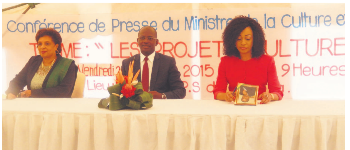
Le ministre de la Culture et des arts, entouré de la représentante de l'Unesco au Congo à sa droite et de la directrice générale du Mémorial Savorgnan de Brazza à sa gauche

Une action importante concernera la Céramique congolaise avec la mise à jour d'un catalogue en