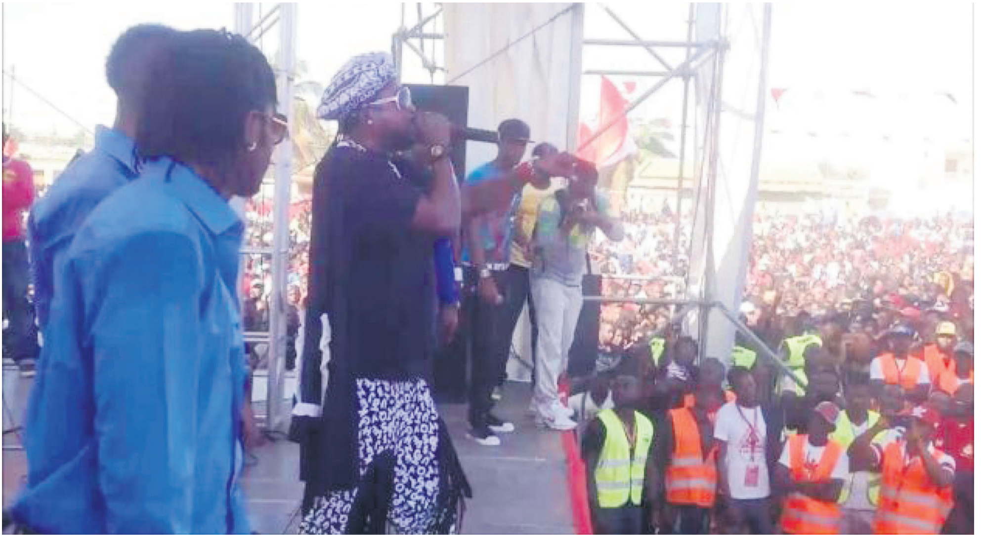
Werrason lors d'une production à Luanda