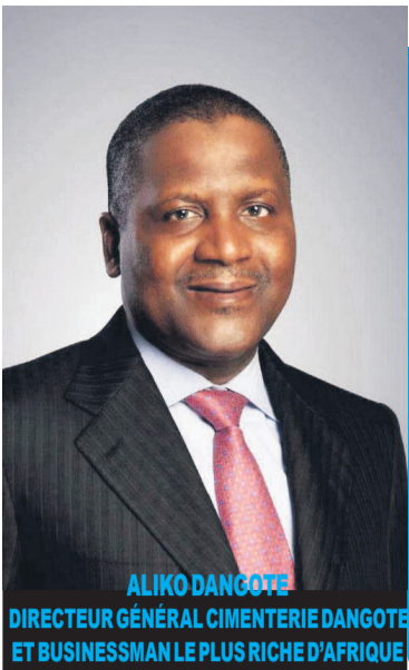
ALIKO DANGOTE DIRECTEUR GÉNÉRAL CIMENTERIE DANGOTE ET BUSINESSMAN LE PLUS RICHE D'AFRIQUE