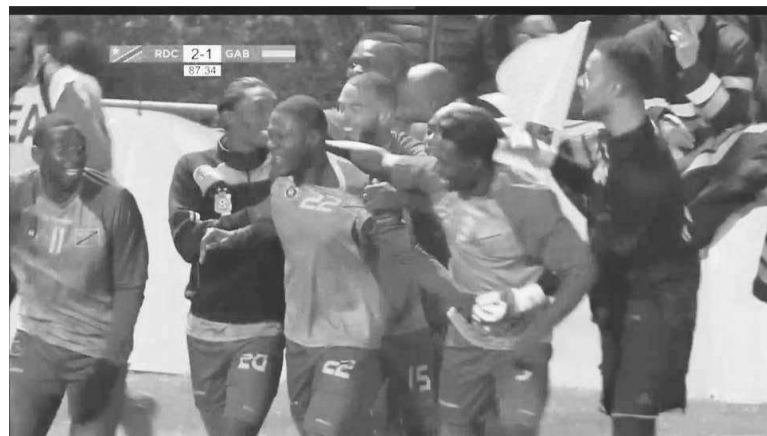
Chancel Mbemba congratué par ses coéquipiers après le deuxième but contre le Gabon