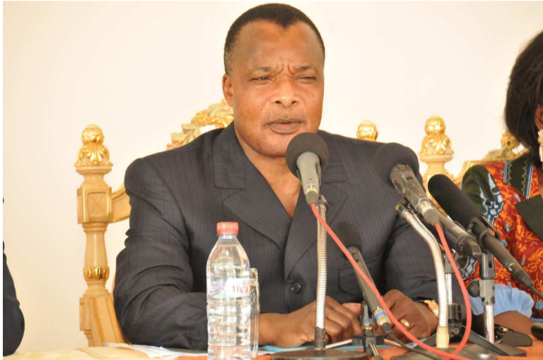
Le chef de l'État lors de la rencontre citoyenne

En séjour de travail dans la capitale économique, le chef de l'État a évoqué, lundi, avec les populations de Pointe-Noire et du Kouilou les questions portant sur le devenir du pays à l'heure où le débat sur le changement ou non de la Constitution du 20 janvier 2002 divise la classe politique.