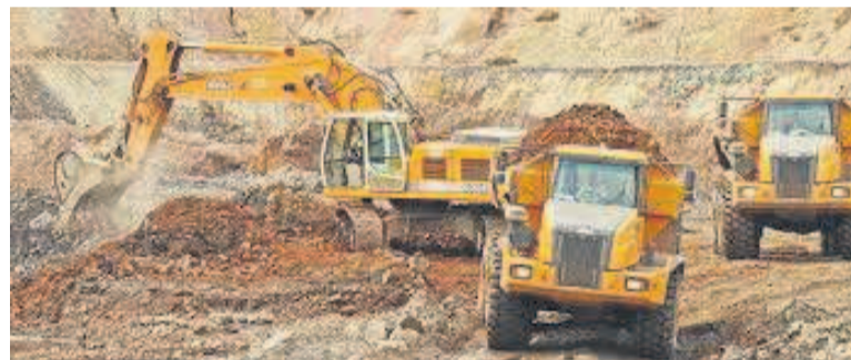
Une carrière de minerais

Au Parlement, ces organisations ont demandé d'intégrer dans le projet de loi portant révision du Code minier les dispositions rendant obligatoire la publication des contrats du secteur minier, leurs annexes et tous les autres documents complémentaires, conformément aux dispositions de la loi n° 11/009 de juillet 2011 portant principes fondamentaux relatifs à la protection de l'environnement et d'adopter la propo-