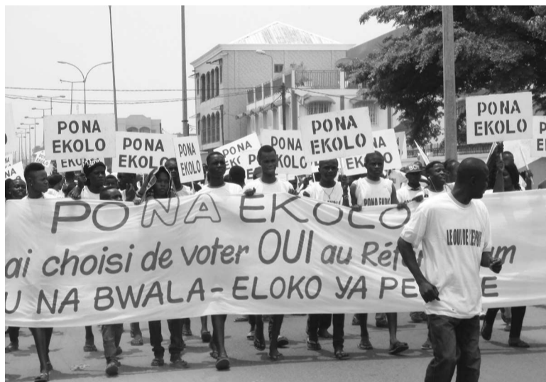
Une vue des jeunes au cours de la marche

Intitulée « le Oui de l'espoir », la campagne itinérante de « Pona ekolo ; Samu na bwala » s'est ouverte le 13 octobre à Brazzaville. Elle se poursuivra dans les départements des Plateaux et de la Cuvette, a fait savoir le coordonnateur national, Elvis Digne Okombi Tsalissan.