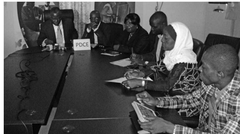
Une vue d'assistance à la conférence de presse

Le projet se déploie dans les villes de Brazzaville et Pointe-Noire. « Celui-ci envisage de former 15.000 jeunes mais au cas où l'on constate que le nombre de candidats est élevé, ce surplus constituera une base de données parce que le projet a une durée de cinq ans. C'est pour cela, le projet encourage la candidature des filles à cette formation »,