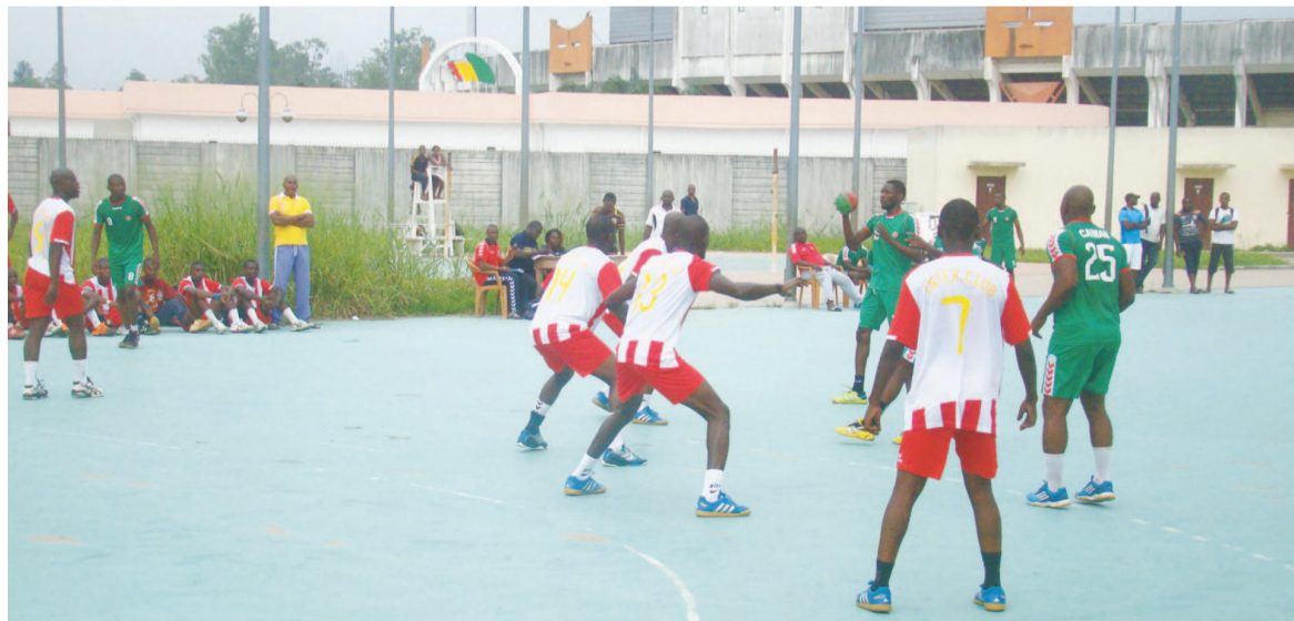
Une des rencontres de l'Inter club

De l'autre côté, version féminine, Abo-Sport affûte également ses armes pour la même compétition. Une série des