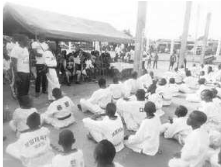
Les participants

Une centaine d'élèves de l'Institut de Taekwondo « Go-Ku-Ded » situé dans le 4 e arrondissement de Brazzaville, a bénéficié d'une formation et reçu des kits scolaires offerts, le dimanche 11 octobre, par le bataillon sportif Congo-Venezuela.