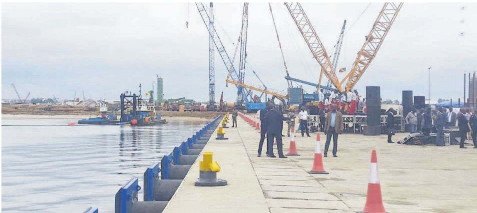
Les nouvelles installations de la société IlogS au port de Pointe-Noire