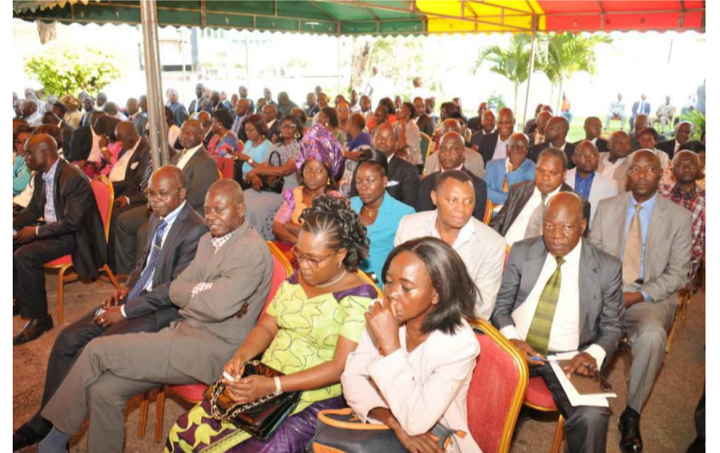
Une vue des participants à la rencontre

lancée lors de son message à la Nation, le 31 décembre 2014. Pour lui, le pays devrait poursuivre son processus de développement. Pour ce faire, il a évoqué la possibilité d'accorder deux municipalisations accélérées à la ville de Pointe-Noire, comme ce fut le cas pour Brazzaville, puis une