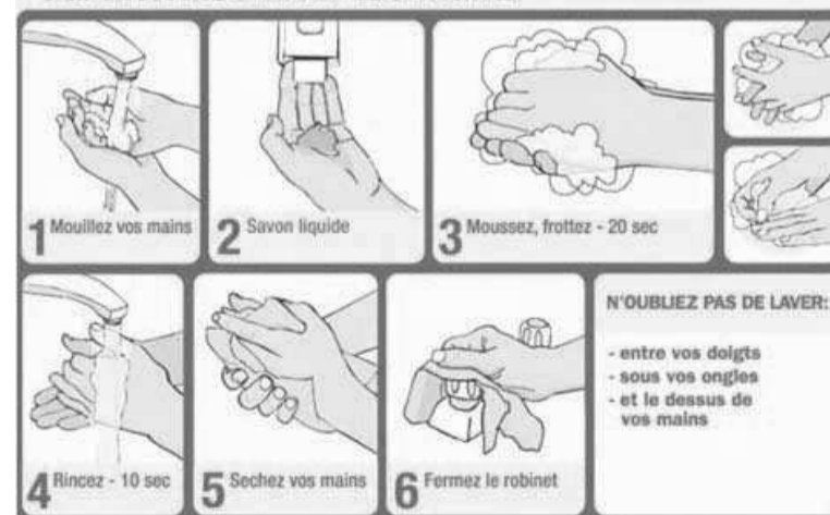
Le lavage des mains prévient beaucoup de maladies

monde. Geste apparemment banal, le lavage de mains présente bien d'avantages pour la santé. Se laver constamment les mains avec le savon ou de la cendre permet d'éviter beaucoup de maladies notamment la diarrhée, la pneumonie, le choléra voire la maladie à virus Ebola. Bien que le la-