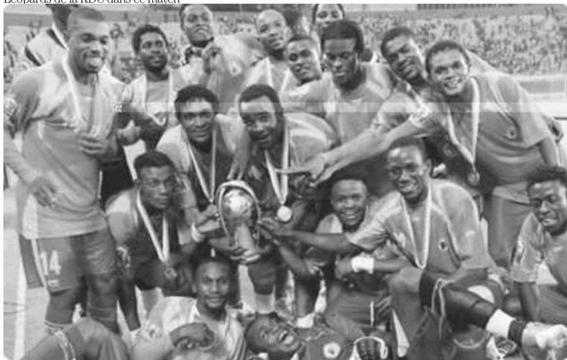
Les Léopards de la RDC vainqueurs du premier Chan en 2009 à Abidjan