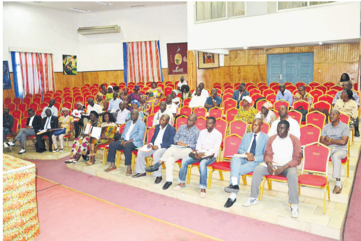
Une vue de la salle pendant la session sur la garde à vue

Des droits qui selon l'orateur sont inaliénables et ne peuvent nullement se marchander. Ainsi, devant une situation de violation des droits de l'Homme, d'un cas quelconque en justice ou d'une interpellation dans un poste de gendarmerie ou de po-