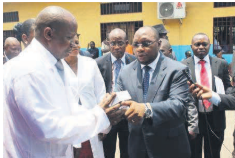
Le ministre de la santé remet des médicaments au médecin directeur de l'hôpital général de Matete

Cette visite du réconfort aux drépanocytaires, explique le ministre de la Santé publique, démontre l'importance que le gouvernement accorde à la drépanocytose et son engagement à accompa-