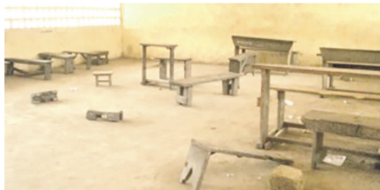
Une salle de classe dépourvue de tables-bancs, image d'archive

Le manque de tables-bancs, et le pléthore d'élèves sont les principales difficultés auxquelles se trouve confrontée l'école primaire de Loussala, située dans le troisième arrondissement de Pointe-Noire.