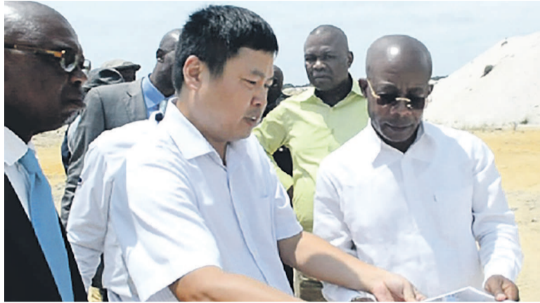
Le ministre Martin Parfait Aimé Coussoud-Mavoungou et le représentant de MPD.

En visite de travail à Pointe-Noire, le ministre à la présidence de la République chargé des Zones économiques spéciales, Martin Parfait Aimé Coussoud-Mavoungou, a visité le 7 novembre, le site où se construit l'usine de séchage et de compactage des potasses à Mengo, en compagnie des responsables de MPD.