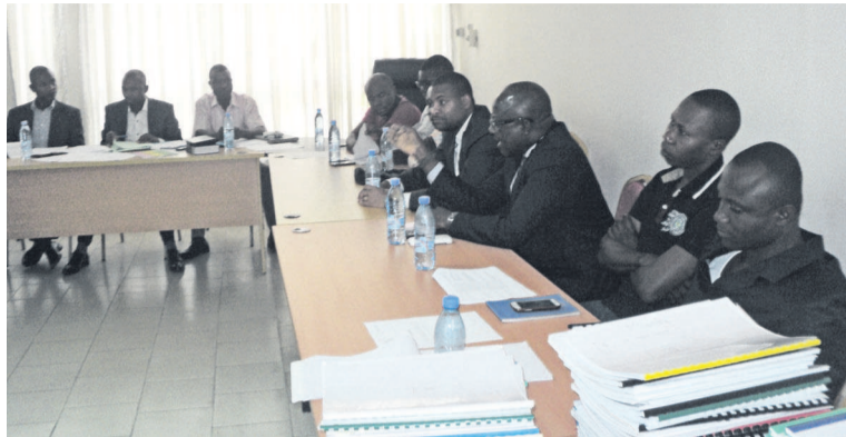
Une vue des participants à l'assemblée générale extraordinaire

L'ordre du jour a porté sur : le retrait non justifié d'une somme de 15 000 francs CFA sur les indemnités des fonctionnaires de l'ARMP, le non affiliation de certains agents à la Caisse nationale de sécurité so-