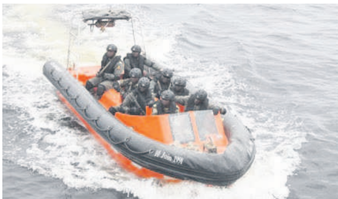
Des marins en haute mer en plein exercice tactique