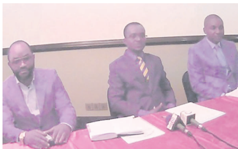
Une vue des membres du directoire

Dans ce texte, Ngonga ebeti rappelle aux uns et aux autres que le Congo, avec ses 342.000 km 2 appartient à tous les Congolais