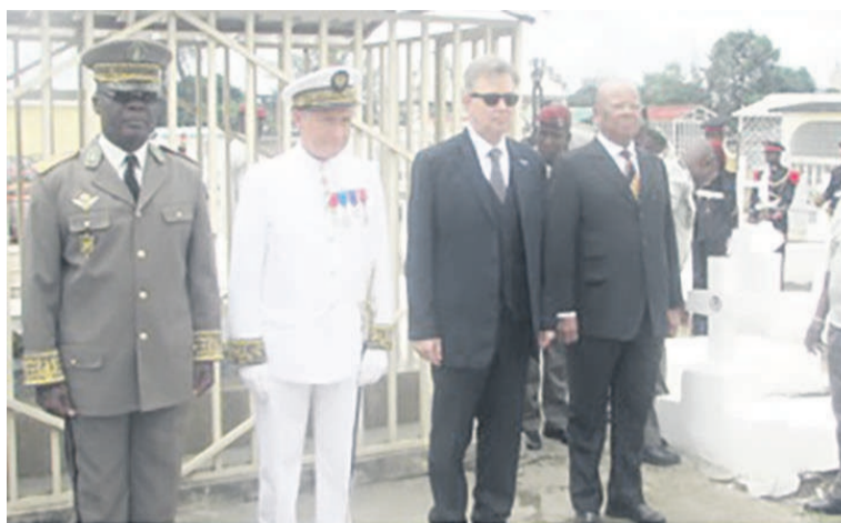
Le lancement de la cérémonie - moment de recueils

la cérémonie. L'ambassadeur de France, Jean-Pierre Vidon ainsi que les hautes autorités civiles et militaires présentes ont ensuite déposé des gerbes de fleurs au pied du monument consacré aux « Morts pour la France ». Sitôt après, ont retenti la sonnerie aux morts et les hymnes français et congolais interprétés par la musique des Forces armées congolaises.