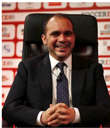
Prince Ali ben Al-Hussein