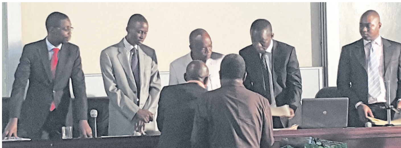
Remise des certificats de participation

niveau qu'ils veulent mettre à la disposition du pays. Vous comprenez que c'est toujours de bon sens d'avoir des nationaux pour enseigner à leurs frères Congolais la fiscalité congolaise, parce que les étrangers maîtrisent mieux les rouages de la