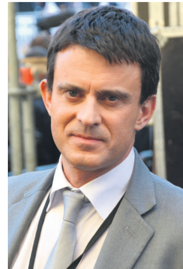
Le Premier ministre français, Manuel Valls et sa région reçoivent 46 millions de visiteurs par an.

Le commerce est lui aussi atteint. D'après la Chambre de commerce de Paris, les grands magasins du boulevard Haussmann, Printemps et Galerie Lafayette ont vu leurs fréquentations diminuer de 30 à 50%. Selon le syndicat des producteurs, les ventes des billets de concerts ont aussi connu une baisse de 80% pour ceux de Paris. Première destination touristique au monde, Paris