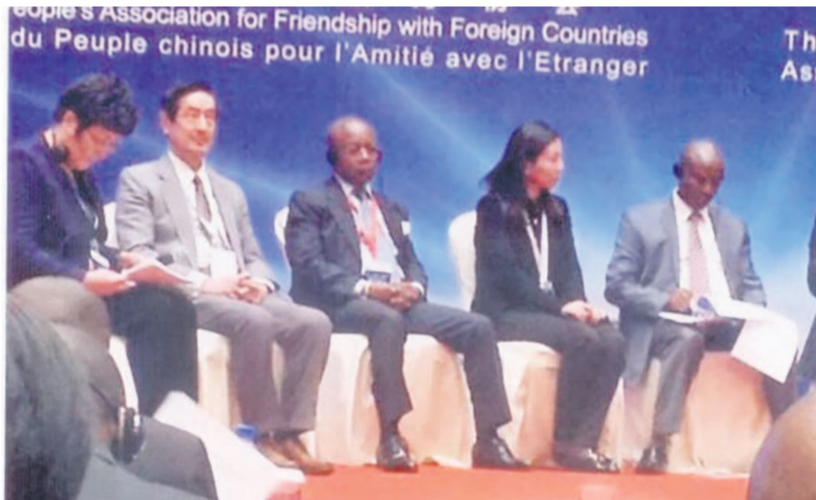
Martin Parfait Aimé Coussoud-Mavoungou, (au centre)

Parlant de l'économie congolaise, le ministre à la présidence de la République chargé des Zones Economiques Spéciales (ZES) s'est appesanti sur la politique de sa diversification prônée par le gouvernement depuis plus de sept ans dans tous les secteurs productifs allant de l'agriculture, l'exploitation forestière, minière et énergétique, l'industrie, les transports, de la logistique, des services au sport. « Le clou de la volonté de diversification de l'économie permet de noter une fiscalité attrayante pour les investisseurs potentiels et les facilités d'installation des sociétés », a fait savoir le ministre du haut de la tribune.