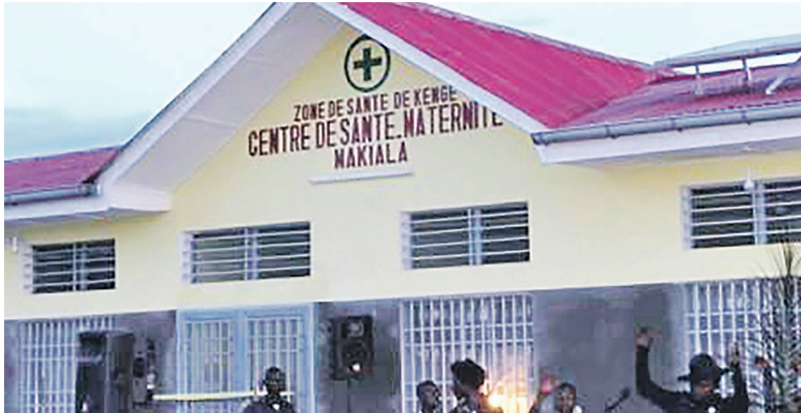
Le centre de santé moderne construit dans le cadre du Pess

Le Dr Félix Kabange Numbi a aussi participé à la réunion sur la situation épidémiologique de la province du Kwango au cours de laquelle il a interpellé la conscience de tous sur la nécessité de la vigilance car jusqu'à preuve du contraire, fait-il sa-