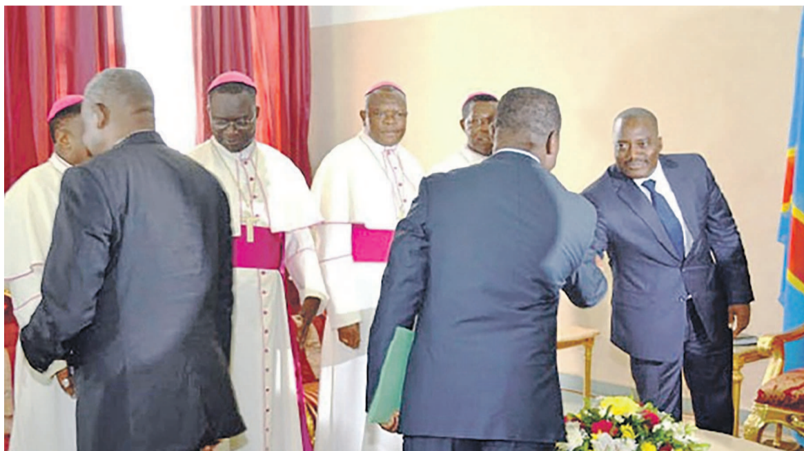
Joseph Kabila recevant les évêques catholiques

Entre-temps, au niveau d'états-majors des partis politiques, tant de l'opposition que de la majorité, la veillee d'armes est, d'ores et déjà, observée. L'activisme affiché des pro-dialogue est prémonitoire à la convocation imminente de ces assises, surtout que le dernier verrou que constituait l'arbitrage international conformément à l'Accord-cadre d'Addis-Abeba posé comme préalable à toute participation par l'UDPS et alliés a finalement sauté. Dans les milieux de la majorité présidentielle, on attend plus qu'une date soit fixée pour l'inauguration des travaux. Au cours d'une entrevue le 24 novembre avec Aubin Minaku en sa qualité de secrétaire exécutif de la plateforme présidentielle, les membres du bureau politique ont appris que le chef de l'État pourrait s'adresser incessamment à l'ensemble de la communauté nationale pour fixer les esprits sur les détails organisationnels de ce forum. Avant la fin du mois de novembre,