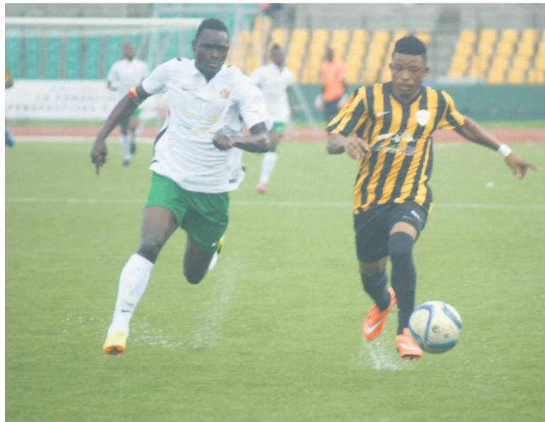
Etoile du Congo n'a pas tenu face à Vita club (Photo Adiac)

Le match Diabes noirs-Diaspora a souri aux jaunes et noirs (Photo Adiac)