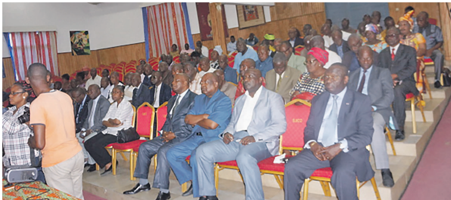
Une vue des participants à la conférence