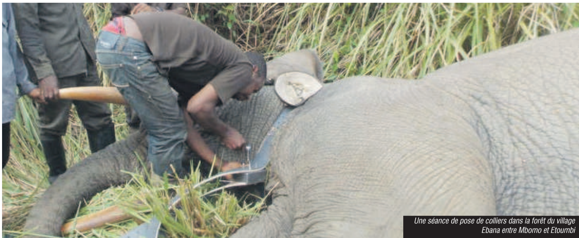
Une séance de pose de colliers dans la forêt du village Ebana entre Mbomo et Etoumbi

Les gestionnaires du Parc national d'Odzala-Kokoua procèdent depuis une année à la pose des colliers sur les éléphants. Depuis le 13 novembre