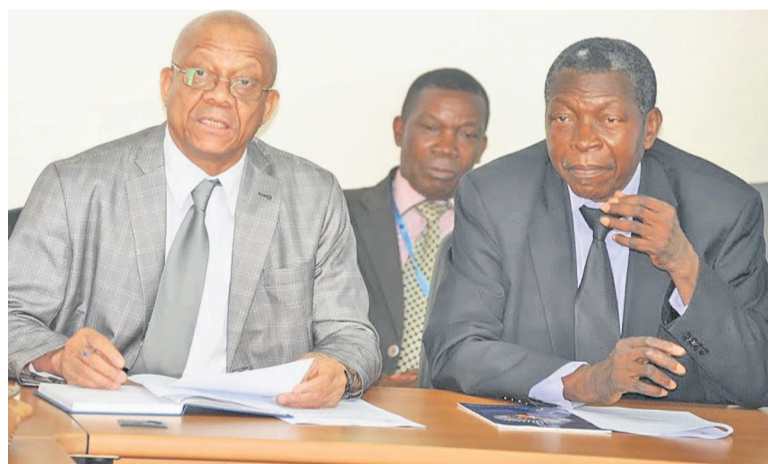
Le Dr Bakary de l'OMS et le directeur du PNCLT, Rigobert Mbuyu

Les différents acteurs impliqués dans la lutte contre le tabac réfléchissent sur la question au cours d'un atelier appuyé par l'OMS pour mettre en place un dispositif de coordination de lutte contre le tabagisme conformément à l'article 5 de la CCLAT. «Le renforcement de la coordination multisectorielle pour la lutte antitabac dont l'atelier a débuté aujourd'hui, et l'examen du projet de plan stratégique prévu du 27 au 28 novembre 2015 permettront à la RDC de mettre en place un dispositif de coordination et de doter le pays d'un outil de plaidoyer pour une mobilisation accrue des ressources en vue de l'accélération de la mise en œuvre de la lutte contre le tabac en RDC», a déclaré le Dr Bakary Sambou, chargé du Bureau de l'OMS en République démocratique du Congo (RDC) lors de l'ouverture de cette réunion. Le Dr Bakary Sambou a, par ail-