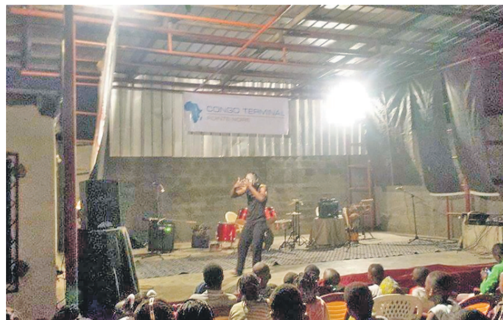
L'Espace Yaro new look

Le mois culturel s'achève ce samedi 28 novembre à l'Espace culturel Yaro à Loandjili dans le 4e arrondissement de Pointe-Noire par la représentation théâtrale de « Stèles du point du jour » de l'association Tchicaya U'Tam'Si. C'est un texte du poète Gabriel Mwènè Okoundji adapté et mise en scène par Antoine Yirrika.