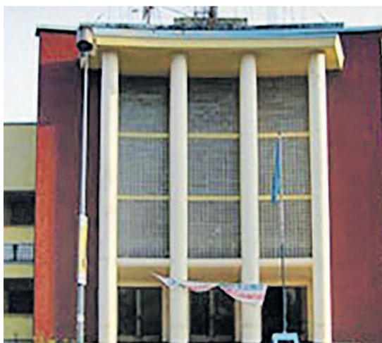
L'immeuble de la poste sur le boulevard du 30 juin à Kinshasa

Le 24 novembre, le gouvernement par le truchement du ministère chargé des Postes et Télécommunications a franchi un pas décisif en mettant en application cette mesure qui vise, dans un premier temps, à valoriser les activités postales en RDC. Officiellement, les autorités congolaises viennent d'accorder une bouffée d'oxygène à une entreprise présentée souvent comme moribonde. L'idée est d'essayer de faire de nouveau de la poste un opérateur universel comme dans les années 1965 et 1985. Entre-temps, en dehors de ce monopole, il y a eu d'autres mesures importantes visant à consolider le processus de relance des activités de la SCPT. En effet, l'ex-entreprise publique devenue société commerciale, dans le cadre de la réforme du secteur public en cours, est autorisée à commercialiser les appareils de télécommunications tels que les téléphones et leurs accessoires. Beaucoup d'analystes restent convaincus des effets d'une telle mesure d'autant plus que celle-ci devrait contribuer davantage à la transformation de l'image de la SCPT et même ouvrir ses horizons grâce à des rapprochements stratégiques avec d'autres opérateurs dans le monde. Autre