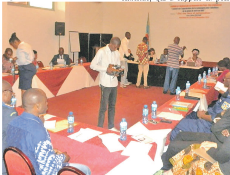
Les participants à l'atelier

gagements nationaux et internationaux de la RDC face à la peine