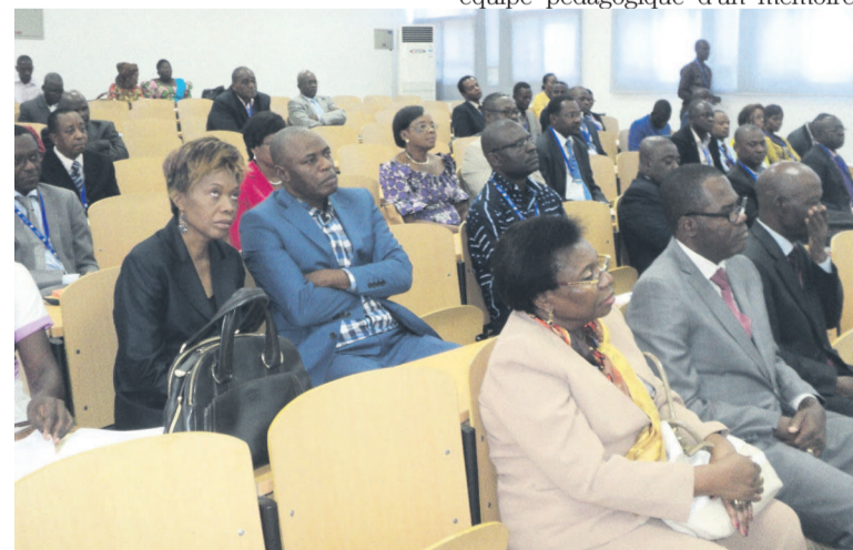
Les formateurs lors de l'ouverture des travaux

Le ministre de l'Enseignement supérieur, Georges Moyen, a ouvert le 26 novembre la formation des formateurs dans l'encadrement des mémoires de fin de cycles à la bibliothèque universitaire.