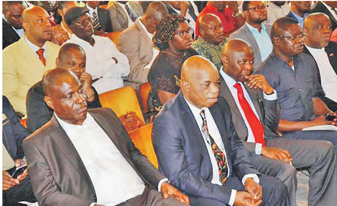
Les cadres de la Dynamique de l'opposition lors d'une activité

Visiblement, les deux parties sont parvenues à un modus vivendi dont on est loin de connaître les dessous des cartes, à considérer seulement l'engouement qui caractérise désormais les militants et cadres de l'UDPS à participer