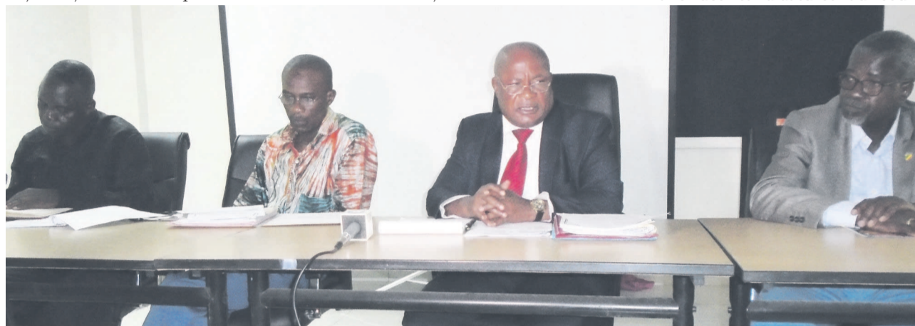
La commission électorale de la Fécofoot dévoilant le chronogramme des élections

Du 10 au 14 décembre, cette commission examinera les dossiers des candidatures reçus avant de procéder, le 15 décembre dans un point de presse, à leur publication et à celle du corps électoral. La période du 16 au 18 décembre, la commission de recours recevra les éventuels recours avant de leur examen les 18 et 19 décembre. Le 20 décembre, la commission électorale procédera à la publication définitive des candidatures au cours