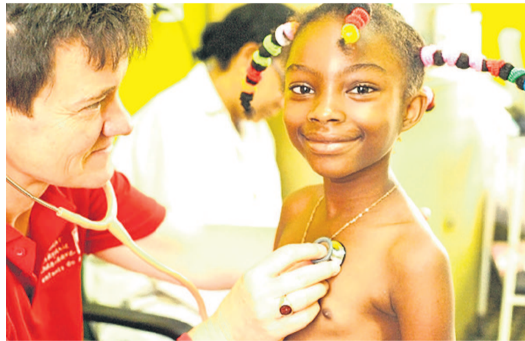
Consultation d'un enfant malade