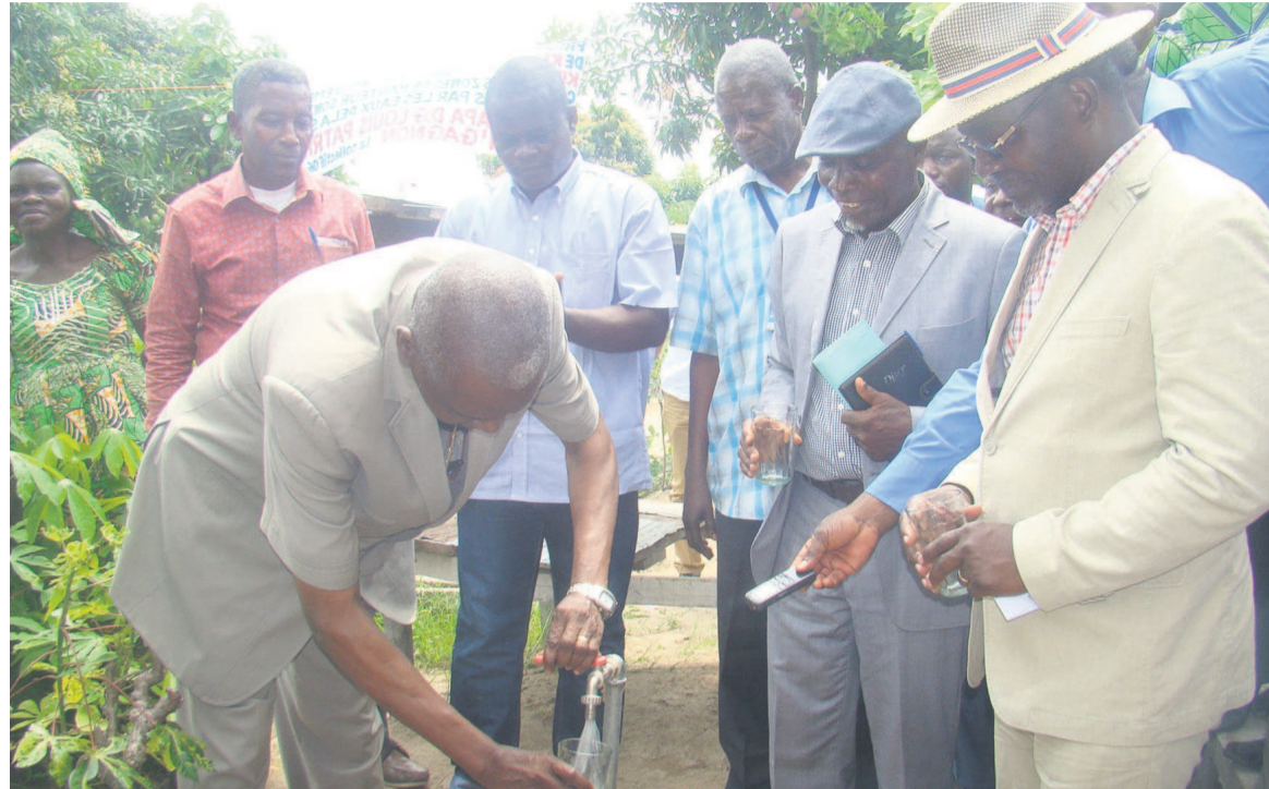
Inauguration du premier robinet d'eau potable

Abordant dans le même sens, Agnès Moutoula, une femme de 3 e âge n'en revient toujours pas : « Je n'imaginai pas que je pouvais voir l'eau couler du robinet