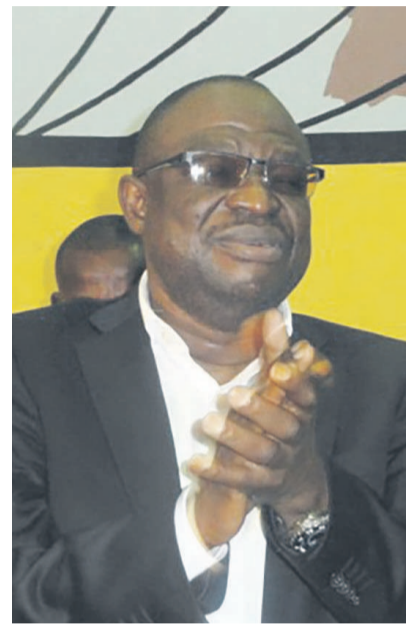
Le président du MCDDI

Le bureau exécutif national du Mouvement congolais pour la démocratie et le développement intégral (MCDDI) a condamné, au cours d'une réunion organisée à Brazzaville le 3 novembre, « les actes inciviques, barbares et antidémocratiques perpétrés par des citoyens manipulés par certaines officines politiques, au cours de la campagne référendaire ».