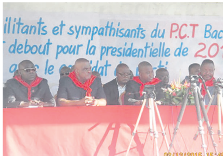
Une vue de la délégation du PCT à Bacongo

frais. Progressivement le mercantilisme prend la place du militantisme. On voit se développer la faiblesse au pouvoir de l'argent. Nous devons le combattre absolument afin que les militants participent aux meetings, parce qu'ils croient à un idéal. Il nous faut nous lever véritablement pour restaurer l'esprit militant. Il faut développer la