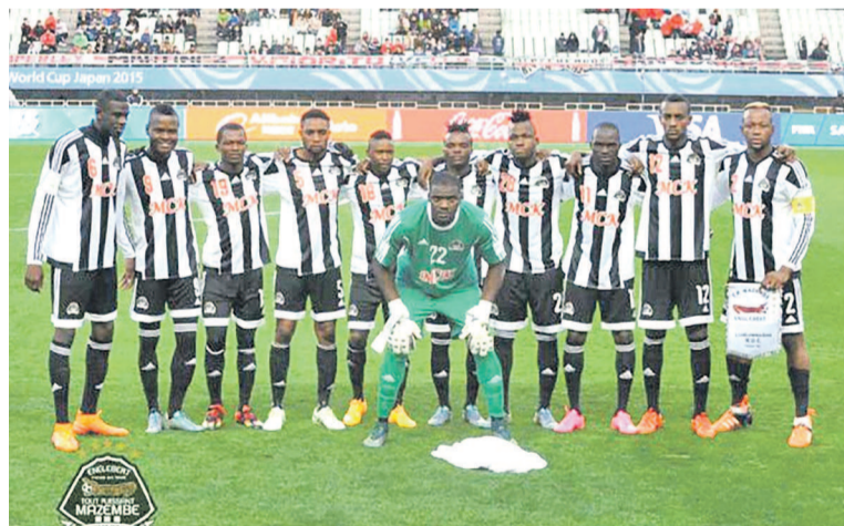
Mazembe à Osaka avant le match contre CF America