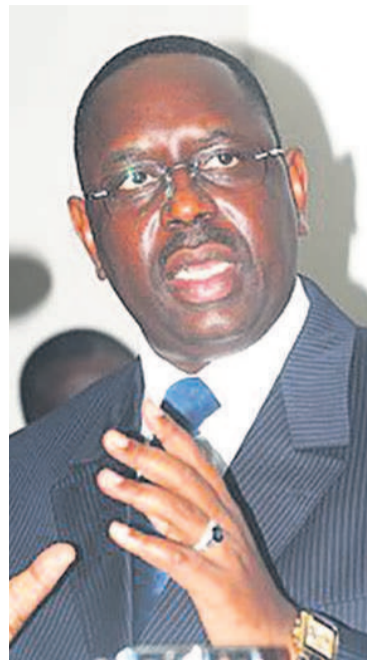
Le président Macky Sall Chargé de faciliter l'intégration socio-économique, cultu-

Le président de la commission de la CEDEAO, Kadré Désiré Ouédraogo a, pour sa part, félicité le président de la transition du Burkina Faso, Michel Kafando, pour son action à la tête du pays. « C'est le lieu pour moi de rendre un hommage mérité à son excellence Michel Kafando et à toute son équipe de la transition, pour la brillante conduite de cette transition, jusqu'à son terme. », a-t-il déclaré. Toujours à propos du Burkina Faso, le président en exercice de la CEDEAO a noté l'importance de la tenue d'élections apaisées qui ont porté Roch Marc Christian Kaboré au pouvoir.