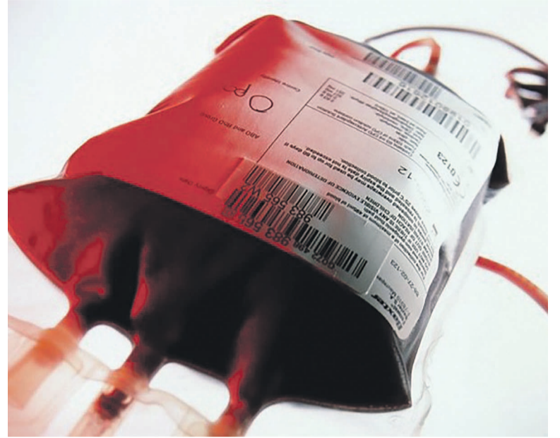
Le ministère de la Santé déterminé à disponibiliser du sang de qualité