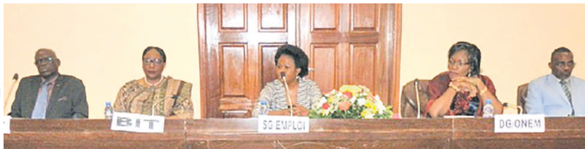
La tribune, lors du lancement des travaux