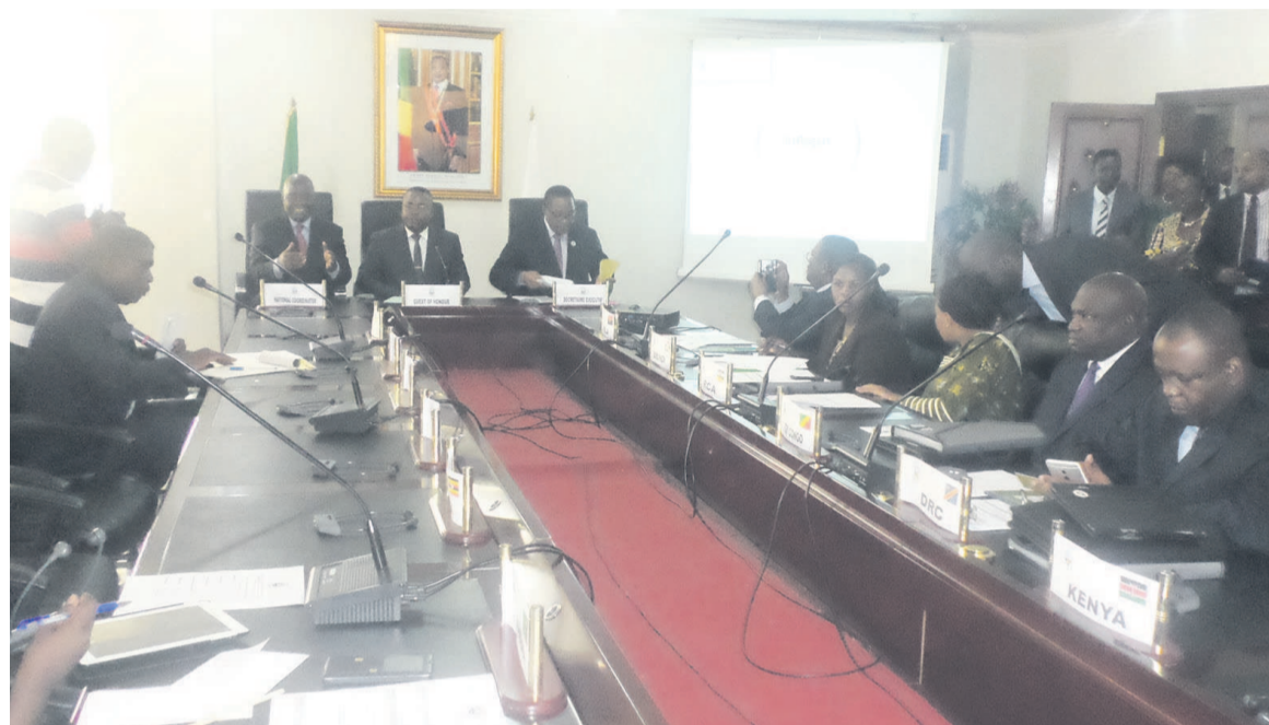
La séance de travail entre les deux parties

l'impunité dans ce pays », a-t-il exhorté.