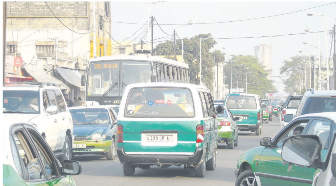
Une avenue de Brazzaville aux heures de pointe

la principale sortie nord de la ville, entre le Lycée Thomas Sankara, à Mikalou-Djiri, et le Terminus de Mikalou à Talangaï. Depuis deux semaines, les eaux de pluie ensablent la chaussée déjà malmenée par les crevasses au niveau du