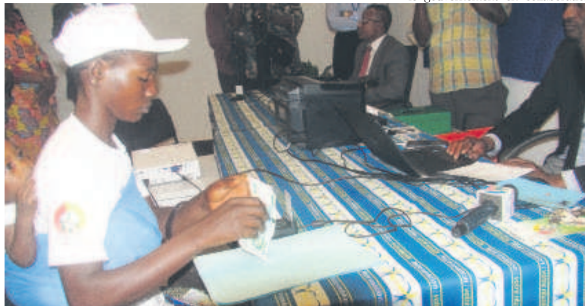
Une des bénéficiaires

« 3200 ménages très pauvres ont été ciblés à Brazzaville. Ce jour nous procédons au lancement des transferts monétaires de 1720 ménages qui ont été jugés éligibles. Pour les 1500 autres ménages, leurs dossiers seront soumis au contrôle. A cet effet, une enquête sociale a déjà été lancée. Ces ménages seront payés après