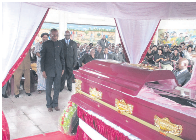
Les membres de la fédération PCT-Sangha devant la dépouille mortelle

du conseil fédéral du PCT de la Sangha. « Son parcours exemplaire donne à relever, avec respect, la double leçon de grandeur et de servitude que nous légue ce camarade, dont la destinée, pourtant hors du commun, aura été semblable à celle qu'en définitive, la fatalité nous réserve, à savoir : l'impermanence de la vie et la dimension libératoire de la mort (...) Avec la disparition de ce camarade émérite, qui a