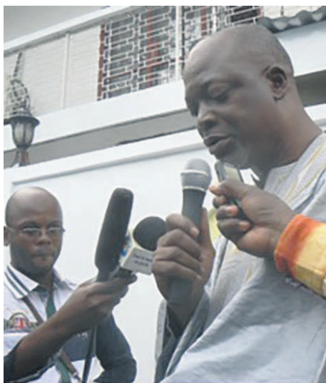
L'un des petits-fils au défunt peintre en train d'expliquer les raisons de la création de cet espace

Il a exposé à Lomé (Togo) en 1958 lors des festivités de l'auto-détermination de la nation Togolaise. En 1964, il expose aussi à Abidjan (Côte d'Ivoire) à l'inau-