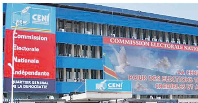
Le siège de la Céni

Le calendrier électoral publié au mois de février 2015 devenu anachronique et ayant été rejeté par l'opposition, la publication d'un nouveau qui ne serait pas problématique s'impose comme un impératif majeur pour débloquer le processus électoral. La Céni est donc appelée à faire diligence pour se mettre en phase avec les objectifs qui lui sont assignés en tant que pouvoir organisateur des élections. D'où l'exigence d'un calendrier consensuel accepté par tous. Dans les milieux concernés, on laisse entendre que ce