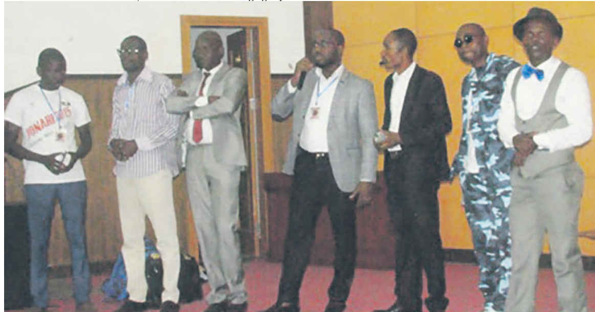
Photo de famille des comédiens