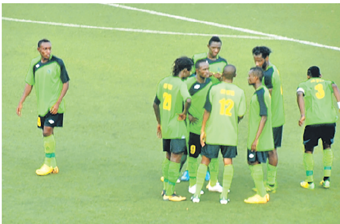
AS V.Club de Kinshasa

Pour leur part, les Dauphins Noirs de Kinshasa qui entreront en lice mars 2016 en Coupe de la Confédération ont mis à profit cette rencontre pour revoir leurs stratégies. Le club dirigé par le général d'armée Amisi Kumba Tango Four a été éliminé lors de sa dernière campagne en C2 africaine au tour de cadrage par Stade Malien de Bamako. V.Club