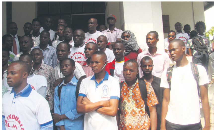
Une vue des membres de l'association ayant participé au don de sang