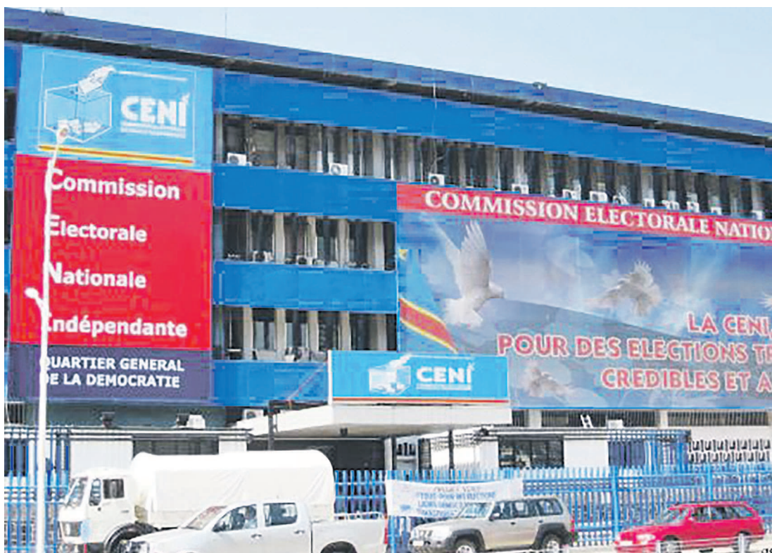
Le siège de la Céni sur le boulevard du 30 juin