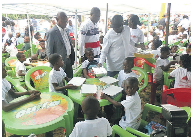
André Kimbuta distribuant la nourriture aux enfants

Près de cinq cents enfants, pensionnaires de différents orphelinats de la ville-province de Kinshasa, ont été le 25 décembre les hôtes du gouverneur de la capitale congolaise, André Kimbuta Yango, à l'occasion du repas de Noël qu'il leur a offert en l'espace de