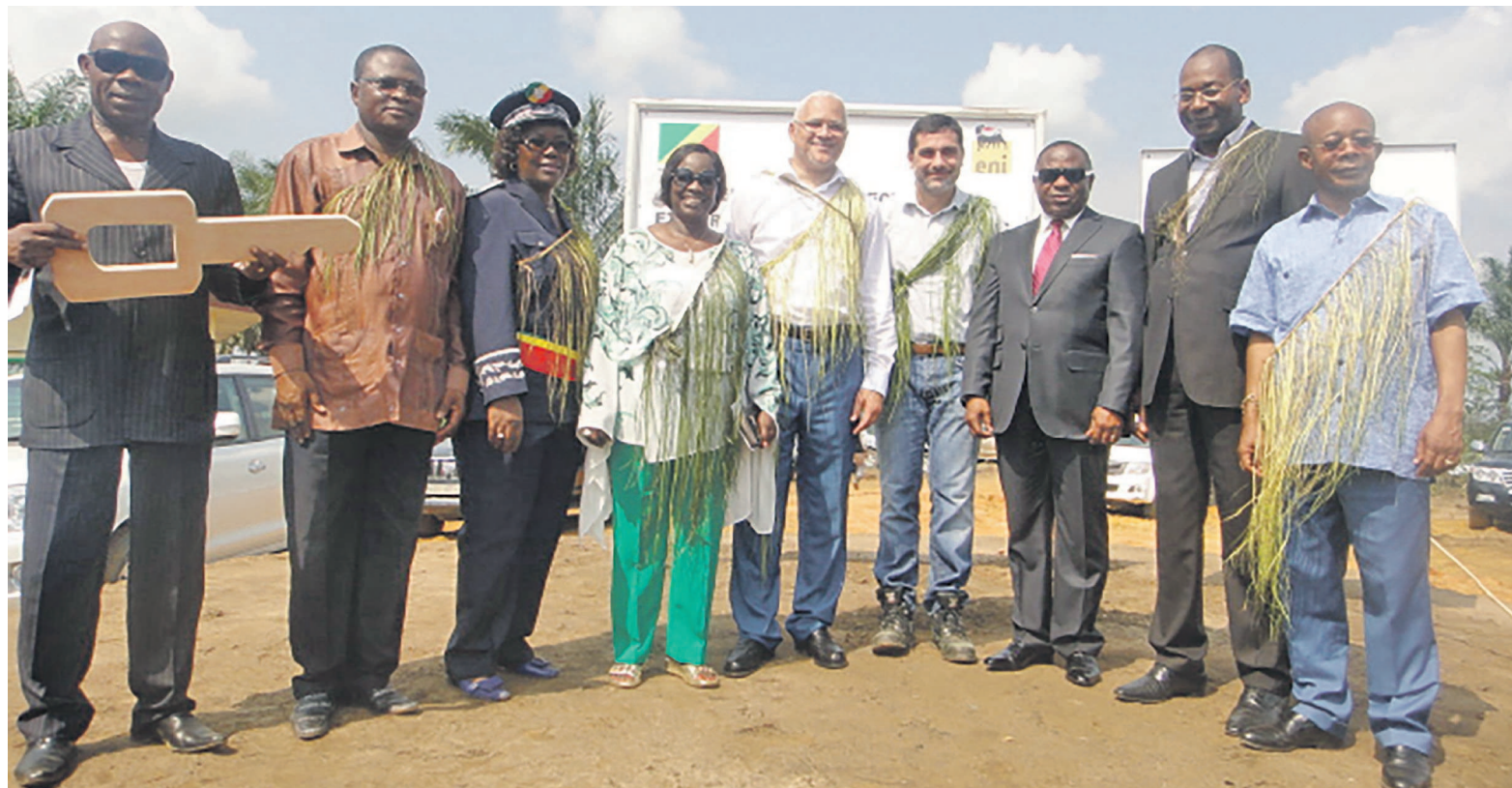
Photo de famille après la visite des sites des projets

Ainsi ces projets se fixent divers objectifs notamment dans le secteur de santé, la réduction de la morbidité et de la mortalité dues aux principales maladies avec une