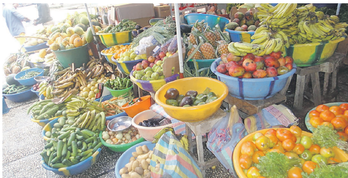
Des denrées alimentaires exposés sans prix

La situation entraîne un grincement de dents des acheteurs. Lorsque ces derniers sont interrogés sur la question, nombreux accusent l'hibernation des autorités départementales chargées de la concurrence et de la répression des fraudes commerciales. Mais en dehors de l'anarchie des prix des marchandises et denrées, il y a aussi une résurgence de la vente d'eau en sachets, des emballages en sachets et autres objets plastiques. De plus, il est constaté un grand silence en matière de saisie et de destruction des marchandises avariées comme si des commerçants récidivistes vendant des marchandises avariées n'existaient plus. Et pourtant Pointe-Noire était presque devenue un modèle à suivre pour d'autres départements en matière de mobilité des agents et contrôleurs