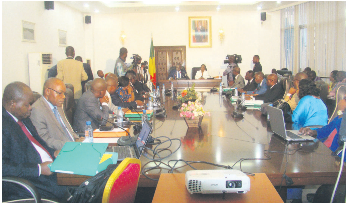
Les membres du COS pendant la session

Les membres du COS ont également adopté, avec amendements, le document de cadrage du plan de travail et du budget annuel 2016. S'agissant du budget prévisionnel, il s'élèverait à la somme de 7 milliards 250 millions 502 945 FCFA. Il est retenu comme activité prioritaire, la fiabilisation du système informatique et l'intégrité du registre unique ; l'augmentation du nombre de ménages inscrits dans le registre unique, et ceux éligibles aux paiements ; le soutien aux activités d'inclusion productive. A cela, s'ajoutent, la préparation des conditions de passage à l'échelle ; le suivi des conditionnalités des ménages ainsi que la construction