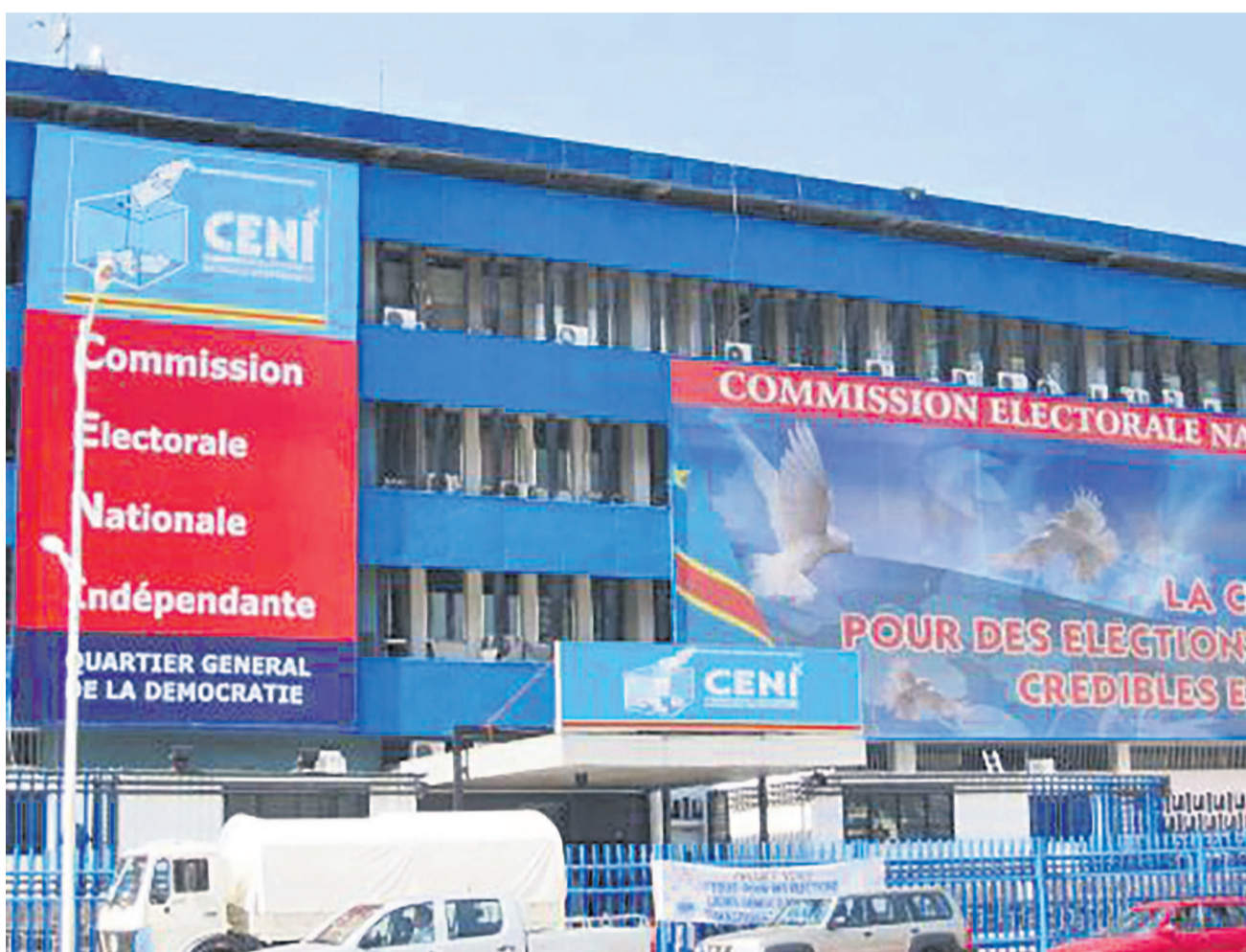
Le siège de la Ceni sur le boulevard du 30 juin