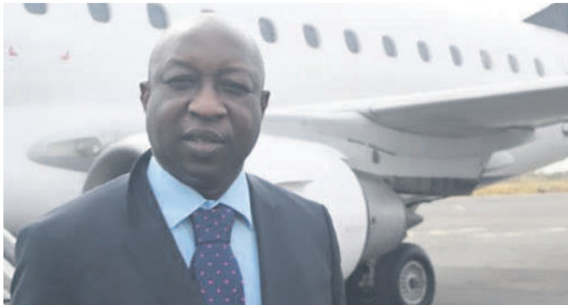
Paul Kaba Thiéba