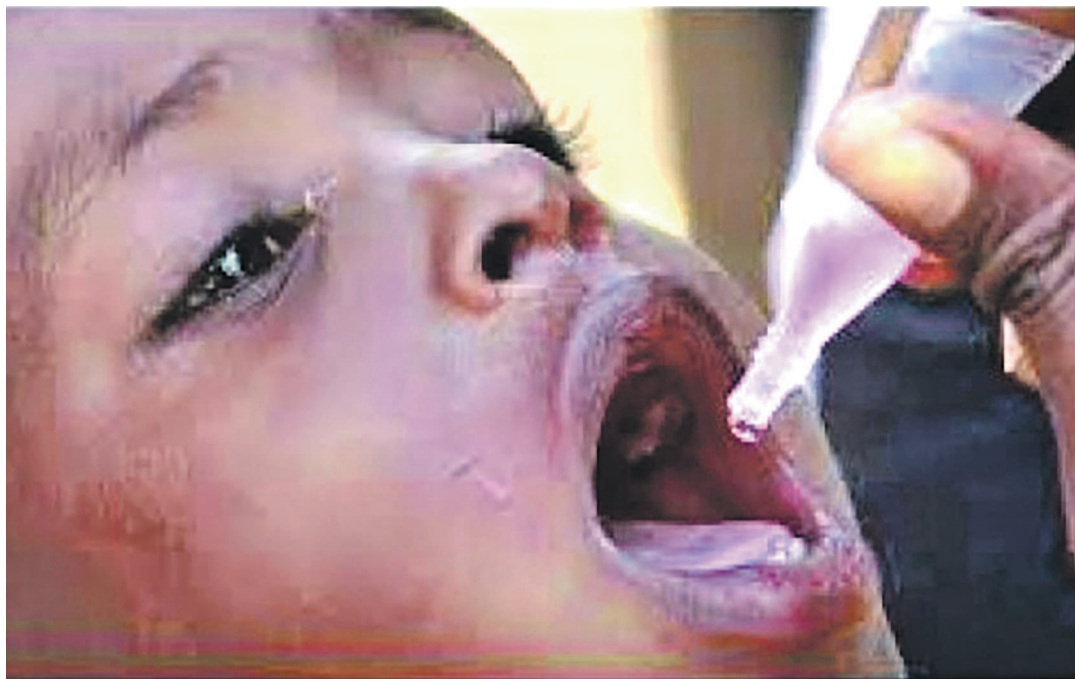
La vaccination protège l'enfant contre plusieurs maladies

Le ministère de la Santé publique à travers son programme élargi de vaccination a organisé dernièrement des journées locales de vaccination dans les 302 zones de santé sur les 516.