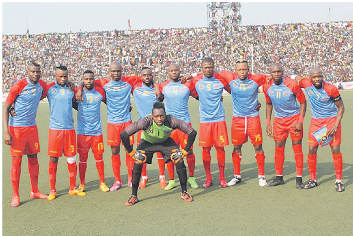
< Sans données à partir du lien >

Notons que les Léopards de la RDC n'ont livré aucune rencontre en décembre 2015. Toutefois, les Léopards locaux (sélection composée des joueurs évoluant exclusivement dans les championnats locaux) avaient plutôt pris part au tournoi quadrangulaire en novembre