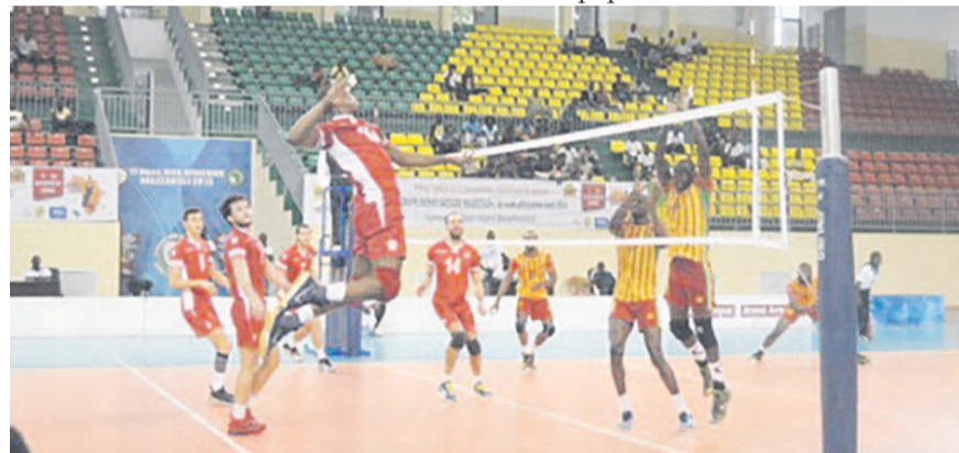
Une phase de jeu du match Congo-Tunisie

Après leur défaite face à Tunisie, les Diables rouges vont se mesurer aux Egyptiens le 8 janvier au gymnase Henri-Elendé en début d'après-midi. L'Egypte qui avait été éliminée par le Congo en demi-finale des onzièmes Jeux africains tentera assurément de prendre sa revanche lors que pour les Congolais ce sera un match crucial duquel dépendra leur éventuelle au deuxième tour de ce tournoi Denis-Sassou-N'Guesso,