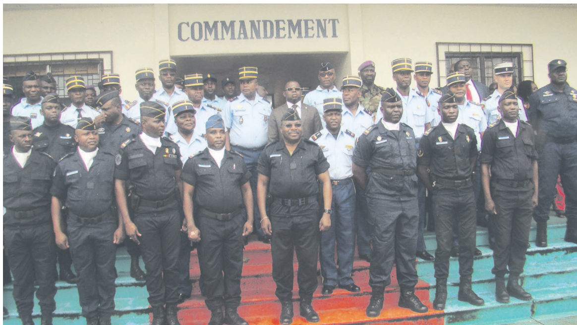
Le Commandement de la gendarmerie nationale posant avec les huit officiers supérieurs promus

grade obéit à trois critères qui sont l'ancienneté dans le grade antérieur, la discipline et le diplôme exigé. « Il faut se reposer sur trois piliers dont la discipline, l'obéissance aux ordres des chefs. Accouplé à cela, la détermination et l'amour du travail bien fait afin de donner une grande satisfaction à la chaîne hiérarchique. Il y a aussi la disponibilité ; il faut être prêt à servir la République partout où besoin sera et quelles que soient les conditions psychologiques et matérielles », a expliqué le diplômé d'état-major et