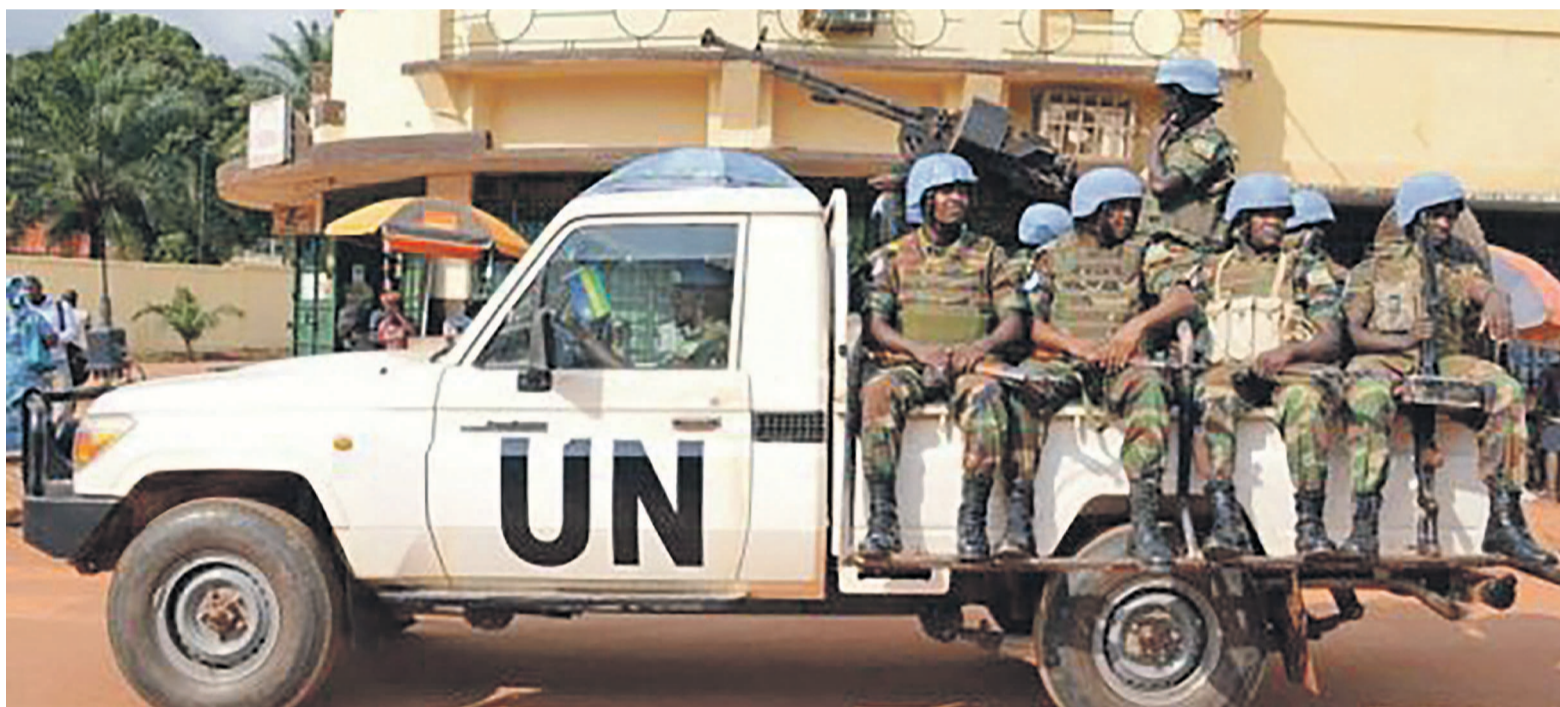
Des casques bleus de la Minusca en patrouille à Bangui

Le bataillon de la RDC actuellement déployé dans la Minusca comptant entre 807 soldats et 118 policiers sera rapatrié sans être remplacé.