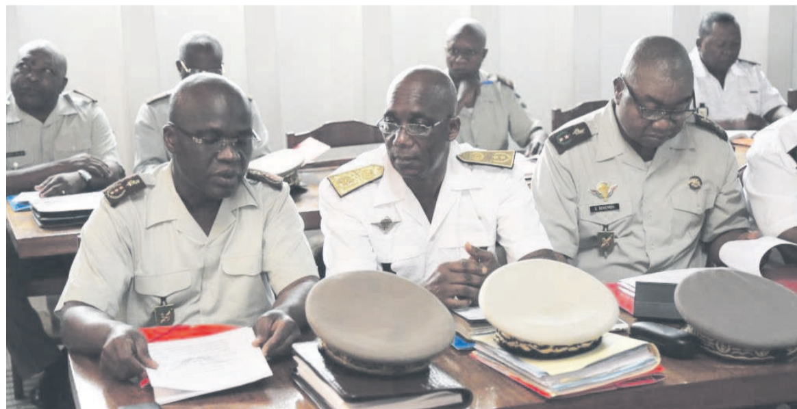
Des membres du haut commandement des FAC

Cette conférence a regroupé les membres du groupe d'anticipation stratégique, du groupe pluridisciplinaire de planification opérationnelle, des contrôleurs opérationnels des commandements des groupements mixtes des forces territoriales ainsi que des commandants des unités spécialisées. Pendant deux jours, les enseignements ont porté sur les projets des plans d'emploi des contrôleurs opérationnels des commandements territoriaux, le dialogue