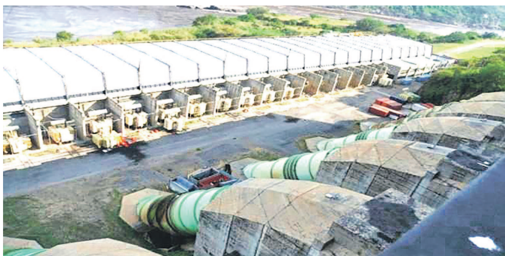
Barrage hydroélectrique Inga II