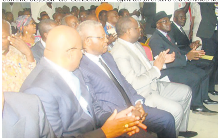
Une vue des responsables deux plates formes

La convention nationale de l'opposition congolaise qui s'est ouverte le 08 Janvier au siège de la CADD à Brazzaville et qui a réuni plus d'une vingtaine de partis politiques parmi lesquels l'UPADS, la CADD, le MCDDI de Parfait Kolélas, l'UDR-Mwinda, le CNR et bien d'autres et dont les travaux dureront trois jours se fixe comme objectif de consolider