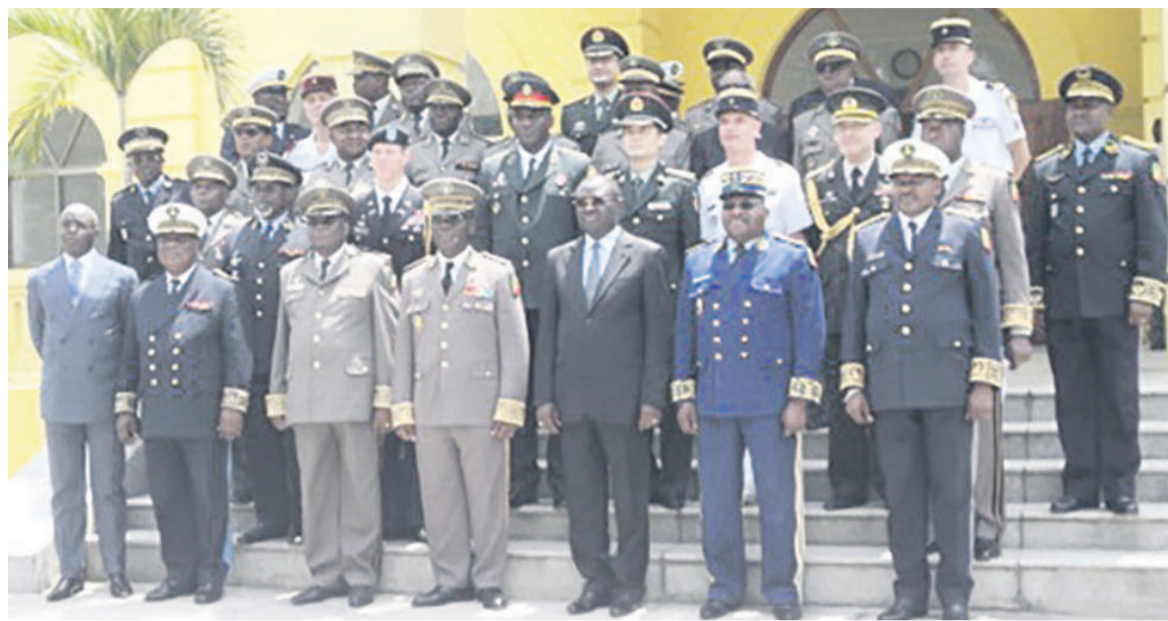
Photo de famille avec le ministre après échanges des vœux