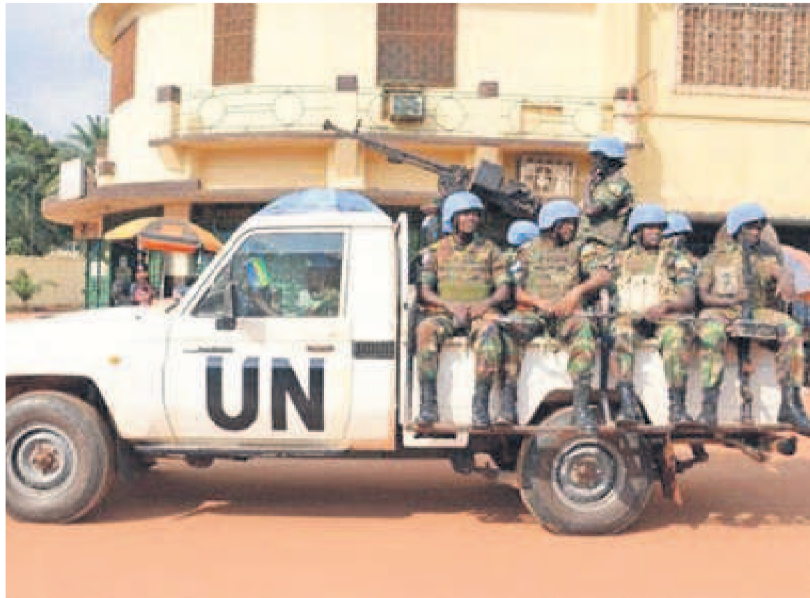
Des casques bleus de l'Onu

Alors que la commission d'enquête mise en place par Kinshasa a conclu à l'innocence de ses trois casques bleus mis en cause et dénoncé un montage, l'ONU a persisté à croire qu'il y avait