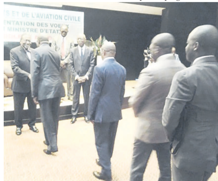
Poignée de main entre le ministre et ses collaborateurs

J'attends de vous un accompagnement constant afin de toujours trouver le juste milieu entre les intérêts particuliers et publics », a souligné