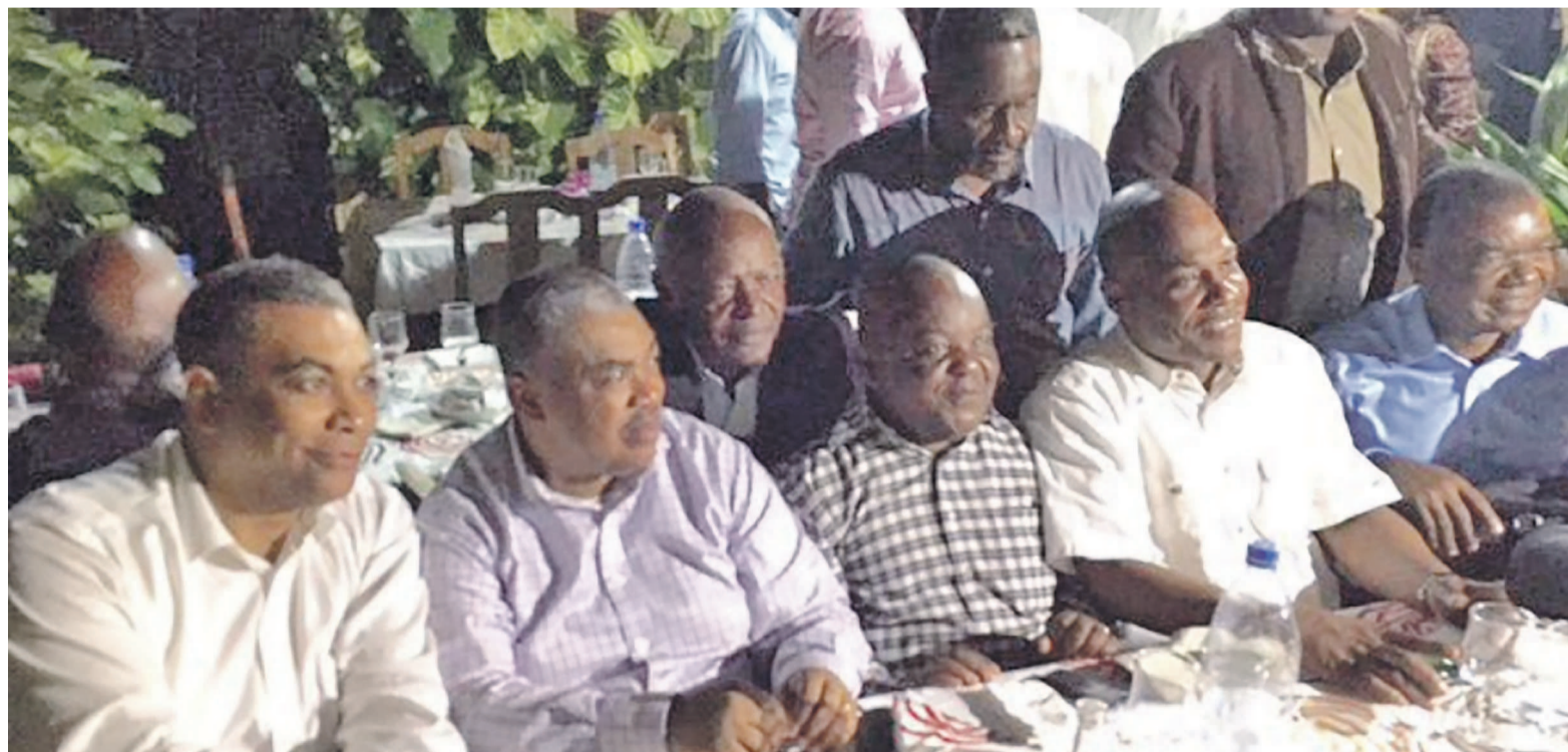
Des opposants congolais à Dakar

Dans sa déclaration, la Dynamique de l'opposition a réitéré son refus de participer au dialogue qu'elle considère comme