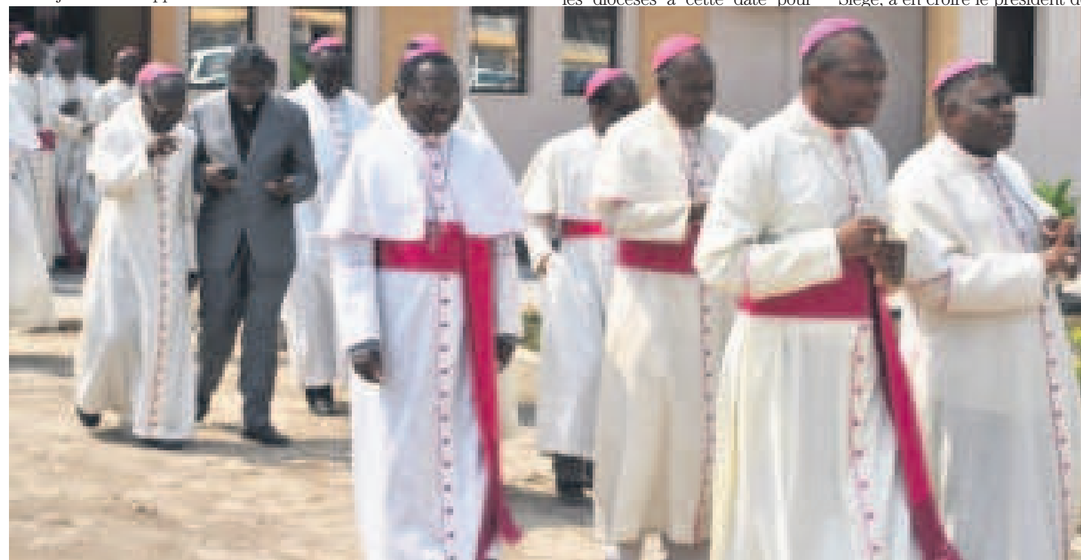
Les évêques de la Cénco

trevoient pour commémorer à leur manière les martyrs de la démocratie. Cette échéance