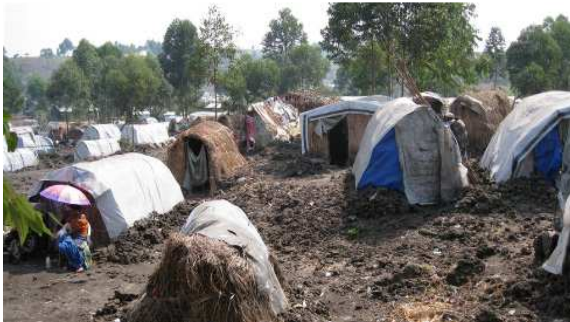
Un camp de réfugiés

Dans un communiqué du 13 janvier, le Chef du Bureau de la coordination des affaires humanitaires (OCHA) en RDC, Rein Paulsen, déplore le démantèlement du site de déplacement de Mokoto, à environ 70 kilomètres de Goma, au Nord-Kivu, qui abritait plus de 4 200 personnes déplacées. « Je regrette la manière dont ce démantèlement s'est déroulé et je suis fortement préoccupé par la punition collective imposée à ces personnes déplacées vulnérables », a-t-il dit. Même si la décision de fermer les sites de déplacement pour des raisons de sécurité nationale appartient aux autorités provinciales, a poursuivi Rein Paulsen, il est