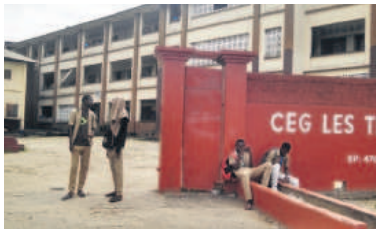
Des élèves prennent goût d'être dehors

», se sont plaints ces parents. L'établissement scolaire, Les Trois-Glorieuses n'est pas le seul établissement scolaire où les élèves prennent le goût d'être errants aux alentours de l'école. Ce spectacle est aussi vécu dans d'autres écoles que ce soit celles de Brazzaville ou de l'intérieur du pays. Un surveillant général et un directeur des études d'un collège d'enseignement général privé interrogés sur ce comportement blâmable des élèves, qui prend corps dans de nombreuses écoles, déclarent : « Ces élèves qui sont constamment dehors sont