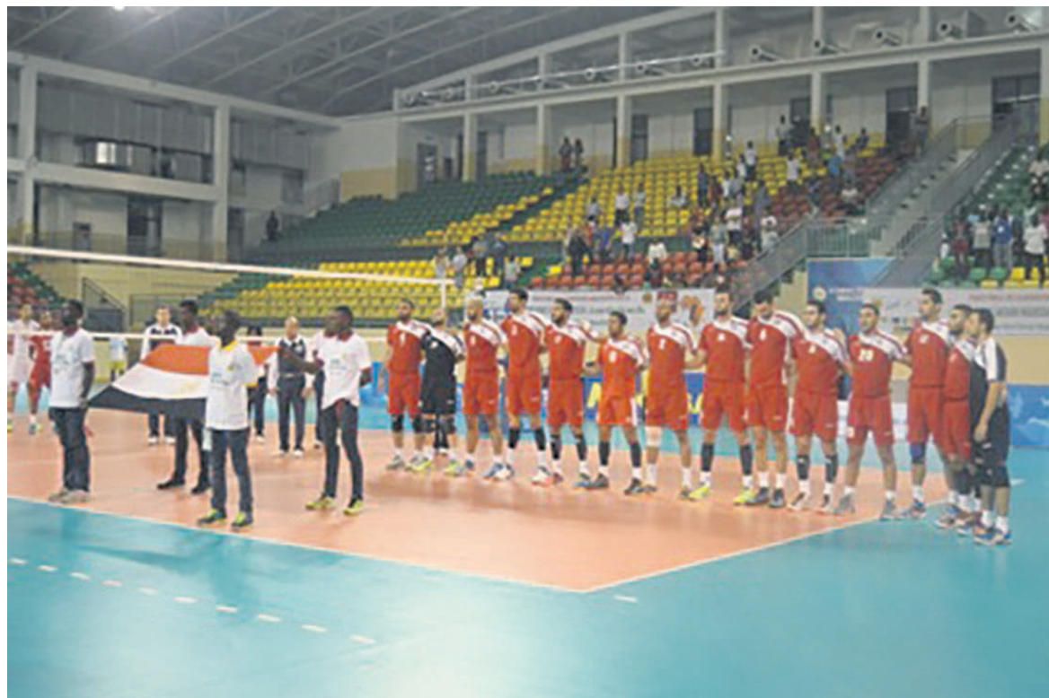
L'équipe d'Egypte de volleyball

si l'Egypte n'a pas mis assez du temps pour plier le premier set 25-19. La situation s'est renversée au deuxième set : la Tunisie est revenue à la hauteur de son adversaire (25-20). Cette finale était tellement chargée de rebondissement au point que les Egyptiens ont repris le dessus au quatrième set