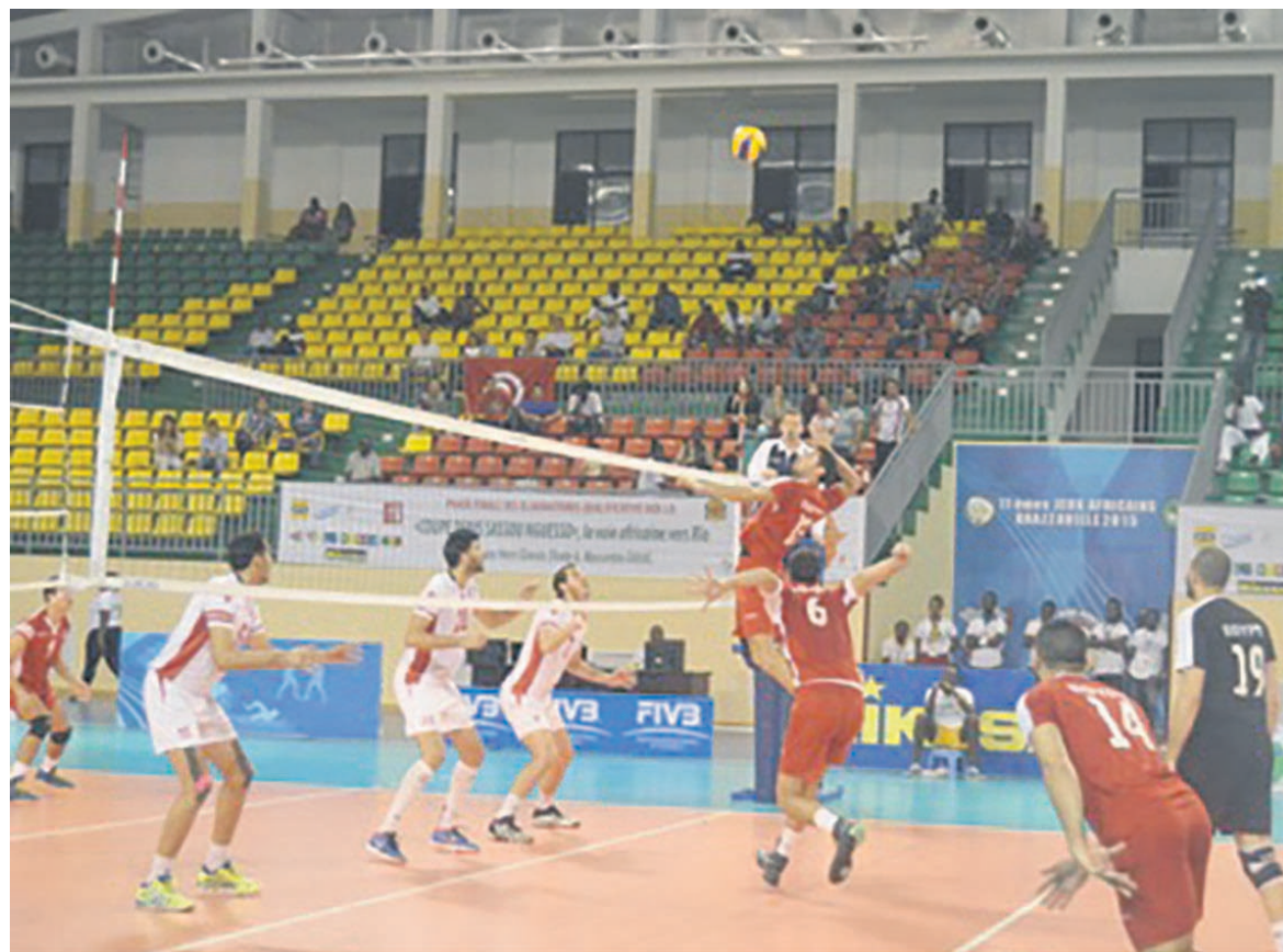
Une phase de jeu de la finale Egypte-Tunisie