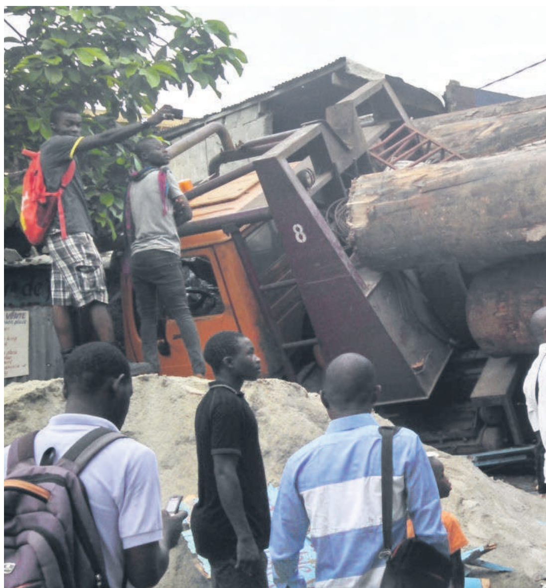
Le Grumier termine sa course contre un banc de sable