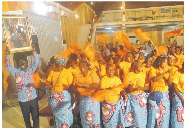
Les femmes du noyau en liesse soulevant haut l'effigie du président de la République; Vue de la tribune officielle