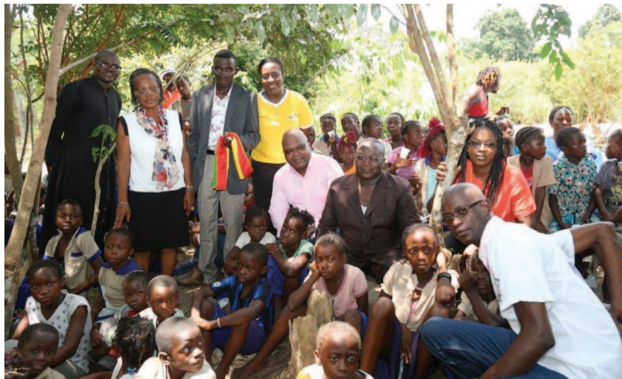
avec les enfants de Koubola

la localité de Koubola lui ont permis d'y bâtir un Centre d'Education et d'Apprentissage avec internat muni de salles de cours et de formations professionnelles, des dortoirs