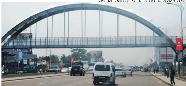
Une vue de la passerelle de la septième rue Limete