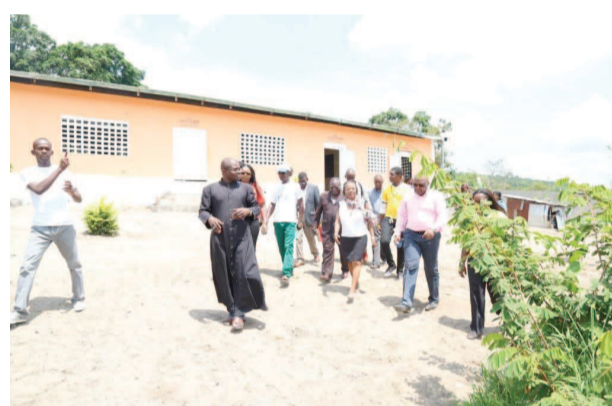
Lors de la visite du centre Ephata