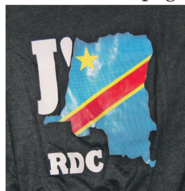
Le logo de la campagne

Au passage de la délégation, hommes, femmes et enfants viennent en masse pour s'in-