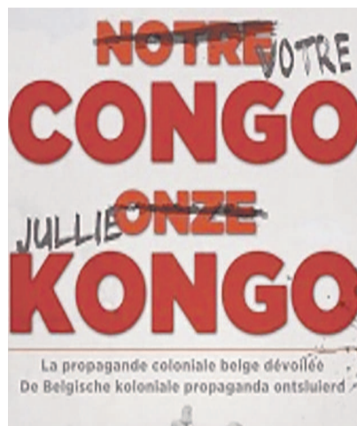
L'affiche de l'exposition

L'exposition se tient du 23 janvier au 13 février au centre culturel Escale du Nord d'Anderlecht dans le cadre du festival « Devoir de Mémoire- colonisation belge du Congo, entre hier et aujourd'hui ».