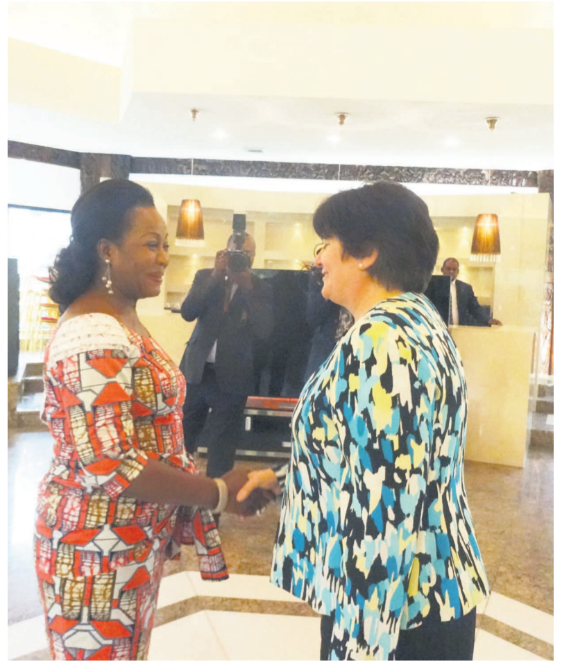
Poignée de main entre Antoinette Sassou N'Guesso et Stéphanie Sanders Sullivan.

« Avant et après le référendum, il y a eu beaucoup d'intox. Or, il fallait chercher à connaître ce qui se passe réellement, et de ne pas écouter ce qui se dit dans les médias. Mais ce que je re-