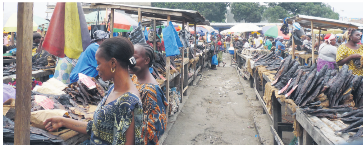
Une vue des étales de poissons fumés dans un marché de Brazzaville

Face à la flambée des prix des produits de première nécessité observée dans les marchés de l'étendue du territoire national, le ministère du Commerce et des approvisionnements inscrit plusieurs actions à son agenda de 2016. « Notre plan d'action cette année s'inscrit dans la continuité de nos activités de 2015. Afin de se prémunir contre la vie chère, il ne sera plus toléré certains comportements néfastes des producteurs, locaux, importateurs et revendeurs des biens et services qui ne se conforment pas aux normes », a promis le ministre Euloge Landry Kolélas, à l'occasion de la cérémonie d'échanges des vœux avec ses administrés. Page 3