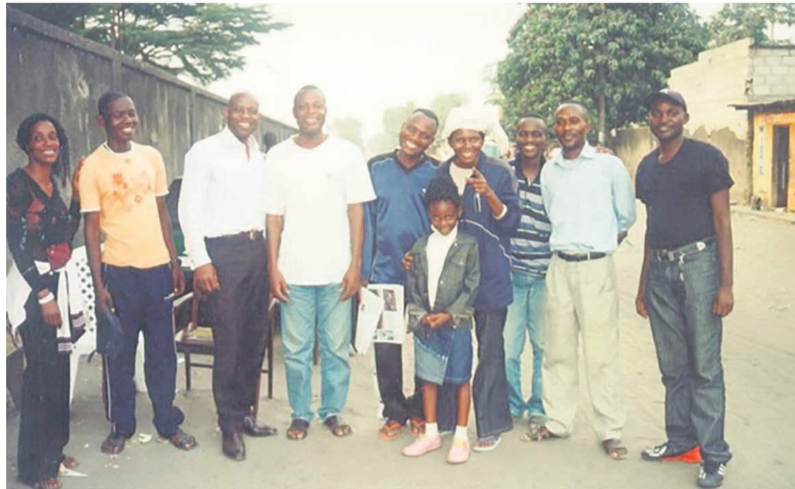
Association Partage après une séance de travail à Bacongo en face de la Paroisse Saint-Pierre Claver

L'association Partage, domiciliée à Vigneux-sur-seine en France, s'est vite portée sur l'amélioration des conditions de vie d'une dizaine de familles congolaises installées dans la ville. « L'ouverture à l'autre a commencé par des