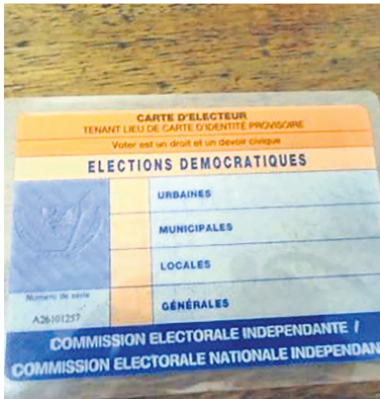
Une carte d'électeur

Comment se sont-ils procurés ces cartes ? À en croire le président de ladite commission parlementaire, c'est par le truchement des membres de l'ancienne rébellion du Mouvement du 23-Mars (M23) réfugiés au Rwanda que ces rebelles burundais ont acquis ces documents imprimés tant au Rwanda qu'au Burundi. Il s'agit des lots que les éléments du M23 auraient soustraits en 2011 dans des centres de vote qui étaient à leur portée. Et en transit au Rwanda où ils subissent un entraînement intense dans des centres de formation avant leur infiltration en RDC, ces rebelles burundais se verraient délivrer ces cartes d'électeurs, soutient le député Justin Butakwira qui a rencontré personnellement les détenteurs desdites cartes. Il explique : « Eux-mêmes ont déclaré qu'ils passent par le Rwanda. Ils font des entraî-