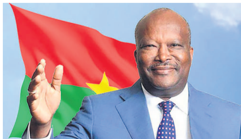
Roch Marc Christian Kaboré

Les représentants des différentes confessions religieuses ont tous condamné l'acte barbare des terroristes. D'abord, la communauté musulmane : elle a fermement condamné ces attaques terroristes et l'idéologie prônée par les terroristes. Selon son représentant, « il s'agira désormais de travailler à restaurer l'image