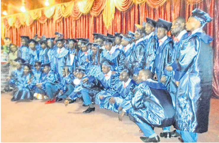
Les étudiants posant pour la postérité

une référence en matière de formation de techniciens supérieurs. En 15 ans, 285 étudiants de 3 e année ont effectué une formation en alternance et ont été diplômés. Près de 66 % sont en emploi dans les différentes entreprises de la place ».