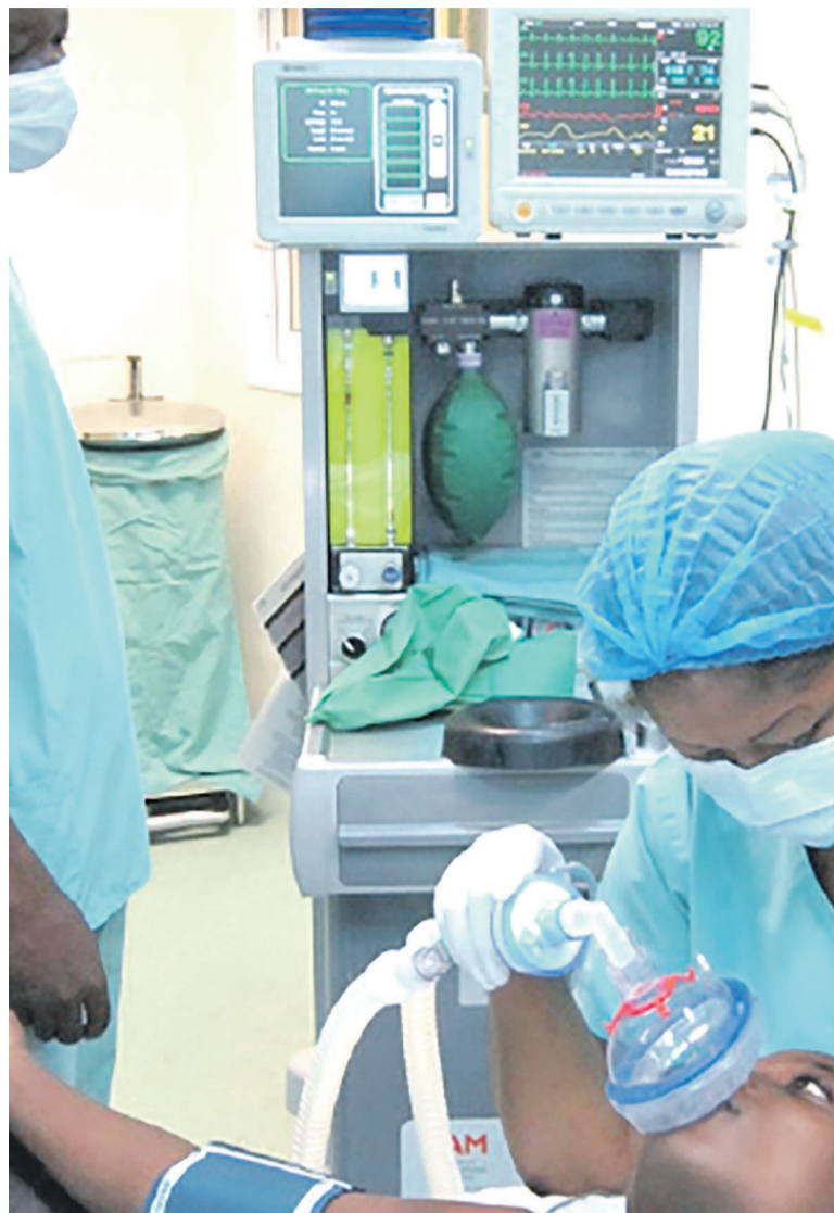
Session pratique en salle d'opération à HBMM

Une équipe de l'ASBL Gradian Health Systems est à l'œuvre depuis le 25 janvier à l'Hôpital Biamba Marie Mutombo (HBMM), en vue d'équiper cette formation médicale de la machine d'anesthésie universelle (MAU) et de former le personnel de cet hôpital- médecins, infirmiers anesthésistes et réanimateurs ainsi que les techniciens- pour la maintenance et l'utilisation de cet équipement. Au deuxième jour, après le côté théorique, l'équipe est passée à une session pratique en salle d'opération où l'on a utilisé la machine pour la première fois avec le personnel de l'hôpital, les utilisateurs, sous la supervision des formateurs de Gradian Health Systems sur « des patients non urgents ». Pour HBMM, l'acquisition de ce matériel, qui est une première en RDC, répond à la vision de la Fondation Mutombo-Dikembe et son chairman, l'ancienne star de la NBA, Jean-Jacques Mutombo Dikembe, de changer la vision des soins de santé en RDC. Elle rentre dans le cadre des actions menées par cette fondation et