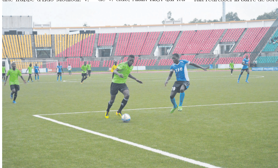
Une contre attaque ayant occasionné le deuxième but de V. Club

ne tarderont plus à commencer les entraînements. Le président du club en a rassuré. C'est peut-être avec ses nouveaux venus que V. Club pourrait redresser la barre de sorte