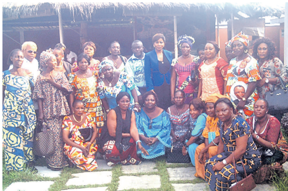
Les femmes du Club 2002 et leurs responsables

Lors des échanges qui ont eu lieu dans une ambiance cordiale et fraternelle,