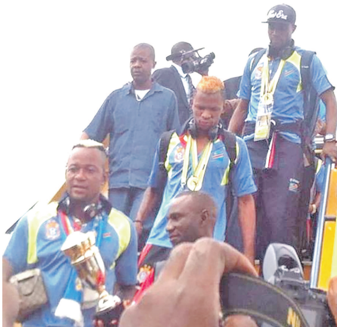
Les Léopards locaux à leur arrivée à Kinshasa avec le trophée du Chan 2016