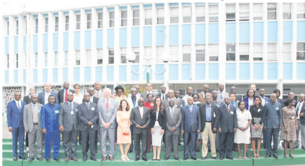
Les participants à l'atelier

En Afrique, le cancer représente un problème de santé publique majeur, du fait du lourd fardeau social et économique qu'il fait porter sur les individus, les ménages, les communautés et les nations. Par contre, les données sur le cancer restent jusque-là parcellaires dans la quasi-totalité des pays africains. Pourtant, ces registres de cancers sont in-