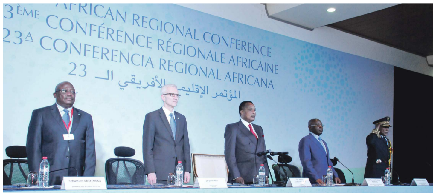
Denis Sassou N'Guesso a présidé l'ouverture de la conférence

Les responsables des polices de trente-cinq pays de la région africaine d'Interpol sont réunis à Brazzaville pour mettre sur pied une réponse régionale à la criminalité organisée.