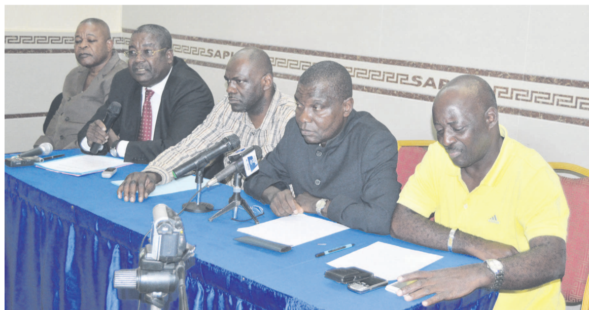
Les conseillers fédéraux ayant déchu le président de la Fédération Firmin Dinga

Pour les 2/3 des conseillers fédéraux, Firmin Dinga est désormais l'ex-président de la Fédération congolaise de basketball (Fécoket). Ils ont tourné sa page. « Dans quelques jours nous convoquerons la deuxième session ordinaire du conseil fédéral pour adopter les Statuts et le Règlement intérieur qui ont connu beaucoup de modifications: le programme d'activités 2016, le budget 2016 etc. » Les propos sont du secrétaire général de la Fédération, extraits de son discours lors de la conférence de presse tenue à Brazzaville par les conseillers signataires d'une mo-