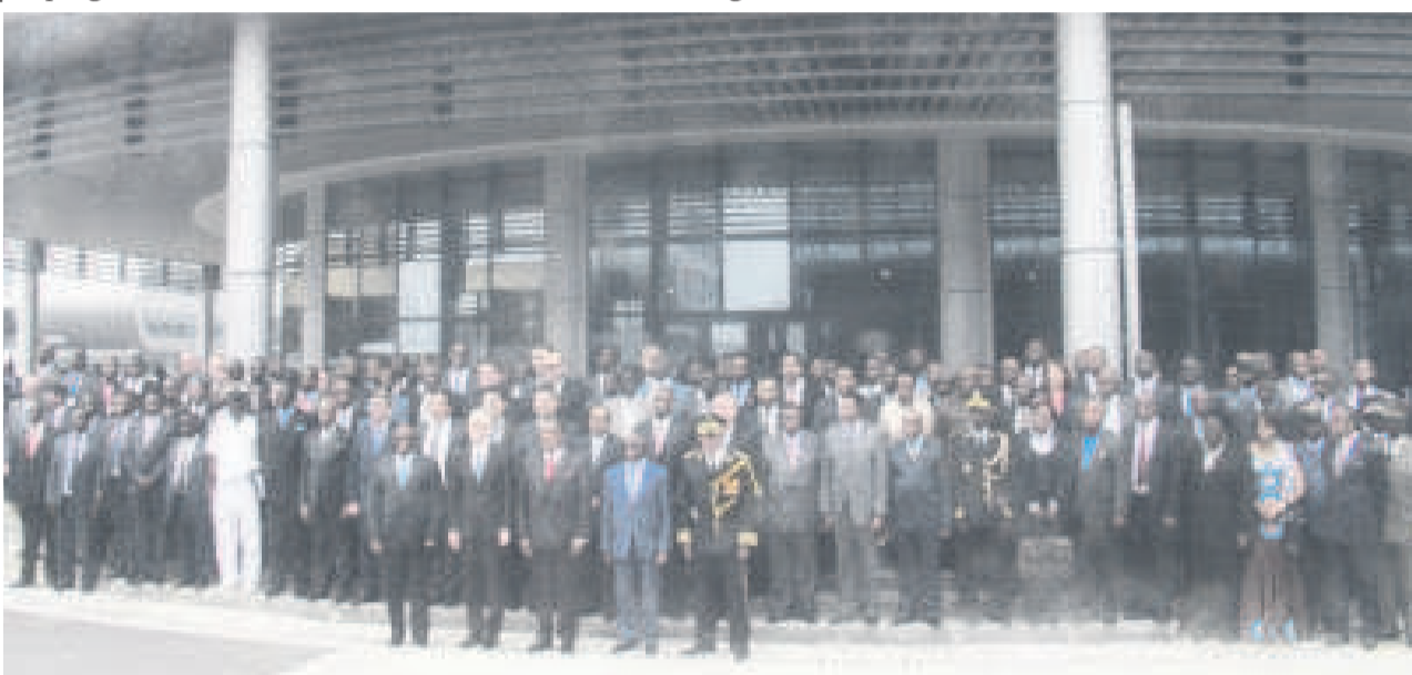
Le chef de l'Etat posant avec les participants ; crédit photo Adiac

Le directeur général de la police congolaise a, par ailleurs, indiqué que les enjeux sécuritaires avaient un caractère mondial indéniable, d'autant plus que des terroristes et délinquants organisés en cartel, profitaient de la porosité des frontières pour agir désormais au-delà de toute limite. Présidant la cérémonie d'ouverture, le président de la République du Congo a rappelé que les assises de Brazzaville avaient pour but de renforcer la coopération entre les pays membres, notamment dans le sens de l'application de la loi. « Au-delà du thème de la conférence, l'occasion vous est offerte d'échanger toutes idées utiles à la vie d'Interpol, de les mettre au point, d'en tirer des conclusions pratiques susceptibles d'inspirer la mise en œuvre d'un schéma général d'actions concertées et d'une chaîne opérationnelle transnationale pour combattre efficacement toutes les formes de criminalité », a souhaité