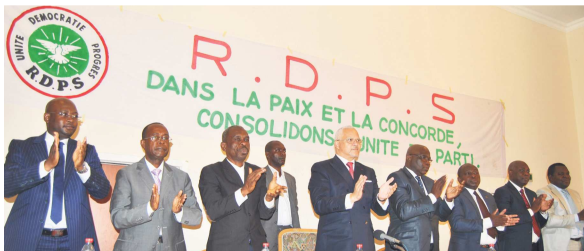
Les dirigeants nationaux du RDPS

Après le MCDDI, le RC, l'UFD, le MAR et bien d'autres partis parmi les principaux de la Majorité présidentielle, le RDPS a, dans une déclaration adoptée à l'issue d'une réunion extraordinaire de son comité national, décidé de ne pas présenter de candidat à la prochaine élection présidentielle.