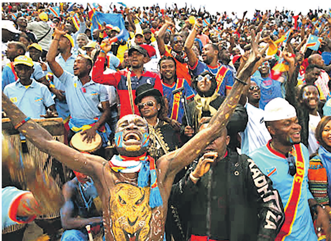
Des supporters congolais au stade Amahoro du Rwanda