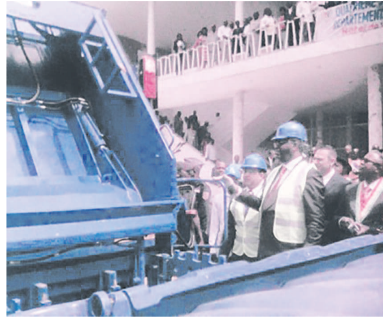
Le maire lance officiellement les activités de la société Averda

à Brazzaville, d'après le contrat signé entre la société et le gouvernement congolais ainsi que la municipalité de Brazzaville au moment des préparatifs des 11 es Jeux africains de Brazzaville de 2015.