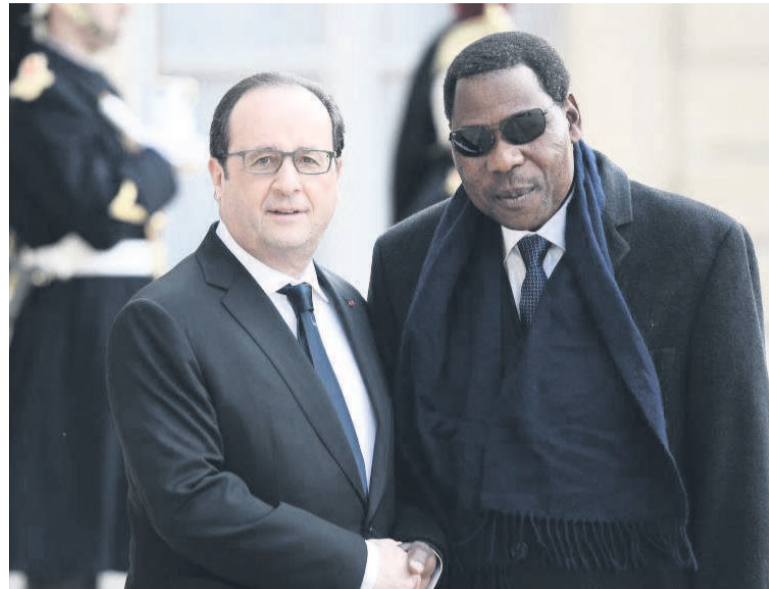
François Hollande et Thomas Yayi Boni

Puis les deux chefs d'Etat ont appelé à la fin des violences au Burundi et demandé à leur homologue burundais, Pierre Nkurunziza « à accepter de dialoguer avec ses opposants sans condition préalable ». L'Union africaine vient de désigner 5 chefs d'Etat, le sud-africain Jacob Zuma, le mauritanien Mohamed Ould Ab-