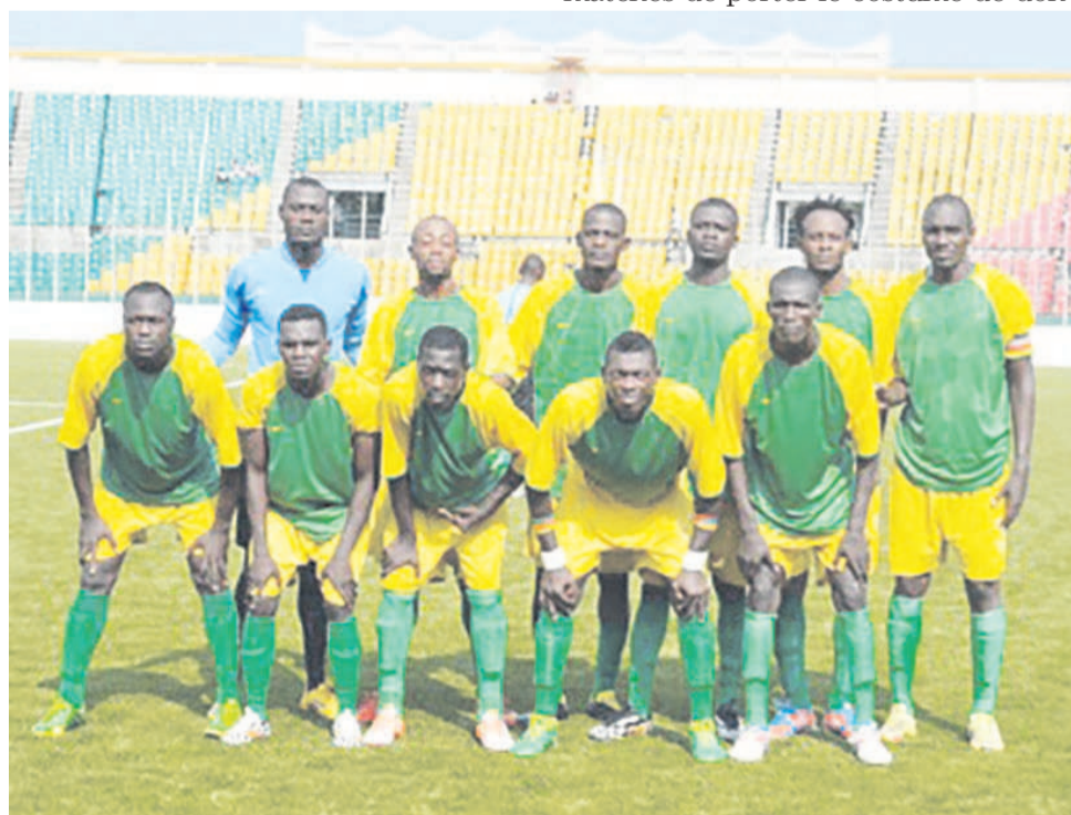
Pigeon vert de Pointe-Noire n'y arrive toujours pas

Le but de Cara a été inscrit en seconde période par Kennedy Chadly. Les Aiglons remontent à la deuxième place avec 20 points soit deux unités de retard que les Diables noirs. Pigeon vert reste la lanterne rouge du championnat avec un petit point acquis face aux Jeunes Fauves lors de la première journée. Depuis lors, l'équipe n'y arrive plus. Elle a concédé sept défaites d'affilée. Non seulement Pigeon vert reste la mauvaise défense avec 18 buts encaissés, pis encore, cette équipe n'a inscrit qu'un seul but depuis le début de la compétition. D'où cette interrogation sur son véritable niveau. Comment cette équipe a pu atterrir à l'élite. Visiblement, cette équipe n'était pas prête à accéder à l'élite. La Fédération congolaise de football s'était pliée à volonté des dirigeants de Pointe-Noire. Ces derniers refusaient un match de barrage qui devrait opposer Pigeon vert au TP Mystère, démontrant ainsi à la Fécofoot que cette place revenait de droit à une équipe de Pointe-Noire après le retrait, à la dernière minute, du FC Bilombé. Mais sur le terrain,