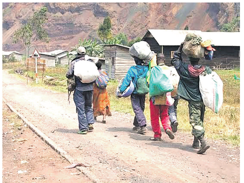
Le village de Mukeberwa déserté par ses habitants fuyant les combats