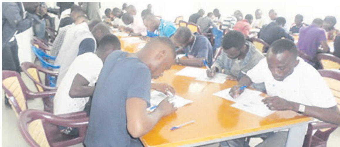
Une vue des candidats à l'occasion d'une séance écrite

Outre ces 157 apprenants, 3000 jeunes congolais inscrits à ces formations sont sur le point d'être affectés dans différentes auto-écoles de Brazzaville. « Les 157 candidats qui se sont présentés ce matin sont ceux qui ont terminé la formation en conduite automobile auprès des auto-écoles. Nous avons placé pour la première et la