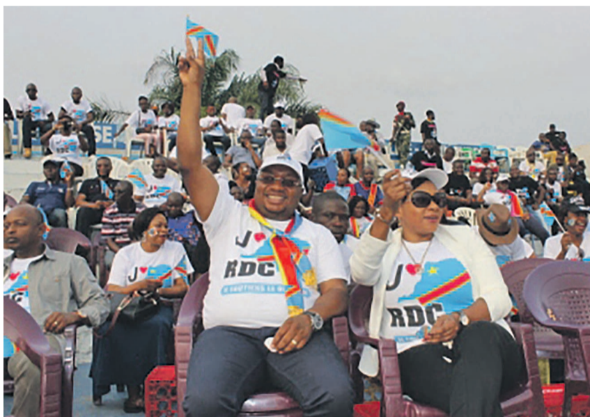
Le ministre de la Santé à l'Ymca Le public venu suivre le match à l'Ymca

Nous devons nous faire dépister, dit-il, pour savoir notre statut sérologique. Il faut, ajoute-t-il, vous protéger contre le sida. Il y a des moyens pour se protéger. Il faut l'abstinence, le préservatif et la bonne fidélité.