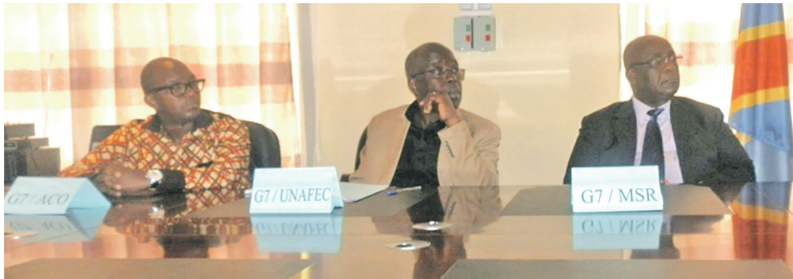
Les représentants du MSR, l'Unafec et ACO lors d'une rencontre du G7

L'Acaj a, en effet, rappelé sa lettre no 002/ACA/J/PN/GK/2016 du 8 février 2016 dont les copies ont été réservées notamment au président de la République, président de l'Assemblée nationale, président du Sénat, Premier ministre, ministre de la Justice et Droits humains et procureur général de la République, dans laquelle cette organisation a exprimé au vice-Premier ministre Évariste Boshab, sa profonde