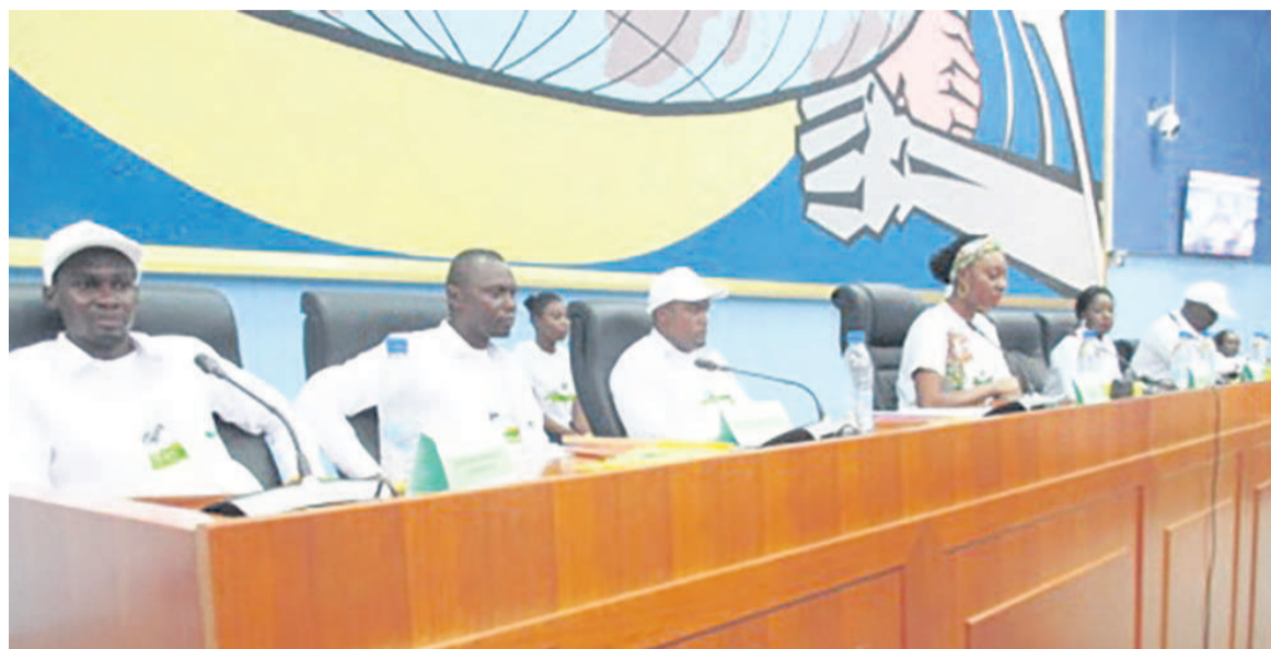
Une vue du bureau de l'association