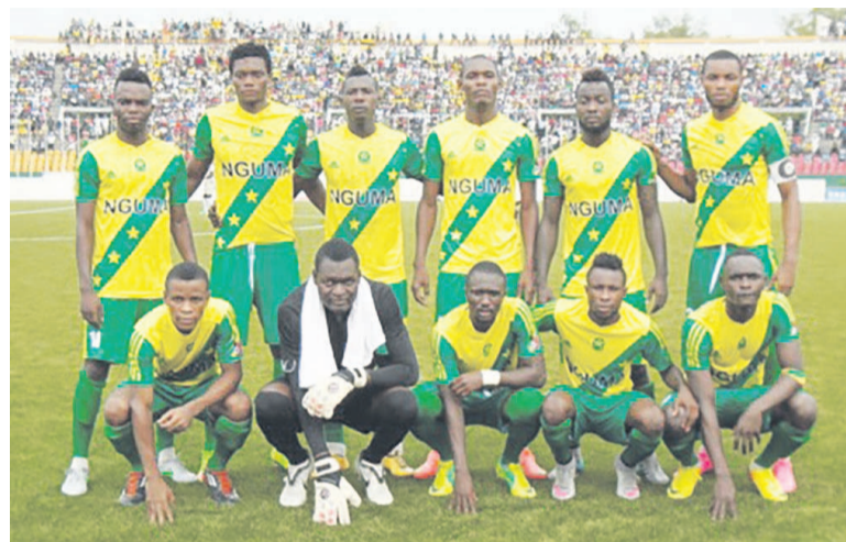
L'équipe de l'Etoile du Congo

Les rencontres de la 8 e journée ont permis de se faire, sans nul doute, une idée du travail accompli et ce qui reste à faire. Le