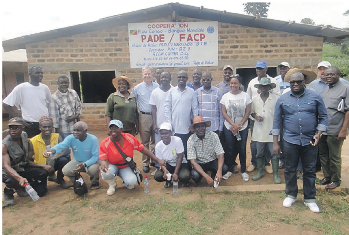
Photo de famille après la visite