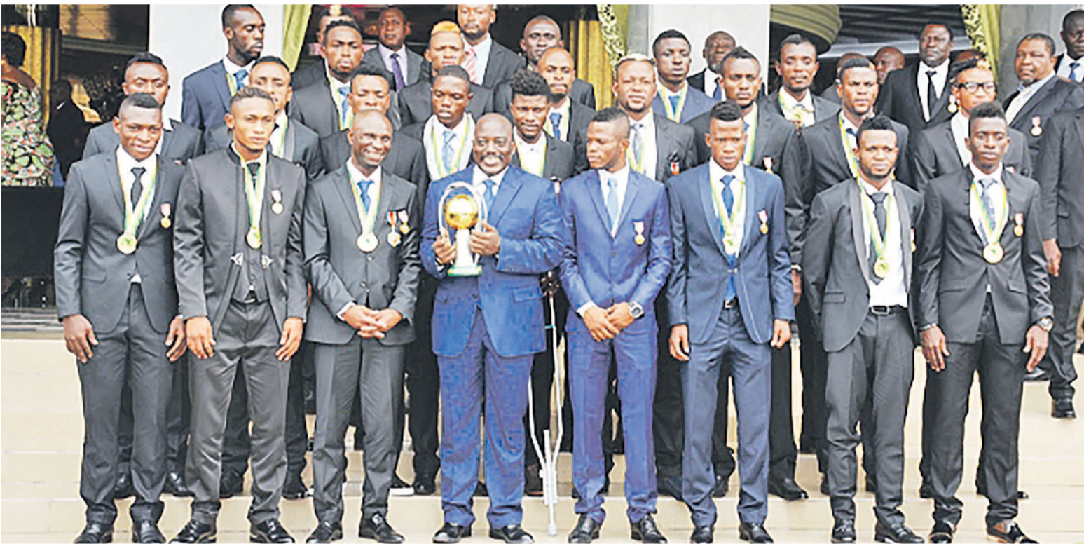
Joseph Kabila posant avec les Léopards

Reçus mardi au Palais de la Nation à Kinshasa par le président Joseph Kabila, les Léopards de la RDC ont chacun reçu une Jeep Prado, en guise de récompense pour leur prestation de facture au Rwanda, couronnée par un deuxième trophée au Championnat d'Afrique des nations réservé aux sélections nationales composées des joueurs évoluant dans leurs championnats nationaux respectifs.