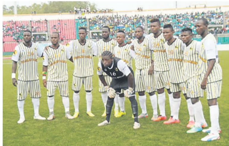
L'équipe des Diables noirs

Ils ont emporté à sept reprises et n'ont concédé qu'un match nul. Du point de vue des résultats, on peut déduire que l'équipe