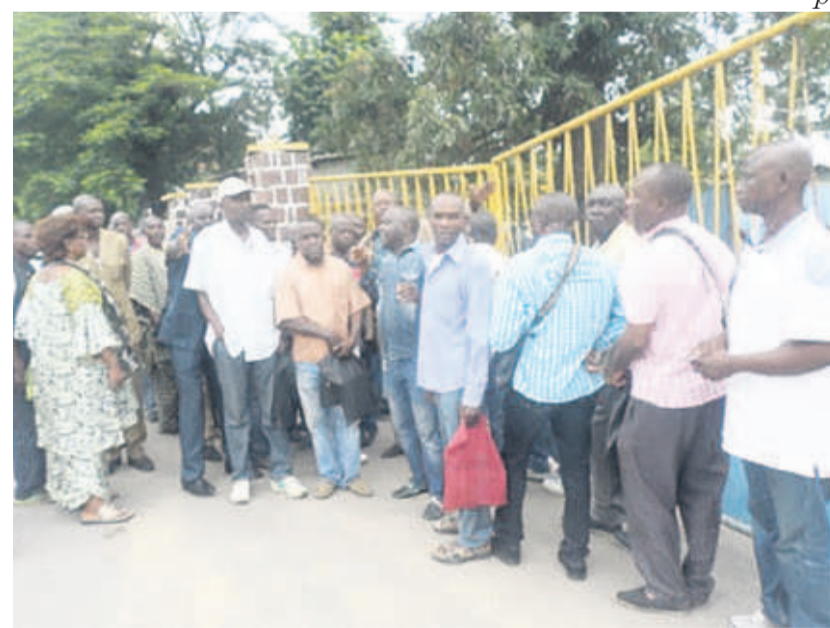
Les ex-agents du Cntf bloqués devant le portail

jusqu'au paiement de leurs droits, conformément aux textes de licenciement.