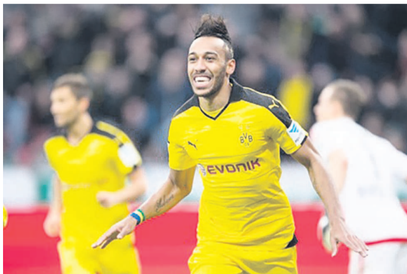
Le Gabonais Pierre-Emerick Aubameyang offre une courte mais précieuse victoire au Borussia Dortmund sur le terrain de Leverkusen

Pierre-Emerick Aubameyang a inscrit son 21 e but de la saison pour permettre à Dortmund de gagner (1-0) à Leverkusen, dimanche, au terme d'un choc marqué par une interruption de jeu historique en Bundesliga. En effet, le match a été interrompu une dizaine de minutes par l'arbitre après un échange virulent avec le coach de Leverkusen Roger Schmidt, qui estimait que le coup franc à l'origine du but d'Aubameyang (64 e ) avait été trop rapidement joué. L'officiel et ses assistants sont rentrés aux vestiaires et ne sont retournés sur la pelouse que neuf minutes plus tard, le temps pour Schmidt d'accepter son renvoi dans les tribunes. Avec 51 points, Dortmund (2 e ) revient à huit longueurs du leader, le Bayern Munich, vainqueur la veille de Darmstadt (3-1), après la 22 e journée. Notons la prestation remarquable de Thomas Müller, auteur d'un doublé, et le but du Polonais Lewandowski, qui reste ainsi en tête du classement des buteurs avec 22 unités. Mais le fait marquant est l'entrée en jeu de Franck Ribery, qui n'avait plus foulé la pelouse de l'Allianz Arena depuis près d'un an : trente-cinq minutes de jeu et une passe décisive ponctuée la bonne soirée de l'ancien international