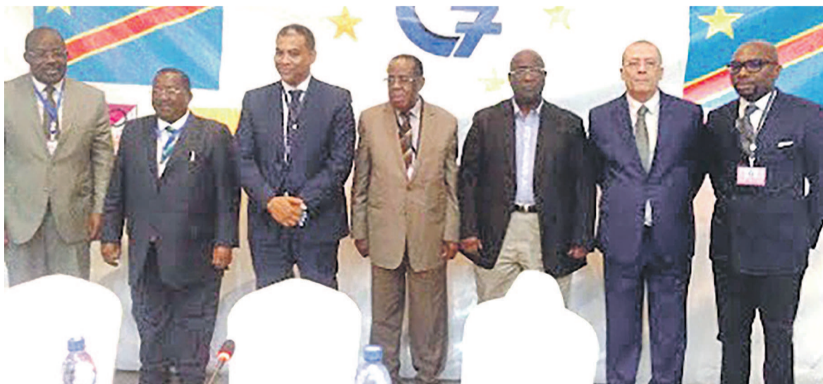
Les leaders du G7

La plate-forme des sept partis politiques exclus de la majorité présidentielle en septembre 2015 estime qu'un tel forum sera différent du dialogue prôné par le chef de l'État qui s'apparente, selon elle, à « une institution de légitimation » des objectifs et stratégies politiques de ceux qui