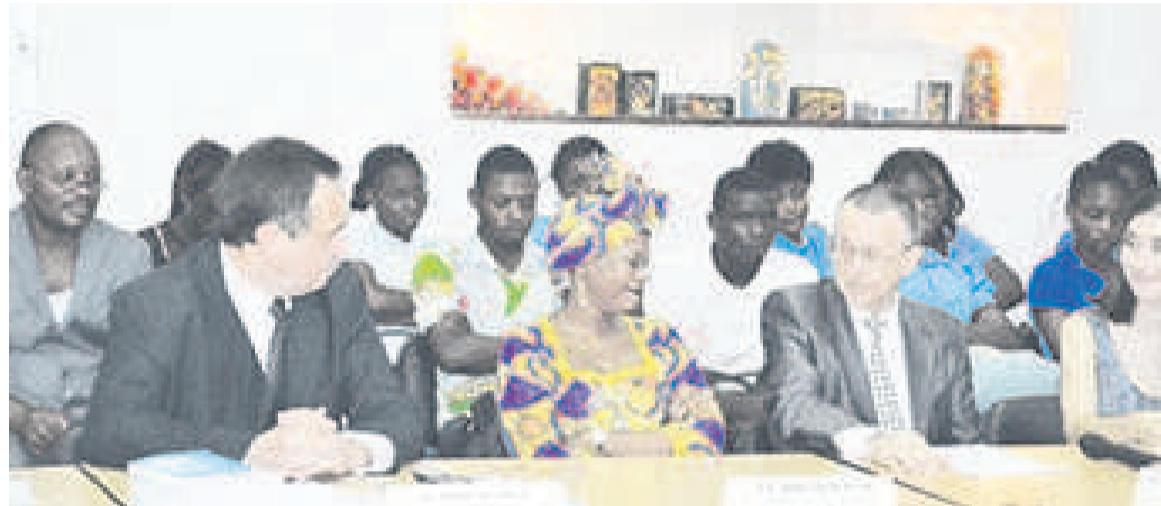
Le directeur du Centre culturel russe, la conseillère du chef de l'Etat congolais, l'ambassadeur de la Fédération de Russie en République du Congo

l'Enseignement supérieur, avec la formation des étudiants congolais dans les universités russes. Ces bourses sont octroyées soit par le ministère de l'Education et de la science de Russie