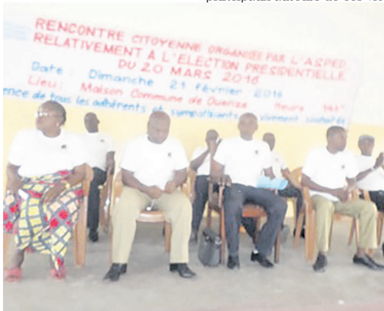
Les membres de l'Asped lors de la cérémonie