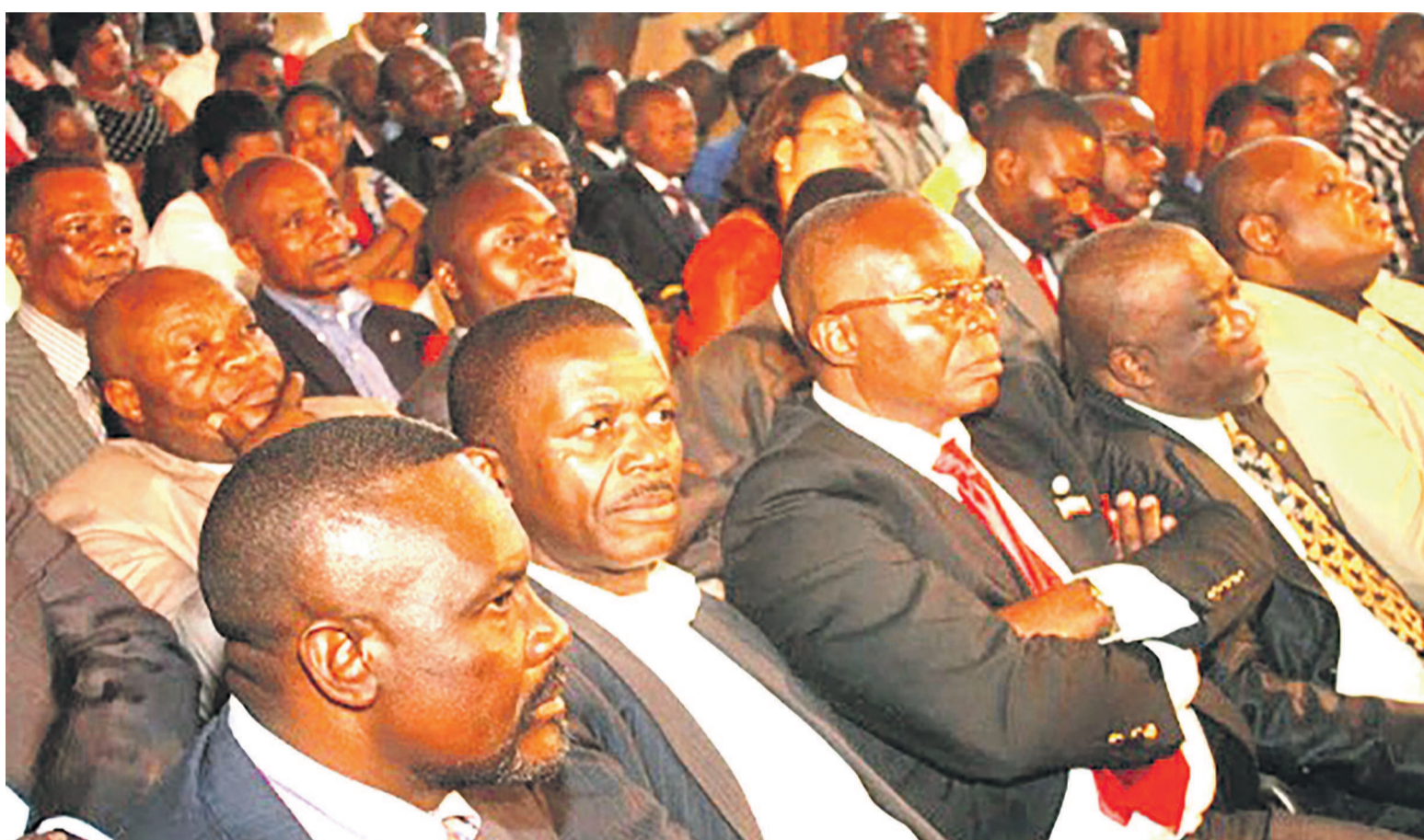
Quelques acteurs politiques congolais

Le passage à Kinshasa de Ban Ki-moon n'aura pas influé sur la donne politique qui est demeurée inchangée alors que les retards accumulés par rapport au processus électoral continuent d'alimenter une tension politique qui va crescendo avec, à la clé, un calendrier électoral réaménagé qui se fait toujours désirer. Au niveau des acteurs politiques, force est de constater que les lignes n'ont pas véritablement bougé dans le sens d'une réelle introspection censée faire taire les divergences. Les membres de la majorité et de l'opposition continuent, en effet, à camper dans leur position en rapport avec le dialogue politique que le secrétaire général de l'ONU appelle de tous ses vœux. La société civile, quant à elle, a eu la justesse de déposer un mémorandum au secrétaire général de l'ONU dans lequel elle affirme son attachement au consensus autour du processus électoral.