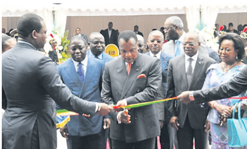
Le chef de l'État coupant le ruban symbolique

Le nouvel immeuble de huit étages et un sous-sol, situé au rond-point La coupole, a été inauguré le 25 février, par le président de République, Denis Sassou N'Guesso. Le coût d'exécution des travaux réalisés en deux ans est de 13 milliards FCFA.