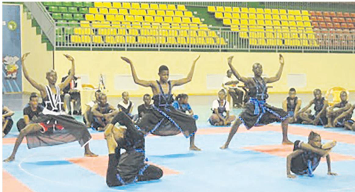
Les athlètes en démonstration