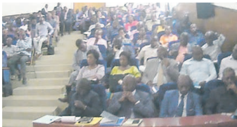
Les participants à la session

Au cours de cette session, les participants suivront plusieurs thèmes liés à la préparation et la tenue d'une élection. Il sera question de parler entre autres sur le rôle du délégué national de la CNEI et les compétences des Commissions locales d'organisation des élections, le suivi du déroulement de la campagne électorale, l'observatoire électorale, le fonctionnement du bureau de vote, la méthodologie de la distribution des cartes d'électeurs et l'utilisation du bulletin unique.