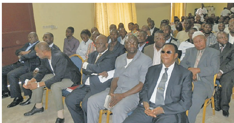
Des membres du Front du peuple.

Le Front du peuple a également émis certaines observations, après analyse du communiqué conjoint signé par l'Union africaine, les Nations unies, l'Union européenne et l'Organisation internationale de la francophonie, dans lequel les quatre institutions internationales soulignent la nécessité d'un dialogue politique inclusif en RDC et leur engagement à appuyer les acteurs congolais en vue de la consolidation de la démocratie dans le pays. Les alliés d'Étienne Tshisekedi reprochent,