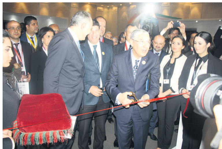
Coupure du ruban symbolique de l'inauguration du Marche de l'investissement par le Pdg d'Attijariwafa bank