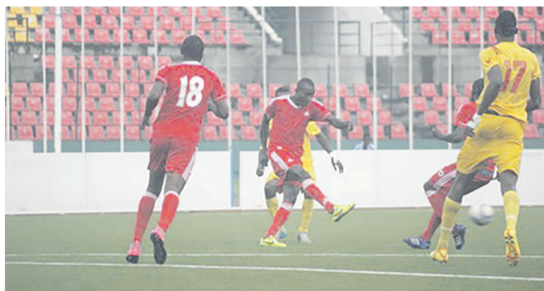
Après le 3 e but, l'heure était venue à la résistance dans le camp de SMO

Saint-Michel de Ouenzé (SMO) n'avait plus gagné en championnat depuis sa victoire 2-0 face à Pigeon vert lors de la 4e journée. Le 24 février au stade Alphonse-Massamba-Débat, face à l'Interclub en match comptant pour la 12e journée, ses joueurs ont revêtu le même bonheur.