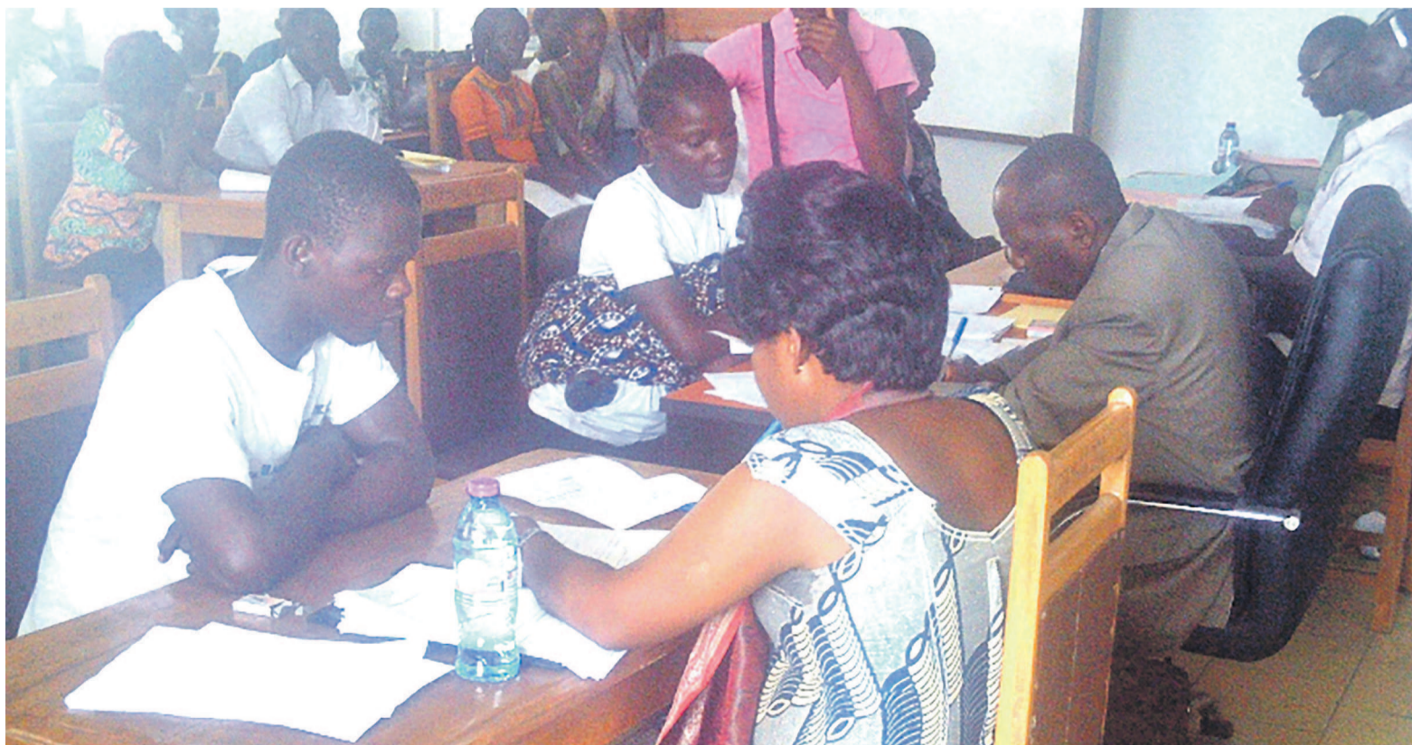
Une vue des jeunes lors de la collecte des candidatures