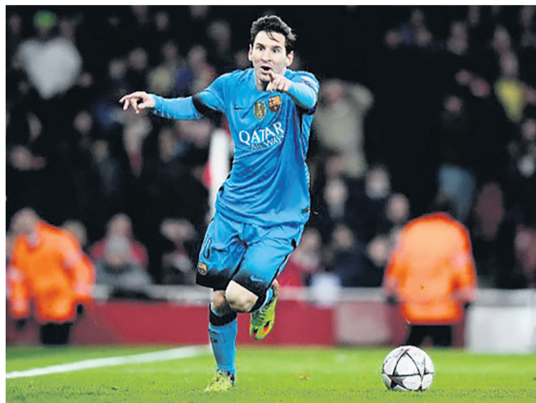
Avec son doublé, Leo Messi sort Barcelone du piège sur la pelouse d'Arsenal

Barcelonais ont pris la possession du ballon, et enfin un bloc regroupé devant sa surface quand la menace s'est précisée. Cela a bien fonctionné en première période, où Barcelone n'a pas cadré un seul tir -une première depuis