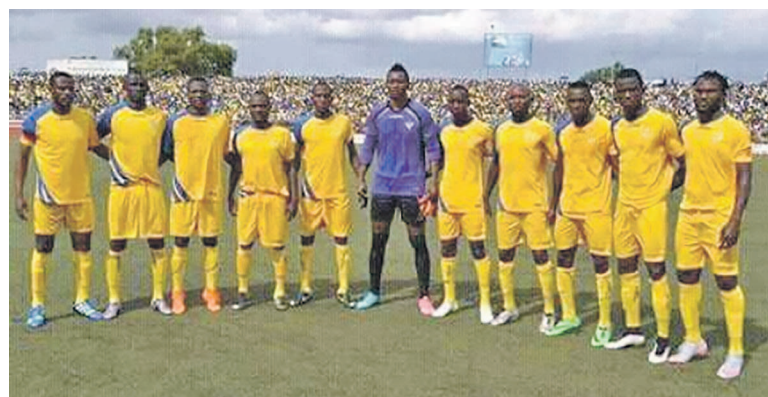
Le FC Saint-Éloi Lupopo avant son match retour contre Bandari du Kenya

Le FC Saint-Éloi Lupopo de Lubumbashi a obtenu, le 28 février, à Nairobi son sauf-conduit pour les seizièmes de finale de la Coupe de la Confédération édition 2016.