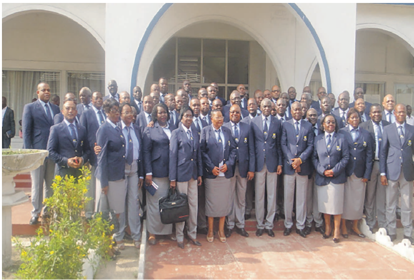
Photo de famille des élus locaux de Pointe-Noire