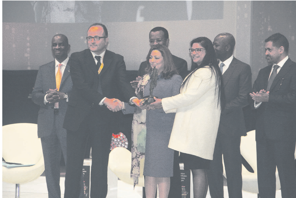
Photos de famille des lauréats des Trophées de la coopération

revenu, doit, pour se faire mettre en œuvre de nouveaux moyens en vue de développer la consommation d'énergie à des coûts compatibles avec le niveau de vie des populations. En effet, doté d'un potentiel considérable pourvu en ma-