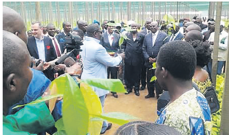
Distribution des plants

Quand les statistiques parlent... Environ 300.000 plants ont été distribués en juin 2014. L'agenda prévoit, d'ici au mois de juin prochain, un million de plants à transporter « auprès des planteurs préinscrits, ayant préalablement préparé leurs champs, pour y être plantés selon les recommandations techniques en vigueur ». Selon les chiffres rendus publics, ce jour-là à Pokola, devant