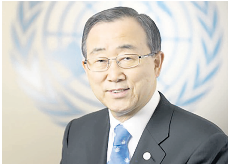
Le secrétaire général sortant, Ban Ki-moon

Outre le profil de chaque candidat, les électeurs onusiens seront donc sensibles à la vision et le programme de chacun. Par exemple, l'une des grandes initiatives du Secrétaire général de l'ONU, en fin de mandat, a été l'organisation du Sommet de 2007 sur les changements climatiques, suivie par d'intenses efforts diplomatiques qui ont contribué à faire de cette question une priorité mondiale. L'accord historique obtenu à l'issue de la Cop21 est, sans doute, le couronnement de cet engagement. Ses actions en matière de lutte contre la pauvreté dans le monde, ont amené le G-20