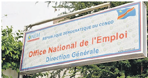
L'enseigne de l'ONEM à Kinshasa