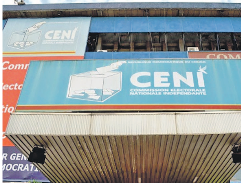
Siège de la Céni

troducts, les incriminés estiment que la Céni n'a pas le droit de les invalider aussi longtemps qu'ils ont rempli les conditions reprises dans la loi électorale précisément en son article 22