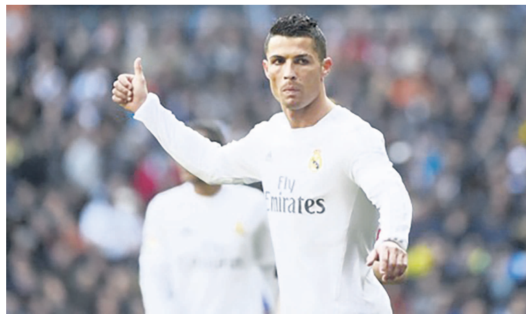
Les déclarations de CR7 font jaser, mais le constat est là: le Real Madrid ne sera pas champion d'Espagne

Censé avoir retrouvé la sérénité depuis l'arrivée de Zidane sur le banc du Real, après plusieurs mois de tensions avec Benitez, le Portugais ne s'est pas arrêté là : « Pour gagner une compétition importante et longue comme la Liga, et je ne veux pas mépriser les autres joueurs parce que je pense que tous ceux du Real sont bons, c'est compliqué si tu n'as pas les meilleurs. Il nous manque Karim (Benzema), Bae (Gareth) et c'est difficile. Je ne dis pas que tous ceux qui ont joué (samedi) ne sont pas aussi bons qu'eux, mais on a besoin des meilleurs dans chaque