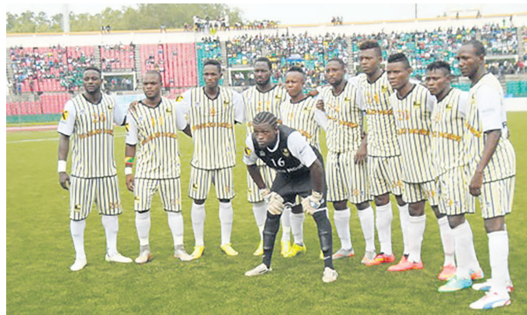
L'équipe des Diabls Noirs

Les Diablotins, battus à domicile 1-2 par Africa sport, se sont inclinés le 27 février à Abidjan sur ce score identique alors que sur l'ensemble des deux matches, les Brazzavillois ont été dominateurs. Les Diablotins ont payé le prix des actions qu'ils ont gâchées à Brazzaville comme à Abidjan.