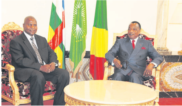
Le président Denis Sassou N'Guesso et son homologue centrafricain

Après une chaude et fraternelle accolade sur le tarmac de l'aéroport international Maya-Maya de Brazzaville, les deux hommes se sont retirés pour un tête-à-tête d'au moins deux heures. Même s'il s'est prêté aux questions de la presse pour dévoiler le contenu de l'entretien, l'on connaît néanmoins le degré d'implication de la République du Congo dans la résolution de la crise centrafricaine. Elu à l'issue du second tour de la présidentielle du 14 février dernier après une longue et difficile transition politique, Faustin Archange Touadera est venu à Brazzaville, sans doute, pour remercier le chef d'Etat