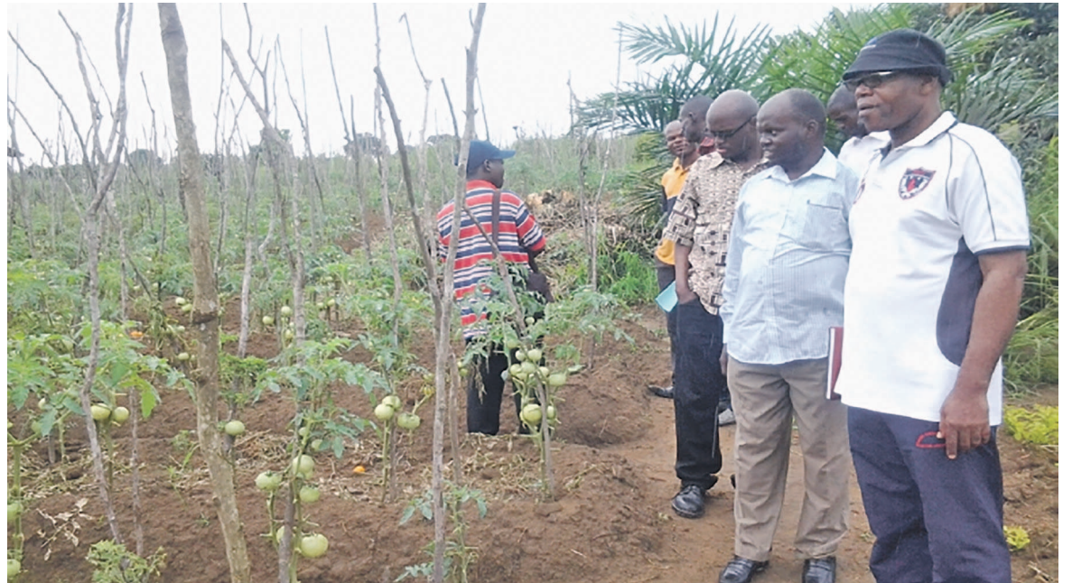
La délégation visitant un champ de tomate à Boko

« Notre projet avait une certaine limite en matière de budget, de capacité d'appui des forma-