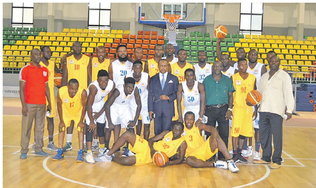
Le président de la Ligue au centre avec les basketteurs

Les joueurs de la balle au panier de la ville capitale ont annoncé leur retour sur scène à travers des rencontres dédiées à la journée de la ligue.