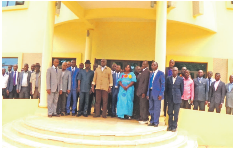
Photo de famille des participants à la 2 ème conférence de la statistique

Cette conférence vise le renforcement des capacités des cadres de la statistique dans la production régulière des données fiables. Tenue deux ans après la première conférence organisée à Owando du 18 au 20 décembre 2013 cette deuxième conférence a inscrit dans son agenda un chapelet d'activités. Il s'agit entre autres, de l'évaluation du niveau d'exécution des recommandations des premières assises, des échanges autour des activités de chaque direction départementale avec intérêt particulier sur les difficultés rencontrées et les solutions envi-