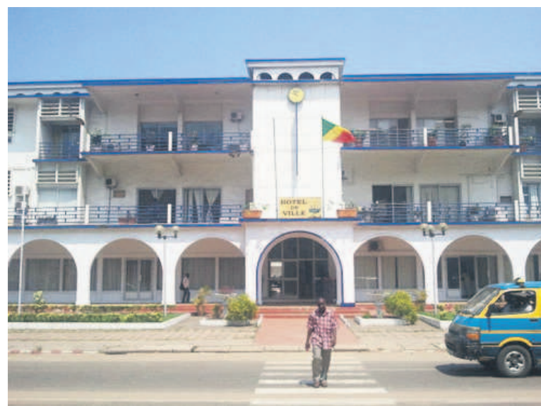
Mairie centrale de Pointe-Noire

Cette situation déplorable met tout le monde mal à l'aise. Et pour remédier à cette situation, le Conseil départemental et municipal de la ville océane, a au cours de sa session ordinaire, dite budgétaire, adopté un programme d'investissement à la hauteur des défis à relever, notamment à la construction de la quasi-totalité du réseau routier. Le conseil départemental et municipal de Pointe-Noire a également fait part d'une donation en matériels de voiries, parmi lesquels une centrale d'enrobage de grande capacité, de la part du président de la République, ceci afin de soulager