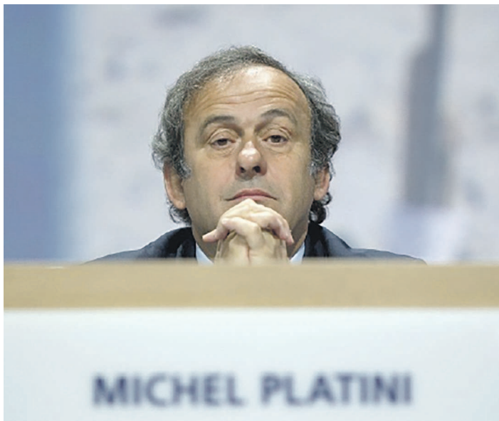
Suspendu pour 6 ans de toute activité dans le football par la Fifa, le Français Michel Platini fait appel de sa sanction devant le TAS

l'annulation des décisions prises à la fois par «la chambre de jugement de la Commission d'éthique de la FIFA et par la Commission de recours de la FIFA le suspendant de toute activité liée au football au niveau