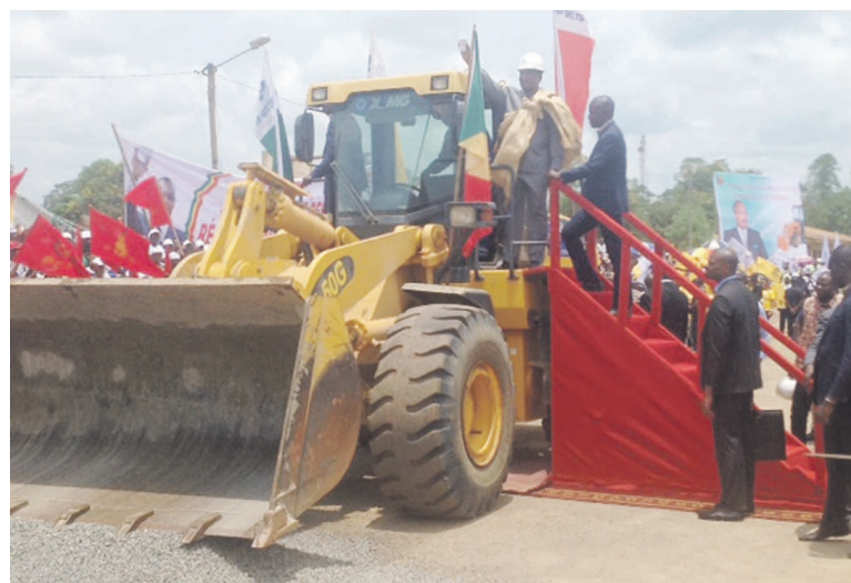
Le chef de l'Etat après le coup d'envoi des travaux

Le président de la République, Denis Sassou N'Guesso, a lancé mardi à Madingou, chef-lieu de la Bouenza, les travaux de la municipalisation accélérée de ce département, le dernier à vivre cette expérience mise en œuvre depuis 2004.