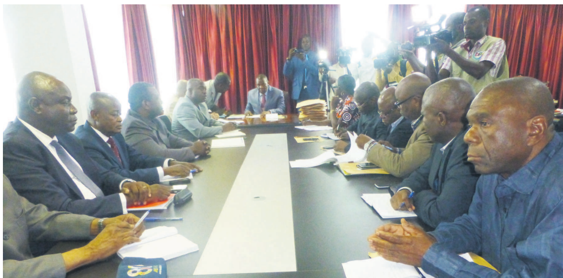
Une vue des participants à la séance de travail

Les représentants des candidats de l'Initiative pour la démocratie au Congo et du Front républicain pour le respect de l'ordre constitutionnel et l'alternance démocratique ont interpellé hier la Commission nationale électorale indépendante (CNEI) sur les dysfonctionnements qu'ils disent