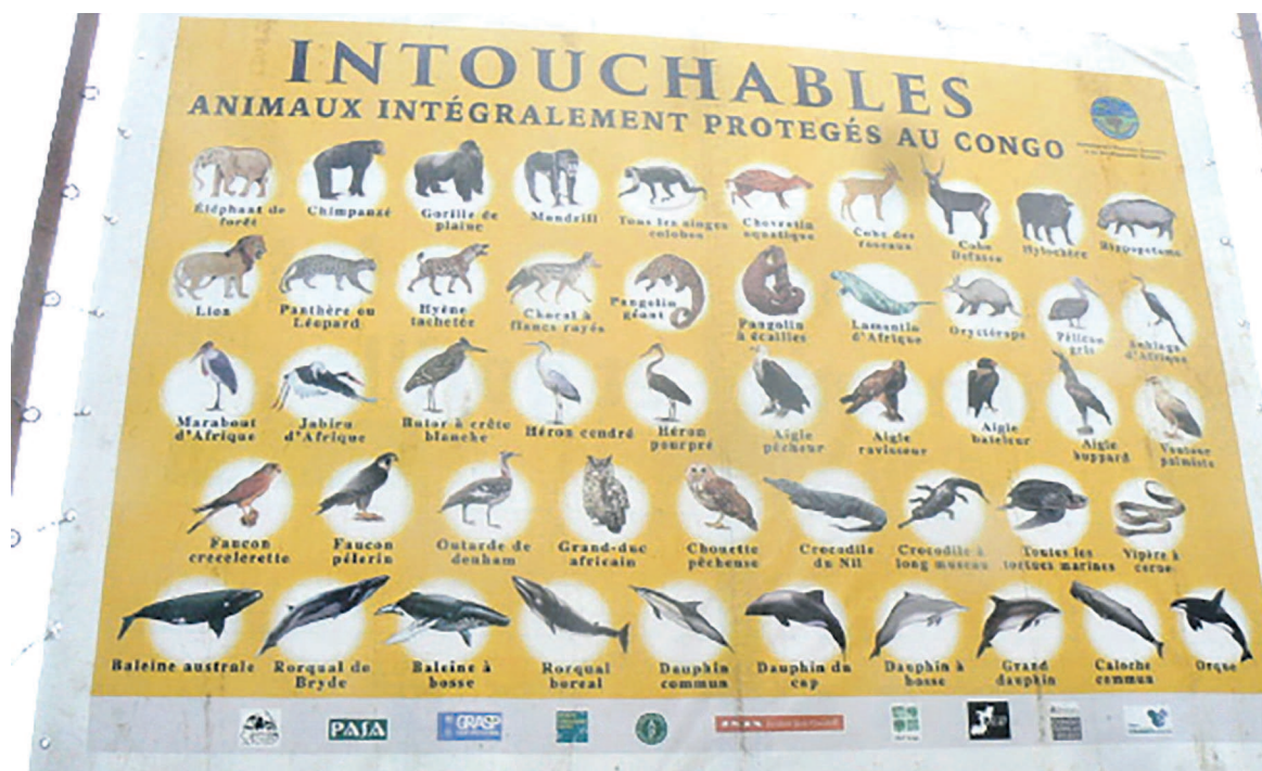
Les organisations mènent au Congo une grande sensibilisation des communautés pour la protection de la faune (adiac)

Tous les États signataires de la Convention sur le commerce international des espèces de faune et de flore sauvages menacées d'extinction (Cites), les organismes des Nations Unies, les autres organisations mondiales, ainsi que la société civile, les organisations non gouvernementales et les particuliers sont invités à festoyer et à s'associer à cette fête mondiale de la vie sauvage. Les communautés locales peuvent jouer un rôle positif en aidant à réduire le commerce illégal des