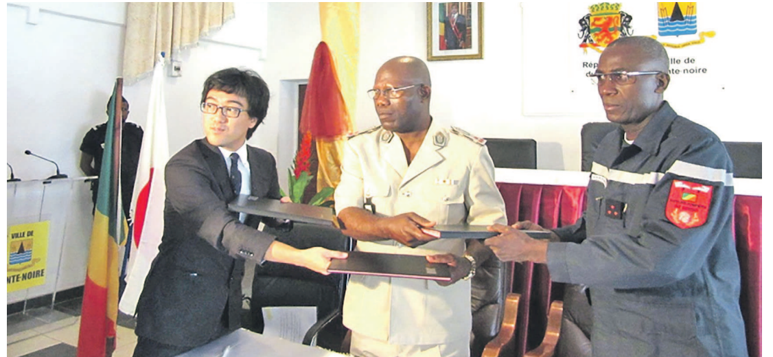
Échange de parapheurs entre deux parties

Le représentant de l'ambassade du Japon au Congo, Kazuya Takahashi a signé, le 26 février, à Pointe-Noire un contrat de don pour la mise à la disposition de véhicules anti-incendie et d'ambulance, ainsi que le financement d'une formation pour les sapeurs-pompiers dans cette ville.