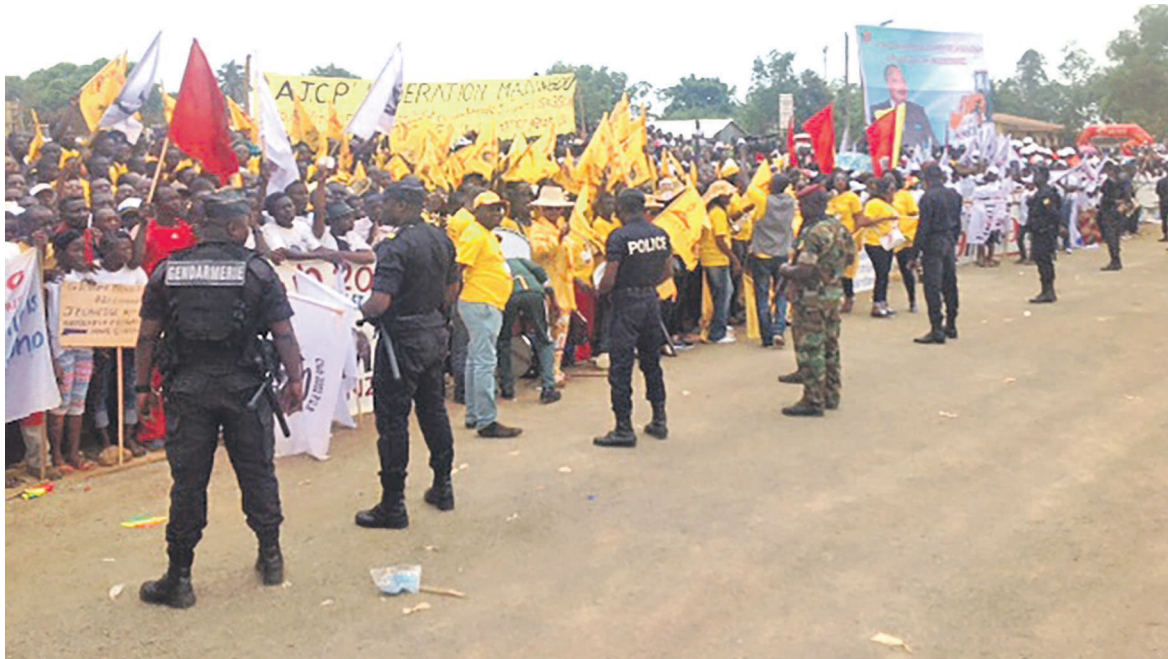
Une vue de la population lors de la cérémonie de lancement officiel des travaux de la municipalisation de la Bouenza

À titre de rappel, le président Denis Sassou N'Gusso a entamé sa tournée de travail le 1er mars par l'inauguration à Yié, dans le Pool, de la route nationale numéro 1 Brazzaville/Pointe-Noire. Longue de 535 kilomètres, sa construction s'est achevée après neuf ans