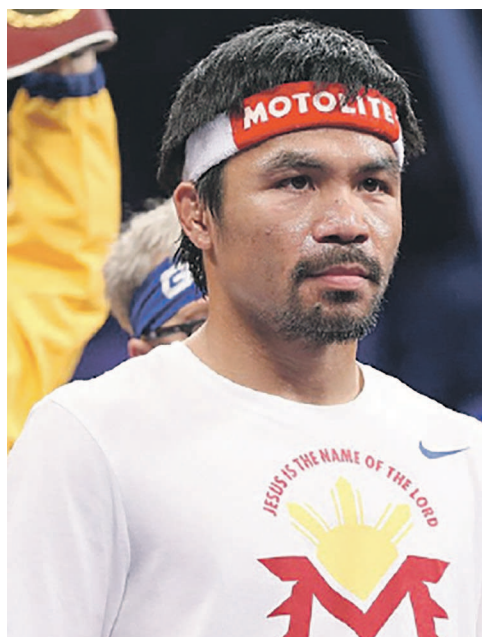
Le Philippin Manny Pacquiao a annoncé vouloir disputer les Jeux Olympiques 2016 (droits réservés)

Le boxeur philippin Manny Pacquiao a déclaré mercredi que ce serait un honneur de combattre pour son pays aux Jeux olympiques de Rio (5-21 août), qui pourraient être ouverts aux boxeurs professionnels, et non seulement aux amateurs.