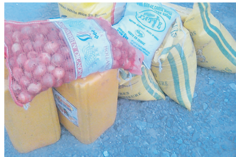
Un échantillon de vivres