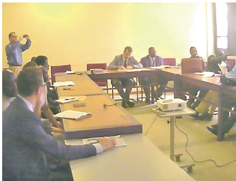
Une vue des participants à cette rencontre

A propos du renforcement des capacités, il s'agira d'apporter aux organisations de base, les moyens financiers nécessaires à la mise en œuvre de leurs actions quant au monitoring ou assistance judiciaire. Dans cette optique, neuf associations locales bénéficieront de subventions via le dispositif de soutien à des tiers qui faciliteront la poursuite de leurs activités. Le