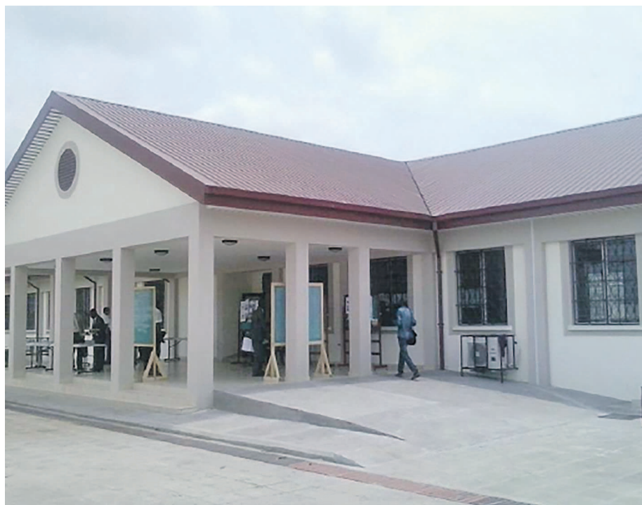
La façade du nouveau bâtiment

Pour le premier conseiller dans le Pieu de la communauté de Makélékélé, Jean-Cyr Mayala, l'immeuble bien que construit pour abriter les paroisses de Bacongo et Makélékélé, le projet a été conçu pour servir la population de cette partie de la capitale. Avec une dimension de 1600m 2 ,