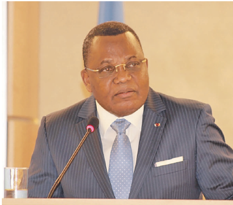
Jean-Claude Gakosso à la tribune de la 31 ème session du Conseil des droits de l'homme de l'ONU

« En République du Congo, la politique du gouvernement vise très clairement l'amélioration du cadre juridique et institutionnel en l'adaptant aux exigences du temps, en veillant au renforcement des capacités des organes chargés de la gestion, de la promotion et de la protection des droits de l'Homme, en y intégrant les dispositions des instruments régionaux et internationaux auxquels le Congo est lié », a signifié le ministre des Affaires étrangères et de la coopération. Et d'appuyer plus loin : « La Constitution congolaise garantit à chaque citoyen tous