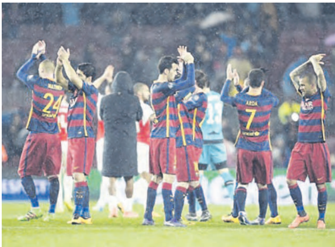
Emmenés par un grand Luis Suarez, le Barça se qualifie sans forcer face à Arsenal

s'est chargé d'éteindre les dernières flammèches adverses avec une claquette sur un coup franc d'Alexis Sanchez (80 e ).