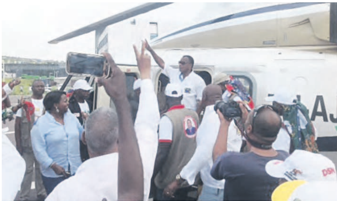
Le candidat Denis Sassou N'Gusso à son arrivée à Kintélé