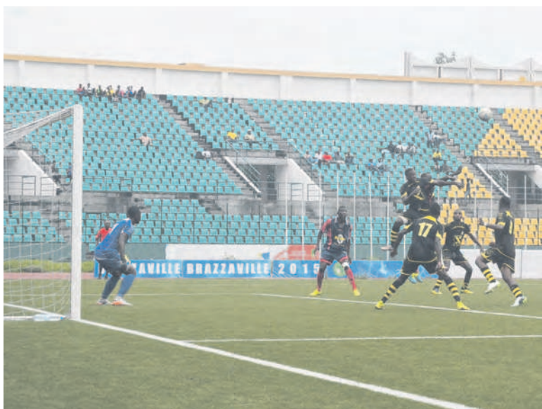
Une vue de la rencontre entre Diabes rouges et FC Kondzo

Les diabolins ont infligé à leur adversaire de la 15 ème journée une lourde défaite de 5-0.