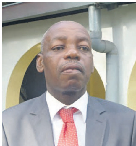
Pierre Siméon Athomo Ndong

Pierre Siméon Athomo Ndong : La mission de la CEEAC se félicite de ce que les partenaires majeurs qui accompagnent ce processus électoral en matière de paix, de sécurité et de gouvernance soient présents à Brazzaville pour soutenir le peuple congolais dans cette échéance capitale de la vie politique de son pays.