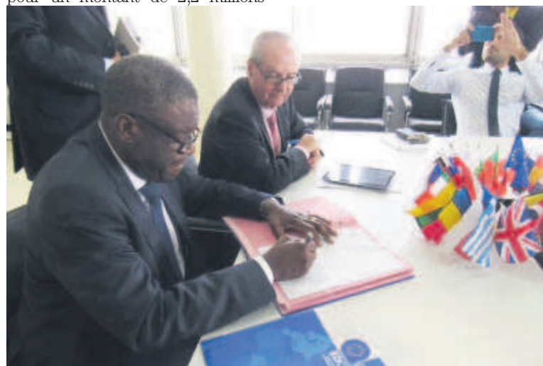
Signature des documents de la convention

Dans le cadre de ce projet, une éducation de rattrapage devra être offerte aux enfants et des forma-