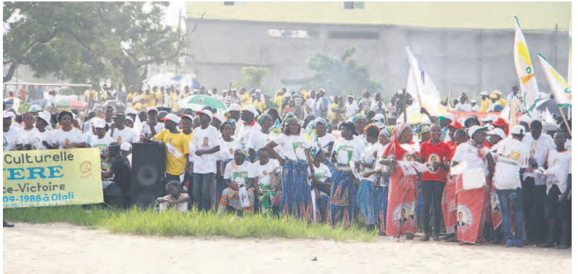
Une vue de la foule

de Roga-Roga, à travers la chanson « Otsouembé vanda na Ebonga », qui signifie Otsouembé reste sur ton fauteuil, a remercié ses sympathisants et leur a donné rendez-vous au boulevard Alfred-Raoul à 13 heures pour, dit-il, un gigameeting de la victoire.