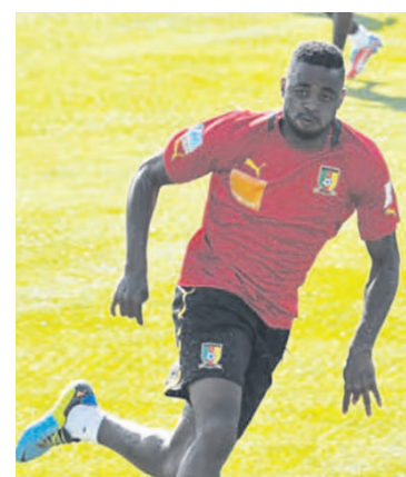
Alexander Song fait son retour en sélection après presque deux ans d'absence

Gardiens de but : André Onana (Ajax Amsterdam/Pays-Bas), Guy Roland Ndy Assembe (Nancy/France/2 e division), Fabrice Ondoa (Gymnastic Tarragone/