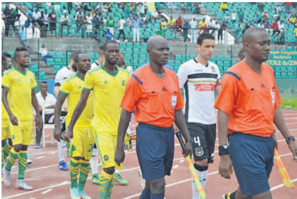
L'Etoile du Congo et Sétif partent à 50-50

Selon lui, son équipe jouera sa chance à fond pour rééditer l'exploit de V Club Mokanda