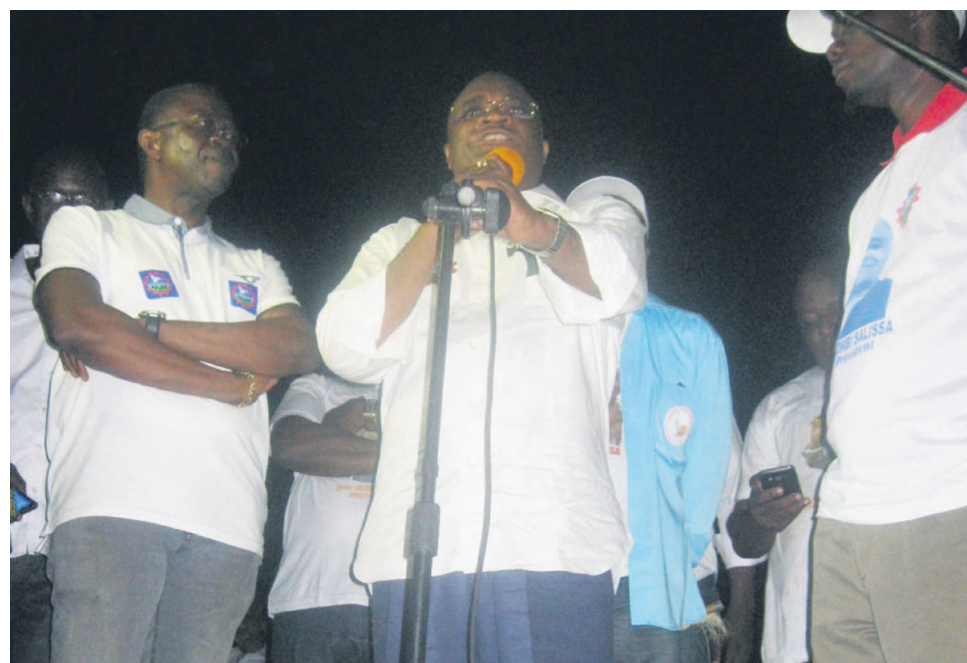
André Okombi Salissa pendant son meeting à Pointe-Noire

C'est au cours d'un meeting tenu le 16 mars à Pointe-Noire que le candidat à la présidentielle du 20 mars, André Okombi Salissa, a fait cette révélation.