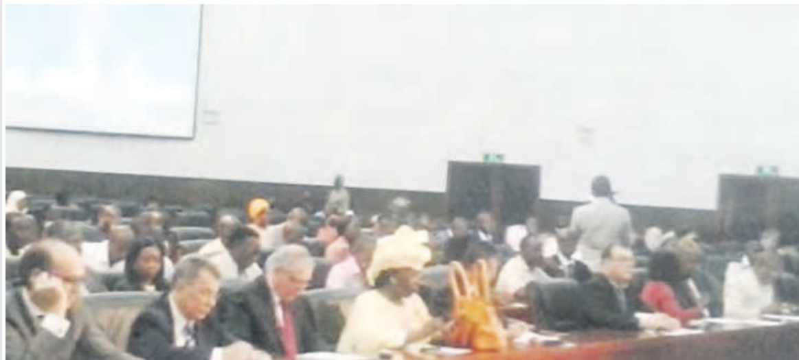
Le corps diplomatique et les délégués des observateurs internationaux