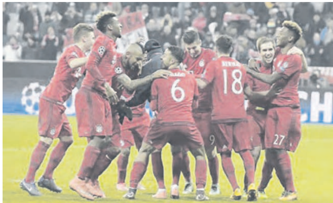
Longtemps menés au score, les Munichois se sont imposés au terme d'un match passionnant

Un soulagement énorme pour l'entraîneur Pep Guardiola. Le Catalan, qui a toujours atteint le carré final lors de ses sept précédentes participations à la tête du Barça puis du Bayern, est particulièrement sous pression pour sa troisième et dernière tentative en Bavière avant de rejoindre Manchester City cet été. Fidèle à sa devise «Fino alla fine», la Juventus Turin, avec un énorme Paul Pogba buteur, s'est battu jusqu'au bout, tenant l'exploit jusqu'aux dernières secondes du temps réglementaire. Maestro de