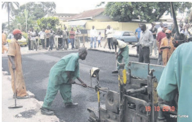
Réhabilitation des routes à Kinshasa

Dans un communiqué du 17 mars, l'ONG attend notamment du gouvernement de la RDC de procéder à l'audit de toutes les infrastructures routières réalisées dans le cadre de ce contrat de collaboration; d'établir les responsabilités des personnes impliquées dans la réalisation défectueuse des infrastructures à Kinshasa; de faire traduire en justice toutes les personnes physiques et morales impliquées dans la réalisation des dites infrastructures et de procéder à l'indemnisation des victimes des démolitions méchantes et illégales. L'Asadho a, par ailleurs, sollicité du gouvernement de la République populaire de Chine d'ouvrir une enquête sur le comportement des entreprises chinoises chargées de la réalisation de ces infrastructures à Kinshasa, alors que la population de la RDC a été appelée à exiger que les personna-