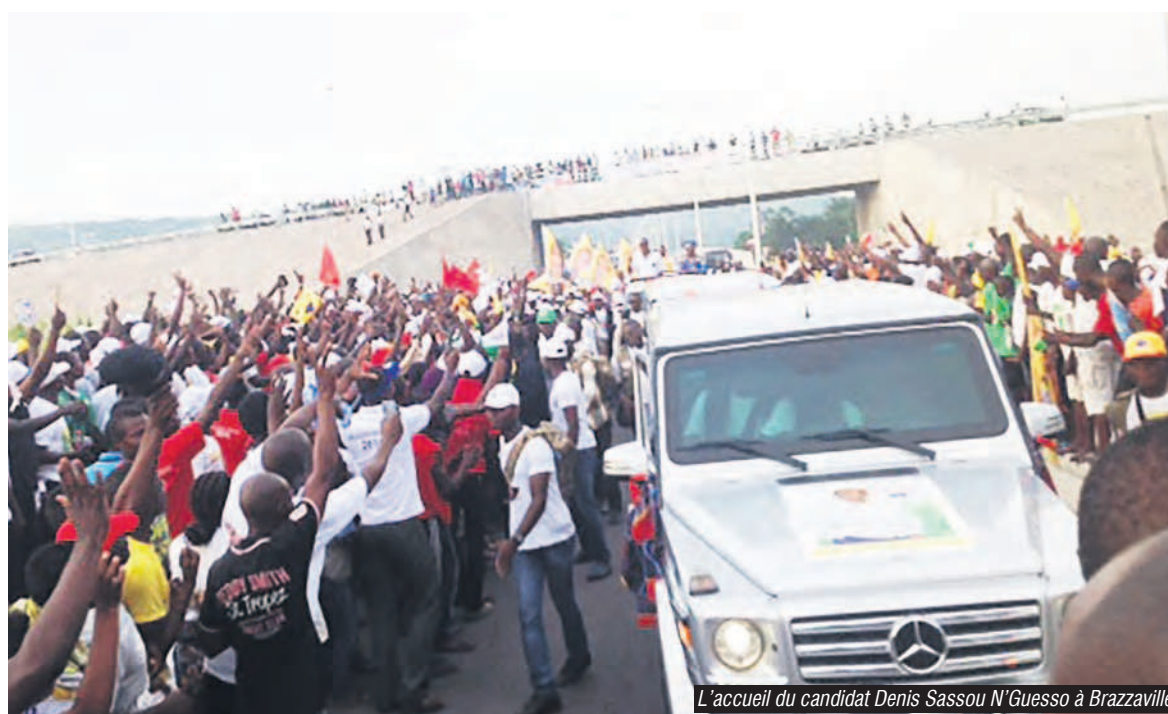
L'accueil du candidat Denis Sassou N'Guesso à Brazzaville

En attendant le grand meeting de fin de campagne annoncé pour ce vendredi par son équipe, le président sortant, Denis Sassou N'Guesso, candidat à sa propre succession, est rentré à Brazzaville hier par la banlieue de Kintélé où l'attendait déjà une foule de partisans en liesse, qui l'a accompagné jusqu'à la place Saint-De-