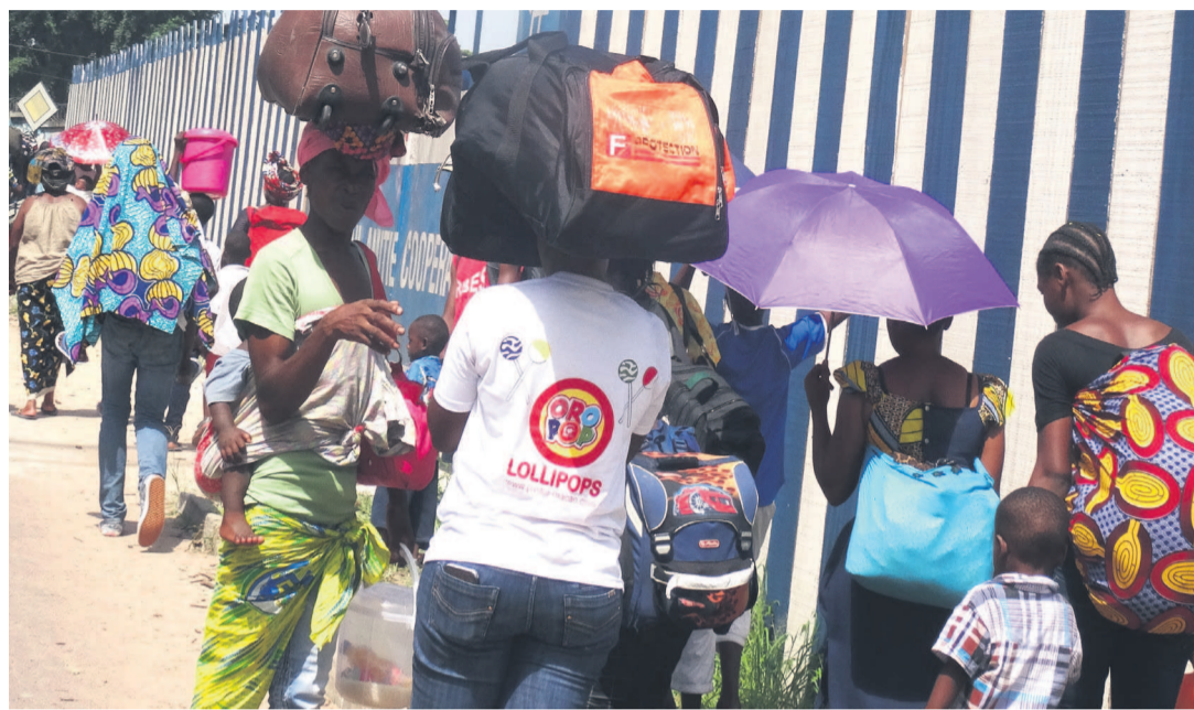
Les populations fuyant leurs domiciles

Le 4 avril à 3 heures du matin, les populations vivant dans les quartiers sud de Brazzaville se sont réveillées au son des rafales. Des tirs nourris d'armes partis de Mayanga ont retenti à Bifouiti, Bacongo, Makélékélé, Kinsoundi, Diata, etc.