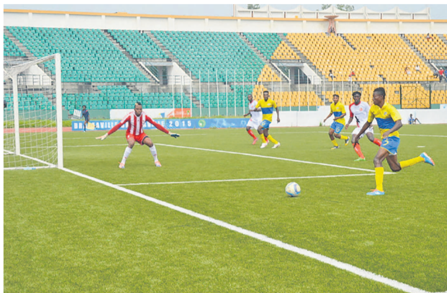
Une contre-attaque de la JST