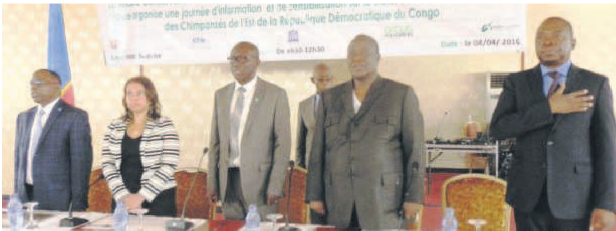
La tribune lors du lancement des travaux

Plusieurs engins de combat et des troupes sont de plus en plus déployés dans l'ex-province du Katanga et particulièrement dans la ville cuprifère de Lubumbashi en ce moment où le pays s'approche de la fin du second et dernier mandat du chef de l'État. Sur le terrain, les spéculations