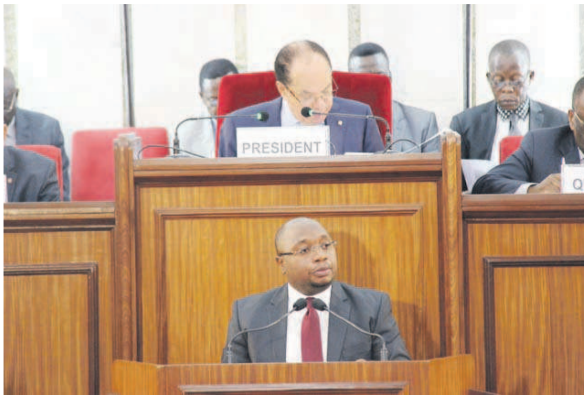
Le ministre de la Santé défendant au sénat le projet de loi portant création de l'ordre des chirurgiens dentistes

Ce projet de loi comprend quatre-vingt-sept articles, répartis en cinq titres. Le titre I est relatif à la création, à la définition des concepts, aux missions de l'ordre national des chirurgiens-dentistes et à l'inscription. Le titre II décrit l'organisation de l'ordre et son fonctionnement. Quant au titre III, il est consacré aux normes de la déontologie des chirurgiens-dentistes, les droits et devoirs envers les malades, envers la collectivité et envers les confrères et les incompatibilités. Le titre IV renvoie à la discipline et aux sanctions. Le titre V organise, par trois dispositions transitoires, le passage de la situation actuelle des chirurgiens-dentistes à l'exercice après l'adoption de la loi. Pour le ministre de la Santé publique, l'exercice de la profession du chirurgien-dentiste exige que le personnel ait une formation académique adéquate et réponde aux principes de moralité, de probité et de dévouement. Par conséquent, il faut l'observance