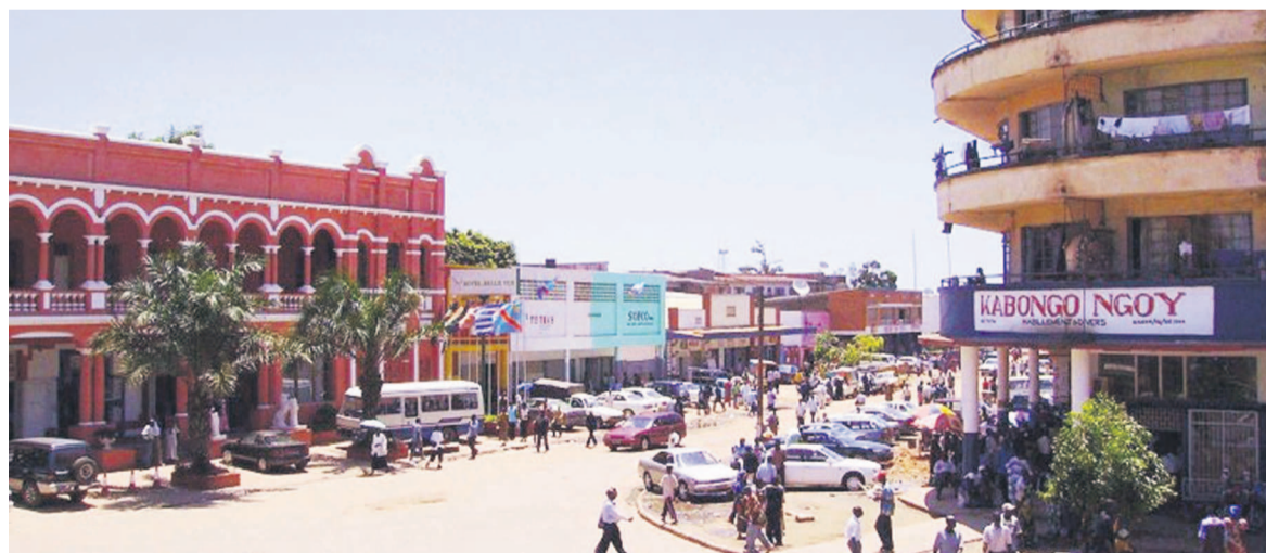
Le centre d'affaires à Lubumbashi

Une journée d'information et de sensibilisation sur le statut des gorilles de Grauer et des chimpanzés de l'est de la RDC a été tenue, le 4 avril, à Kinshasa. Cette activité organisée par le ministère de l'Environnement, Conservation de la nature et Développement durable, en collaboration