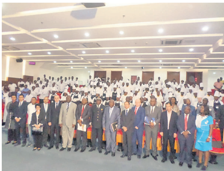
Les officiels posant avec les apprenants