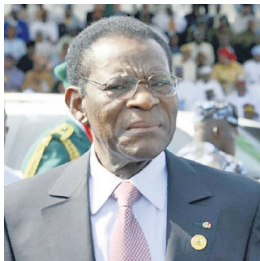
Théodore Obiang Nguema

Le président sortant de Guinée équatoriale, Teodoro Obiang Nguema, au pouvoir depuis 1979, affrontera six candidats à l'élection présidentielle du 24 avril, en l'absence des principaux partis d'opposition.