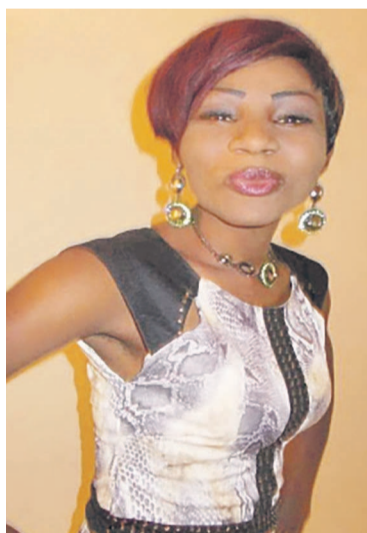
La comédienne-actrice Paoline Oliveira

Mannequin, artiste comédienne, actrice, Paoline Oliveira ne cesse d'épater le public par ses prestations. Au cinéma comme au théâtre, son culot et son talent font d'elle l'une des artistes les plus en vue dans la villeocéane.