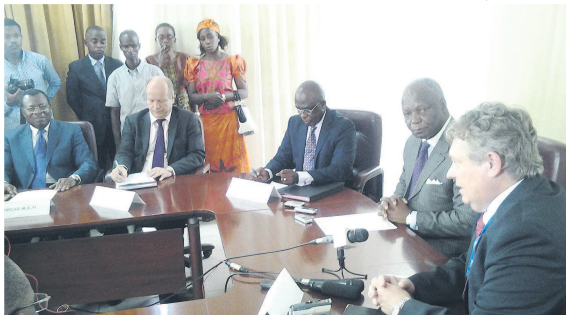
La réunion des représentants du ministère des Finances et le chef de mission EDF.

« Le département de l'Economie se réjouit de ce que le gouvernement a consenti ce nouvel effort pour permettre à la société française EDF de continuer à accompagner notre société nationale pour une nouvelle période devant couvrir les six mois à venir. Nous sommes convaincus que la SNE et l'EDF mettront à profit ce nouvel outil pour parfaire l'œuvre entamée », a déclaré le président du conseil d'administration de la SNE. Le chef de la mission EDF a, pour sa part, affirmé sa volonté permanente d'aller vers la performance. En signant cet avenant, le gouvernement vise à assurer de manière progressive