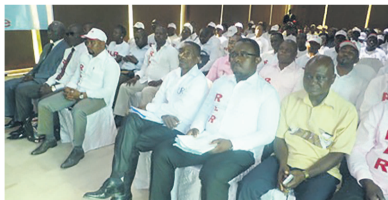
Une vue des participants à l'assemblée générale