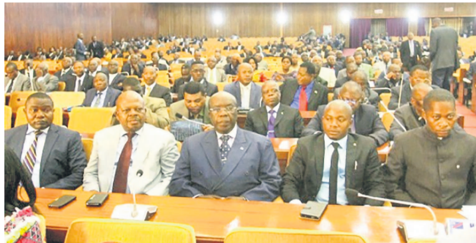
Des députés lors d'une plénière

Selon cette organisation, la RDC est le pays qui, avec 34 cas recensés, compte le plus grand nombre de députés victimes de violations de leurs libertés et de leurs droits fondamentaux.