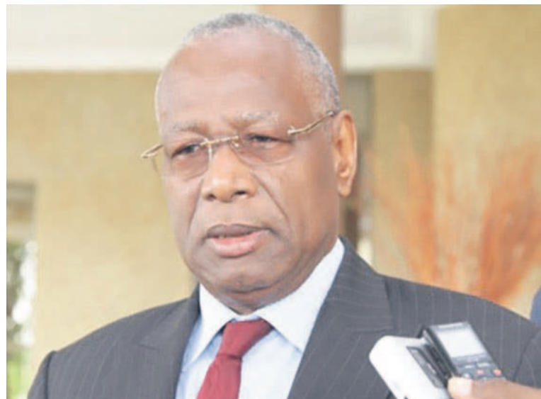
Abdoulaye Bathily

Abdoulaye Bathily a tout d'abord salué la mobilisation des candidats, des partis politiques et des populations pour le scrutin du 10 avril. Le re-