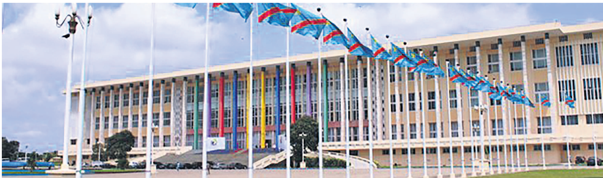
Le siège du Parlement à Kinshasa

Selon cette organisation, la RDC est le pays qui, avec 34 cas recensés, compte le plus grand nombre de députés victimes de violations de leurs libertés et de leurs droits fonde-