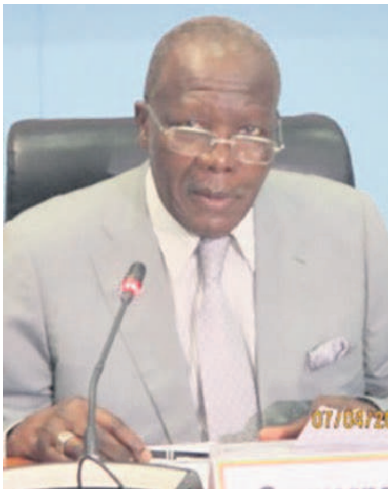
Le ministre des Mines et de la géologie, Pierre Oba à l'hémicycle

Dans le cadre de sa politique de diversification de son économie, l'Etat congolais a souhaité qu'une entreprise de droit congolais s'engage dans le projet de développement du gisement à Zanaga, dans le département de la Lékoumou, en vue de son exploitation. Ce projet revêt un caractère intégré comportant à la fois un volet relatif aux activités minières de recherches et d'exploitation mais aussi un volet