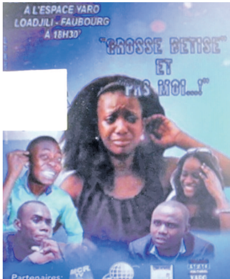
L'affiche de l'avant première des deux films

Le deuxième film, « Pas Moi ! », est aussi un court métrage de 23 minutes. Le film est une interpellation de la jeunesse à se préserver du VIH- sida qui a pour cible maintenant les jeunes. Le film met en scène