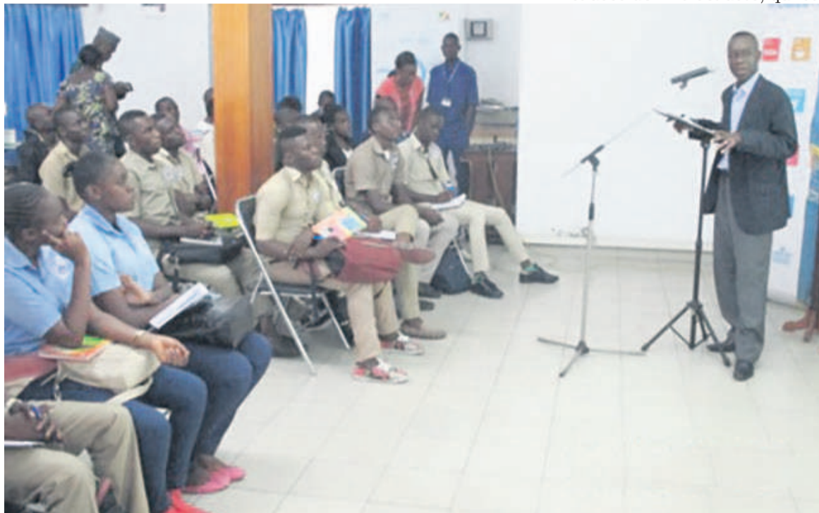
Une vue des élèves suivant l'exposé

« Nul ne peut nier les crimes atroces commis durant l'Holocauste. Chaque année en honorant la mémoire des victimes et en rendant hommage au courage des survivants et de ceux qui les ont aidés et libérés, nous renouvelons notre engagement à prévenir pareilles horreurs et à condamner l'odieuse idéologie dont elles sont issues. Partout dans le monde des hommes, des