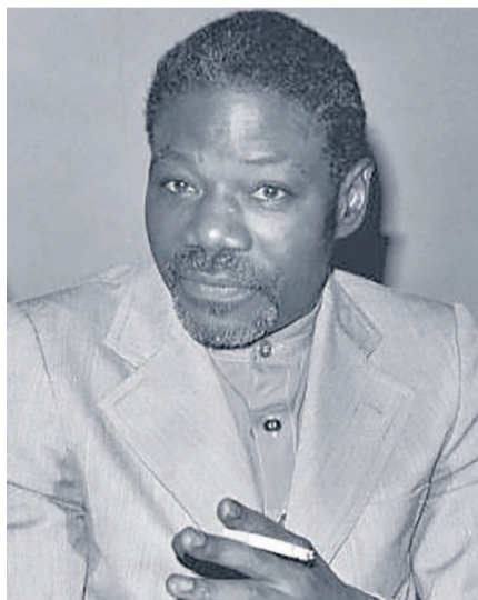
Tchicaya UTam'Si en 1980

Tchicaya UTam'Si est né le 25 août 1931 à Mpili, près du village Loango sur la plaine côtière de Pointe-Noire au Congo. Il quitte son pays dès l'âge de 15 ans pour la France