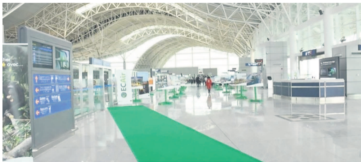
Une vue intérieure de l'aéroport Maya-Maya

cette semaine. Le diagnostic du troisième groupe est techniquement mauvais. En attendant que ces fournitures n'arrivent, nous sommes en train de faire une grande opération de nettoyage. On a neutralisé tous les tuyaux percés qui ont été détectés », a-t-il indiqué, avant de relever que les deux groupes auront un rendement relativement acceptable.