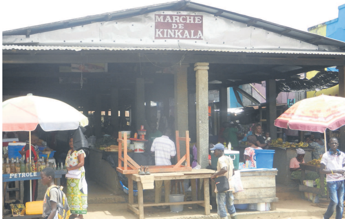
Le marché de Kinkala

maire. L'armée aurait confondu cette école à un centre d'entraînement et de commandement tenu par le Pasteur Ntumi. A en croire le sous-préfet de la localité, le colonel Gaston Aleba, il n'y a eu ni mort ni blessé. Les populations interrogées disent la même