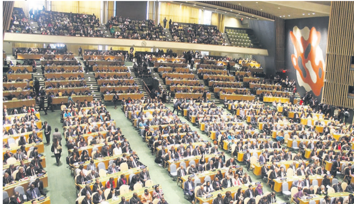
La plénière de l'Assemblée générale des Nations unies

naturelles, l'amélioration de la gouvernance, la modernisation des infrastructures et des services sociaux de base ainsi que la diversification de son écono-