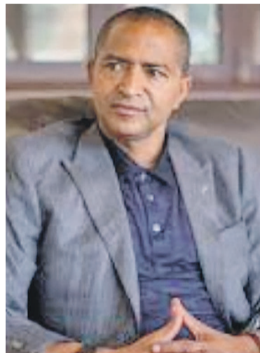
Moïse Katumbi Chapwe

Que cette situation intervienne juste à la veille du meeting annoncé par Katumbi au stade de la Kenya le 24 avril en commémoration de l'ouverture démocratique décrétée par feu Maréchal Mobutu en avril 1990, n'est pas innocent. Beaucoup y voient une volonté délibérée du pouvoir de dissuader, à coup d'intimidation, le président du TP Mazembe à renoncer à son meeting. Bien avant, des effigies de l'ex-gouverneur placardées quelques heures plus tôt sur quelques édifices en prévision de cette manifestation avaient été arrachées par des policiers, rapporte-t-on. « Loin de nous affaiblir, ces actes nous ren-