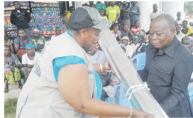
La DG de l'action humanitaire remettant un échantillon au sous-préfet de Mpouya

La directrice générale de l'action humanitaire, Alice Tsoumou Gavouka Mpili, a remis le 20 avril des matériaux de construction et des objets divers à une centaine de chefs de ménages dont les habitations ont été endommagées par un orage qui s'était abattu à Mpouya, dans le département des Plateaux, le 4 mars dernier