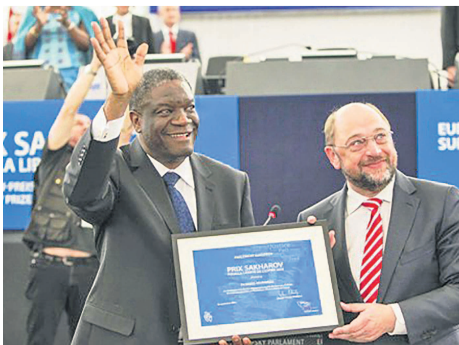
Remise du prix Sakharov 2014 au Dr Denis Mukwege