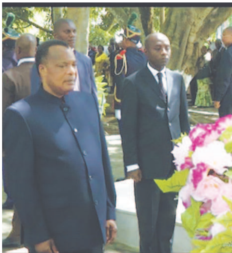
Denis Sassou N'Guesso après le dépôt de la gerbe de fleurs