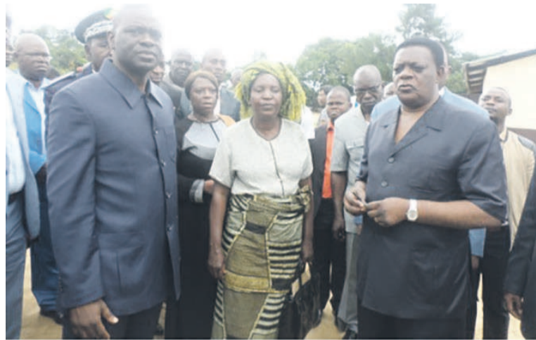
Le ministre Anatole Collinet Makosso et les autorités du Pool à Soumouna

C'est ainsi que le ministre a instruit les enseignants à redoubler d'efforts afin que les chapitres restants soient dispensés dans les