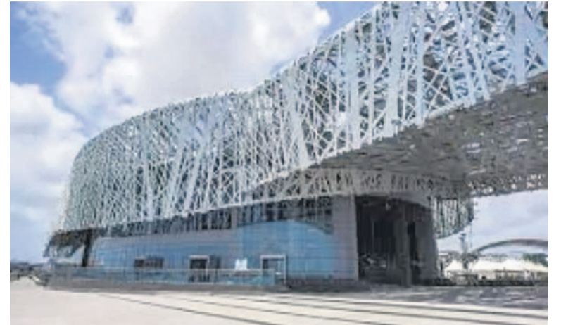
Memorial Acte Guadeloupe Centre caribéen d'expressions et de mémoire de la traite et de l'esclavage

Bordeaux, Nantes et, plus récemment, la Guadeloupe possèdent dans leurs agglomérations respectives des musées d'expression et de mémoire de la traite et de l'esclavage.