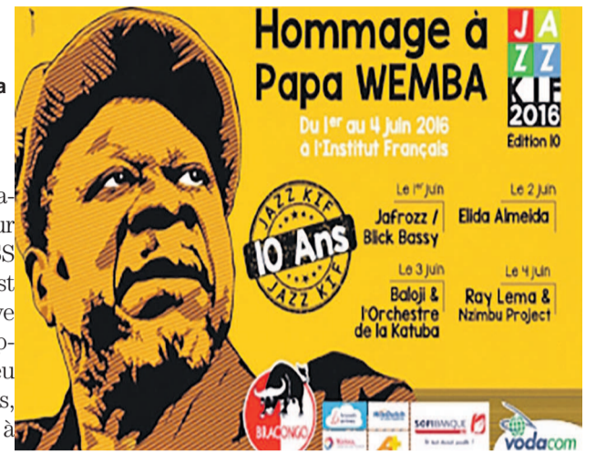
JazzKif 2016 annonce la couleur