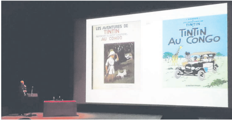
L'un des films prévus pour le festival

Le festival ouvert lundi, donne la parole à des historiens de haut niveau.