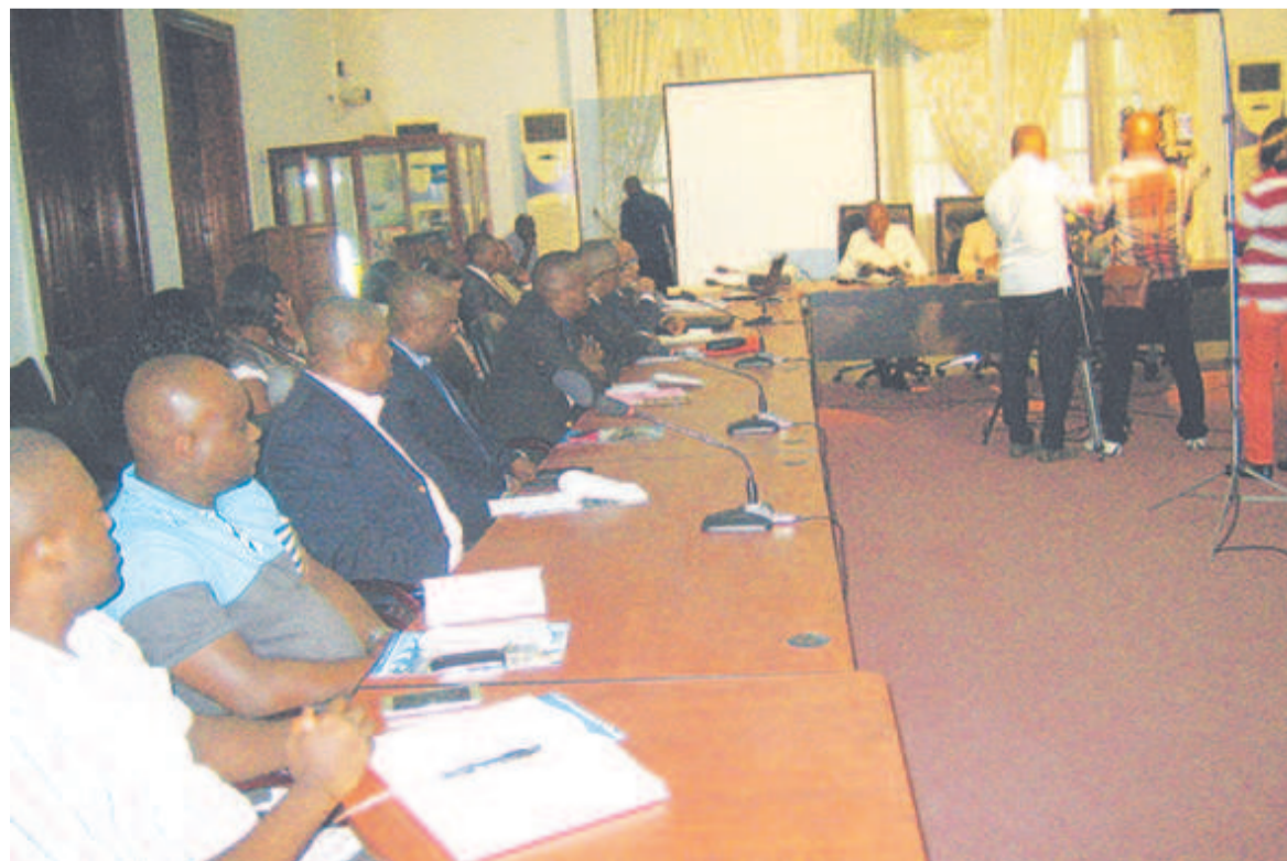
Des chefs d'entreprise prenant part au séminaire