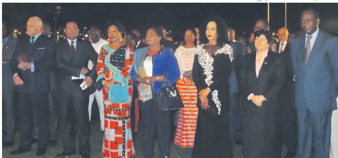
Une vue des invités

rienne. Dans le même esprit, nos résultats ont augmenté de quelque 18% pour le premier trimestre, seul chiffre positif pour les pays d'Afrique cen-