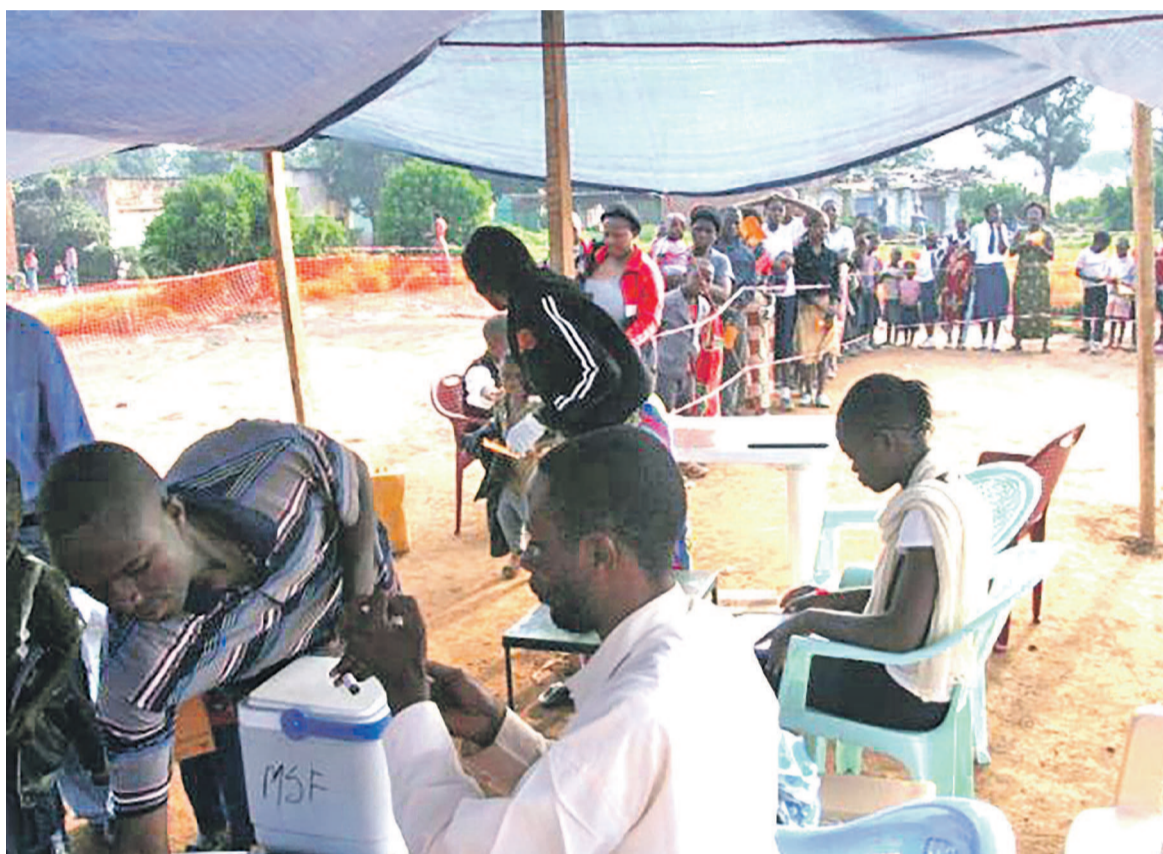
Une campagne de vaccination contre le choléra à l'est du pays