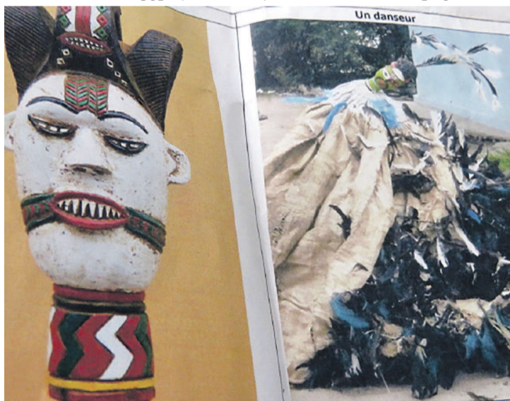
Vue d'une marotte et un danseur de Kiébé Kiébé