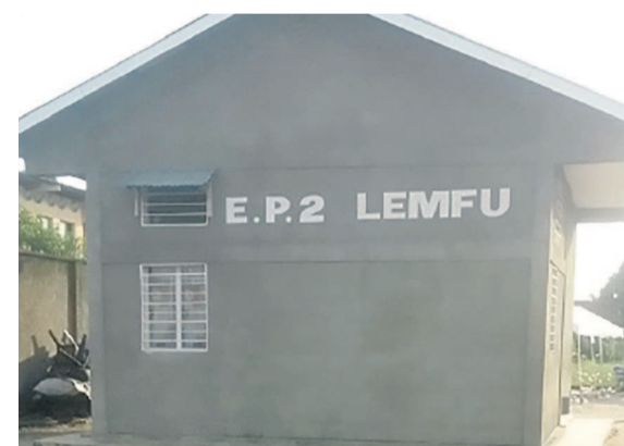
Le bâtiment abritant le bureau d'une école de N'Djili

Aujourd'hui où les nouvelles technologies sont de mise dans l'instruction et l'éducation, l'utilisation dans ces écoles construites par le gouvernement de