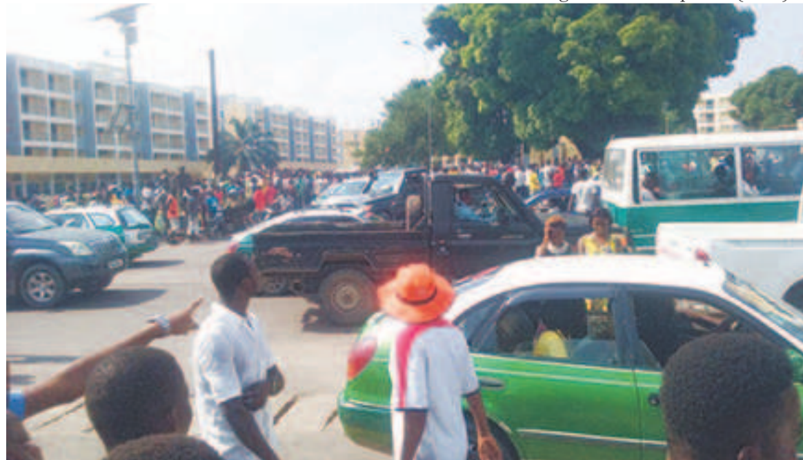
Une scène de panique au rond-point Ebina

de la force publique, appartenant l'une à la zone militaire de défense n°9 (ZMD), garnison de Brazzaville (Police militaire) et l'autre à la direction générale de la police (DGP).