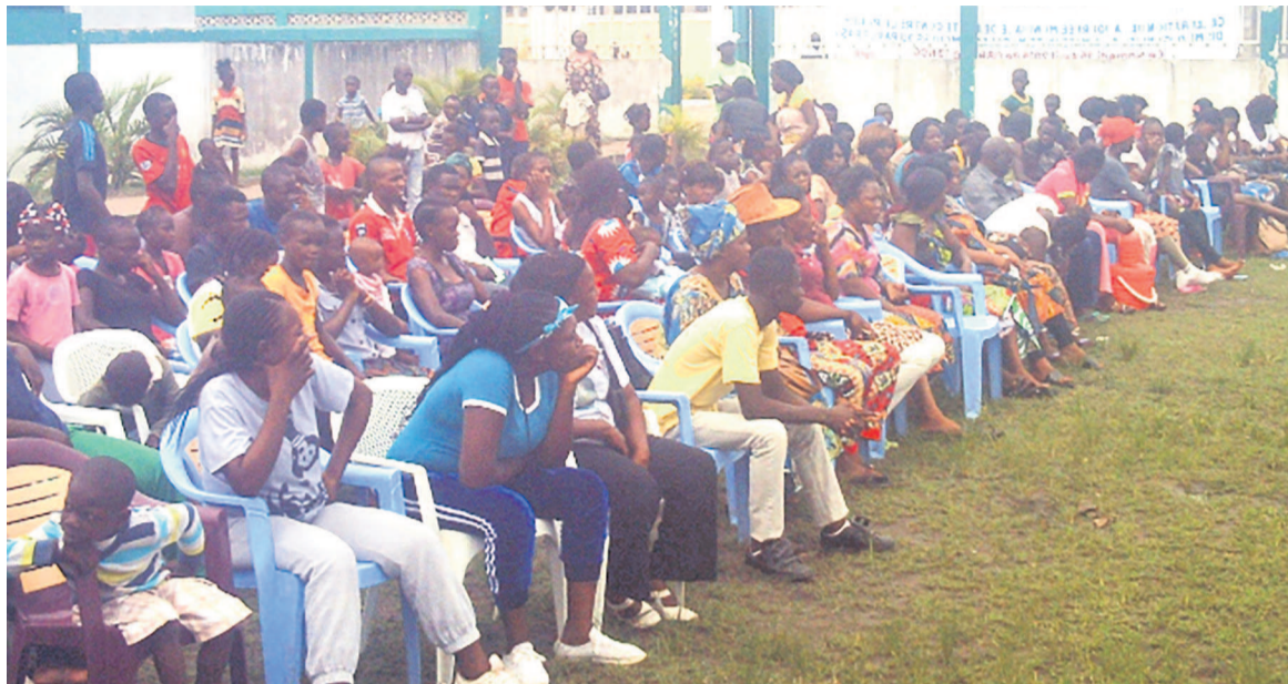
Des patients au CSI Madeleine Mouissou

Pour la mise en œuvre du FBP/FBR, trois phases principales ont eu lieu, à savoir l'atelier de sen-