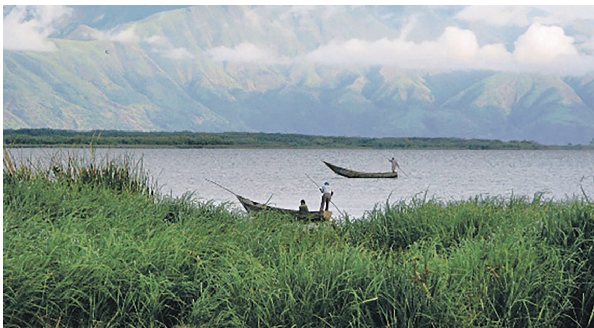
Une vue du lac Albert

Les travaux d'exploitation amorcés sur le site pétrolier Bloc III Graben Albertine du lac Albert dans la nouvelle province de l'Ituri sont en instance de finalisation, du moins pour sa première phase. Débutés il y a deux mois et demi, les travaux de recherches ont concerné une étendue d'environ 246 km qui couvre la plaine du lac. Ces recherches ont consisté principalement en des tests sismiques permettant de visualiser les