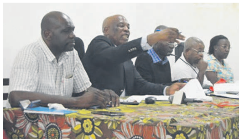
Le présidium de l'assemblée générale extraordinaire de la Fécoket

C'est l'article 30, sur le droit de vote qui a plus alimenté les débats. Dans son ancienne version, elle stipulait : « Ont droit de vote: les délégués des clubs ayant participé au championnat national ou départemental; les délégués des ligues; les membres du bu-