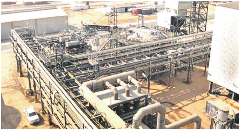
La mine de Teke Fungurume

Il s'agit de la plus importante transaction dans le secteur du cuivre depuis la vente par Glencore de sa mine de Las Bambas au Pérou pour 6 milliards de dollars en 2014.