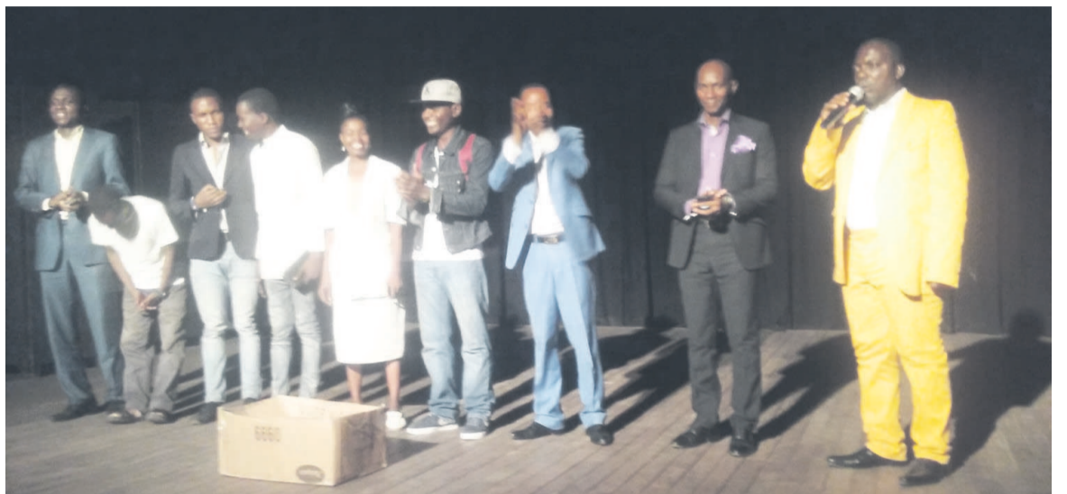
Les acteurs du rire sur scène, à côté le maître de cérémonie