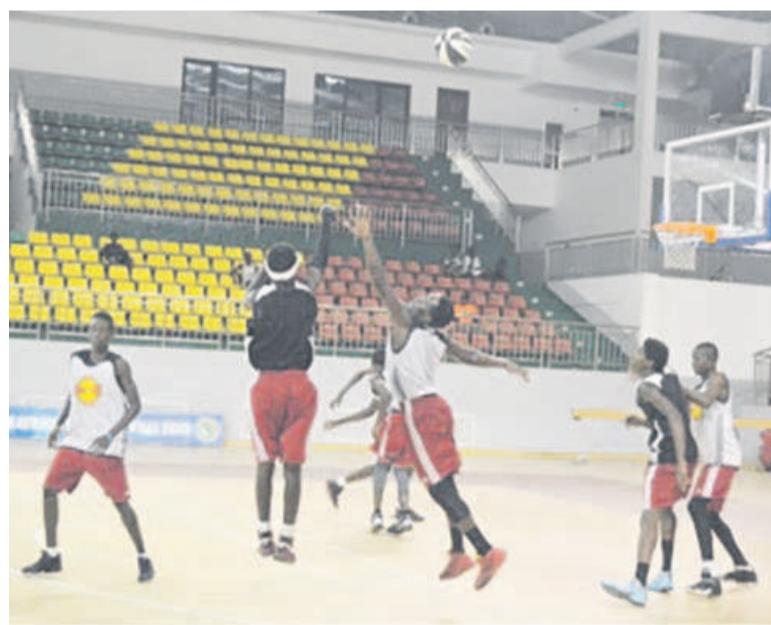
Séance d'entraînement des jeunes basketteurs.