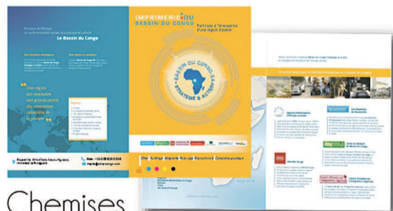
Chemises à rabat