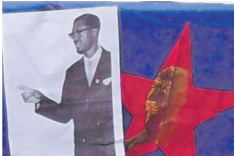
La photo de Lumumba collée aux insignes du MNC/L.

Mais aussi le MNC/L, qui souhaite l'organisation des élections libres, transparentes, démocratiques et apaisées, conseille de commencer ces élections par la base. « Le parti déplore l'absence des élections communales et locales depuis 1959, ce qui contrarie le principe démocratique », ont souligné les participants à ce