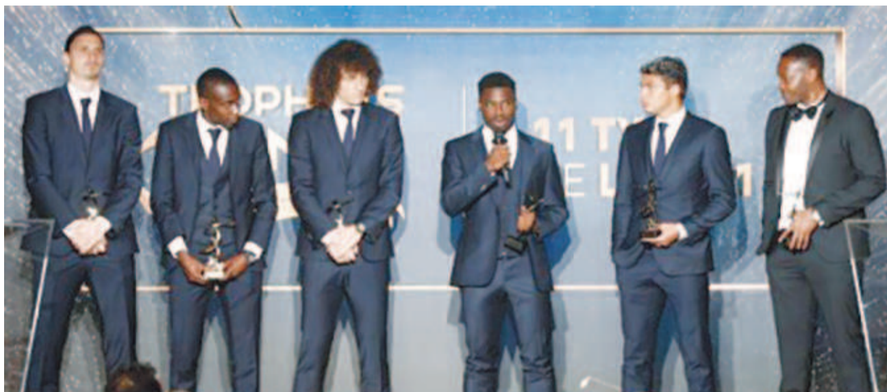
Huit joueurs du PSG dans l'équipe-type, symbole de l'emprise du club parisien sur la Ligue 1

Meilleur joueur : Zlatan Ibrahimovic Meilleur gardien : Steve Mandanda (Marseille) Meilleur espoir : Ousmane Dembélé (Rennes) Meilleur entraîneur : Laurent Blanc (Paris-SG)