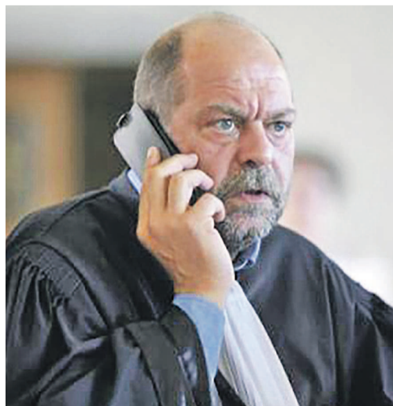
Me Éric Dupond-Moretti

Ce crack du barreau français est chargé notamment d'aider à faire pression pour internationaliser la procédure et s'assurer de son bon déroulement.