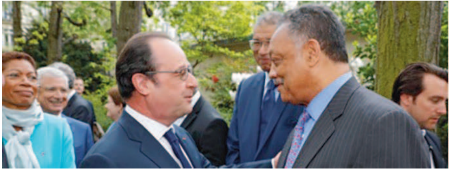
François Hollande salue Jesse Jackson au jardin du Luxembourg.

« Cette fondation sera une source de promotion des valeurs de liberté, d'égalité, de tolérance et diffusera la connaissance de l'esclavage, de la traite mais aussi tout le combat des abolitionnistes », a-t-il ajouté, en expliquant qu'elle devait rassembler « toutes les mémoires et tous les Français ». En 2006, l'ancien président, Jacques Chirac, avait fait du 10 mai