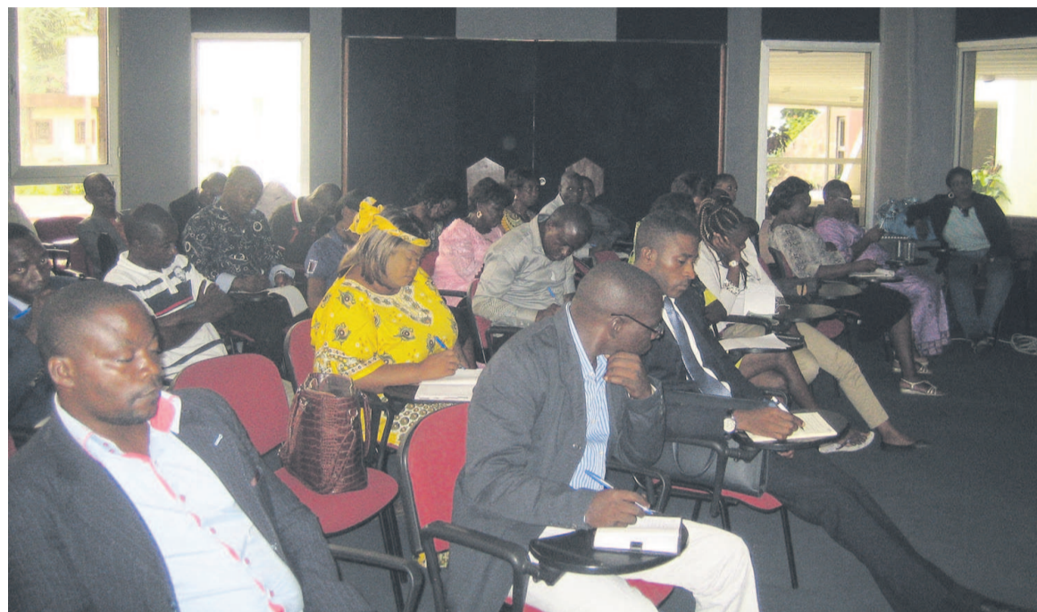
Des journalistes présents à la conférence