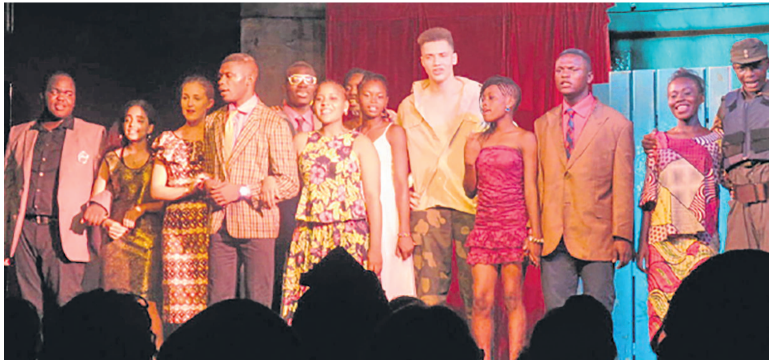
Les comédiens après la représentation de Cauchemar d'homme

Jouée par les élèves du lycée Victor-Augagneur, du lycée français Charlemagne et de l'Espace Enfants, Cauchemar d'homme est une pièce de théâtre née d'un projet de métissage culturel mutuellement profitable entre les deux lycées depuis près d'une décennie. Sous la direction de Jack Percher, chaque année est montée une troupe théâtrale qui réunit sur une même scène les comédiens des deux lycées et même d'ailleurs comme c'était le cas il y a quelques années avec les lycéens de Joachim-Du-Bellay d'Angers en France unis par un jumelage conclu en 2004 avec le lycée ponténégrin. «Cauchemar d'homme» est une comédie d'aujourd'hui librement adaptée de Lysistrata Aristophane qui peint avec ironie les vices de la société que le metteur en scène de sa farce met en lumière. C'est une fable inventée il y a 2500 ans par Aristophane qui