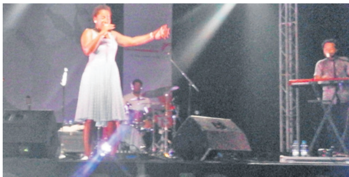
Elida Almeida sur la scène du JazzKif 2016

Véritable coup de cœur du public des deux premières soirées du dixième Festival international de jazz de Kinshasa, la « pépite » du Cap Vert a offert un show chaleureux la nuit du vendredi 2 juin à l'Institut français (IF).