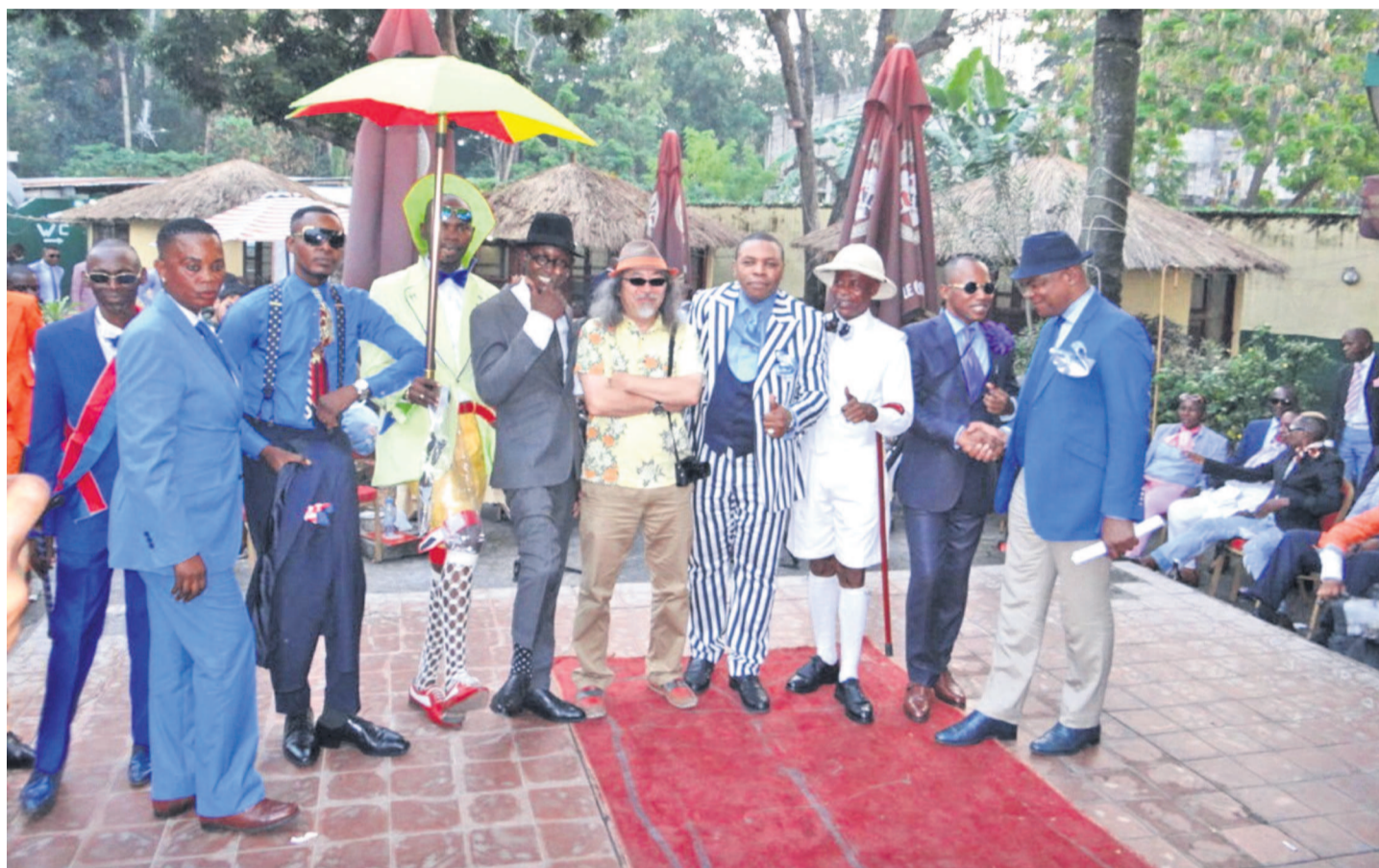
Les cinq vainqueurs et les membres de l'Uasc

« La compétition s'est déroulée sans contestation pour la simple raison que les choses se sont faites devant tout le monde et selon les critères retenus par les Japonais. Certes, il y avait des sapeurs méritant en habits, mais qui ne répondaient pas aux critères retenus. Soit, ils étaient trop gros, soit ils étaient trop âgés, soit ils étaient trop grands de taille... C'est