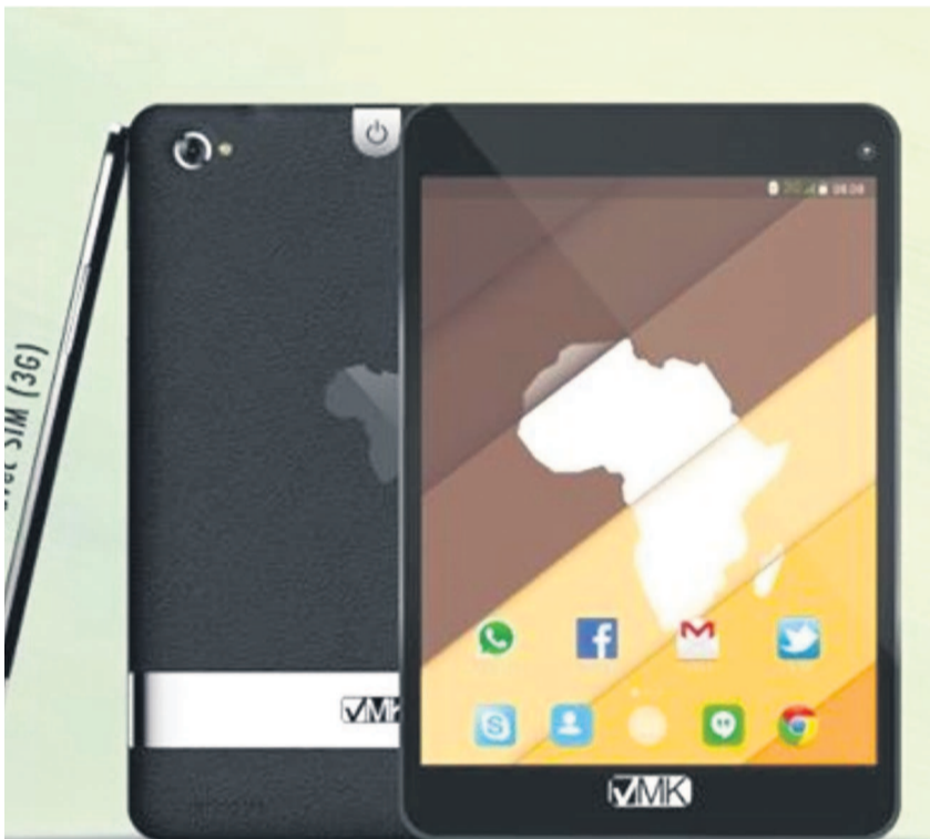
La tablette Elikia HD est commercialisée 99.900 FCFA