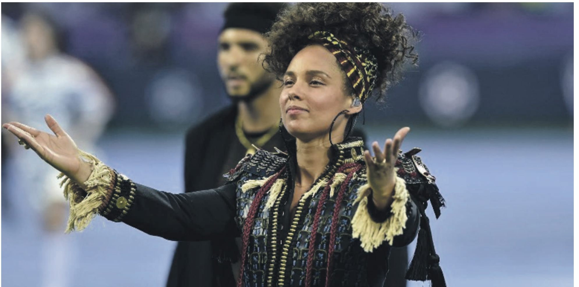
Alicia Keys à l'ouverture de la finale de la Champions League à Milan