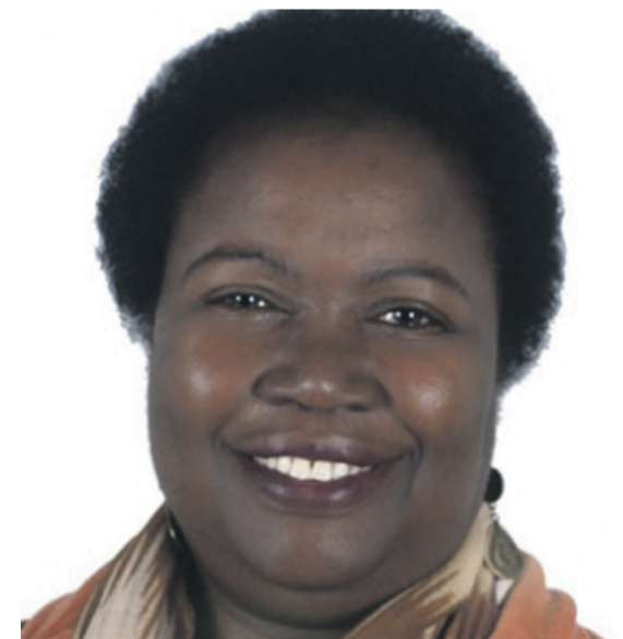
Tanella Boni, écrivain-philosophe

« On reproche souvent aux Africains de critiquer sans rien apporter. Nous ne devons pas nous contenter de faire du commentaire de textes - de lire et de critiquer les grands textes classiques de la philosophie occidentale - sans produire du texte nous-mêmes ».