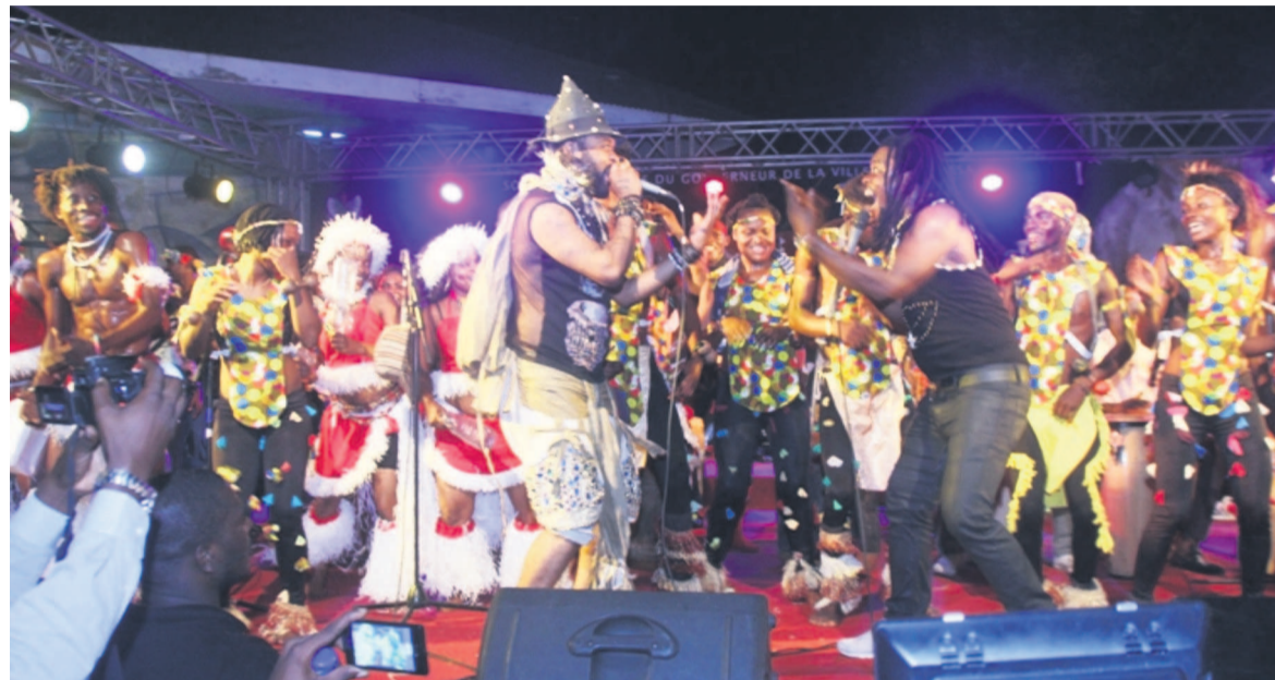
Un extrait du spectacle final de Mbonda Elela avec Bill Clinton

Riche en percussions et en musique traditionnelle, le spectacle final sur lequel se sont éteints les lampions du festival a tout simplement charmé Luc Mayitokou venu assurer une formation dans le cadre de l'événement qui a fait vibrer l'Académie des Beaux-arts le week-end dernier, les 28 et 29 mai à Kinshasa.