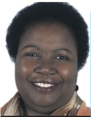
Tanella Boni écrivain philosophe