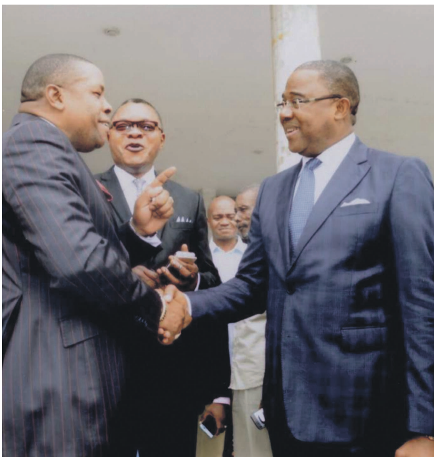
Le président de l'Uasc saluant l'ambassadeur de la RDC après sa remise du diplôme

Par contre Sodios Sengola, pionnier de la sape congolaise a été distingué pour ses nombreux témoignages sur les artistes musiciens Papa Wemba et King Kester Emeneya. C'est