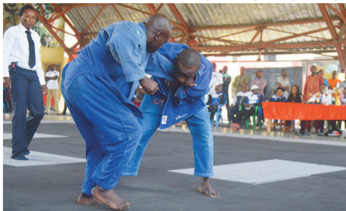
Un des combats du tournoi entre vétérans et jeunes en activité

Seulement, l'égalité de chance que l'Unascojuda veut faire valoir n'est pas synonyme de l'égalité des résultats. Sur le tatami, à dire vrai, ce sont les vétérans qui sont venus à bout des jeunes judokas. La