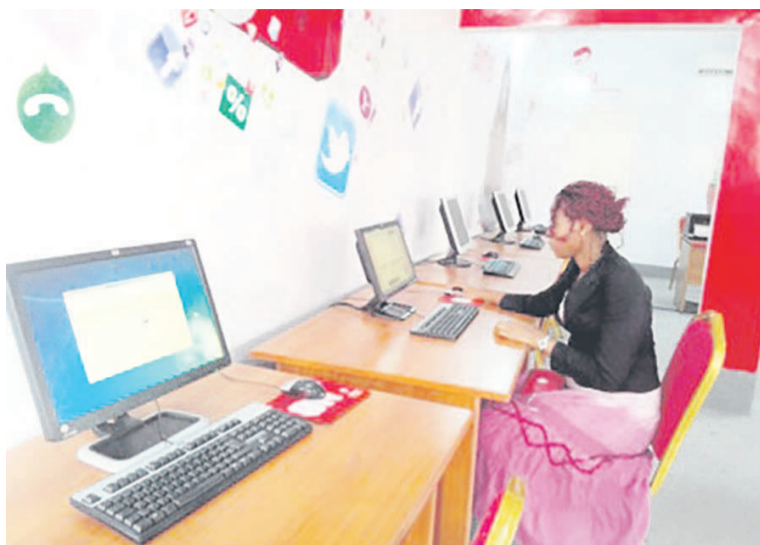
Une vue de la salle multimédia

Accompagnant le projet dans le cadre du programme sur l'entrepreneuriat des jeunes, l'Unesco pense de son côté que ce projet de partenariat public-privé est le fruit de ses échanges débutés en fin 2014 avec Airtel Congo. Il s'agit également pour la représentante de cette institution onusienne au Congo, Ana Elisa Afonso de Santana, d'une réponse apportée aux multiples demandes formulées par le ministère de la Jeunesse et de l'éducation, le Conseil national de la jeunesse