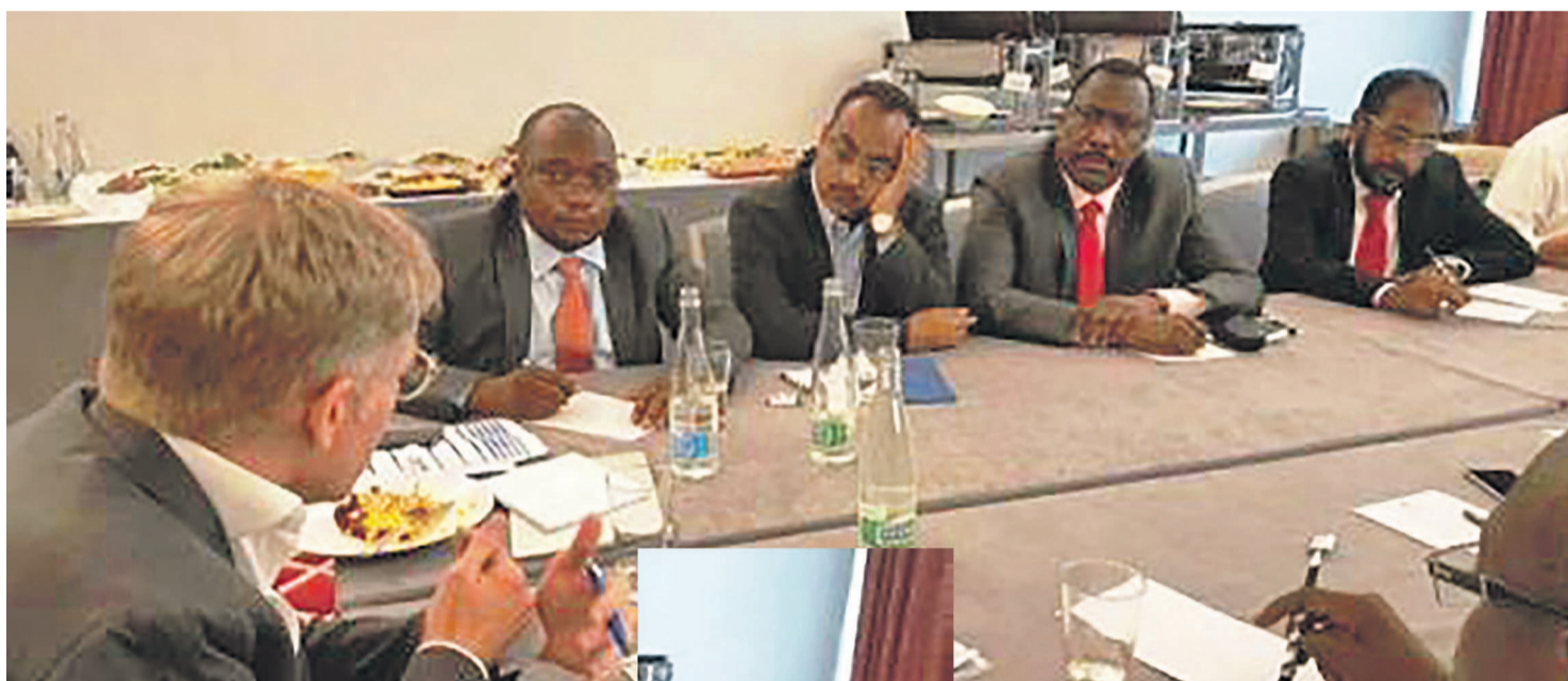
Réunion de crise sur la fièvre jaune à Genève en Suisse