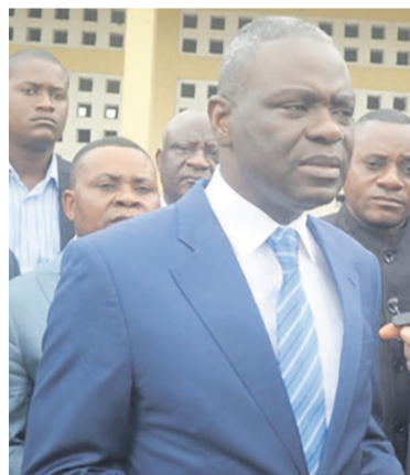
Le ministre et les candidats

Le ministre de l'Enseignement primaire secondaire et de l'alphabétisation, Anatole Collinet Makosso, a félicité le 24 juin, la conscience patriotique de l'ensemble des compatriotes pour le déroulement des examens d'Etat de cette année en cours