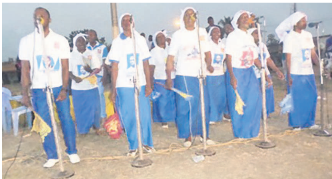
La chorale de l'association Louzolo Amour-OPH

Les artistes musiciens de la capitale de l'or vert (Dolisie) se sont exprimés avec beaucoup d'enthousiasme lors de la célébration de la trente-quatrième journée internationale de la musique, le 21 juin dernier au rond-point du Cercle culturel. Cette fête a été organisée par les directions départementales de la culture et du Patrimoine.