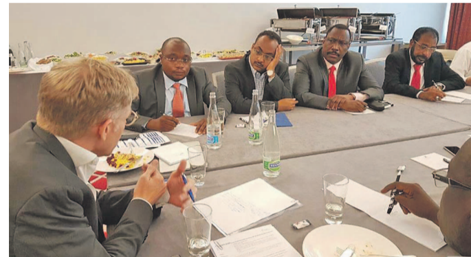
La réunion de crise sur la fièvre jaune à Genève en Suisse

pour mettre fin à l'épidémie de fièvre jaune en cours. Vu la pénurie du vaccin observée sur le plan mondial, une commande spéciale a été faite dans l'un des quatre laboratoires produisant le vaccin anti amaryl situé au Brésil pour produire rapidement le vaccin pour la RDC. Ainsi, plus de onze millions de doses seront administrés à toute la population. Pour Kinshasa, la population sera vaccinée en deux phases: une première phase débutera avant à la fin de juillet 2016 et