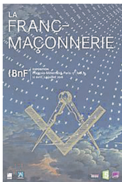
Visuel exposition franc-maçonnerie à la BNF François Mitterrand

religieux, artistique et philosophique - enfin l'évocation des légendes qui lui sont attachées, constituent le parcours de cette exposition dont l'ambition est de faire comprendre, dans un esprit didactique, ce qu'est la franc-maçonnerie. L'exposition s'attache d'abord à retracer les origines - encore en partie mystérieuses - de la franc-maçonnerie moderne. Comment, au cours du XVII e siècle en Grande-Bretagne, une confrérie de métier s'est-elle transformée en une société de rencontres et d'échanges ? Des documents exceptionnels, tels les manuscrits médiévaux des Anciens Devoirs datant de 1390 et 1425, ont été prêtés par la British Library.