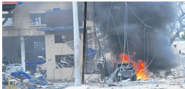
Les combats ont cessé et les terroristes ont été neutralisés

à un carrefour, proche de l'hôtel, là où le conducteur a fait exploser le second véhicule ayant servi au transport des assaillants. En plus de ces victimes, l'attaque de l'établissement fait une vingtaine de blessés dont certains grièvement. « Le bilan pourrait donc s'alourdir », a fait savoir, le ministre somalien de la Sécurité.