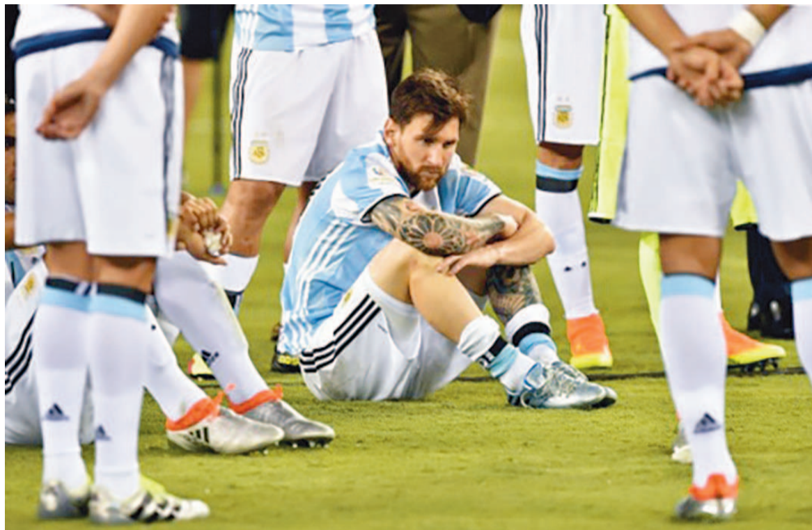
Ecoeuré par ce nouveau revers, Messi renonce à la sélection argentine

Le Chili est la nouvelle terreur du football sud-américain après son succès dans la Copa America 2016 dimanche: pour la deuxième année consécutive, il a donné une implacable leçon de réalisme à l'Argentine qui attend toujours son premier titre depuis 1993.