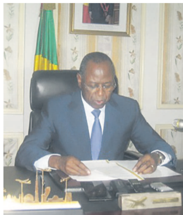
Le ministre Gilbert Mokoki

Dans un message livré à l'occasion de la Journée mondiale des gens de mer, le 25 juin dernier, le ministre congolais des Transports, de l'aviation civile, et de la marine marchande, Gilbert Mokoki a promis œuvrer pour la protection de la vie des gens de mer et la sécurité des navires, y compris pour l'amélioration du niveau de formation de ces professionnels de mer. Instituée en 2010 par l'Organisation maritime internationale, la Journée mondiale des gens de mer de