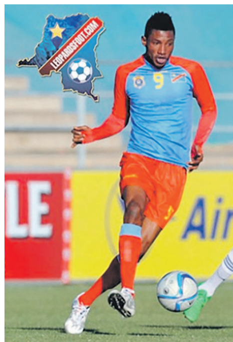
Manzoki n'a pas pu marquer pour les Léopards au Cosafa Cup

Les Léopards de la RDC ont fini à la quatrième place de la 16e édition du tournoi de la Cosafa Castle Cup organisé en Namibie.