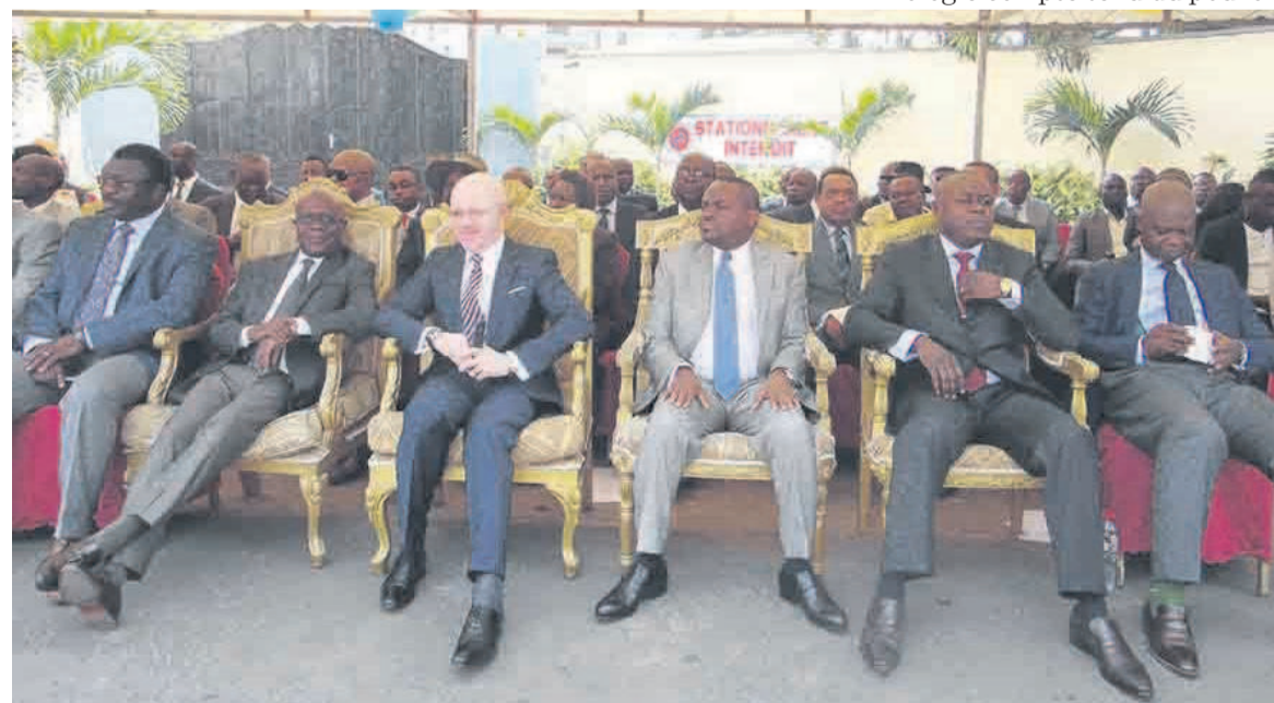
Une vue des officiels