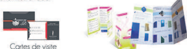
Cartes de visite