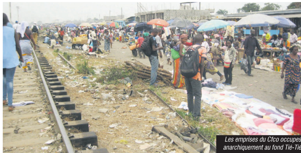
Les emprises du Cfcoc occupées anarchiquement au fond Tié-Tié

Le ministère des Affaires foncières et du domaine public va en guerre contre les occupants illégaux des emprises le long du Chemin de fer Congo océan à Pointe-Noire où il a entrepris une opération de déguerpissement.