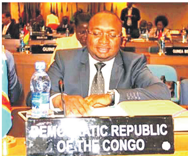
Le Dr Félix Kabange Numbi à la 66 e session du comité régional de l'OMS

Le ministre de la Santé publique, le Dr Félix Kabange Numbi, a conduit la délégation de la RDC aux travaux de la 66 e session du comité régional de l'OMS. Débutés le 19 août, ces travaux se sont clôturés le 22 août à Addis Abeba en Éthiopie.