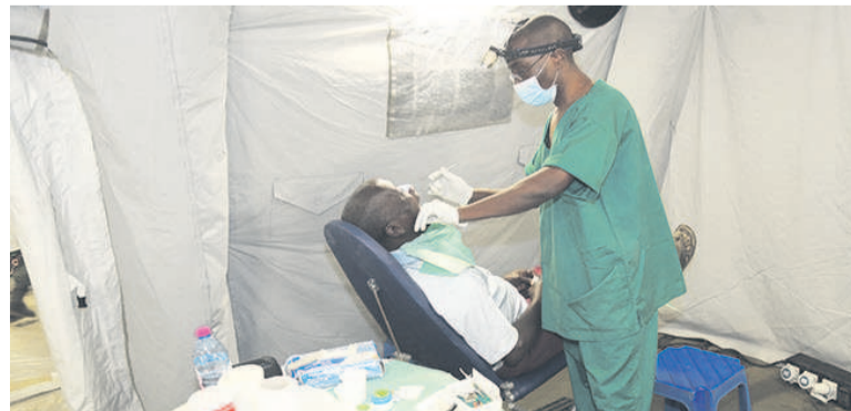
Une séance des soins à l'hôpital médico chirurgical de campagne naires ou intensifs. Les pathologies soignées ont été entre autres, le paludisme, la grippe, l'hy-

L'initiative est une action civilo-militaire et humaniste qui rapproche davantage les services des Forces armées congolaises aux populations. A travers cet hôpital de campagne, le personnel soignant des Forces armées congolaises écoute et oriente les malades dans différents services pour qu'ils bénéficient des soins ordi-