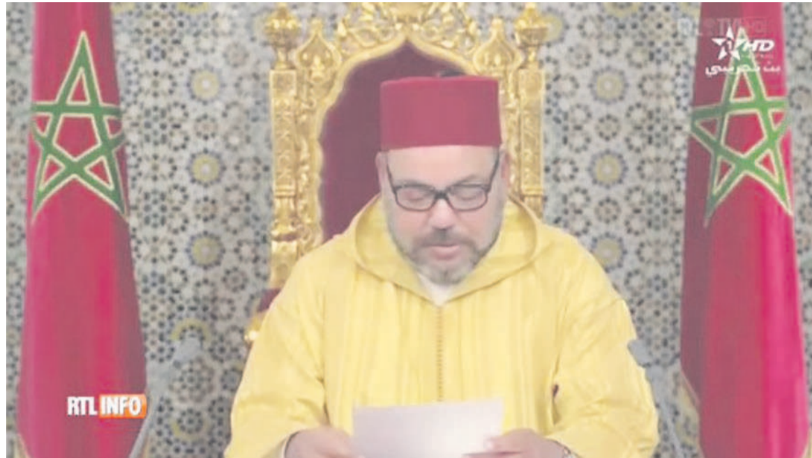
Le roi du Maroc Mohamed VI

les a aussi invités « à rester attachés aux valeurs de leur religion et à leurs traditions séculaires face à ce phénomène qui leur est étranger ». « Nous condamnons vigoureusement le meurtre d'innocents », a souligné Mohamed VI, qui faisait allusion à l'assassinat d'un prêtre, le 26 juillet dans le nord-ouest de la France, égorgé par deux djihadistes alors qu'il célébrait la messe matinale. Le roi