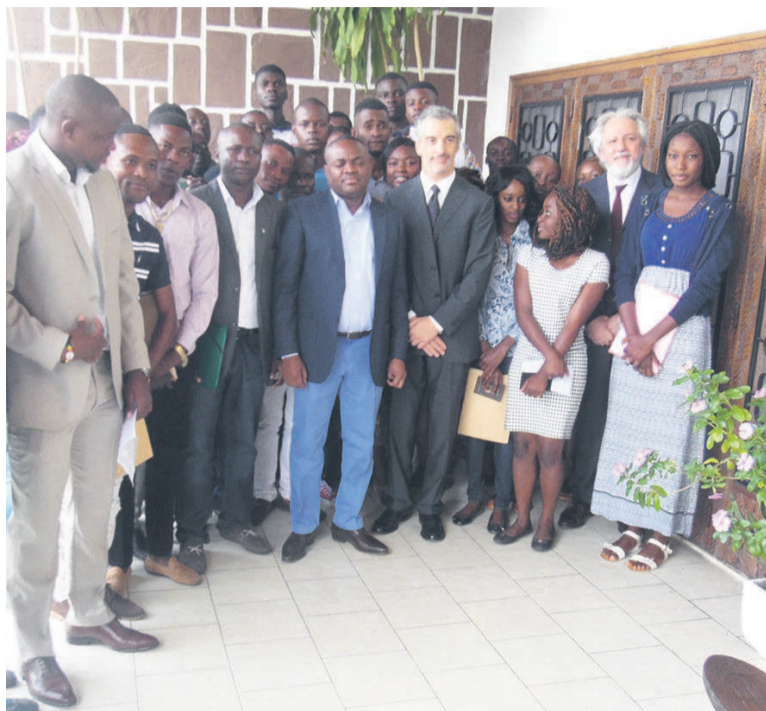
Les étudiants posant avec le ministre de la Culture et des Arts et l'ambassadeur d'Italie au Congo

Le ministre de la Culture et des Arts, Léonidas Carel Mottom Mamoni, a remercié l'ambassade d'Italie pour ce geste qui témoigne de sa volonté à accompagner la République du Congo dans sa marche vers le développement, avant d'exhorter ses compatriotes. « L'ambassade