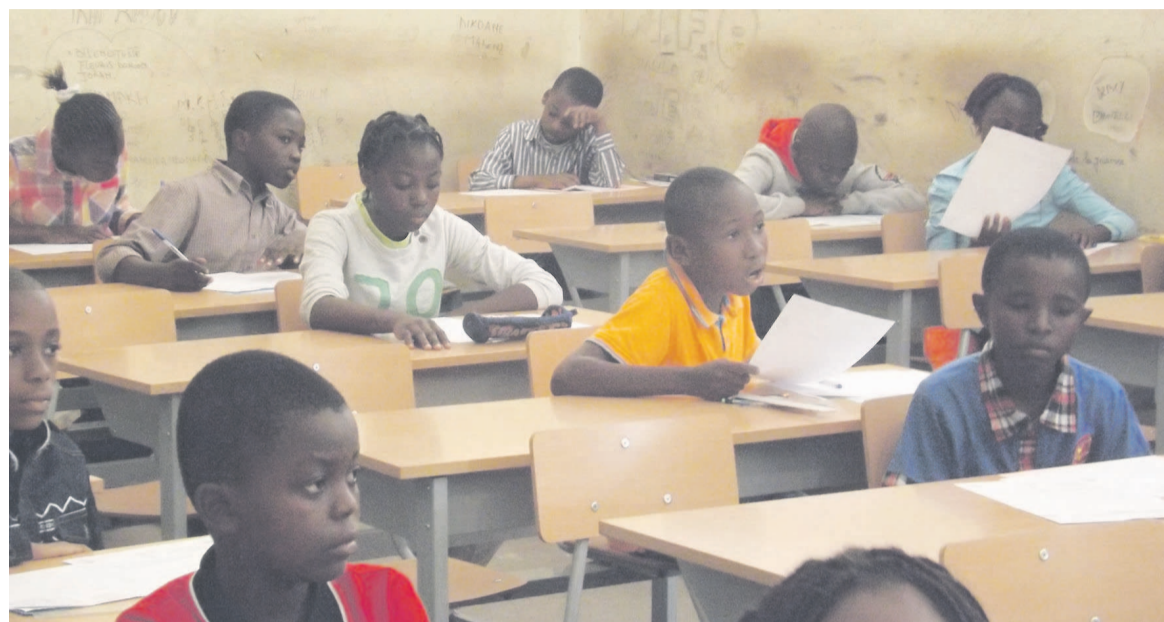
Les candidats dans une salle d'examen à Brazzaville./Crédit photo Arnel Mambou

Au total 580 candidats se sont inscrits à ce concours pour seulement 60 places réservées. Pour le département de Brazzaville, sur les 156 inscrits, 150 se sont présentés ce matin. A l'issue de ce concours qui se déroule sur toute l'étendue du territoire national, cinq meilleurs élèves seront retenus par département. Interrogé sur le nombre de places réservées à chaque département, le ministre Anatole Collinet Makosso estime que l'objectif est la recherche de l'excellence, la crème, l'élite. « Nous ne sommes pas pour la massification des diplômés, nous sommes pour la recherche de l'excellence, la qualité. Nous avons beau être intelligents mais nous n'avons pas tous les mêmes aptitudes, il faut toujours que vous puissiez admettre que parmi nous il y a les plus brillants et c'est