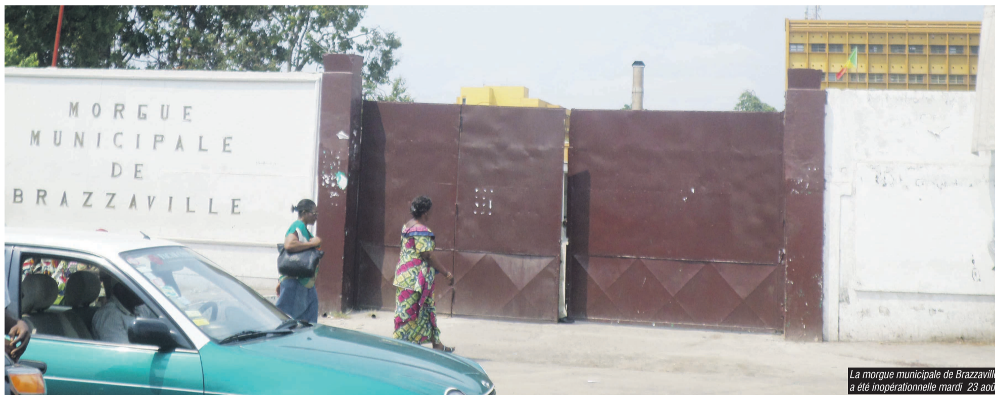
La morgue municipale de Brazzaville a été inopérante mardi 23 août

La plateforme des syndicats des mairies du Congo a déclenché, depuis le 18 août, une grève des agents municipaux ayant totalement paralysé mardi le programme de levées de corps à la morgue municipale de Brazzaville au détriment de nombreuses familles qui