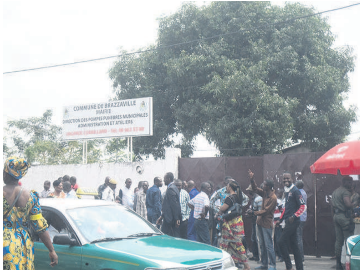
L'entrée principale de la morgue de Brazzaville le 23 août

En effet, selon les revendications affichées à la mairie