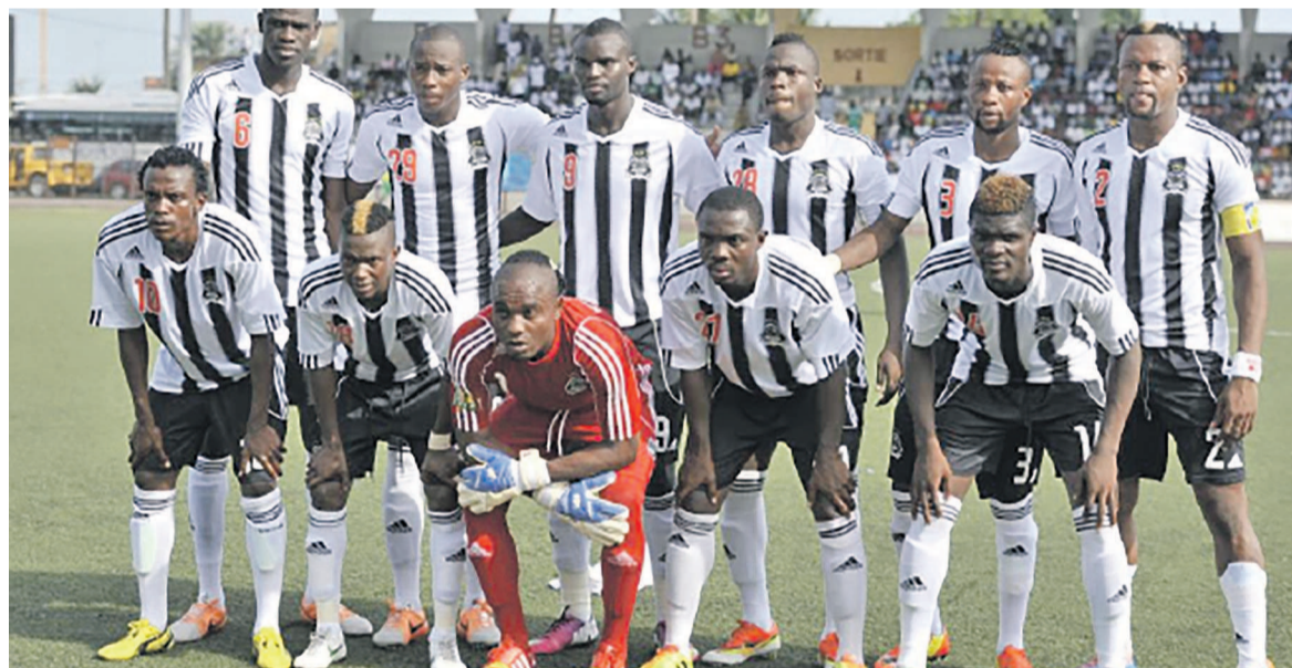
TP Mazembe de Lubumbashi

Victorieux sans surprise de Young Africans de Tanzanie par trois buts à un à Lubumbashi, le TP Mazembe s'envole vers la demi-finale de la C2 africaine.