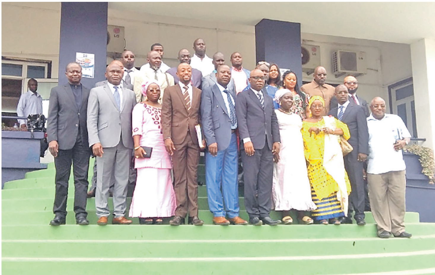
Photo de famille après la réunion