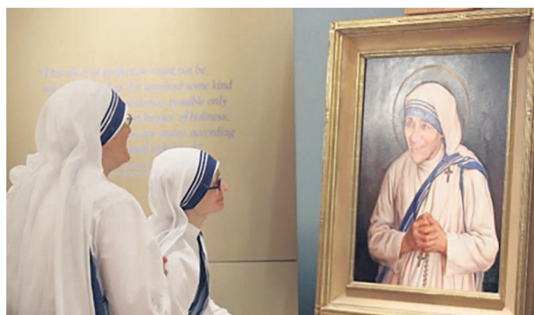
Mère Teresa a été canonisée, à Rome, par le Pape François

Dans le cas de Mère Teresa, il s'est agi de la guérison en 1998 d'une Indienne qui souffrait d'un