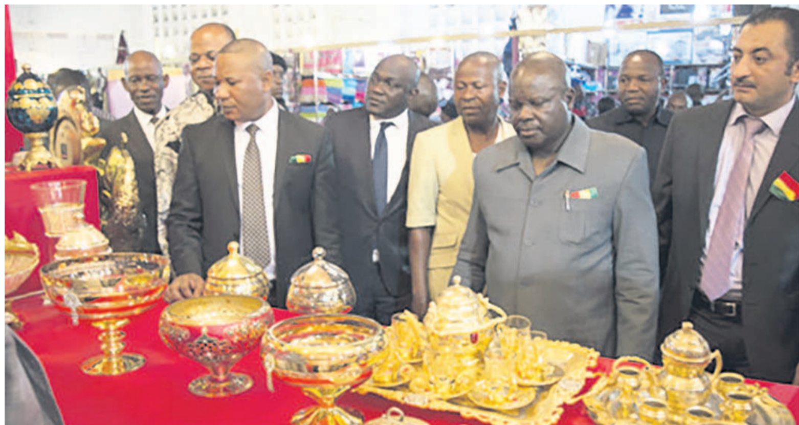
Visite des expositions par les responsables du ministère du Commerce

Des produits que les Congolais découvriront pendant un mois. Une occasion pour le Centre congolais du commerce extérieur d'inviter les opérateurs économiques à bénéficier de l'expérience syrienne dans l'organisation des fêtes foraines avec des produits diversifiés.