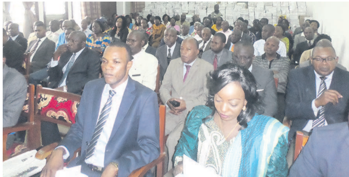
Les participants

Noire, Sangha et Likouala. Elle est aussi revenue sur l'implication de la direction générale de l'alphabétisation dans le Projet de développement des compétences pour l'employabilité