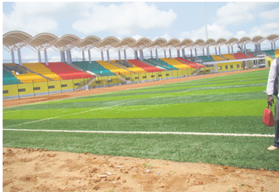
Le stade de Ouesso

avoir l'autorisation préalable des Grands travaux parce que le stade n'est pas encore livré. Techniquement, nous avons des difficultés pour utiliser ce stade », a-t-il expliqué.