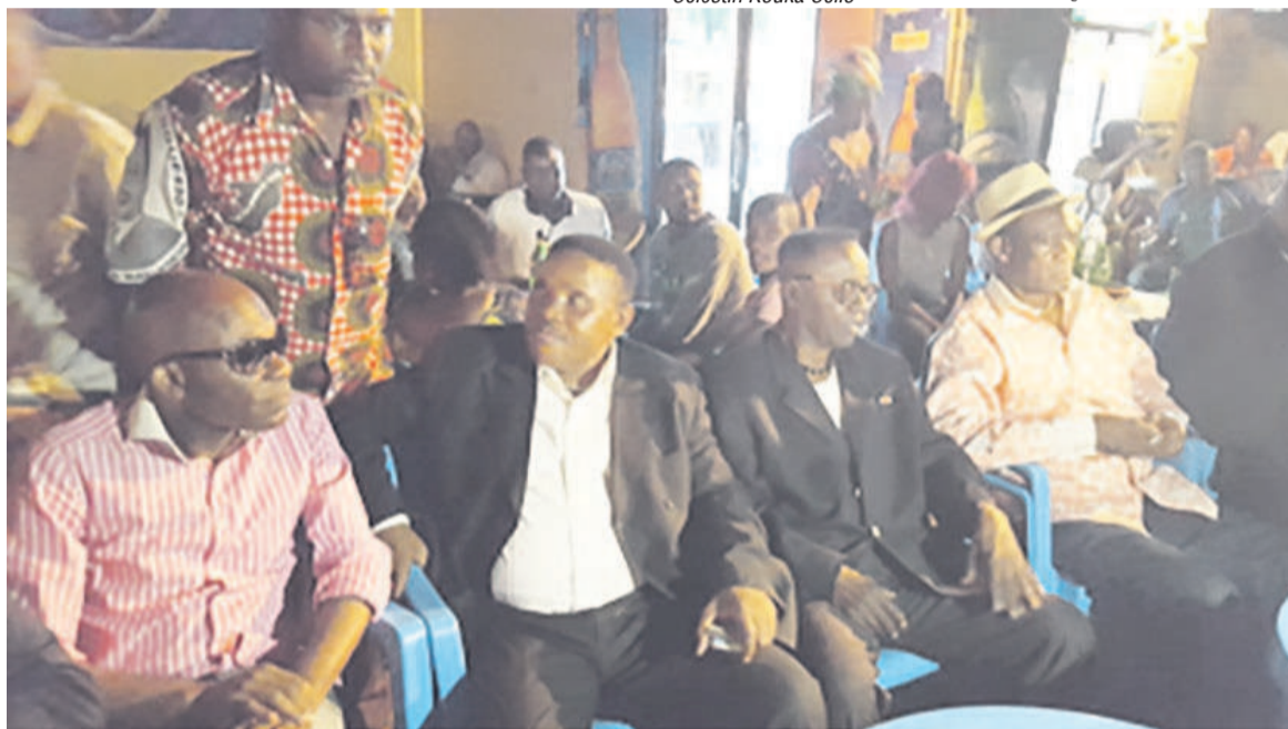
Les artistes de la RDC présents au méga-concert