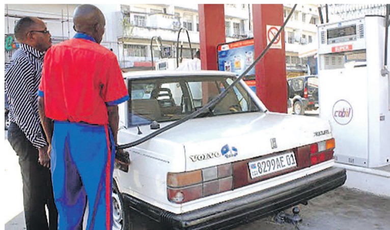
Un pompiste approvisionnant un client en carburant

Les causes de la dernière augmentation du prix du carburant sont liées aux changements signalés dans les paramètres de la structure des prix. Et le gouvernement a entériné cette décision par crainte des implications désastreuses sur son économie déjà soumise à un régime d'austérité, révèle-t-on. Aussi cette révision à la hausse avait-elle pris en compte la sauvegarde des intérêts de l'État, des opérateurs économiques et des consommateurs. La période d'austérité marquée par une baisse des recettes fiscales n'offrait aucune alternative au gouvernement obligé à faire face à des dépenses contraignantes. Avec ce réajustement, il y aura une réduction à une proportion acceptable de la perte mensuelle de l'État, sans oublier l'absence de manque à gagner pour les sociétés pétrolières et le rapprochement entre les taux de change.