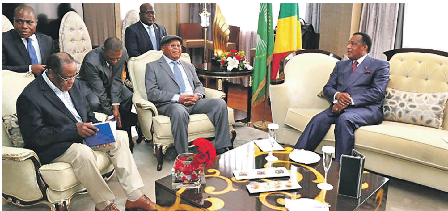
L'audience avec les leaders des partis de l'opposition

En visite de travail à Kinshasa, le 2 septembre, le président Denis Sassou N'Guesso a été reçu par son homologue, Joseph Kabila. S'agissant du processus électoral en RDC, les deux chefs d'État ont loué la maturité des acteurs politiques congolais quant aux progrès accomplis vers la tenue effective du dialogue politique national et encouragent une participation inclusive de toute la classe politique congolaise sous le couvert du facilitateur international désigné par l'Union africaine.