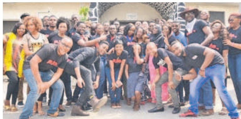
L'équipe de Ringier Afrique de Lagos

Les stagiaires effectueront, font savoir les initiateurs du programme, divers exercices au sein de Ringier Afrique et de ses modèles d'affaires. Chez Ringier Nigéria, le stagiaire participera à un tout nouveau programme qui débouchera sur un