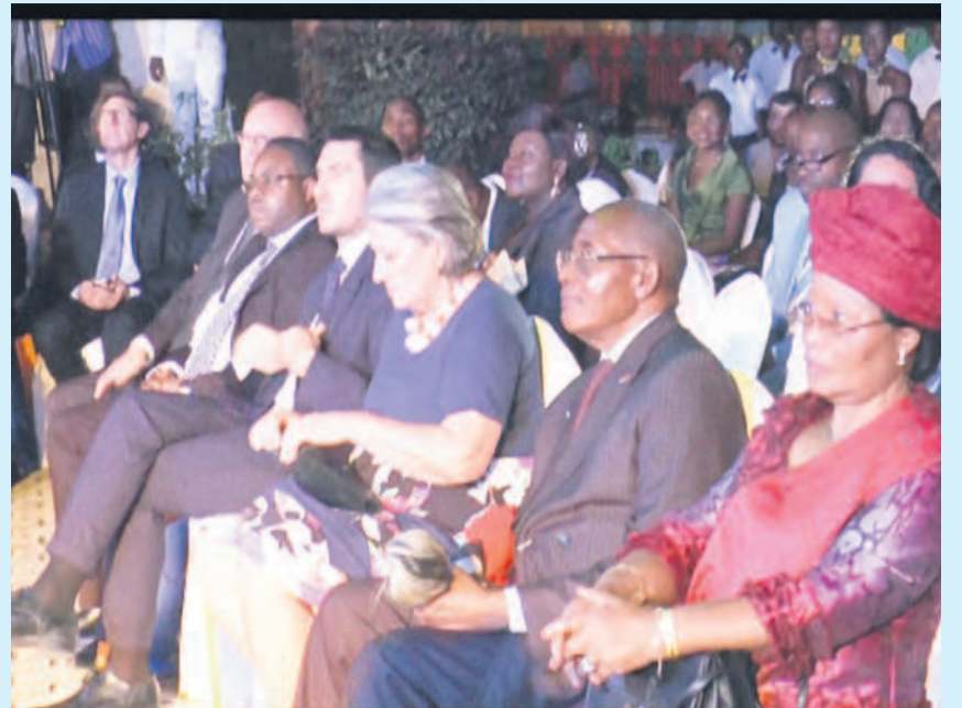
La famille Royale de Mbé et les descendants de Savorgnan de Brazza