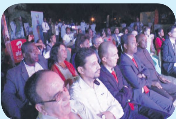
Une vue des diplomate