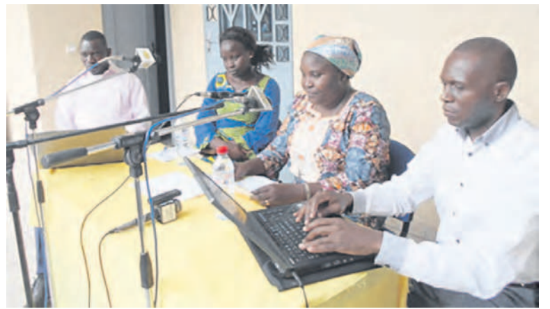
La présidente de l'ACA prononçant son allocution