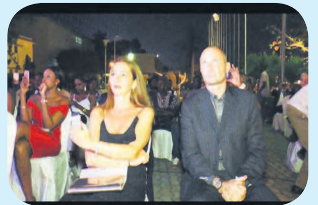
Vue des invités