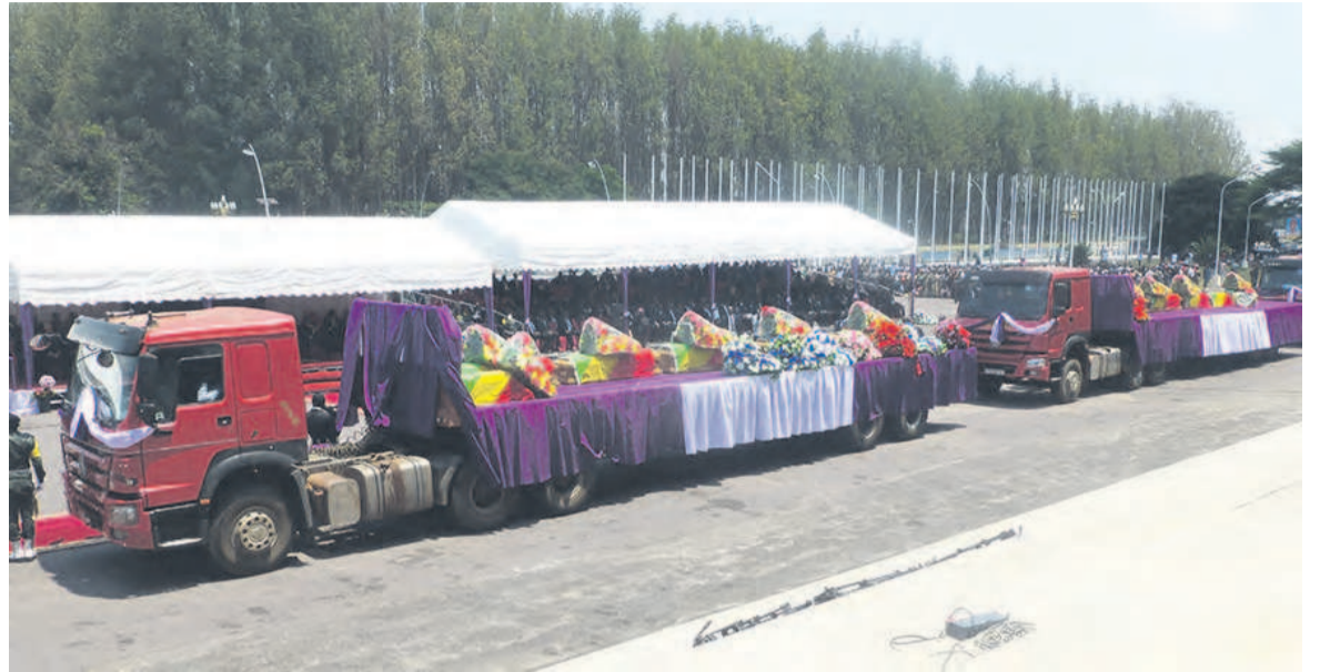
Une vue partielle des corps placés sur les remorques

Il a assuré tous les Congolais que l'action humanitaire en cours engagée par le gouvernement se poursuivra jusqu'au retour des déplacés dans leurs lieux de résidence respectifs. Le gouvernement, a-t-il dit, s'incline devant les mémoires des victimes du terrorisme et renouvelle ses condoléances les plus attristées aux familles éplorées. Clément Mouamba a déploré le mutisme des orga-