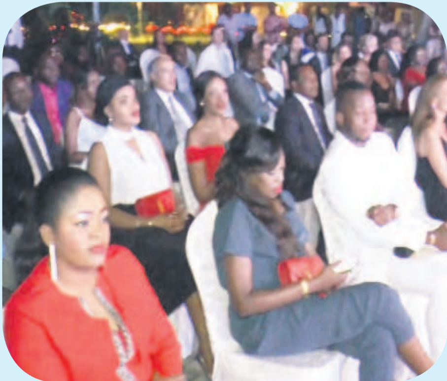
Une vue des diplomate