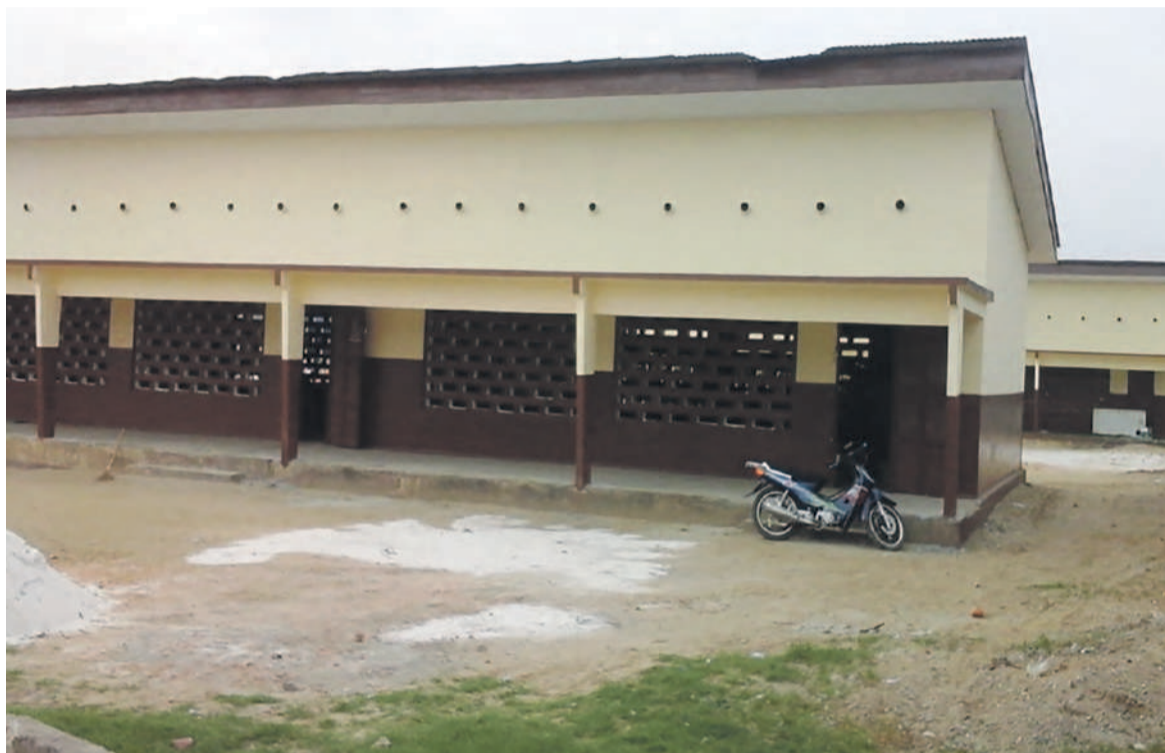
Un des bâtiments renoués

L'école Lien-Athanase-Dambou située à Lumumba 3 secteur Mawata a fait peau neuve et brille tel un beau bijou. L'action de Maurice Mavoungou est la réponse aux cris du cœur des directeurs de cette école ainsi que des parents d'élèves qui souhaitaient la sécurisation et les bonnes conditions de travail