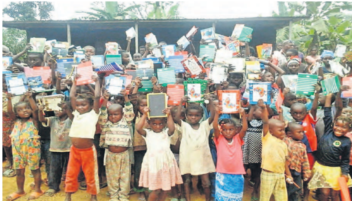
Les enfants de Mboukou et leurs kits scolaires