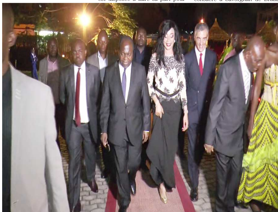
Arrivée du 1 er ministre Clément Mouamba à la cérémonie