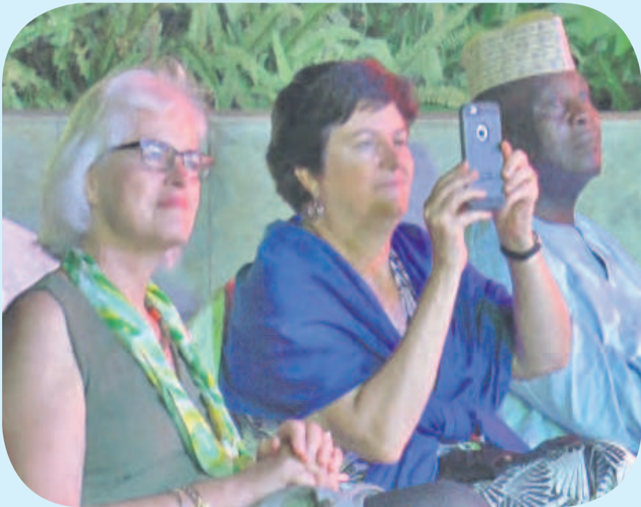
Une vue du défilé