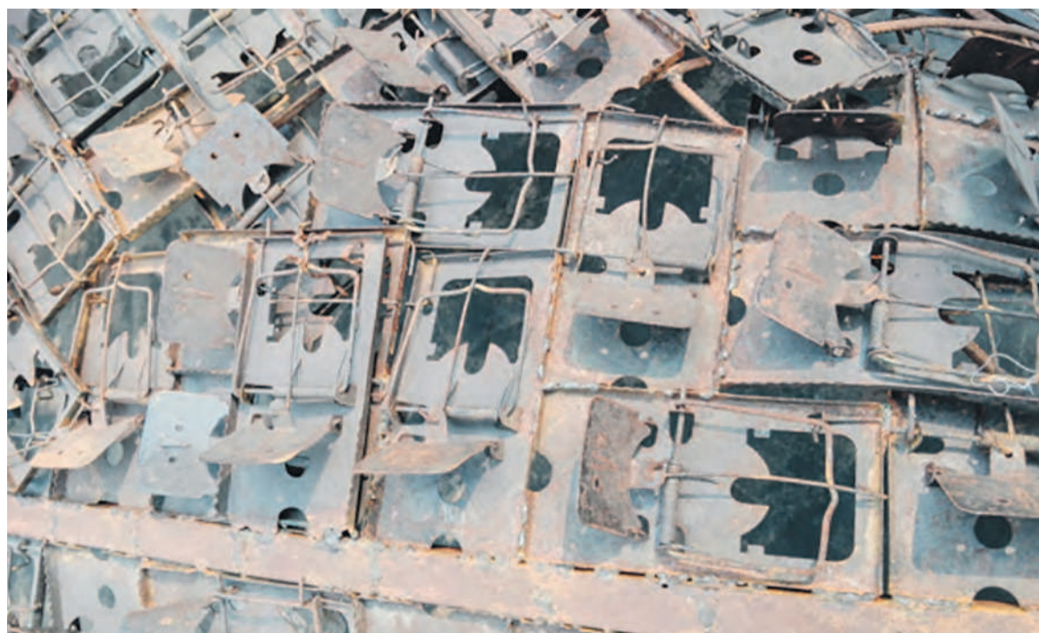
œuvre de Freddy Tsimba réalisée à l'aide de pièges à souris

Les œuvres de Freddy Tsimba vont constituer le nouveau décor de la salle d'exposition de l'Institut français de Kinshasa (IF) pendant plus d'un mois, soit du 14 octobre au 26 novembre. Savoir que ce sera la seconde qu'il y tiendra en l'espace de deux ans. En effet, sa première grande exposition en solo dans ce réputé centre culturel de la ville remonte à juin 2014. Le sculpteur, qui s'est forgé une solide notoriété son chalumau à la main s'employant coutumièrement à la soudure de matériaux divers, y revient avec un lot de ses dernières réalisations. Si les douilles et autres cartouches ont servi à la réalisation des premières œuvres qui font