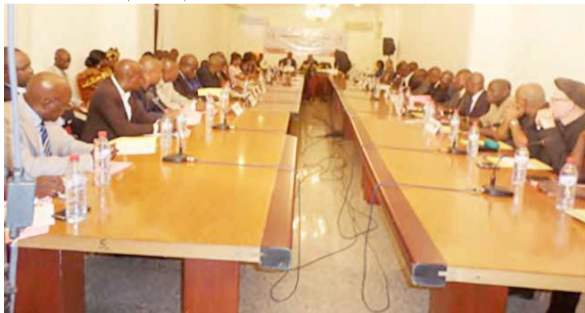
Les membres du Secrétariat permanent du Club 2002 PUR

« Nous les femmes, qui donnons la vie, ne pouvons accepter une situation dans laquelle la vie des femmes, des enfants