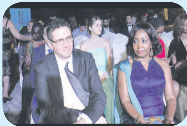
Une vue des diplomate