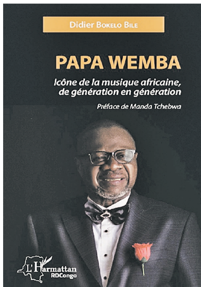
La couverture de l'ouvrage

Et le témoignage extrait de « son petit village urbain » « Molokai », au cœur de Matonge », est plus que jamais convaincant sur ces traits de caractères qui sont reconnues à l'illustre disparu. En effet, souligne-t-on, dans ce milieu-là, « on le dit pétri de bonté et de sagesse, parce qu'il en était « le chef coutumier ». Bien plus, précise-t-on encore : « Dans ce beau monde de bons vivants, juvénile jusqu'au bout de l'aventure, il incarnait l'espérance de toute une jeunesse qui, sur ses pas, s'est mise soudain à s'inventer des édens de jouvence bercés, depuis plus de trois décennies, par des textes et mélodies taillés dans du marbre sonore ». Et de conclure de la sorte : « Papa Wemba était, lui, de la race des optimistes