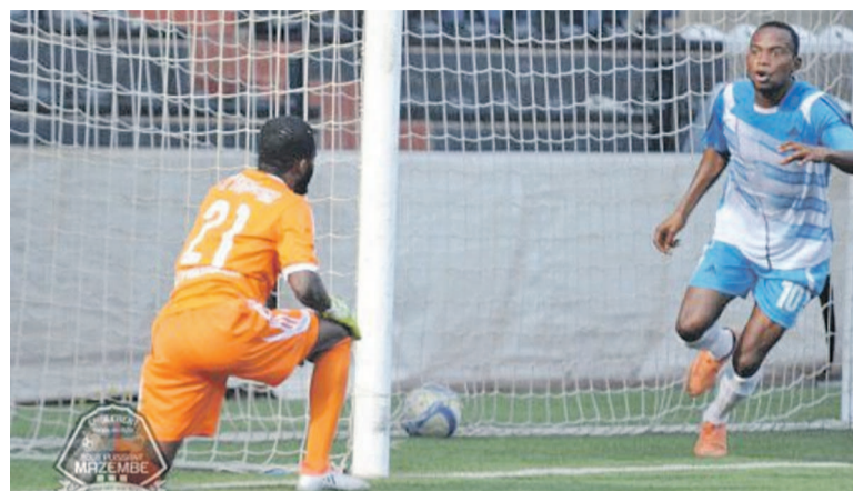
Vue du match entre Simba et Mazembe