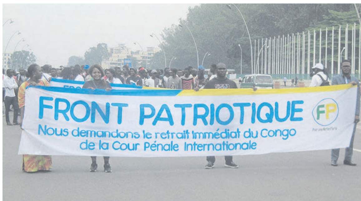
Une vue de la marche de protestation contre la CPI

Le Front Patriotique (FP) et le Mouvement Eveil 2020 (MR20) ont co-organisé, le 03 novembre, une marche populaire de protestation contre la Cour pénale internationale. Objectif : solliciter des autorités compétentes congolaises le retrait immédiat du pays de cette juridiction internationale.