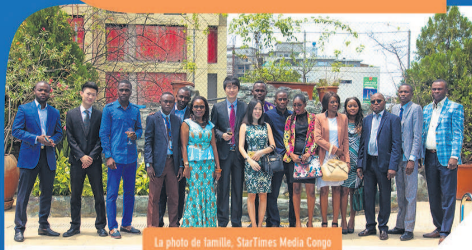
La photo de famille, StarTimes Media Congo