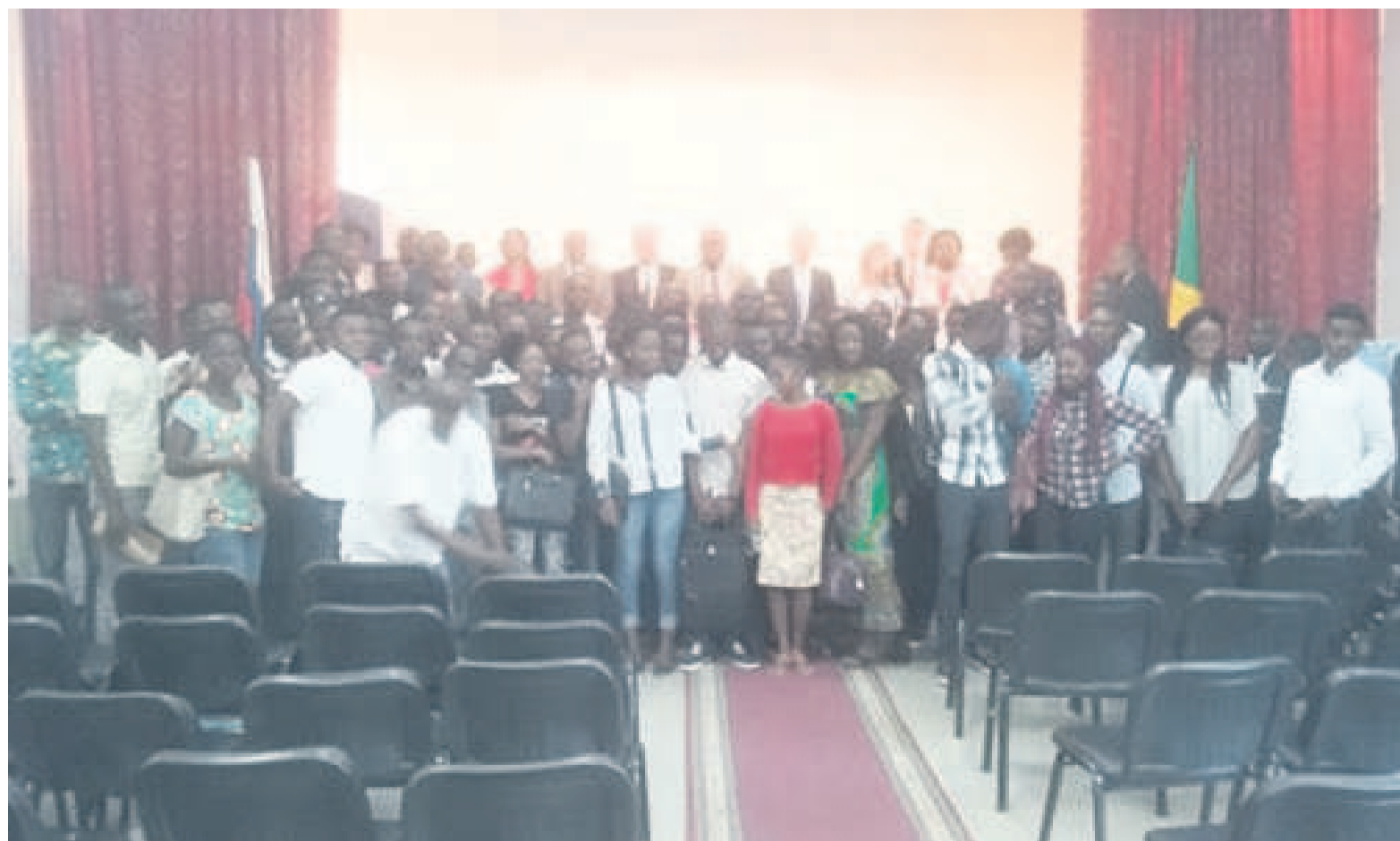
Photo de famille avec les étudiants bénéficiaires de la bourse de la fédération de Russie

Au total, 79 étudiants congolais partent cette année pour la Russie. Le ministre de l'Enseignement supérieur a précisé aux étudiants qu'au sein de l'ambassade du Congo en Russie, il y a un représentant de l'enseignement secondaire qui anime le service pédagogique. « Nous allons moderniser le fonctionne-