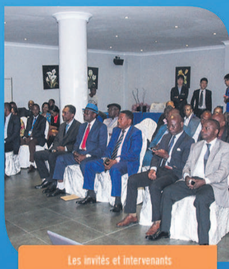
Les invités et intervenants

A la différence d'autres opérateurs, StarTimes Media Congo propose un nouveau type de décodeur de type DTH en haute définition incluant une parabole au prix de 10.000 FCFA . Ce décodeur est accompagné de deux bouquets principaux à savoir :