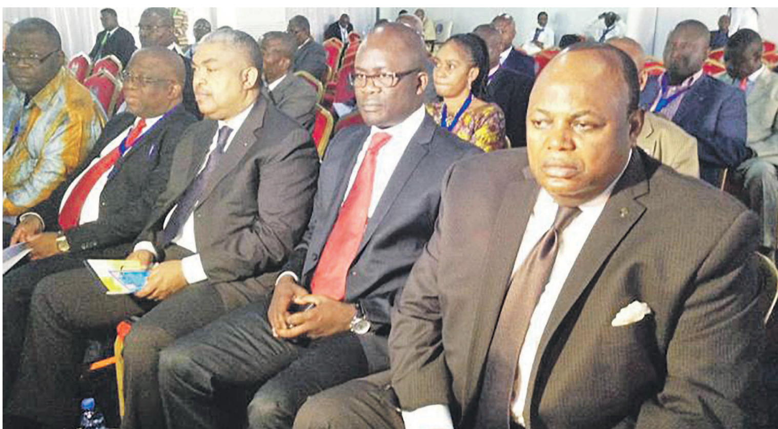
Des délégués de l'opposition au dialogue national