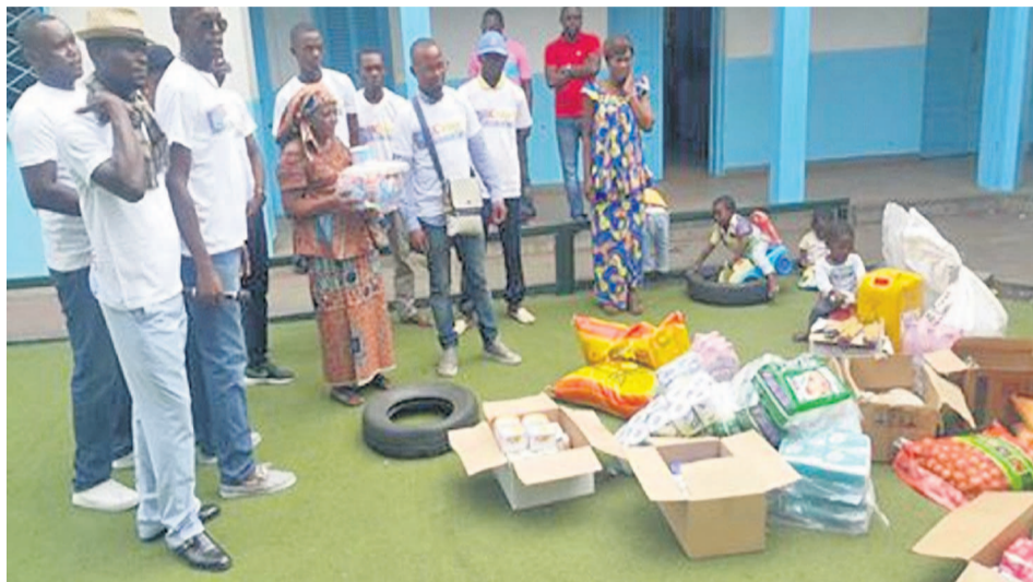
Un don de l'association Brac services dans un orphelinat de la place