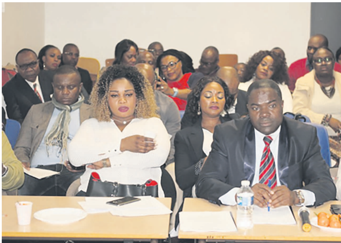
Bureau exécutif de l'Assocreef.

saire de l'association, bien que ce point n'ait pas été inscrit à l'ordre du jour, plusieurs membres ont insisté pour obtenir la diversification des activités. « Il est temps de mener des actions caritatives en faveur des populations congo-