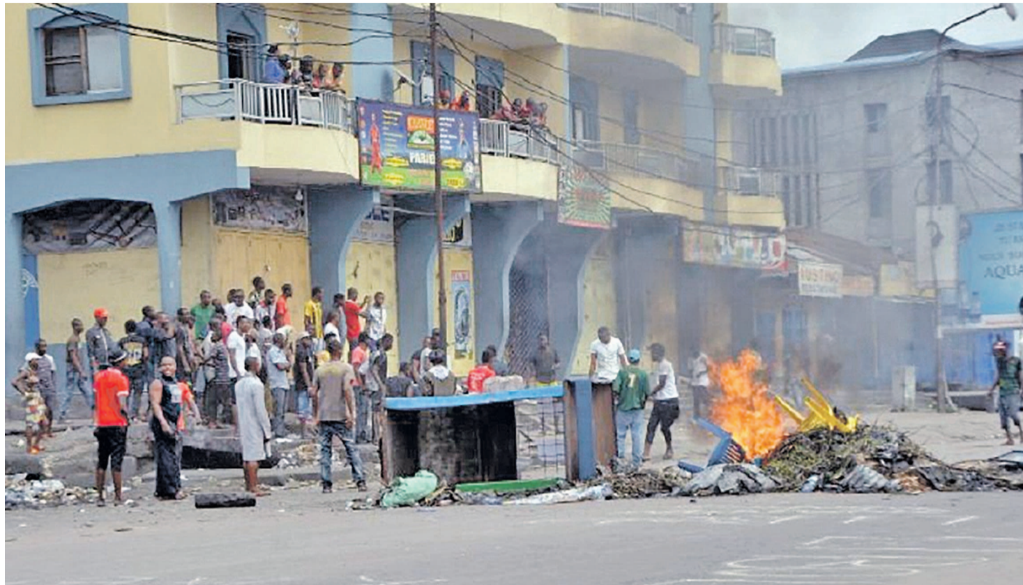
Des jeunes kinois barricadant une avenue, lors des manifestations du 19 et 20 septembre 2016

Par rapport aux droits et libertés fondamentaux, la délégation du CS est exhortée à appeler au respect des droits fondamentaux garantis par les instruments internationaux et la Constitution de la RDC. Ceci devra conduire le gouvernement, ont noté ces scientifiques, à cesser de fermer et de brouiller le signal des médias, couper l'Internet, empêcher des manifestations