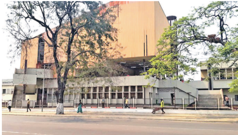
Le bâtiment d'un institut