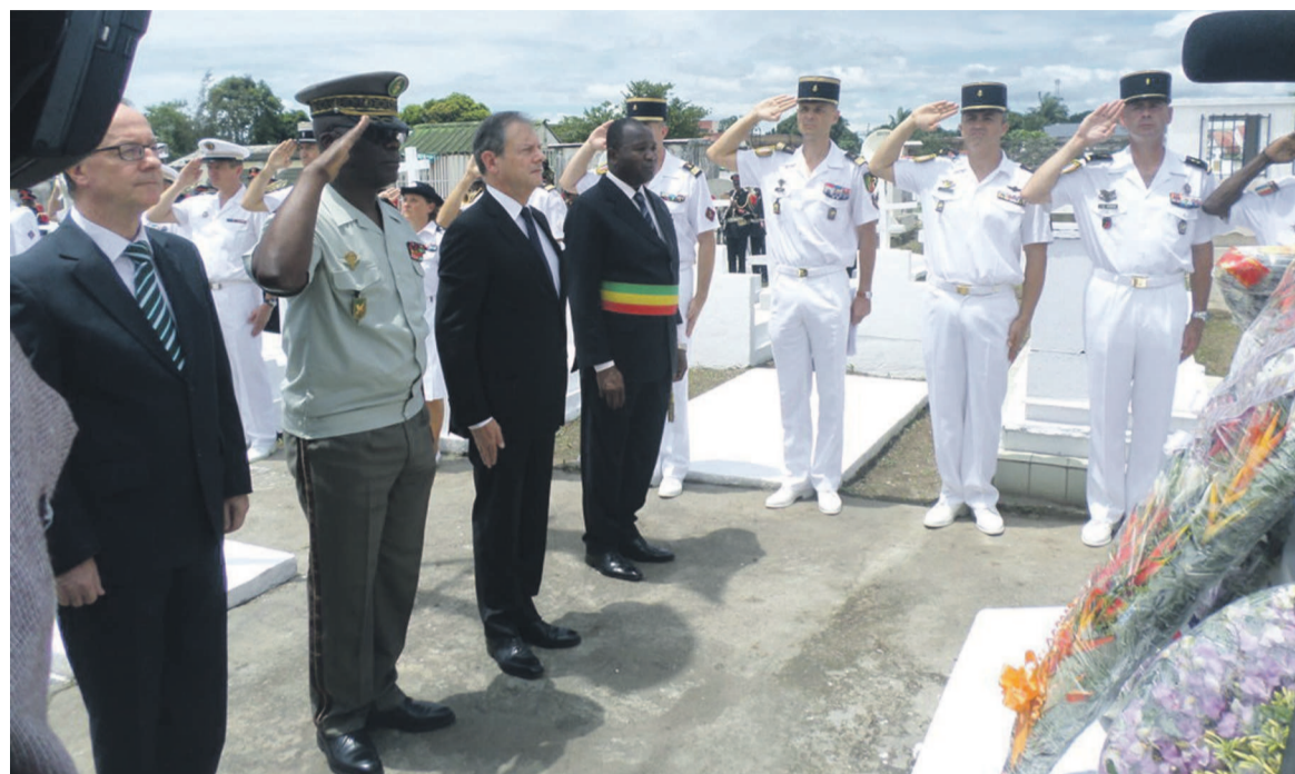
Dépôt de gerbes de fleurs

La date du 11 novembre commémore la signature de l'Armistice à Rethondes entre la France et l'Allemagne, qui met fin à la Première Guerre mondiale. Pour la énième fois de son histoire la République du Congo s'est associée à la France pour marquer cette journée spéciale de son empreinte.