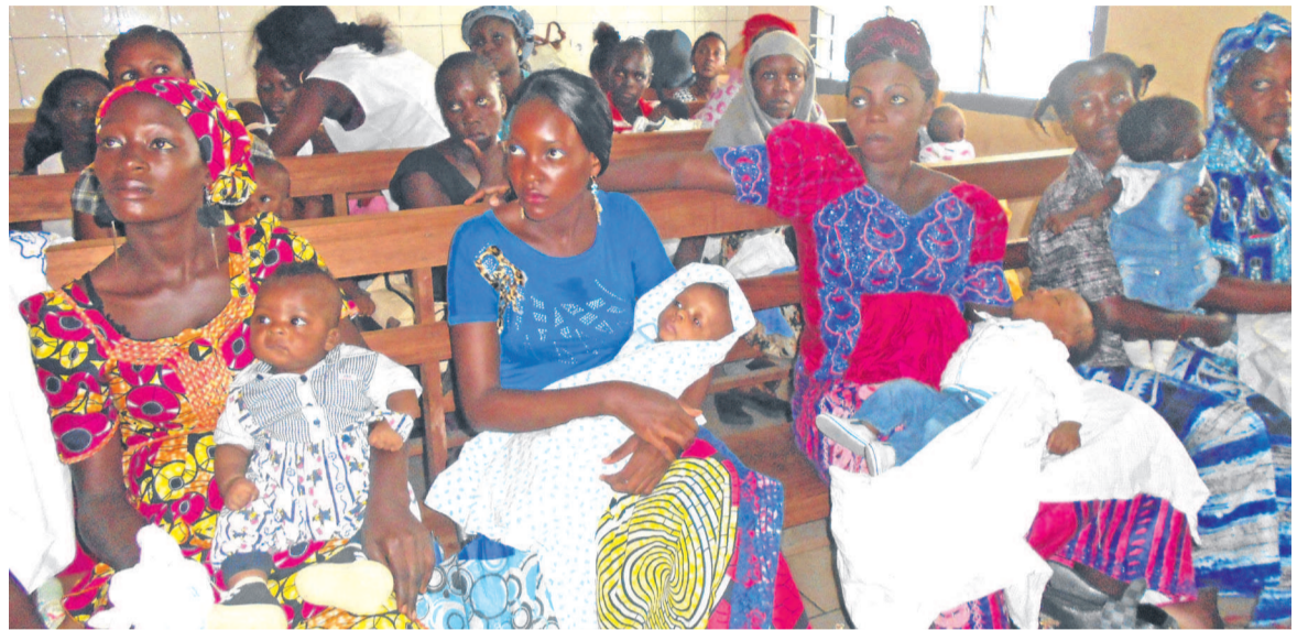
Les femmes en consultation (adiac)

Le Comité départemental de coordination et de suivi (CDCS) du programme de développement des services de santé (PDSS II) a validé, le 10 novembre, les factures consolidées de l'année en cours des structures de santé publiques et privées en contrat avec le PDSS II, programme cofinancé entre le gouvernement congolais et la Banque mondiale.