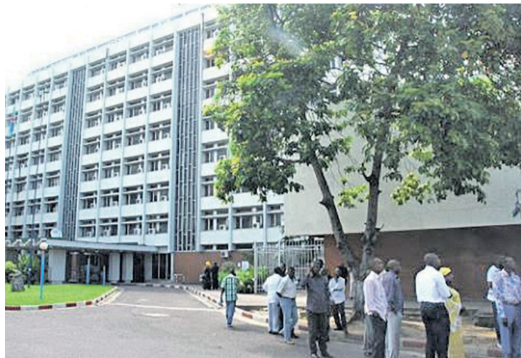
Le ministère des Affaires étrangères à Kinshasa

Au ministère des Affaires étrangères à Kinshasa, rien ne tourne. Tous les services sont paralysés depuis quelques semaines déjà par une grève qui ne faiblit pas. Bien au contraire, chaque jour qui passe voit les grévistes radicaliser leur mouvement au grand dam des demandeurs des passeports et autres services. « Même le service minimum est hors service », apprend-on. Préférant l'air libre à l'air conditionné de leurs bureaux, les agents postés souvent à l'entrée de leur bâtiment n'ont qu'un seul discours dans leur bouche : le paiement illico presto de leurs primes et indemnité permanente. Celles-ci équivalent, d'après des sources contactées sur place, à 5% de la production du ministère, soit deux millions de dollars par mois. Là où le bât blesse, c'est que depuis 1998, ces sommes n'ont jamais été payées sans qu'aucune explication plausible ne rassure les agents quant à la volonté du gouvernement à décanter la situation. Bien au contraire, fait-on savoir, l'exécutif national paraît se complaire de la situation. Après avoir tenté une médiation au lendemain du déclenchement de la grève le 1er août avec le syndicat des diplomates, laquelle grève s'est terminée en eau de boudin sans engagement ferme de répondre aux exigences des grévistes, le gouvernement s'est depuis lors retranché dans un mur d'ivoire, ne pipant mot sur ce débrayage qui pourtant dessert l'État congolais.