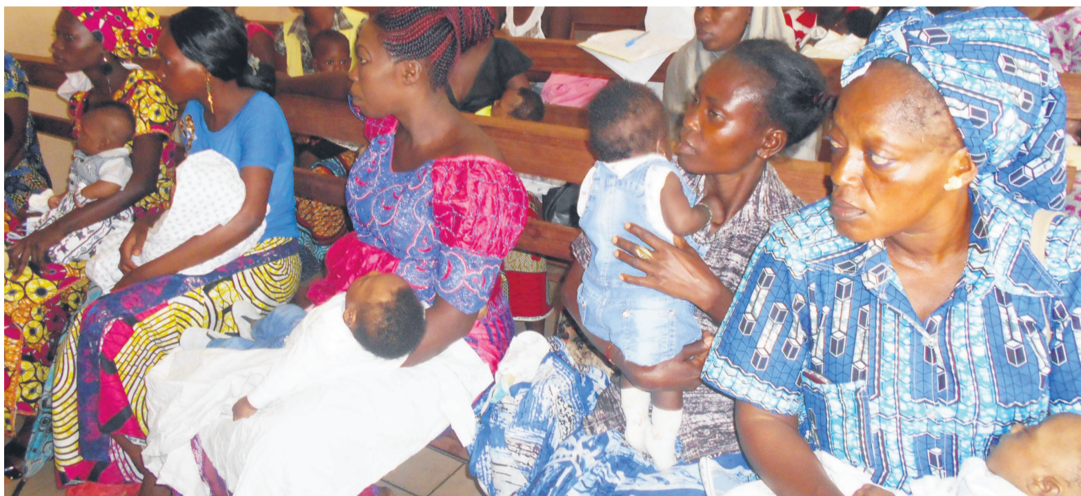
Des femmes en consultation