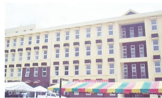
Une façade d'un nouveau bâtiment bagatelle de 5,8 milliards FCFA financés totalement par la partie chinoise. Page 4

Fruits de la coopération entre la Chine et le Congo, les travaux de ces immeubles R+3 et R+1 et leur équipement ont coûté une