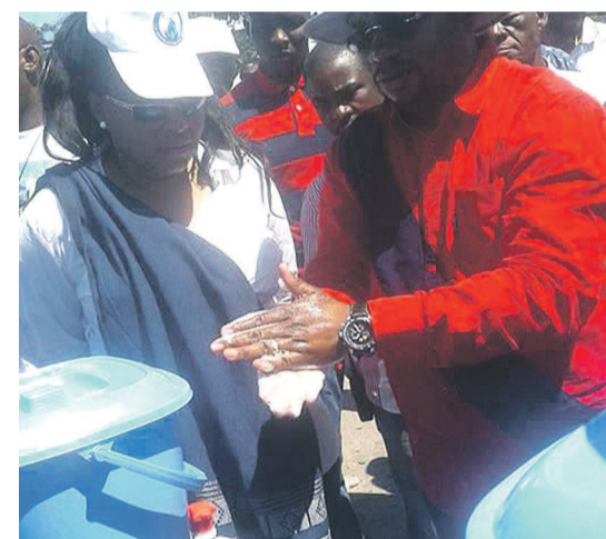
Le ministre de la Santé publique fait une démonstration de lavage des mains

En plus des lave-mains, le ministre de la Santé pu-