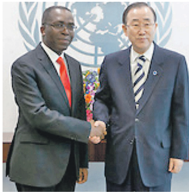
Matata et Ban Ki-moon

Le secrétaire général de l'ONU, Ban Ki-moon, a remercié le Premier ministre sortant de la RDC, Augustin Matata Ponyo, pour son leadership pendant les quatre années passées et il est désireux de travailler avec le gouvernement conduit par le nouveau Premier ministre Badibanga nommé par le président de la République, Joseph Kabila. Ceci ressort d'un communiqué de presse publié le 17 novembre par le porte-parole du secrétaire général de l'ONU. Réagissant après la nomination le 17 novembre du Premier ministre Samy Badibanga Ntita conformément aux résolutions de l'accord politique du dialogue national inclusif, le secrétaire général de l'ONU a pris acte de cette nomination. « Il a félicité cette première étape concrète dans la mise en œuvre de l'accord politique censé culminer avec la tenue des élections cré-