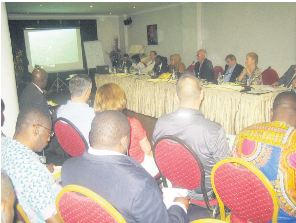
Les participants lors des discussions