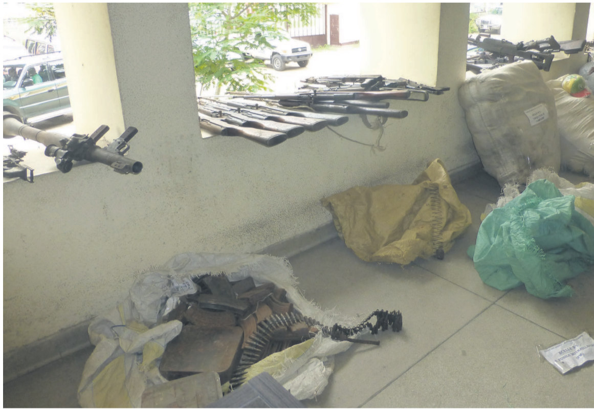
Une vue des armes et munitions

« Il reviendra dans le cadre de cette procédure au doyen des