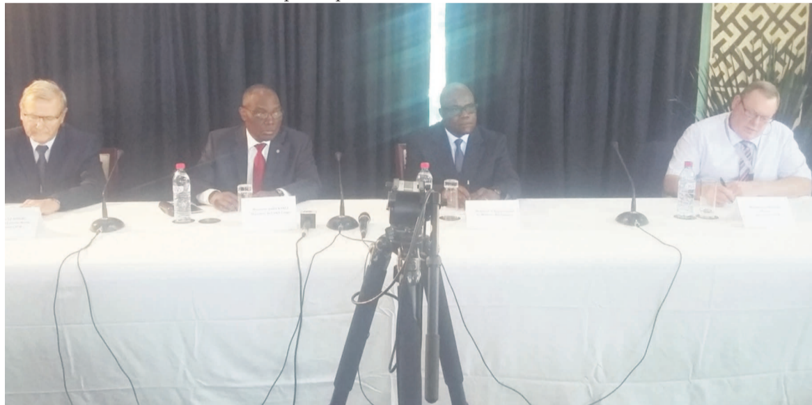
Le présidium des travaux à l'ouverture