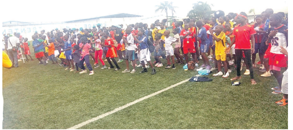
Vue des enfants lors de la deuxième édition

« On a parfois des vies professionnelles un tout petit peu dense et cela ne consti-