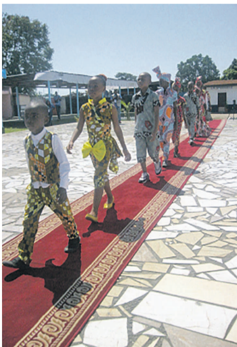
Le défilé des enfants

Dans son mot de circonstance, Fabien Obongo a rappelé que cette activité était importante pour les enfants mais également pour les parents. « Nous sommes ici pour assister à l'explosion de talents cachés qui se trouvent en nos enfants, pour votre gouverne, l'art est une notion divine, il vient en se-