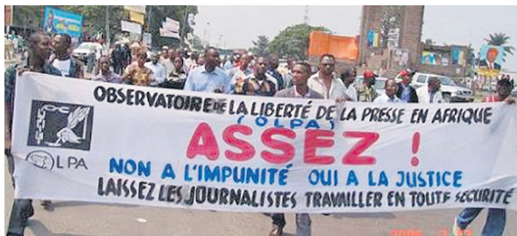
Une banderole arborée par Olpa lors d'une manifestation des médias à Kinshasa

Pour cette ONG, l'action recommandée devra permettre à identifier les commanditaires et les exécutants de ces attaques, et les déférer devant les instances judiciaires compétentes afin qu'ils répondent de leurs actes.