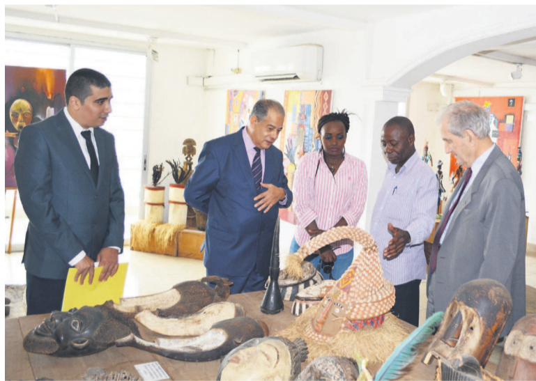
L'ambassadeur Mohamed Benattou appréciant les oeuvres d'art à la galerie Bassin du Congo

Après une visite des locaux du journal Les Dépêches de Brazzaville qui l'a conduit à la salle de rédaction, ainsi qu'aux ateliers de montage et d'impression, l'ambassadeur d'Algérie au Congo,