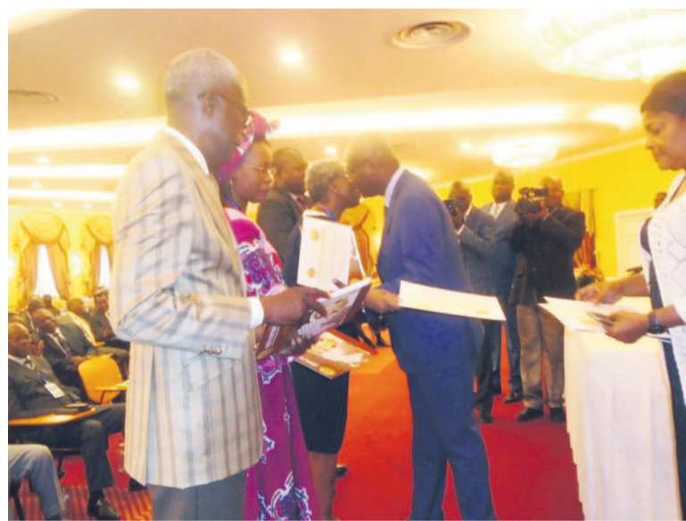
Le secrétaire général de présidence remettant les attestations de fin de formation aux participants

les participants ont émis le souhait d'adapter les techniques GPEC au système administratif de la présidence et d'élaborer une lettre d'orientation destinée à la direction des ressources humaines. Ils ont ensuite suggéré que les compétences du personnel soient dorénavant évaluées conformément aux standards internationaux.