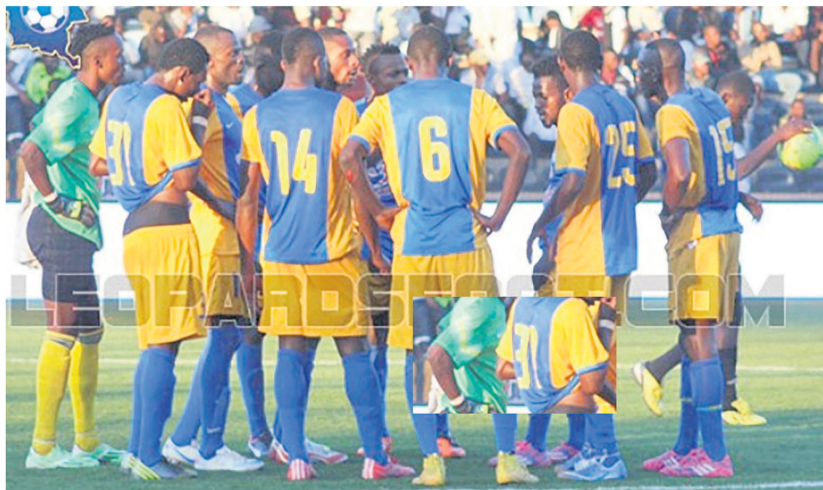
Le FC Saint-Éloi Lupopo de Lubumbashi

Au classement, le Racing Club de Kinshasa rejoint le FC Renaissance de Kinshasa (ac-