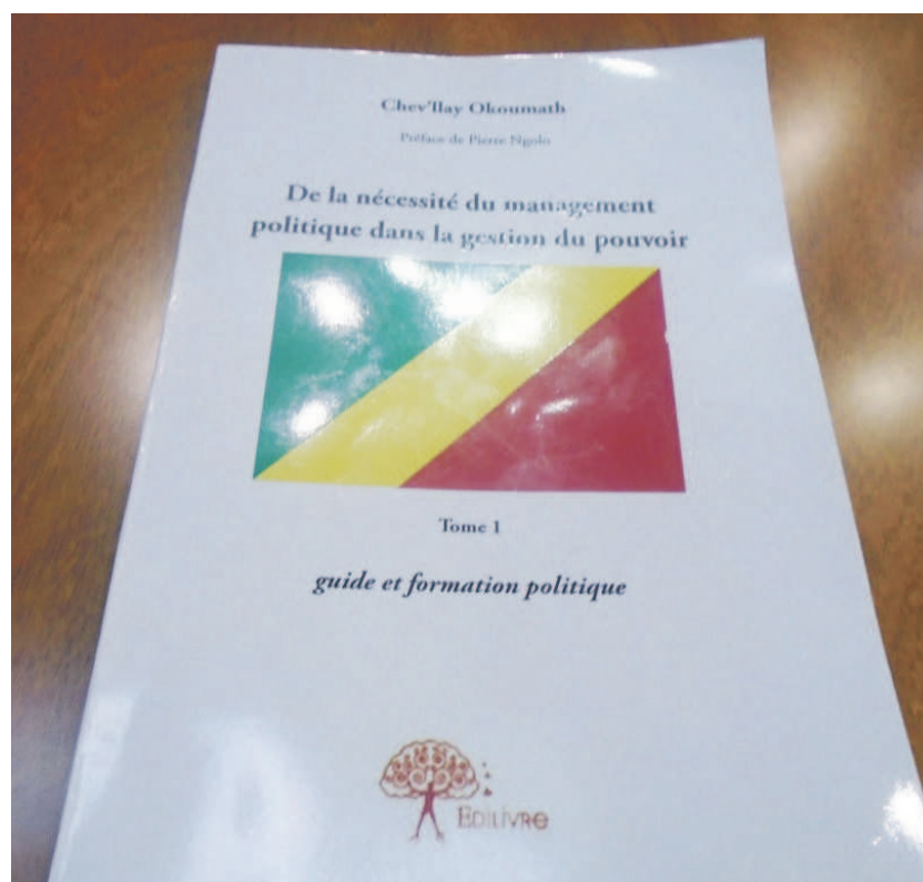
La couverture du livre photo Adiac

riges africains de s'imprégner de l'idéal de la social-démocratie. « Le fondement principal de cet ouvrage est de contribuer à redonner confiance aux politiques africains, à s'inspirer de l'idéal de la social-démocratie. En leur faisant comprendre la profondeur des concepts, les approches idéologiques par rapport aux enjeux de la politique internationale (...) », a affirmé l'auteur sur la quatrième de couverture de son livre.