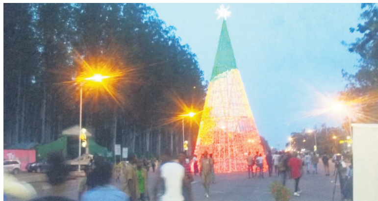
Le Marché de Noël arborant les couleurs nationales

marché ; d'où le concept « Marché de Noël au parfum du tourisme ». Parlant de la particularité de ce marché, le directeur de cabinet a