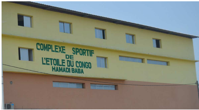
Le complexe sportif abritant le siège de l'Etoile du Congo.