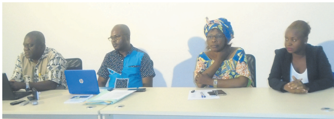
Quelques responsables d'ONG à la clôture de l'assemblée générale

La plate-forme Dette et développement au Congo a vu le jour le week-end dernier à Brazzaville, à l'issue d'une assemblée générale constitutive. Elle est formée par vingt-sept organisations de la société civile parmi lesquelles l'Association des juristes sans