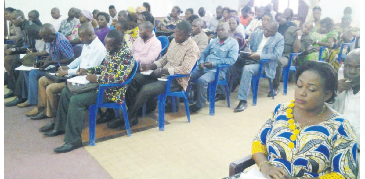
Une vue des contrôleurs lors de leur rencontre avec le ministre de tutelle

Car, l'état des lieux qui a été fait par les services de tutelle révélait quelques insuffisances dues au chevauchement des missions entre les services, au non-respect des procédures de travail, notamment le contrôle et le recouvrement des amendes. On signa-