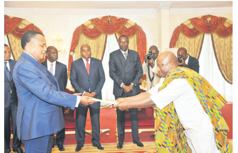
L'ambassadeur du Ghana transmettant sa lettre de créance au chef de l'Etat