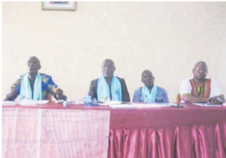
Le présidium