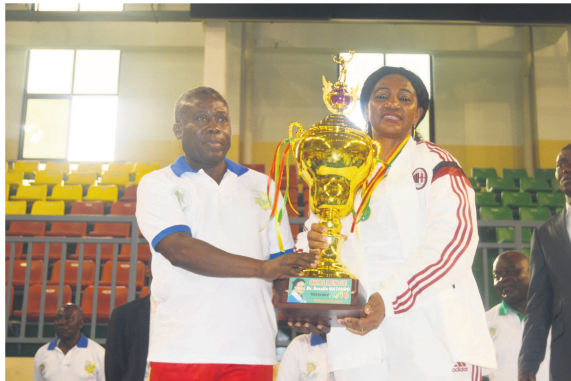
La ministre Rosalie Matondo recevant son trophée de vétérane

« L'honneur que la Fédération congolaise de volleyball me fait aujourd'hui me rappelle les souvenirs de mon jeune âge dans cette discipline. Je serai toujours là pour apporter un plus afin que le volleyball congolais aille de l'avant », a indiqué la vétérane