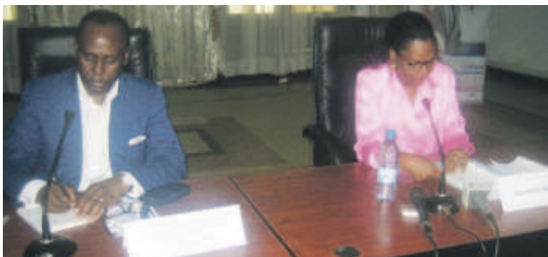
Le présidium de l'atelier

La Chambre de commerce de Brazzaville a affiché sa volonté d'accompagner ce genre d'initiative. Après s'être engagé à subventionner les frais d'adhésion des cent nouveaux adhérents de