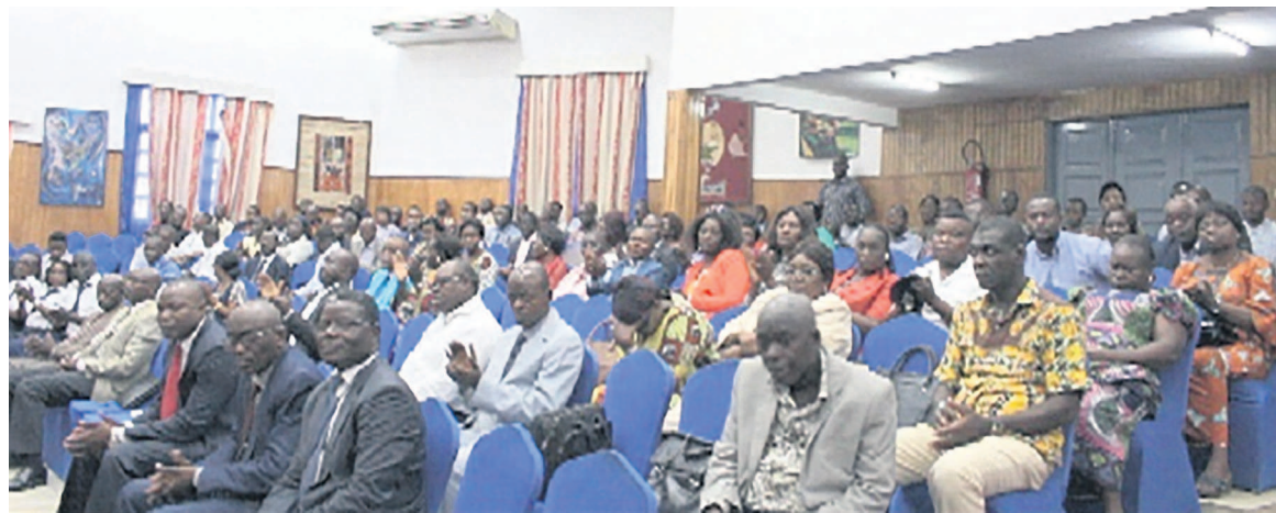
Une vue des participants

a rappelé aux participants les paroles du président de la République extraites de son discours prononcé au mois d'avril dernier, lors de son investiture, sur l'inauguration de la nouvelle République, lorsqu'il invitait chacun dans son domaine précis à créer la rupture avec les mauvaises manières d'agir et de servir l'Etat.