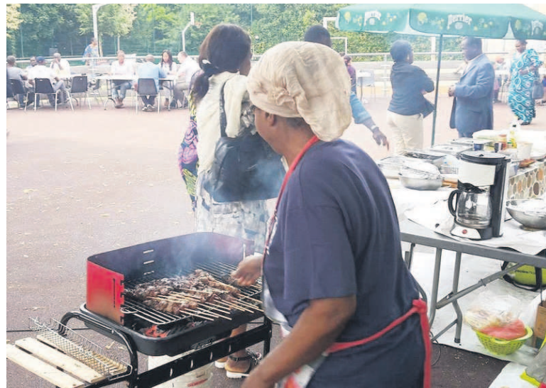
Décor en plein air de la Guinguette Africaine sur le plateau Mont Valérien de Suresnes près de Paris

Pour 2017, les organisateurs ont prévu une élection inaugurale « Mama Liputa - Miss Guinguette 2017 » pour le 24 juin, dans la salle des Landes à Suresnes, sur le chemin de la Motte. « Ce sera une grande soirée « Mama Liputa » qui portera les couleurs