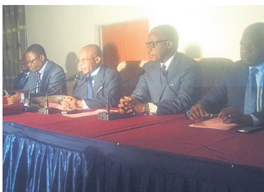
La tribune officielle lors de l'opération de lancement de l'enquête préalable

Après près de six ans de travaux préliminaires divers, le projet de la ZES de Pointe-Noire prend forme avec l'opération de lancement de l'enquête préalable dont l'objectif est d'informer et sensibiliser le public aux réalisations qui vont être faites dans ladite zone. La ZES de Pointe-Noire s'étend