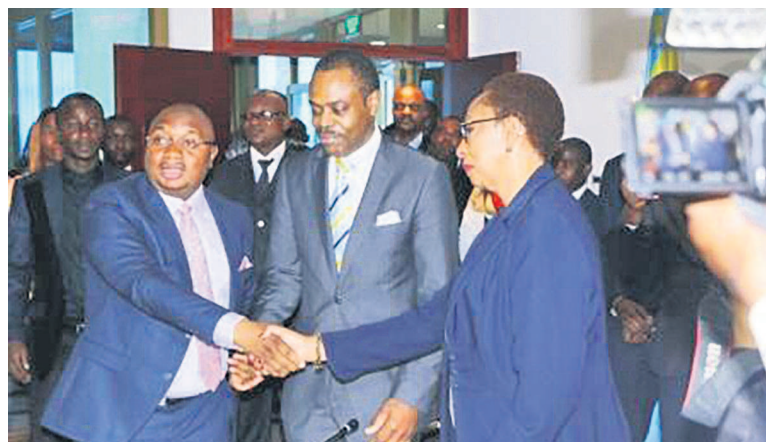
Le ministre sortant de la Santé saluant le nouveau ministre et le vice-ministre de la Santé