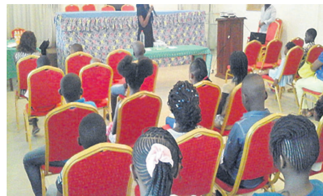
Une vue de la salle lors de la sensibilisation