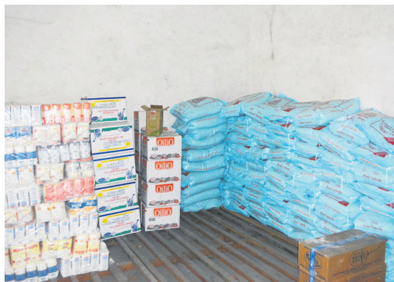
Un échantillon du don

Des dons composés de riz, d'huile, de lait etc, ont été destinés à la Maison d'arrêt de Ouessou, l'Union des associations des personnes handicapées du Congo, la Maison des séniors de Mfilou, l'hospice Paul Kamba, l'orphelinat