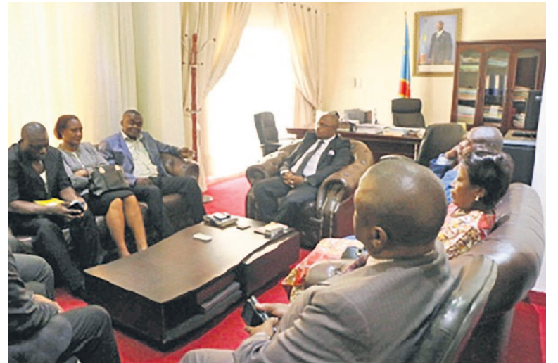
Kabange Numbi s'entretenant avec les députés du Haut-Lomami

Le ministre des Affaires foncières, Félix Kabange Numbi Mukwampa, peut compter sur l'appui et le soutien du caucus des députés du Haut-Lomami dans l'accomplissement de ses nouvelles fonctions.