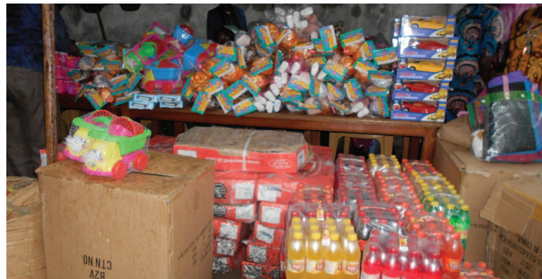
Des jouets prêts à être distribués aux enfants