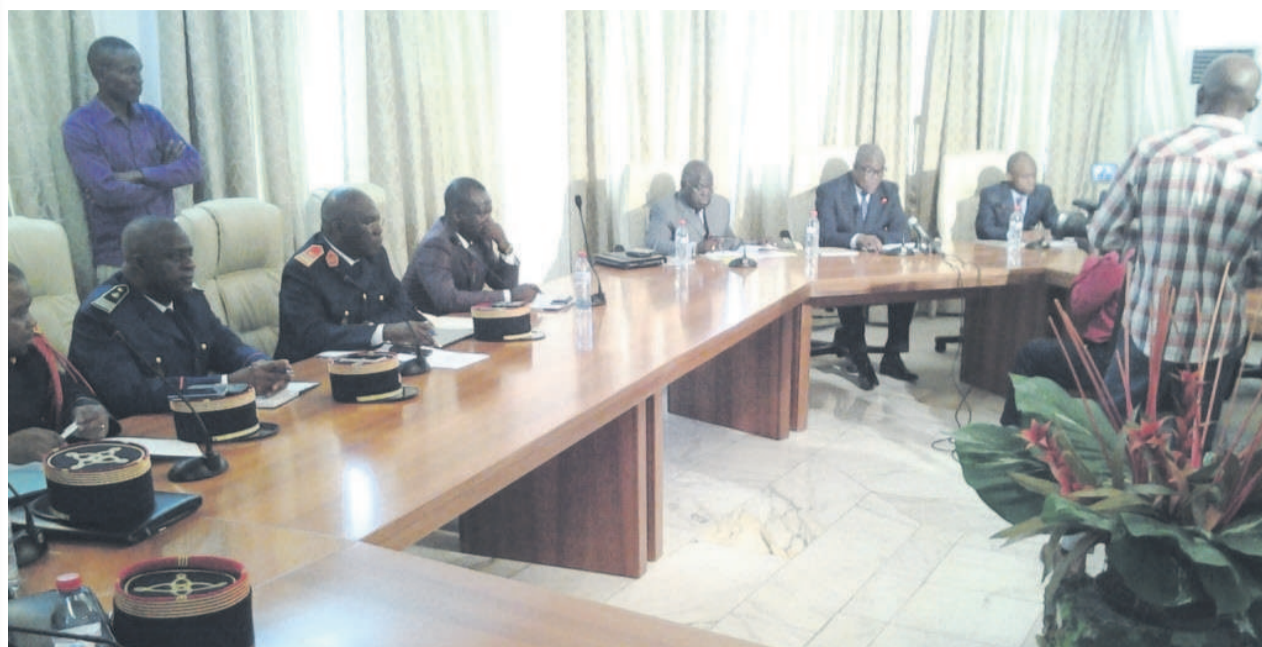
Une vue de la salle lors de la réunion

Les membres de la commission chargée d'évaluer les dispositions et informations des annexes de la convention de Kyoto révisée ont débuté le 5 janvier à Brazzaville un atelier de deux jours, en vue de préparer le draft d'adhésion du Congo à cette convention.