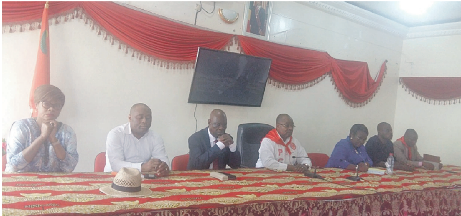
Tribune officielle des cérémonies