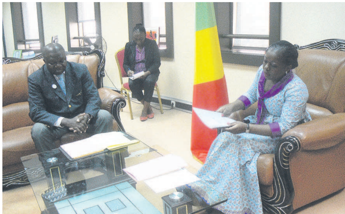
Le président de Aile cassée s'entretenant avec la ministre de la Jeunesse et de l'éducation civique

« Toutefois qu'elle aura besoin de nous et dès que la nécessité se fera sentir, nous serons toujours à ses côtés. Nous la suivons depuis qu'elle a été honorée. Nous aussi avons été honorés d'avoir un des nôtres à cette haute fonction qui a bénéficié de la confiance du président de la République », s'est rejoui le président de Aile Cassée, à l'issue d'une rencontre avec la ministre de la Jeunesse et de l'éducation civique. Il a par ailleurs informé que Destinée