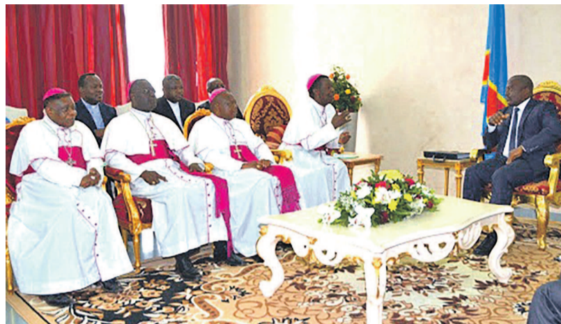
< Sans données à partir du lien >

de la mise en application de l'accord, de la composition du futur gouvernement qui aura comme Premier ministre un candidat du Rassemblement et de la composition du Conseil national de suivi de la transition.