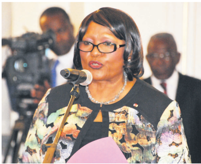
Marie-Charlotte Fayanga, doyenne du corps diplomatique