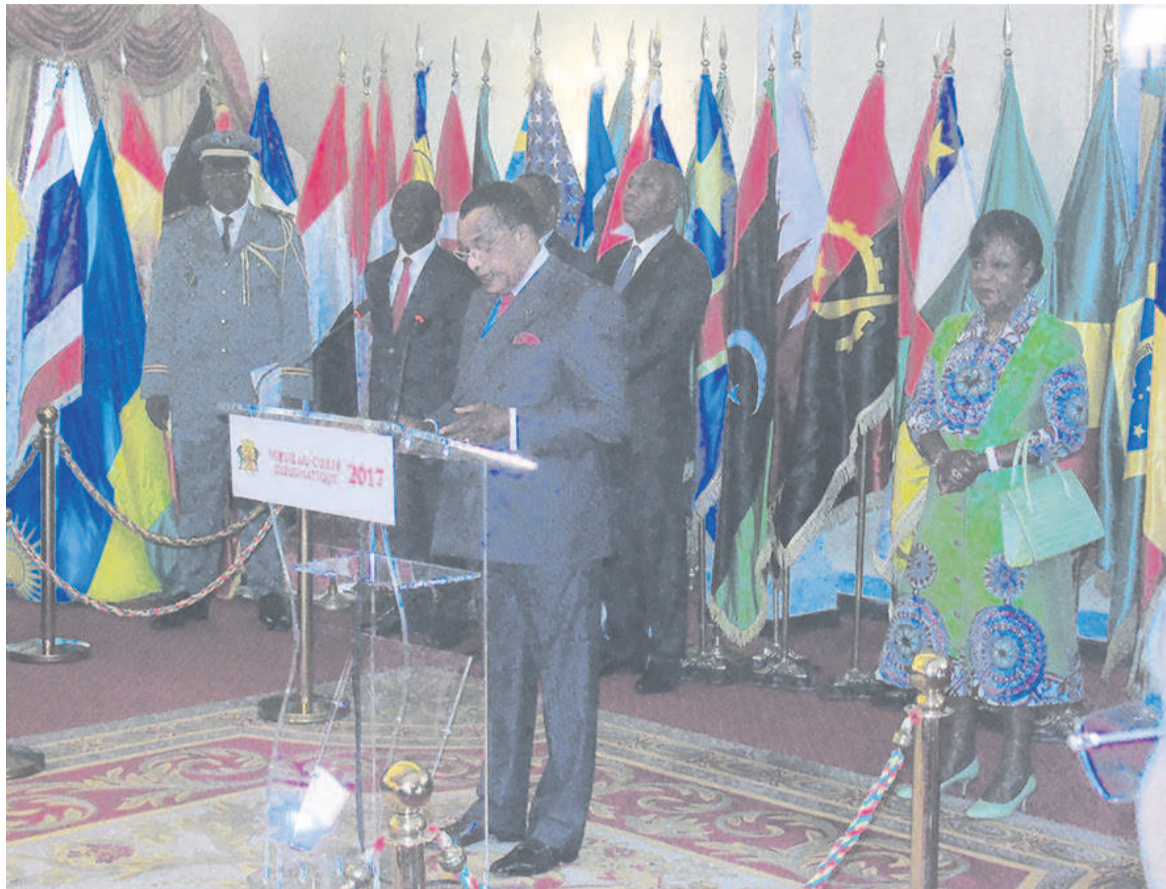
Le président de la République s'adressant aux ambassadeurs.

La doyenne du corps diplomatique a passé en revue la situation politique, économique et sociale du Congo pour l'année écoulée et prié le président de