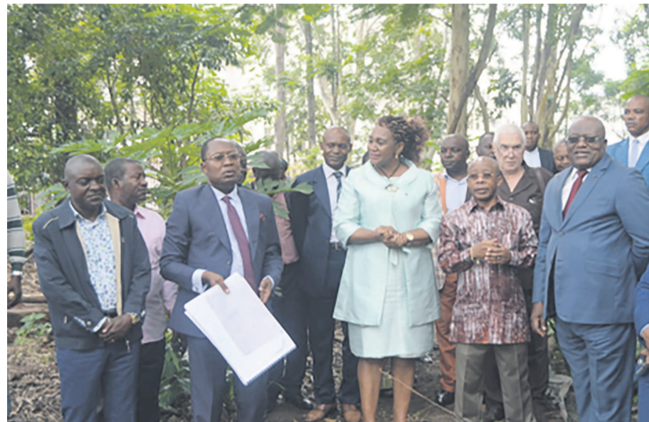
Les membres du gouvernement avec les responsables de la Fécofoot sur le terrain où sera construit le siège.

Après la procédure qui passe par le déclassé du domaine public où sera érigé le siège de la Fédération congolaise de football (Fécofoot) et l'attribution, les travaux de construction peuvent maintenant commencer, a expliqué l'architecte Gilles Prime.