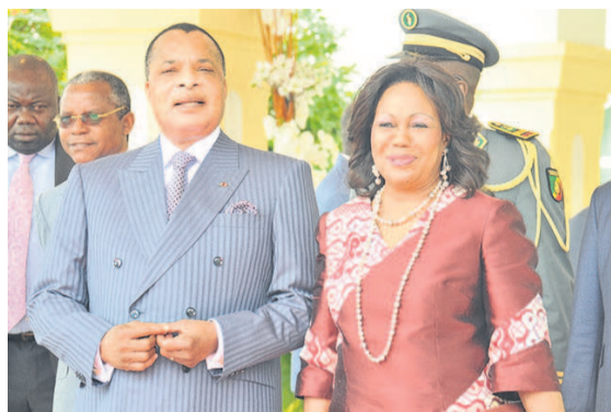
Le couple présidentiel