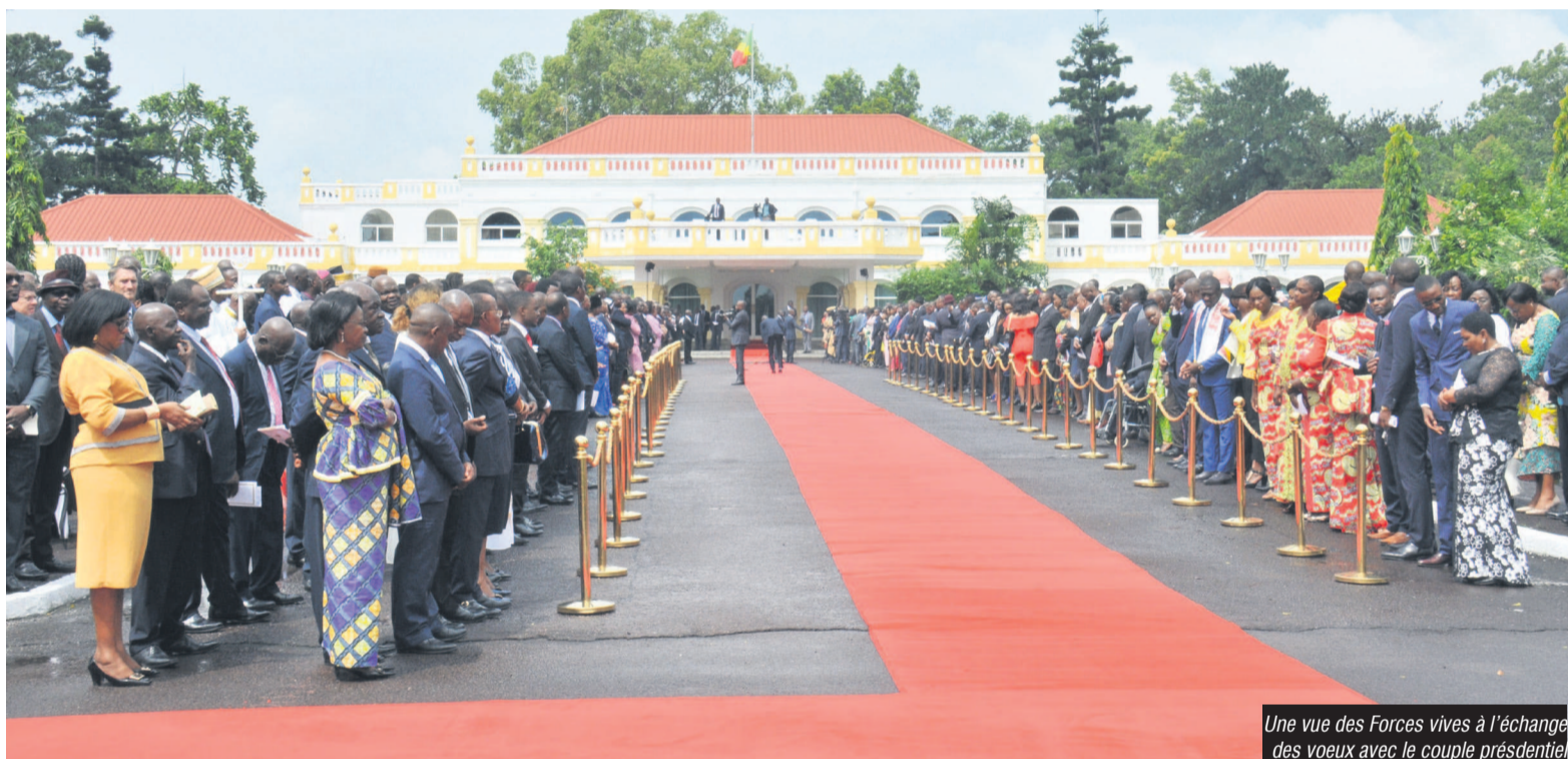
Une vue des Forces vives à l'échange des vœux avec le couple présidentiel