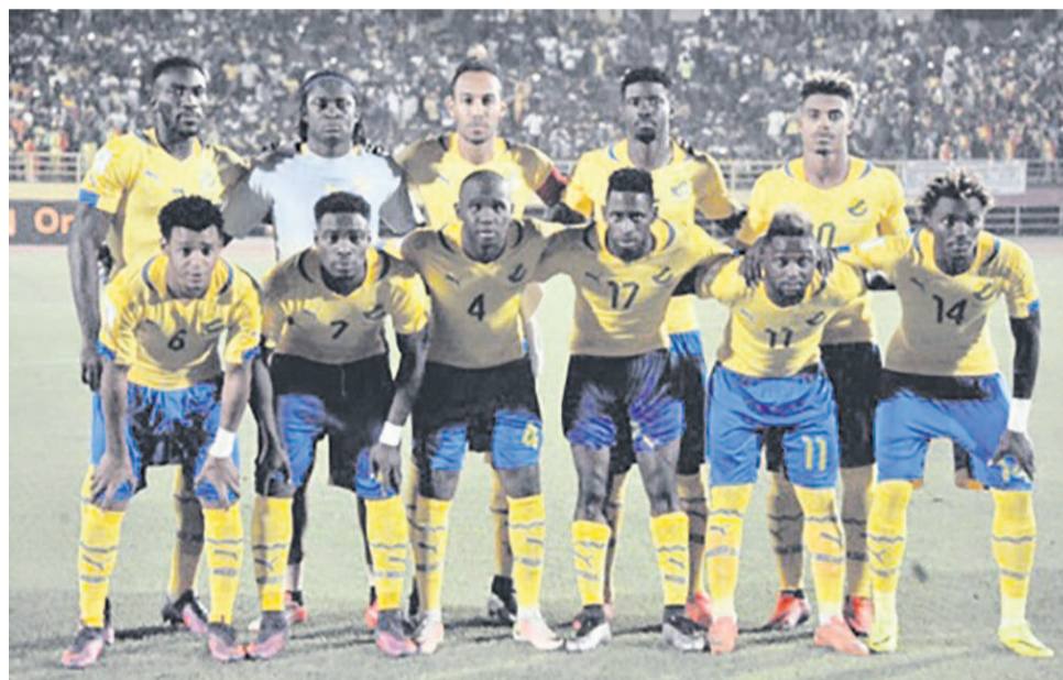
Les Panthères du Gabon de Pierre-Emerick Aubameyang ne bénéficient pas d'un contexte très favorable à une semaine de «leur» CAN