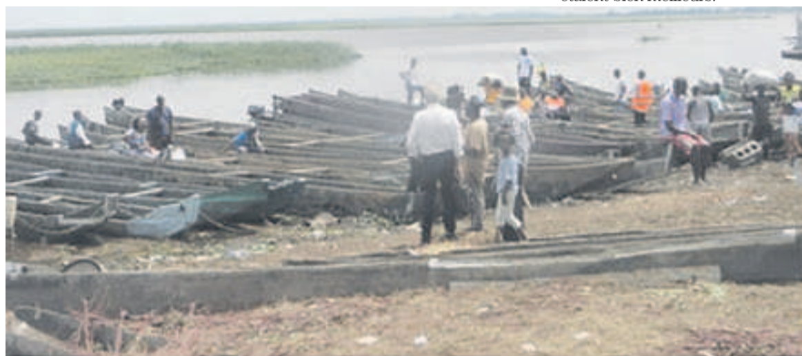
Le débarcadère des pêcheurs au port de Yoro