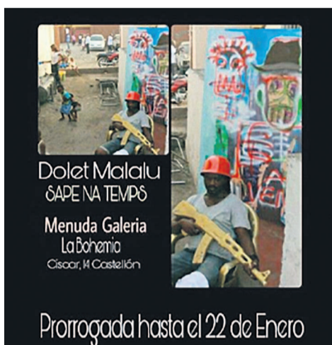
Affiche de l'exposition des œuvres de Dolet Malalu en Espagne

L'art de la République démocratique du Congo est à l'honneur à double titre, depuis le 17 décembre 2016 jusqu'au 22 janvier 2017 à la Menuda Galeria de Castellon, à 4 Km de Villareal où joue l'attaquant international congolais, Cédric Bakambu, en Espagne.