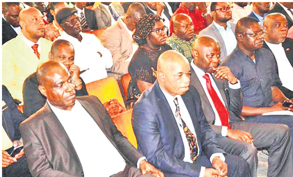
Les cadres de la Dynamique de l'opposition lors d'une activité

Qui succédera à Samy Badibanga à la tête de l'exécutif de la transition ? La question est au centre des préoccupations au sein du Rassemblement des forces politiques et sociales acquises au changement quoique jusque-là aucune option n'est encore été levée dans le sens du choix de la personne indiquée. Pour l'heure, la gestion des ambitions paraît difficile à gérer dans ce regroupement politique où chacune des composantes tente de jouer le tout pour le tout pour avoir droit de cité au prochain gouvernement. Dans l'informel, le débat est d'ores et déjà engagé. La Dynamique de l'opposition, une des grandes forces politiques au sein du Rassemblement, vient de donner le ton en se déclarant preneur au poste de Premier ministre. Jean Claude Vuemba, un des cadres de cette plate-forme, estime que cette dernière, en tant que fer de lance du Rassemblement, a le droit de prétendre à ce poste. Il est en avant du combat mené par la Dynamique qui a été sur tous les fronts en jouant un rôle-clé dans l'ouverture de l'espace politique. En vertu de cela, Jean Claude Vuemba pense que