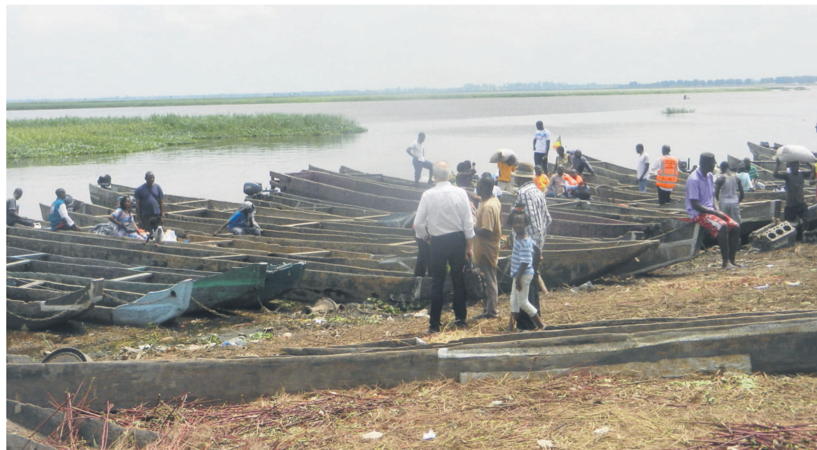
Le débarcadère des pêcheurs au port Yoro à Mpila

Parc à pirogues démolé à près de 90%, filets emportés, zones de pêche réduites, siège endommagé, tel est le tableau sombre que présente la coopérative des pêcheurs du port de Mpila-Yoro, dans le 6 e arrondissement de Brazzaville. Face à ces difficultés,