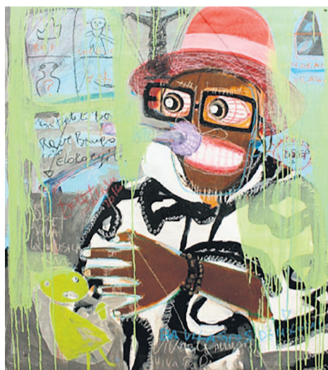
Papa Wemba peint par Dolet Malalu

ces termes : « Mon art exprime la face cachée de la sape, notamment par mon graphisme puéril et innocent, un peu comme si la sape était un jeu d'enfants auquel se livrent les sapeurs. Ces derniers étant capables des pires extrémités lors de leurs hostilités vestimentaires ou passent quatre vingt-dix-neuf virgule quatre vingt-dix-neuf pour cent de leurs revenus ! La sape est au cœur de la vie des jeunes gens de mon quartier à Kinshasa, et en tant que phénomène de société, la sape influence considérablement la jeunesse kinoise. Raison pour laquelle je me suis mis à peindre la sape. Ainsi, ma peinture est une fresque brossée, non sans une