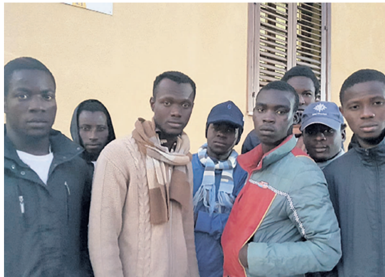
Des jeunes migrants africains à Lampedusa

Chaque année, de milliers de migrants en provenance de l'Afrique subsaharienne débarquent sur l'île italienne de Lampedusa. Notre journaliste Patrick Ndongidi est le premier reporter africain à s'être rendu sur cette île considérée comme la première porte d'entrée des migrants africains en Europe. Dans ce reportage, découvrez le récit glacial de quelques jeunes migrants qui ont, inconsciemment, bravé le danger et la mort pour fuir un quotidien où l'espoir n'était plus permis pour certains.