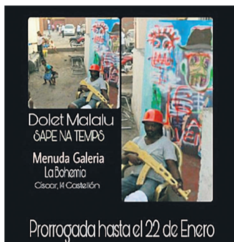
Affiche de l'exposition des œuvres de Dolet Malalu en Espagne

L'art de la République démocratique du Congo est à l'honneur à double titre, depuis le 17 décembre 2016 jusqu'au 22 janvier 2017 à la Menuda Galeria de Castellon, à 4 Km de Villareal où joue l'attaquant international congolais, Cédric Bakambu, en Espagne.