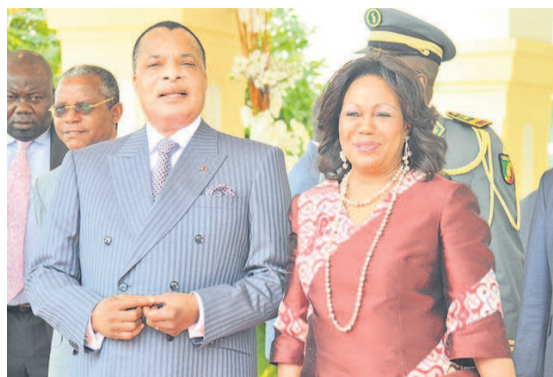
Le couple présidentiel