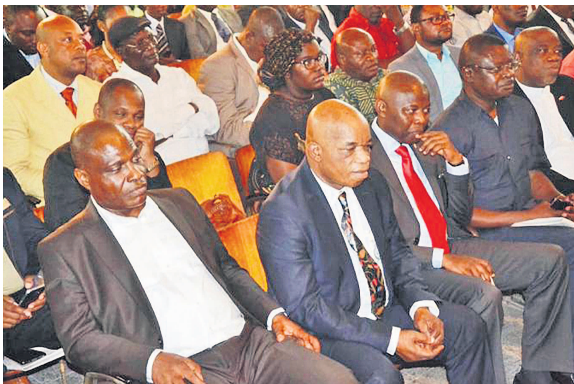
Les cadres de la Dynamique de l'opposition lors d'une activité