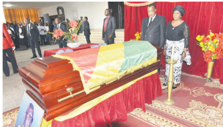
Le couple présidentiel s'inclinant devant la dépouille mortuaire

Au service de l'Etat et militant engagé du Parti congolais du travail, l'illustre disparu a, de son vivant, occupé plusieurs fonctions aussi bien au niveau administratif que politique. Page 2