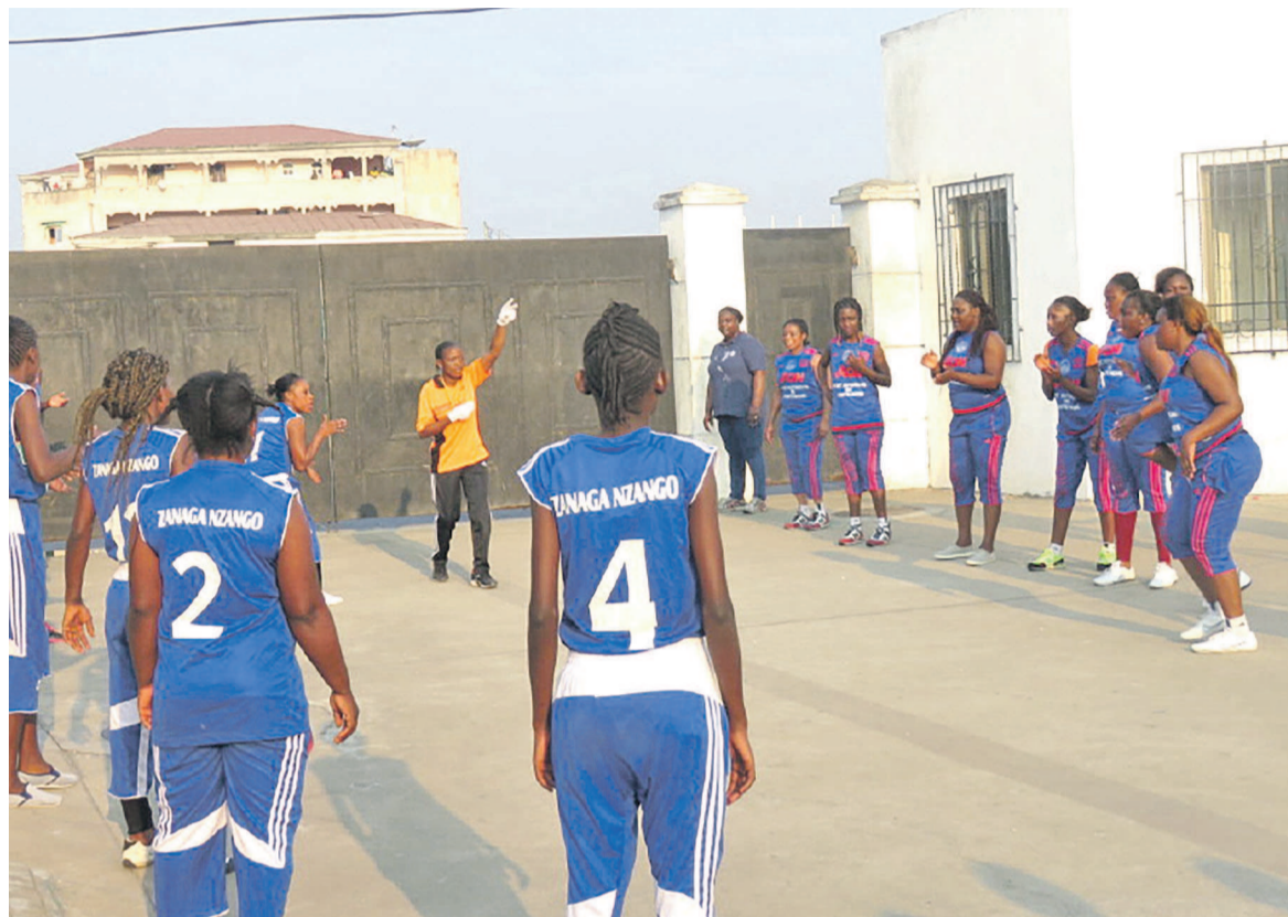
Des femmes congolaises jouant au nzango

Ce moment serait l'une des occasions pour les tenants des sports au Congo en général et dans les départements en particulier d'organiser des actions sportives féminines afin de mieux faire connaître l'univers du sport féminin, ses pratiquantes, ses athlètes de haut niveau et aussi présenter les possibilités offertes aux femmes pour pratiquer ou s'inscrire à un club sportif, à travers l'éventail des disciplines et des installations sportives existantes. Lors des Jeux africains 2015 par exemple, le Congo a obtenu une note très satisfaisante de la part des décideurs et acteurs sportifs internationaux en matière d'infrastructures sportives capables d'abriter n'importe quelle disci-