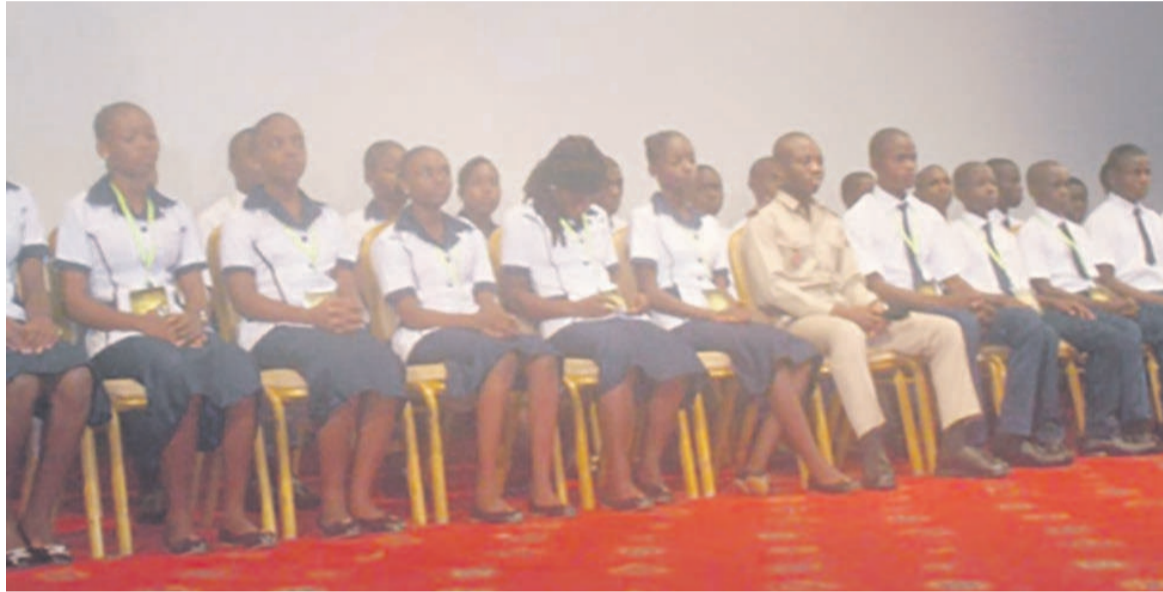
Les lauréats de 2015-2016