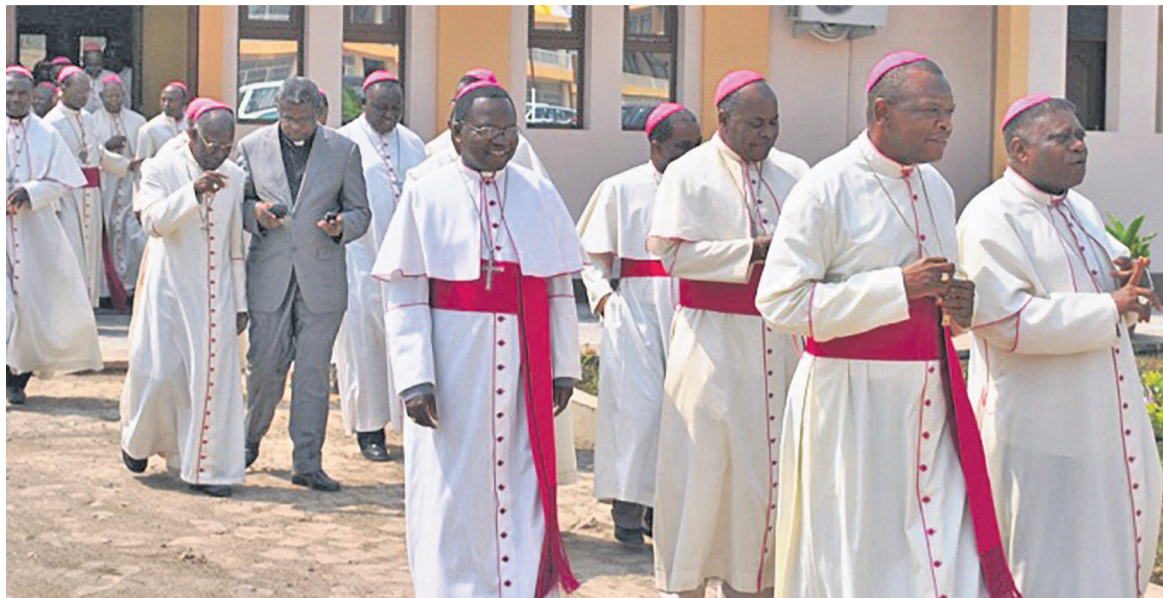
Des évêques catholiques

Si le choix porté sur Étienne Tshisekedi l'a été par consensus bien qu'il existe encore quelques contestations, il n'en est pas le cas de celui de son fils biologique Félix Tshisekedi pressenti futur Premier ministre de la transition. Pour le G7 qui ne trouve pas d'inconvenient que ce poste revienne à l'UDPS (parti phare du Rassemblement), cependant la personne à désigner n'aurait pas d'em-