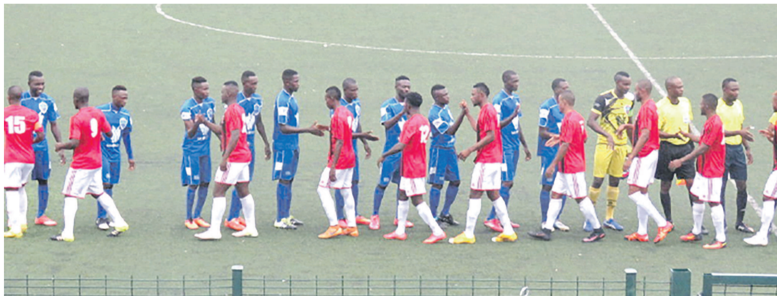
Salutation des joueurs des deux équipes

Quatre équipes de Pointe-Noire ont répondu à l'offre de Cara dans son objectif de jauger le niveau technique de ses hommes retenus pour deux événements sportifs décisifs dont l'équipe s'est engagée cette année afin de parfaire sa préparation, à savoir le Championnat national de football Ligue 1 et la Coupe de la Confédération africaine de football qui démarre le 11 février. Les équipes qui ont accepté d'accompagner le Cara sont la Sélection départementale du Kouilou, le FC Nathaly's qui vient de faire sa montée cette saison en ligue d'élite, l'équipe de Total EF Congo évoluant en ligue 2 nationale et lui-même le Cara, organisateur dudit tournoi. Le tournoi a démarré, le 6 janvier, au Complexe sportif de Pointe-Noire avec la large victoire du Cara sur la Sélection mise en place par la ligue de Pointe-Noire, 5 buts à 0. Il s'est poursuivi le 8 janvier avec deux rencontres, le Cara a été