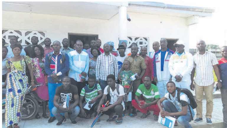
Les membres du bureau de la section Brazzaville de Close-combat