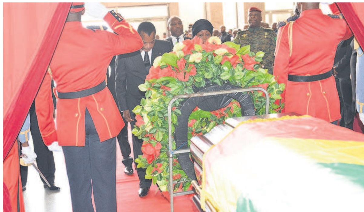
Le couple présidentiel s'inclinant devant la dépouille mortelle