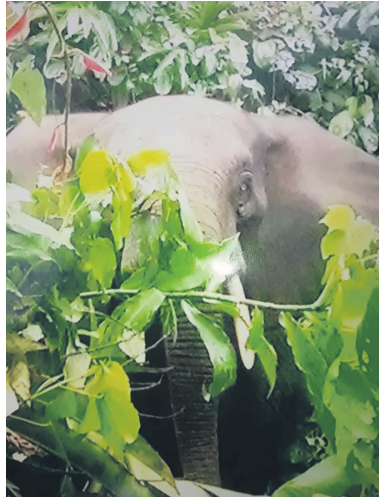
Les deux éléphants en promenade de l'autre côté de la rivière Ngabadzoko (DR)

Du point de vue de l'environnement, la réapparition de ces mammifères pourra contribuer à la régénération de l'écosystème, surtout pour cette forêt qui a subi d'énormes dégradations du fait de l'homme. « L'éléphant