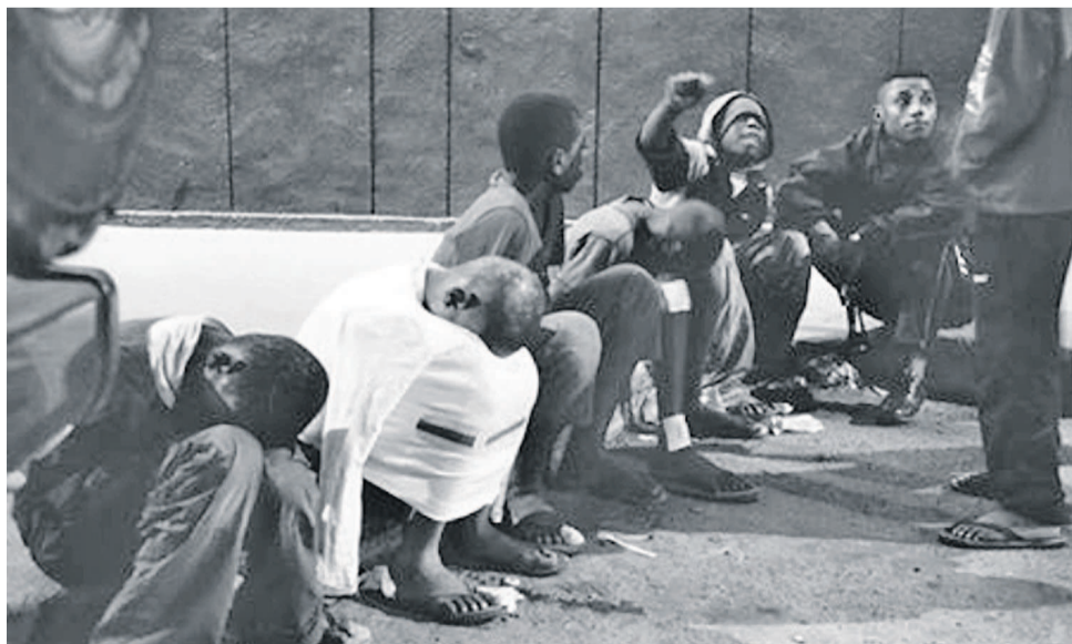
Une photographie des enfants en rupture