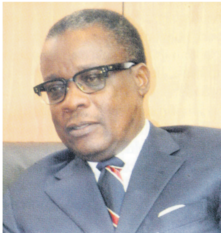
Alain Akouala Atipault

entre mars et avril une vision de ce que les partenaires chinois veulent investir au Congo. On pense que la saison sèche prochaine, on pourra lancer les travaux de construction de la zone économique spéciale de Pointe-Noire », a précisé le ministre de tutelle, Alain Akouala Atipault, dans un entretien exclusif avec Les Dépêches de Brazzaville. Page 3