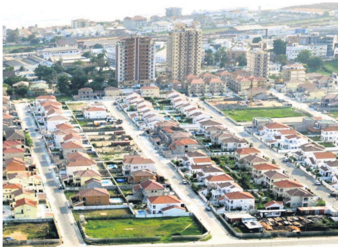
Maquette de la future Zone économique de Pointe-Noire (DR)

Ce nouveau texte a été révisé en tenant compte de l'appartenance du Congo à l'Organisation mondiale du commerce (OMC) et à l'Organisation mondiale des douanes (OMD), ainsi qu'à des observations des investisseurs et