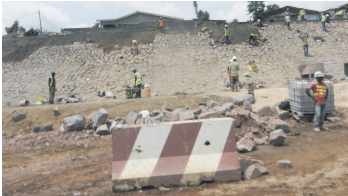
Les techniciens oeuvrant sur le chantier de la corniche

Hormis les expropriations, le ministre Jean Jacques Bouya qui était en compagnie de son collègue chargé de l'Équipement et de l'entretien routier Josué Rodrigue Ngounimba, a également évoqué les intempéries comme facteurs de ralentissement des travaux