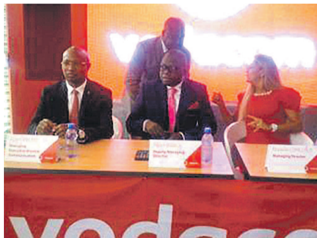
L'équipe dirigeante de vodacom-Congo

Leader dans le monde cellulaire, Vodacom-Congo a au-