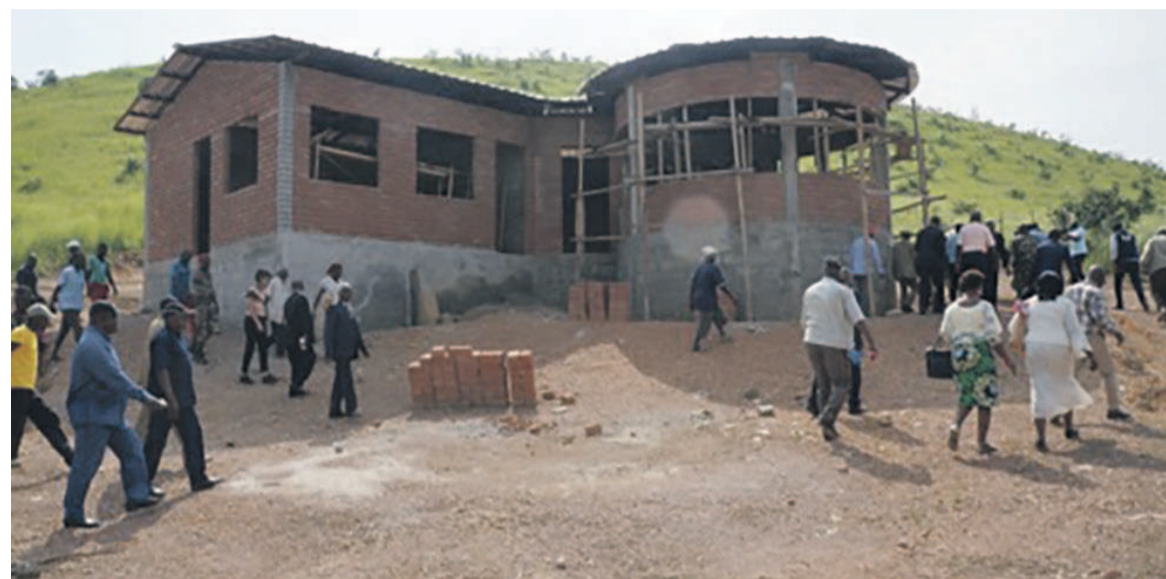
Le gîte de Sossi en construction (Adiac)

La réalisation du gîte de Sossi est un projet pilote car, il est le premier d'un vaste programme