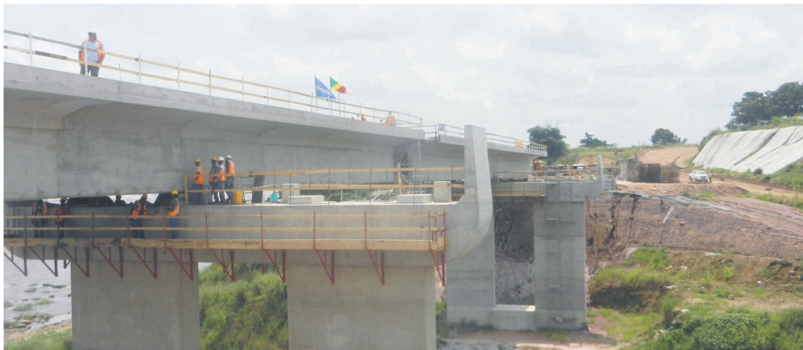
Un ouvrage d'art sur le chantier de la corniche sud de Brazzaville

Les expropriations prévues dans le cadre du projet de construction de la Corniche Sud de Brazzaville ont été ramenées à 5,6 milliards de francs CFA au lieu de 11 milliards comme estimées au départ. Le ministre de l'Aménagement du territoire et des grands travaux, Jean Jacques Bouya l'a indiqué hier lors d'une visite du chantier. « Un travail a été fait avec des ingénieurs, des experts pour essayer de réorganiser le tracé, le réduire. On a fait des économies qui nous ramènent les expropriations à 5,6 milliards de francs CFA au lieu de 11 milliards de francs CFA, grâce à la correction du tracé. L'Etat a dû payer plus de 3 milliards de francs CFA et il reste plus de 2 milliards de francs CFA », a-t-il expliqué. Page 3