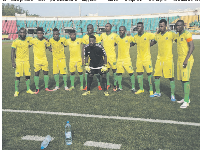
Etoile du Congo/Adiac

En 2015, cette formation a déjà gagné cette coupe de remporté le titre national puis la Confédération en 2011 plus a disputé sa première ligue une super coupe d'Afrique