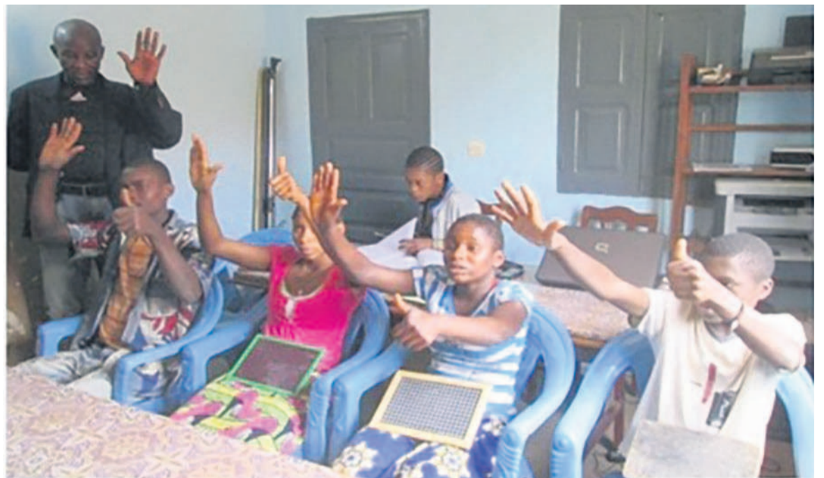
Séance de formation au Centre

À l'intention des donateurs, Sadema propose, entre autres, des activités socio-culturelles autour de la solidarité internationale. Au programme : exposition de peinture ; tables rondes littéraires ; défilé de mode et surtout, une collecte de fournitures scolaires et culturelles. Tout ce matériel sera acheminé au Centre d'accueil de formation professionnelle par apprentissage de métiers adaptés -CAFPAMA- créé en 2014 en faveur des enfants : sourds-muets, orphelins et ceux qui sont déscolarisés. Depuis deux ans, « nous