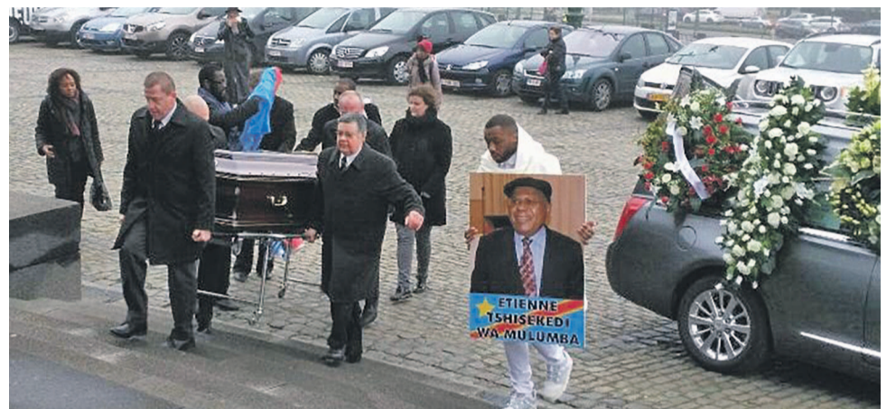
La dépouille d'Étienne Tshisekedi en Belgique