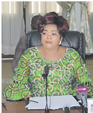
Ines Bertille Nefer Ingani

Dans son mot de circonstance, la ministre de tutelle, Ines Bertille Nefer Ingani a tout d'abord rappelé l'importance et la signification de la journée du 8 mars, avant d'inviter tout le monde à mettre la main dans la pâte pour faire en sorte que cette fête soit une réussite. Elle n'a pas manqué de souligner la nécessité de faire adopter des textes d'application de la loi sur la parité. « Nous sommes donc appelés à nous retrouver, nous, femmes du Congo, pour voir ensemble, comment mener les différentes activités de réflexion sur l'avenir de nos filles et femmes de demain en tenant compte des défis actuels, à savoir notre ferme détermination à faire adopter la loi sur la parité et à nous positionner aux prochaines échéances électorales », a-t-elle déclaré. Elle estime que la parité, dès qu'elle est acquise, contri-