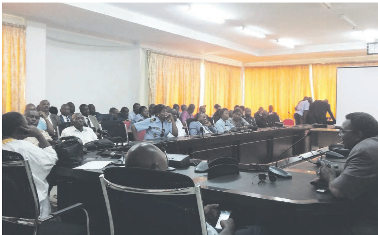
Une vue de la salle lors de l'assemblée générale extraordinaire

Les travailleurs des douanes réunis en assemblée générale extraordinaire le 20 février, ont invité le ministre des Finances et du budget à surseoir les notes de services portant nomination des cadres de la direction des douanes, en attendant le dénouement définitif de la situation.