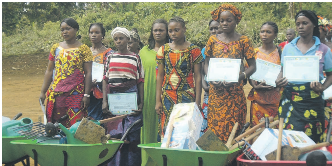
Des jeunes filles mères après réception des kits

duction maraîchère, en leur apportant de nouvelles connaissances sur la pratique du maraîchage biologique, sans utilisation d'engrais et de pesticides chimiques.