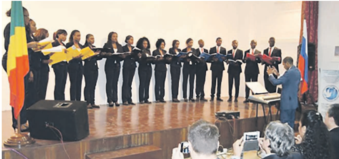
Les choristes de Chœur Sanctus Dieu est amour

Avec pour objectifs d'évangéliser, de sensibiliser, de secourir les