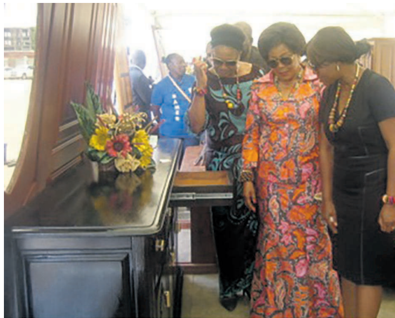
Des membres du gouvernement appréciant les meubles (DR)

De manière générale, cette première édition est considérée, par les participants, comme une « grande » école qui, d'après eux, leur permettra de corriger les imperfections constatées. Pour justifier les prix des objets que