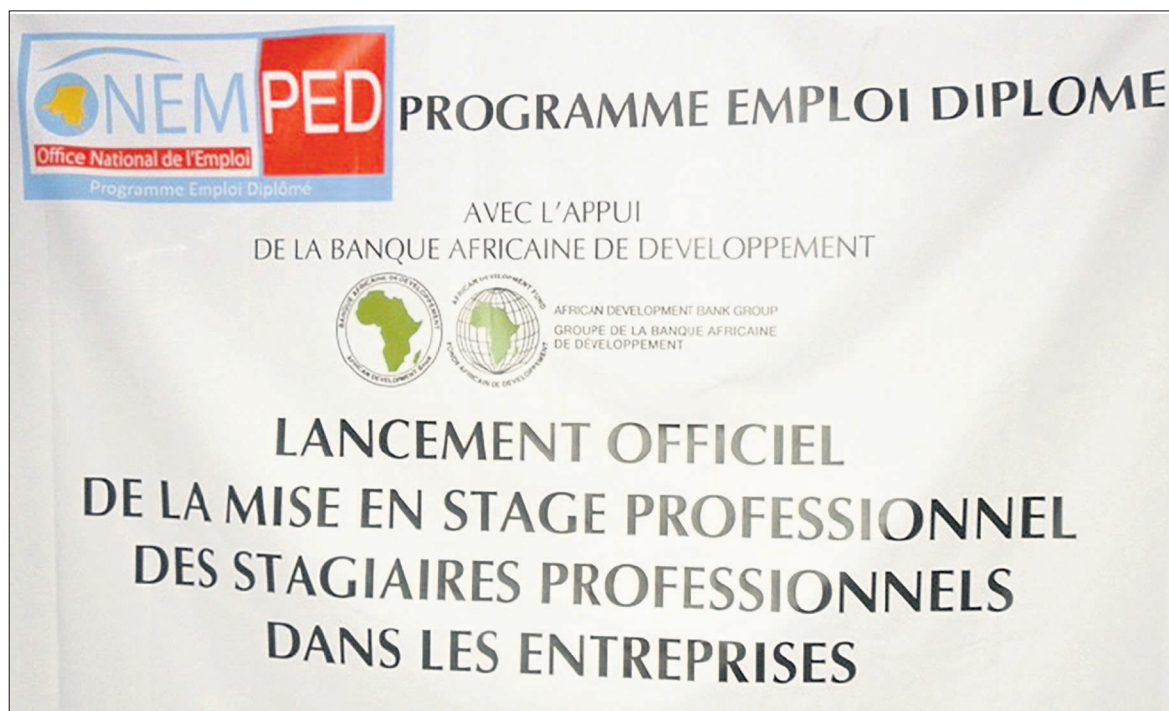
Affiche du PED

qui avait, en effet, précisé que cette cérémonie avait concerné le placement dans une entreprise du secteur agro-alimentaire, a également exprimé le plaidoyer de la coordination de ce programme auprès du gouvernement, d'étendre le PED sur toute l'étendue du pays, étant donné que ce programme ne couvre actuellement que 3 provinces, sur les 26 que compte le pays. Le plaidoyer de la coordination auprès du gouvernement en vue d'étendre le PED à travers la RDC, a-t-elle dit, résorberait la carence alimentaire, ce qui nous réjouit pour un futur partenariat, étant donné que le New DAIPN a