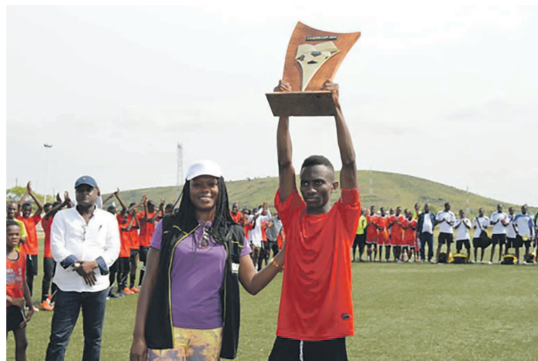
Le capitaine d'Aigles sport soulevant le trophée Adiac