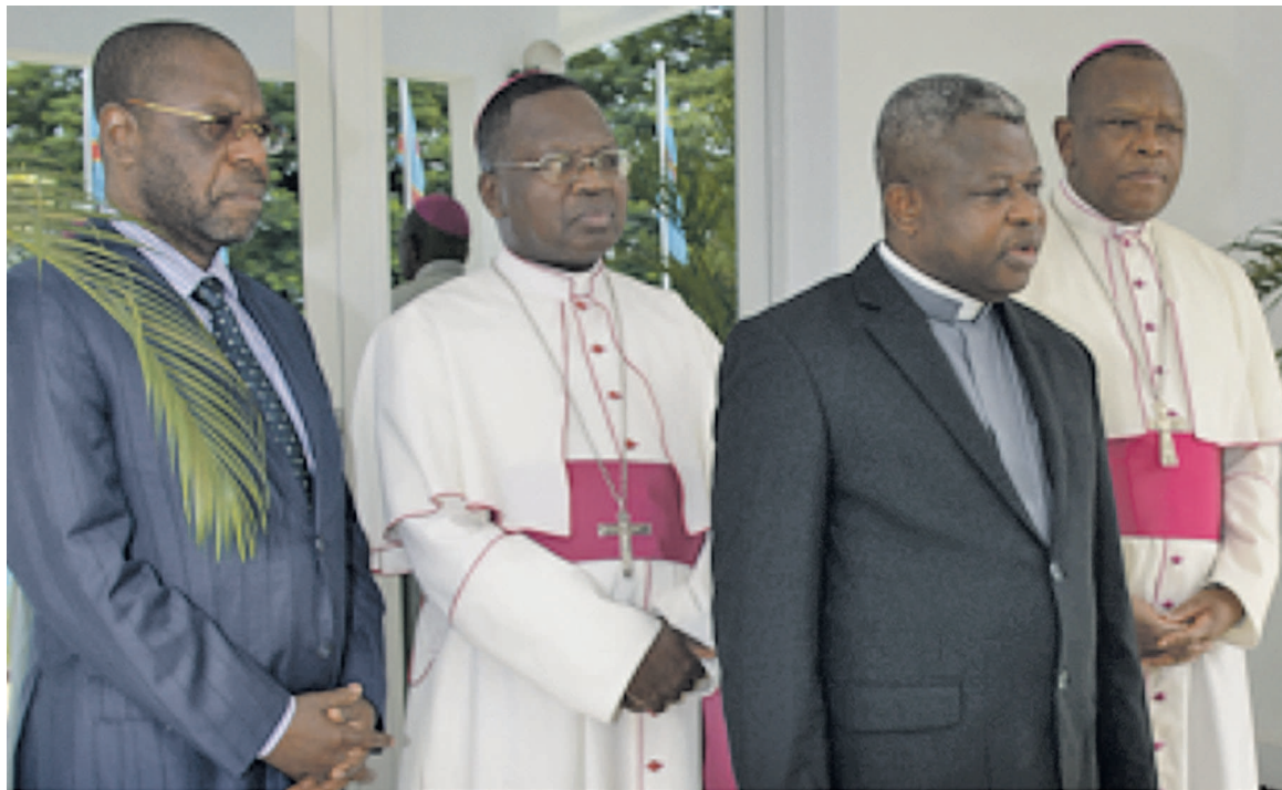
La délégation de la Céncó au sortir de l'audience

C'est sur ces entrefaites que les évêques catholiques membres de la Conférence épiscopale nationale du Congo (Céncó) ont été reçus en audience le 20 février par le chef de l'État, Joseph Kabila, avec qui ils ont pu évoquer la situation politique de l'heure avec, en toile de fond, le blocage qui caractérise l'application de l'accord du 31 décembre. En sus de cette entrevue, les évêques