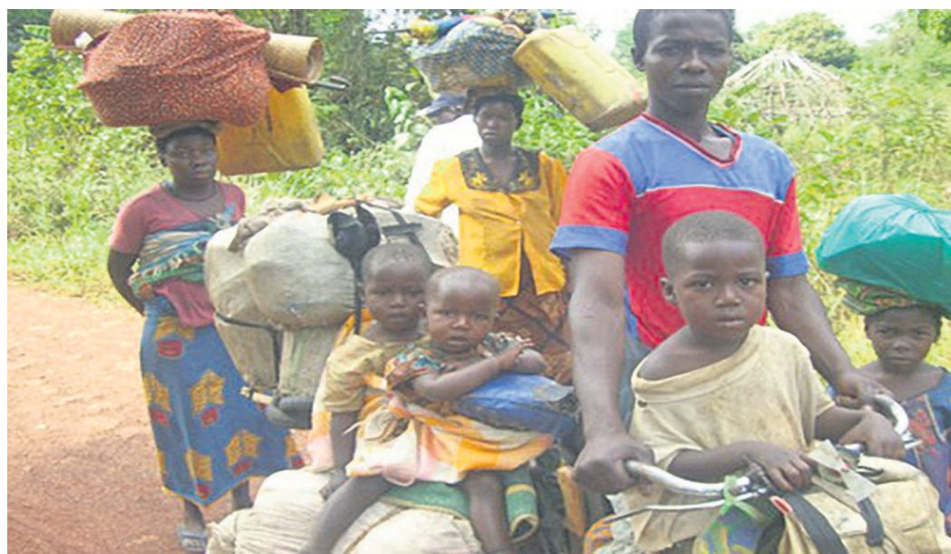
Les réfugiés ont droit d'être sécurisés

Selon un communiqué du HCR, c'est depuis le 20 février que le rapatriement volontaire de réfugiés rwandais vivant en République démocratique du Congo (RDC) a repris. Avec le premier convoi de l'année, cent réfugiés rwandais sont rentrés chez eux par la grande barrière de Goma, dans la province du Nord-Kivu.