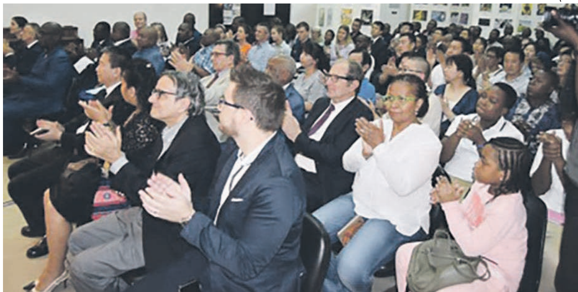
Les invités au concert-requiem

hommes par le chant afin qu'ils retrouvent et trouvent leur vrai sens de vie et les guérir de différents maux ; en quatre ans et demi d'existence, Chœur Sanctus a déjà un riche palmarès. Il s'est produit à diverses manifes-