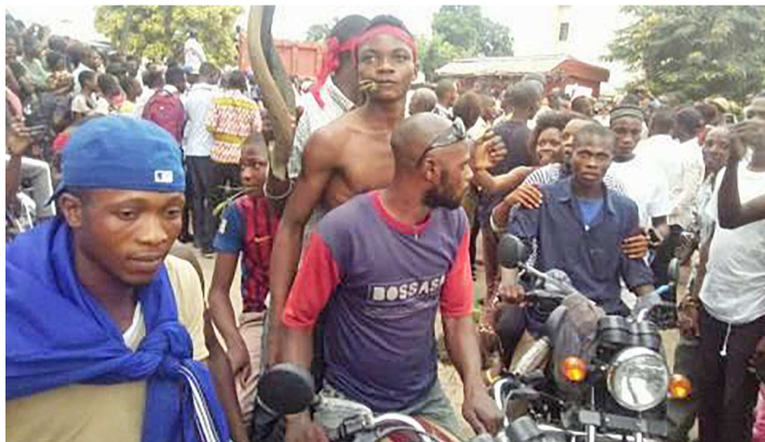
Des miliciens Kamuina Nsapu

Les faits remontent à vendredi 24 mars dernier. Une quarantaine des policiers sont tombés dans une embuscade tendue à leur convoi par les miliciens Kamuina Nsapu, alors qu'ils se rendaient à Kananaga en provenance de Tshikapa. L'incident se serait produit à Kamuesha, à environ 75 km au nord-est de Tshikapa, une ville du