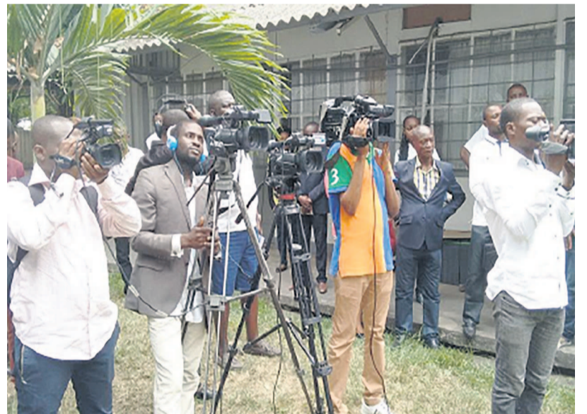
La presse, lors d'une activité à Kinshasa.