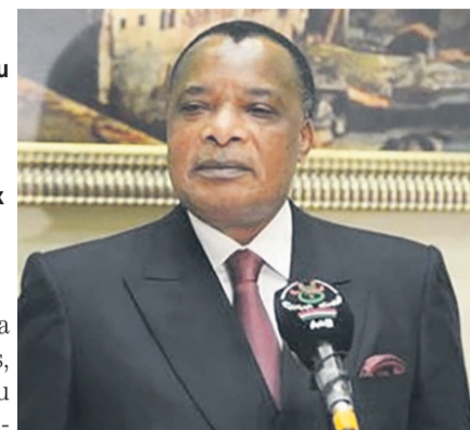
Denis Sassou N'Guesso à sa sortie d'audience avec Abdelaziz Bouteflika

Signés en marge du séjour de travail du président Denis Sassou N'Guesso, du 27 au 30 mars à Alger, ces accords sont le résultat de la 7 e réunion de la commission mixte entre les deux pays tenue les 25 et 26 mars dans la capitale algérienne.