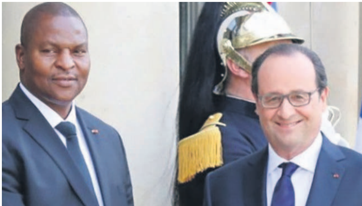
Les présidents François Hollande et Faustin-Archange Touadéra

Le président français François Hollande s'est réjoui des avancées du processus de consolidation de l'armée centrafricaine, avec l'apport de la mission européenne de formation EUTM, à l'issue d'un entretien. Il l'a fait savoir à son homologue centrafricain, Faustin-Archange Touadéra, qu'il a reçu à l'Élysée. Il s'est également félicité de la posture adoptée par la Mission multidimensionnelle intégrée de stabilisation des Nations en Centrafrique (Minusma) à Bam-