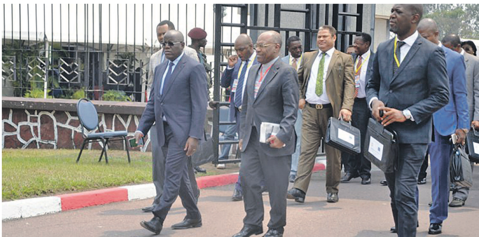
Les délégués des composantes à la cité de l'UA