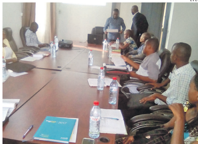
Une vue de la salle pendant la formation

Débutée le 26 mars, cette formation intitulée « Primo entrepreneur » destinée aux Très petites entreprises (TPE) et aux Petites entreprises (PE) prendra fin le 31 mars. L'activité se déroule à la chambre consulaire de la ville initiatrice de ladite formation.